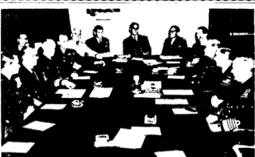
Amerikan ve İngiliz devletleri toplantısında

Meclise yapılan müracaatlar 8000 doyanın Dişkeç Komisyonunda, Grupluların dünkü C.H.P. Gruplularında bildirildi.