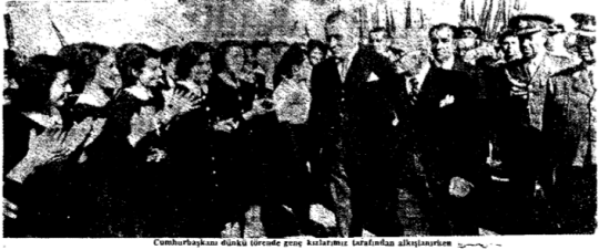
Celâl Bayar'ın Ankara'da gençlere hitap ettiği törenin anı fotoğrafı.

Halk ve gençler Bayar'a büyük tezahürat yaptı Bayar, "Gençler unutmayınız: Vatandaşın saadetinin temini sırası bir gün sizlere gelecektir. Bu tarihi vazifeye hazır ve lâyık olmaya çalışınız," dedi.