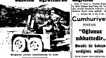
Birliğimizin önemli bir birliği baskına uğratıldı

Başkent Seul'u ele geçirmek üzere hazırlık yapan ceterlerin bir kısmı baskına uğratılarak dağıldı