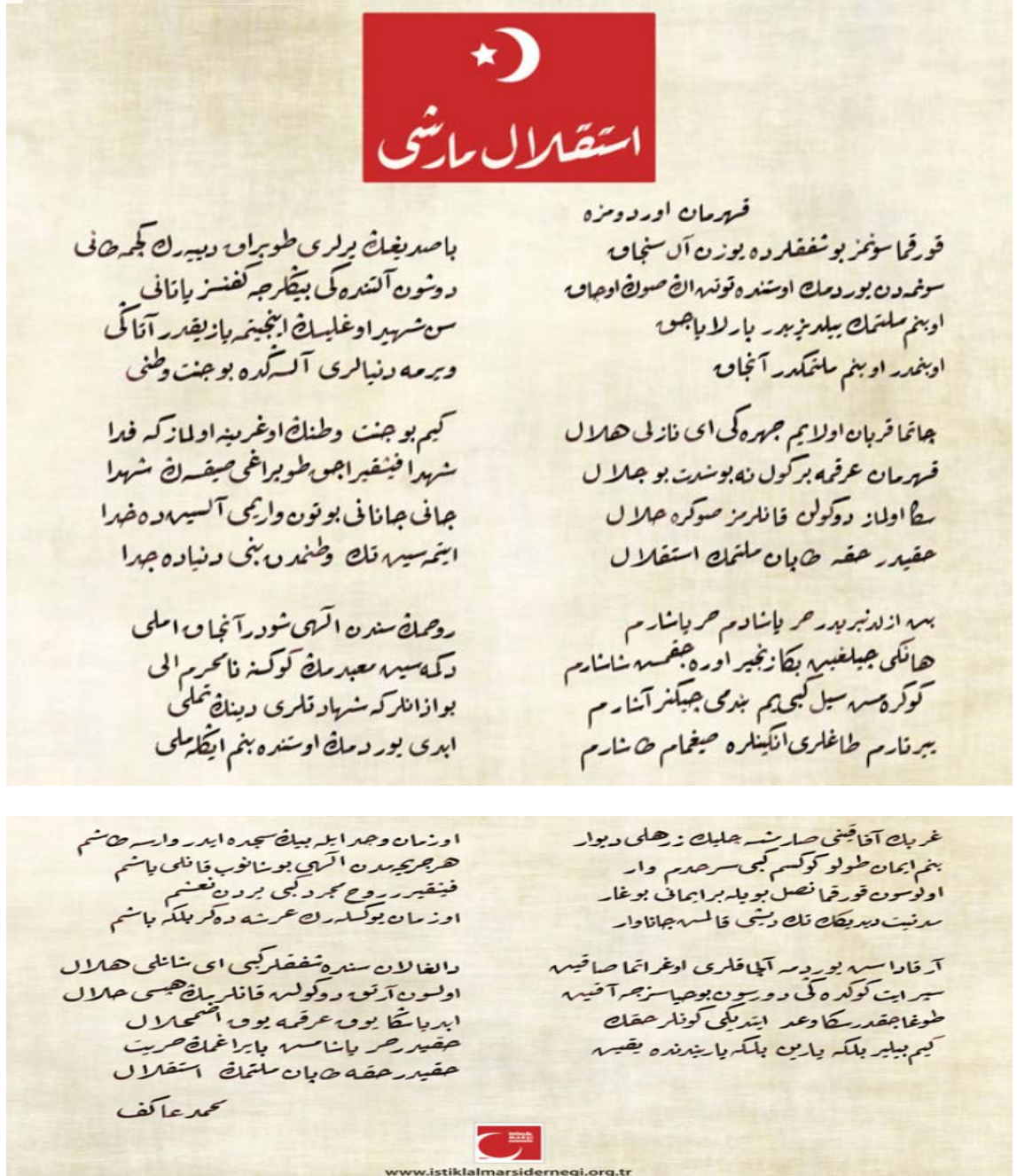
Şekil 1: (İstiklal Marşı Derneği, 2020)

Dernek, kendi internet sitesinde İstiklâl Marşı için ayrı bir alan açmış ve marşı Osmanlı Türkçesi ile siteye yerleştirmiştir.