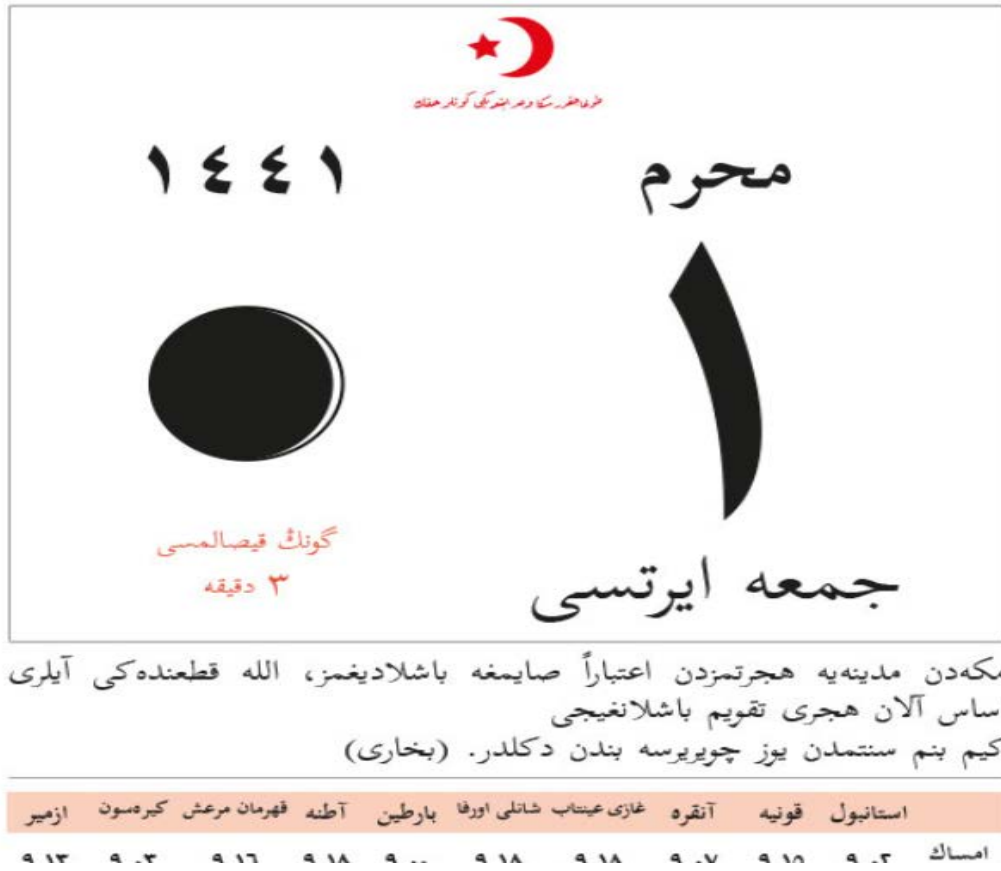
Şekil 3: İstiklâl Marşı Derneği'nin çıkardığı İstiklâl Takviminden bir örnek (İstiklâl Marşı Derneği, 2019).