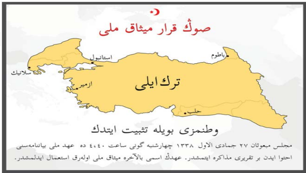
Şekil 2: Misak-ı Milli Sınırları (İstiklâl Marşı Derneği 2019).

2007, s.3). İstiklâl Marşı Derneği de Türklüğün ana vatanı olarak Misak-ı Milli sınırlarını esas kabul etmektedir. Bu bağlamda “Türkelî'nin Nüfus Kaydı bir ‘nüfus cüzdanı’ gibi neşrolundu” denilerek harita üzerinde ilan edilmiştir. Bu faaliyet, İstiklâl Marşı'nın yazışının hicri takvime göre yüzüncü yılında gerçekleştirilmiştir. Burada toprakların az olmasının sebebi Misak-ı Milli'den sekiz ay sonra Sevr Antlaşmasının yürürlüğe girmesidir. (İstiklâl Marşı Derneği, 2019).