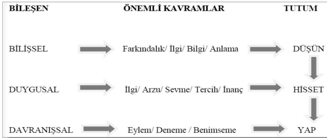
Şekil 3.1 Tutum Bileşenleri ve Tutum Geliştirme Süreci

Tutum bileşenleri ve tutum geliştirme süreci şöyle özetlenebilir: