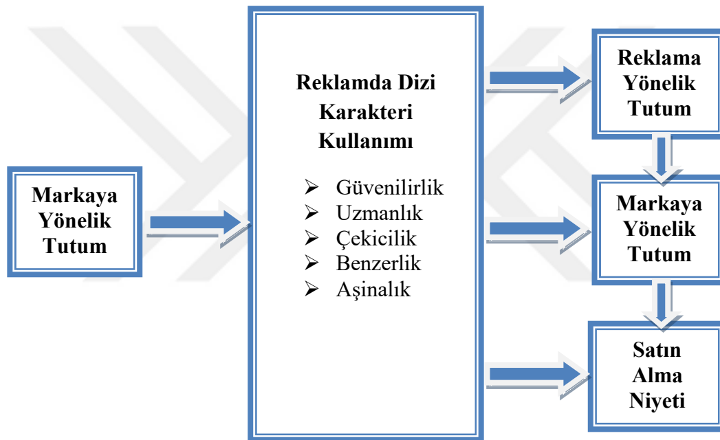
Şekil 4.1 Araştırma Modeli (Model, Methaq, 2011'den geliştirilmiştir.)

Reklamlarda dizi karakteri kullanılmasının, reklama ve markaya yönelik tutumu ve satın alma niyetini etkileyeceği varsayımına dayanan araştırma bir modelle açıklanmaya çalışılacaktır: