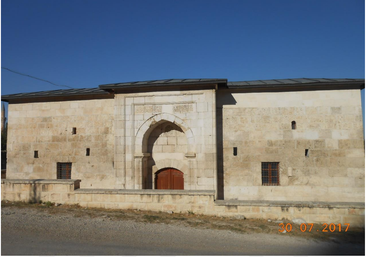
Resim 1,2,3 Hamidođlu Emir Sinaneddin Medresesi