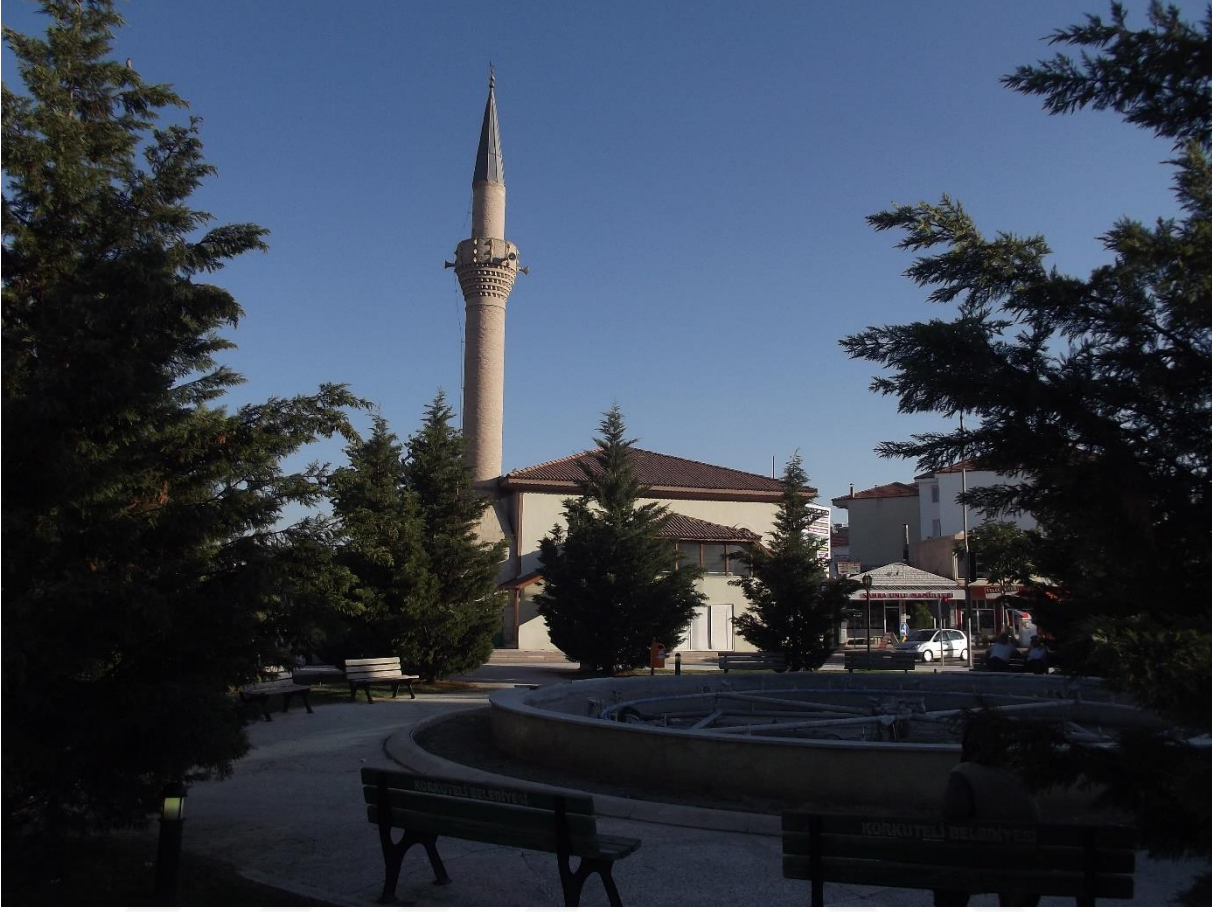
Resim 11 Oyunyeri Osman Çelebi Camii