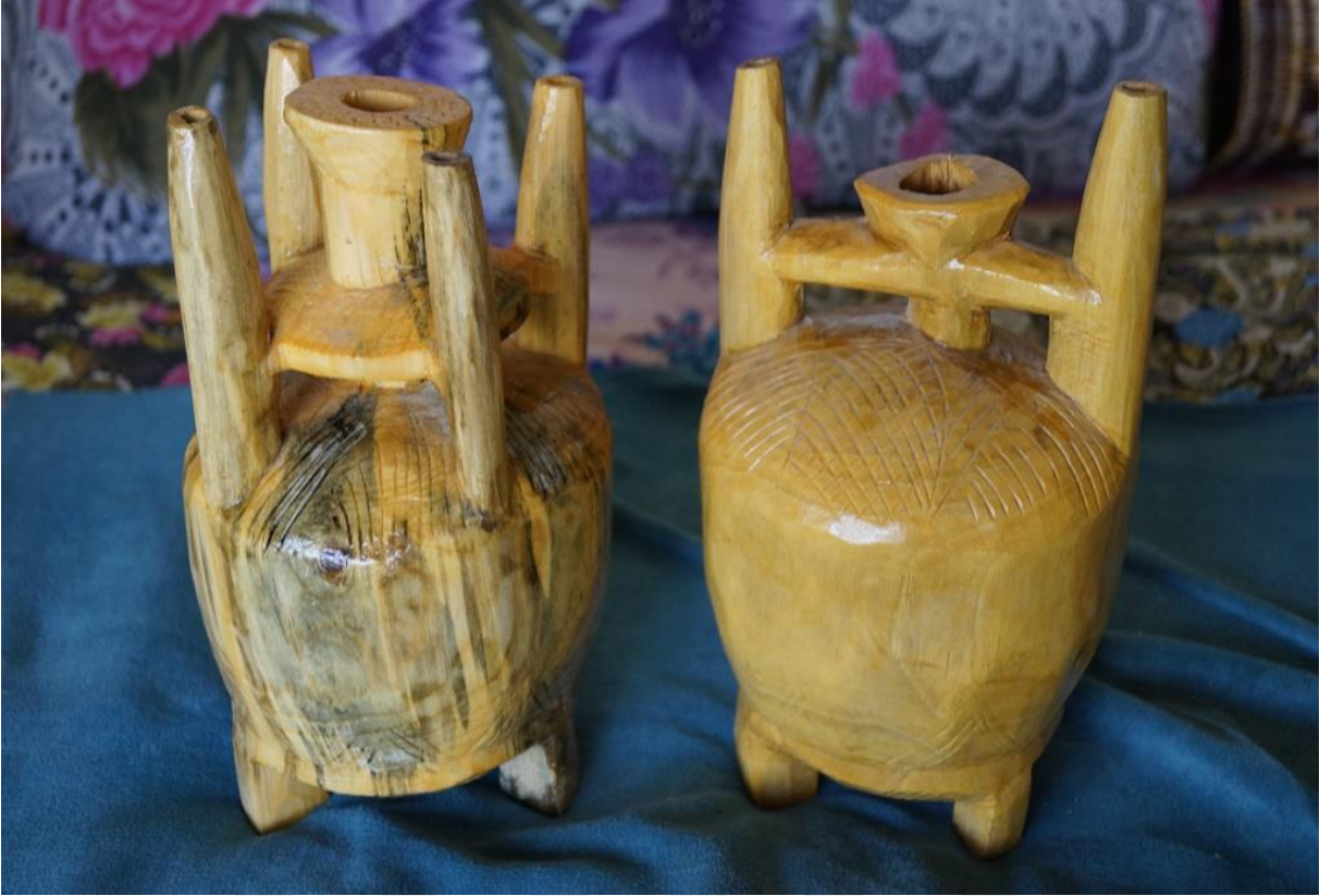
Resim 16 Fıđla Bardađı