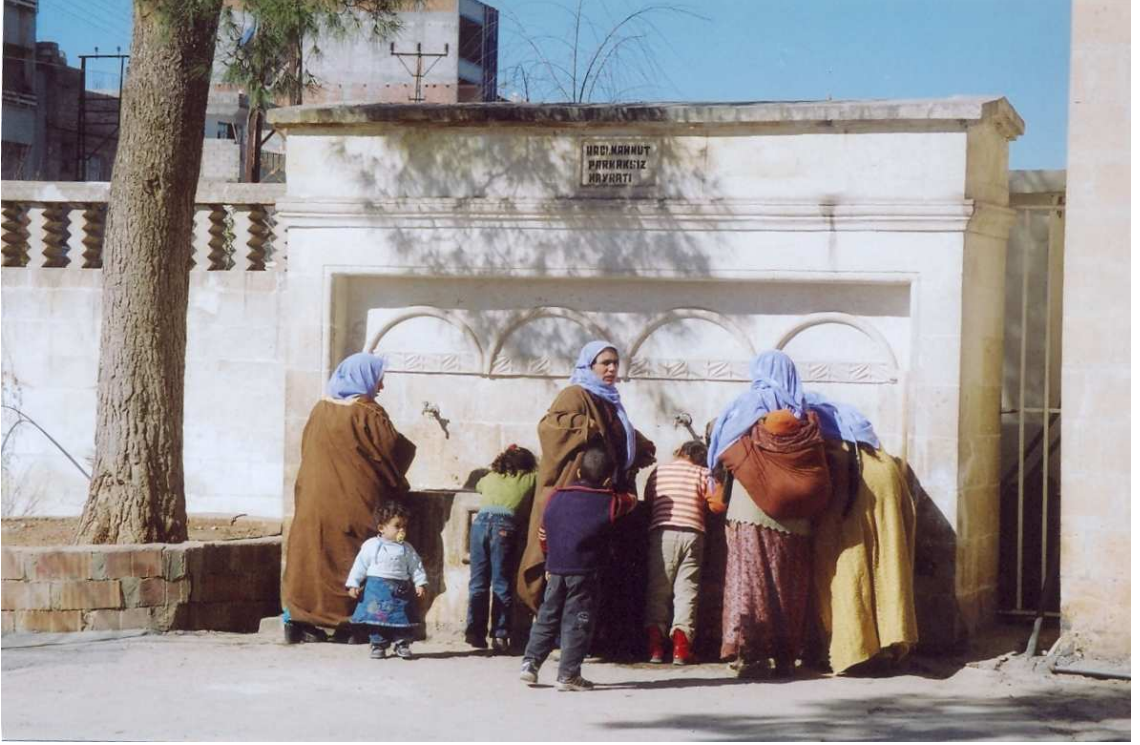
Fotoğraf No:7 Hz. Eyyûb'un "Kuyu"sundan aktarılan şifalı sudan içenlerden bir görünüm