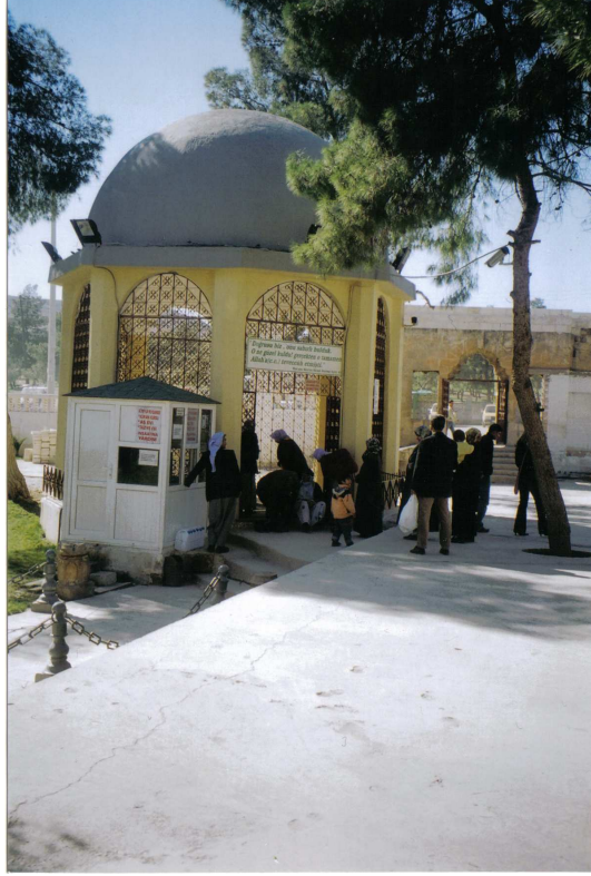
Fotoğraf No:1 Hz. Eyyûb'ün makamı olarak bilinen çile çektiği mağarayı ziyaret edenlerden bir görünüm

Şanlıurfa'nın Eyyübiye semtinde Hz. Eyyûb Peygamber'e ait kutsal mekânlar 427