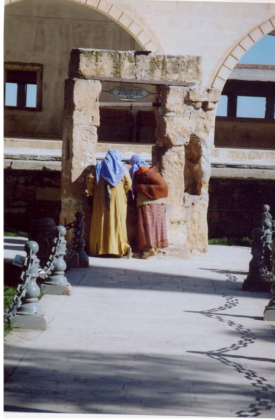
Fotoğraf No:5 Hz. Eyyûb'ün "Kuyu"sunu ziyaret edenlerden bir görünüm