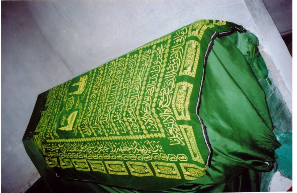
Fotoğraf No:2 Hz. Eyyûb'ün oğlu Havmel'in türbe içerisindeki kabri