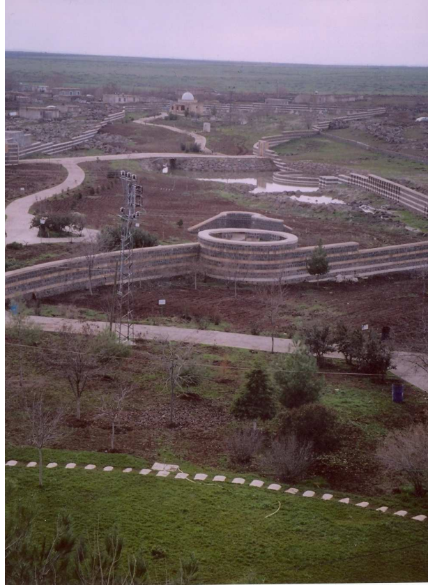
Fotoğraf No:4 Eyyüp Nebi Beldesi'nde Şanlıurfa Valiliği tarafından restore edilerek düzenlenen ziyaret yerinden bir görünüm