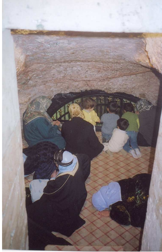
Fotoğraf No:3 Mağaranın içinde namaz kılan ve dua eden ziyaretçiler