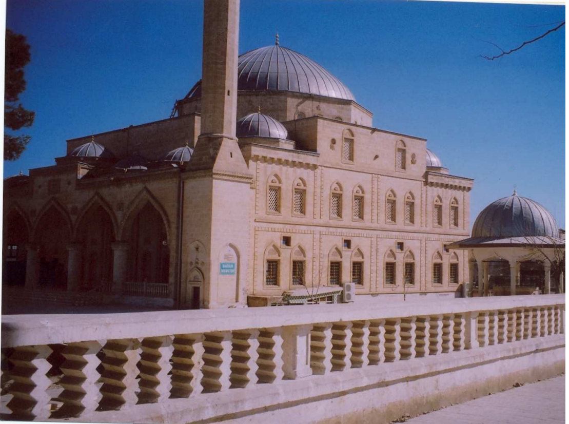
Fotoğraf No:8 Hz. Eyyûb'un adını taşıyan "Eyyûb Peygamber Camii"nin kuzey-batısından görünümü