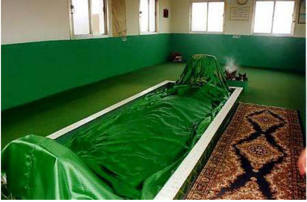
Fotoğraf No:3 Hz. Eyyûb'un türbe içindeki kabri ve yanmakta olan tütsü.