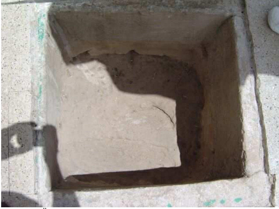
Fotoğraf No:5 Üzerinde Hz. Eyyûb ve eşeğine ait ayak izlerinin olduğu ileri sürülen kaya