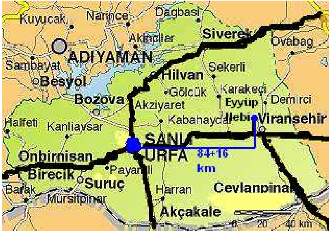
Şanlıurfa il haritası ve harita üzerinde Eyyüp Nebi Beldesi.