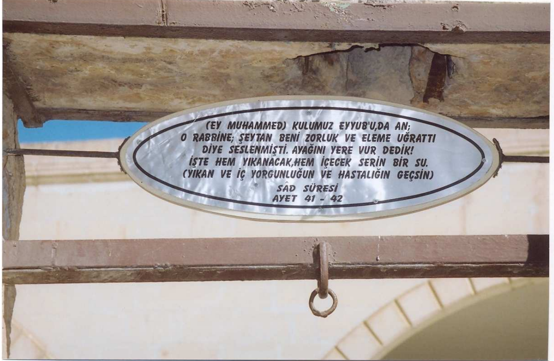
Fotoğraf No:6 Kur'an-ı Kerim'de Hz. Eyyûb'e şifa verilmesini anlatan ayetin meâli.