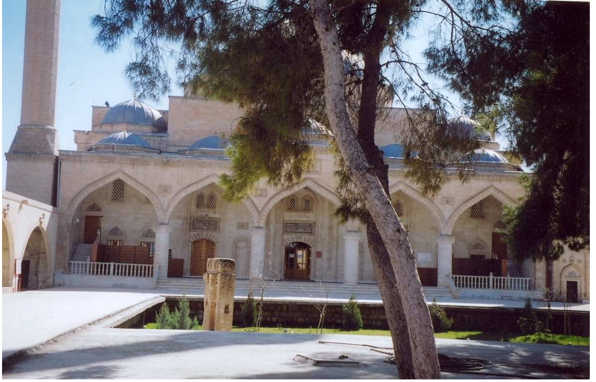
Fotoğraf No:9 Hz. Eyyûb'un adını taşıyan "Eyyûb Peygamber Camii"nin kuzeyi ve "Kuyu"