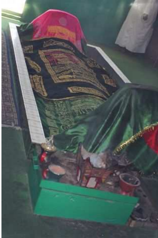
Fotoğraf No:4 Hz. Eyyûb'un başucunda tütsü yakılmakta kullanılan araçlar.