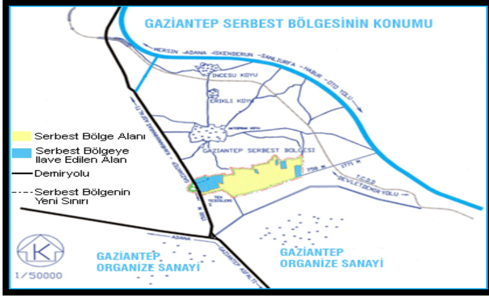
Şekil 3.1: Gaziantep Serbest Bölgesinin Konumu