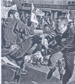
Memurların uyan eyleminde zaman zaman arbede yaşandı. Bir bankanın duvarına yazı yazmak isteyen göstericilerle güvenlik görevlisi arasında kavga çıktı. Güvenlik görevlisi, kalabalık göstericilerin elinden güçlüğü kurtuldu.