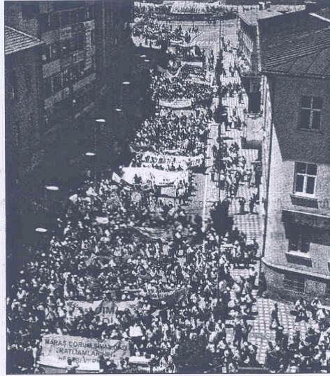
Sivas'ta tahrik ve provokasyon peşinde koşanlar amacına ulaşamadı

Sivas'ta miting düzenleyen eylemciler, merhum Muhsin Yazıcıoğlu'nun posterinin açılmasına bile tahammül edemeyerek pet şişe fırlattılar.