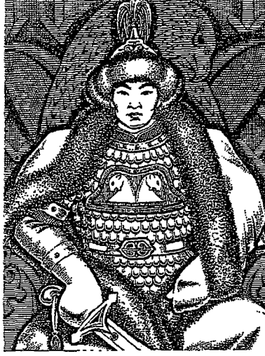
Kırız Kağanı Barsbek (s. 79)