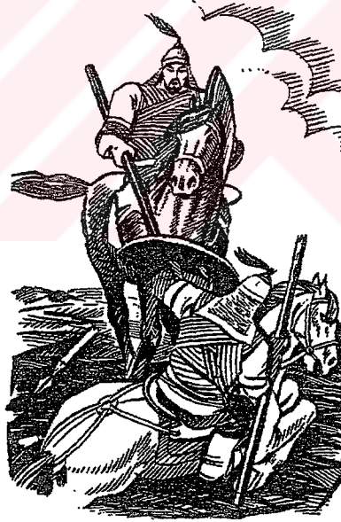
Taylak Batır ve Arap Batır Er meydanında (s. 128)

10. SINIF KIRGIZİSTAN TARİHİ DERS KİTABINDA YER ALAN RESİM ÖRNEKLERİ