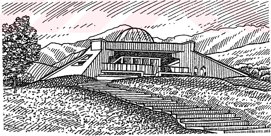
1930'lardaki Sürgün Şehitlerinin Anısına Yapılan "Ata-Beyit" Anıtı. (s. 60)