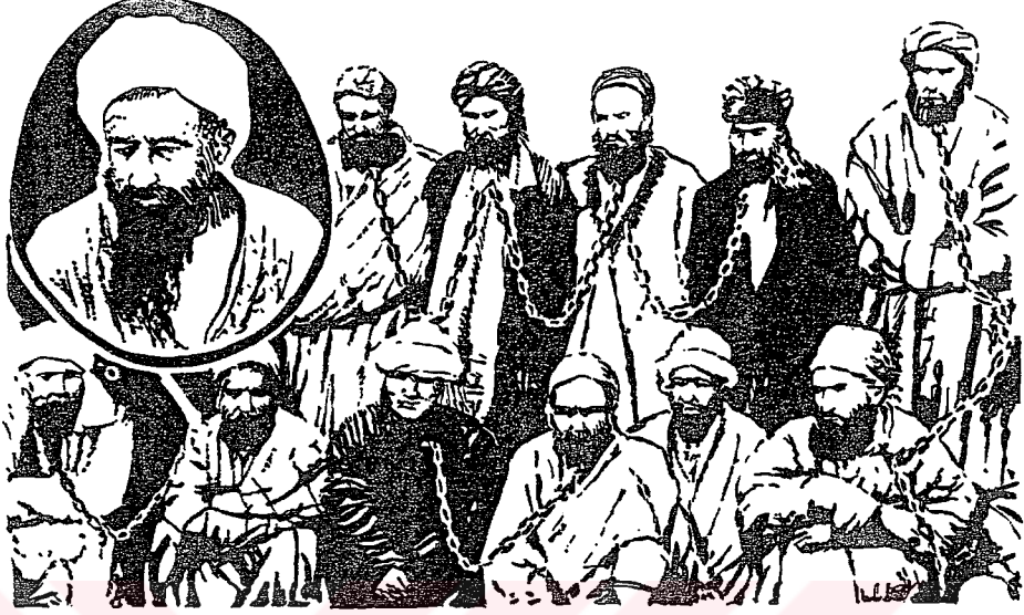
1898 Ayaklanması Esirleri (büyüteç içine alınmış olanı liderleridir). (s. 33)