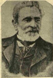
انباتیا باش وکلی متوق ووسو ساغاسقا Feu Mr. Sağasta

زوانده ، حشویانه تصادف ایدلز ایدی. ایلم خیانتک قسم اعظمی خدمت حکومتده کیرمیش ، مالیه نظارتنده اوقاق بر مأموریتین باشلاپه رق ذکای فوق العادسی سایه سنده مستشارلغه قدر ارتقا ایش ایدی. امور مالیه ده معلوماتی غایت واسع ویشون دقایق حسابیه به حقیه واقف ایدی. مالیه نظارتنده ابراز ایدلیکی انار روت و در ایدن استفاده اولحق ارزه ایدن زلاقی دفتر دارلغه تعیین ایدلیکی صبرده ولایتک امور مالیه سنده حالا ده تور العمل اولان برچوق آثار بر قش و برارالی ایدن والی وکالتده بولنه رق ضبط و ربعلی آیین خصوصنده کی موقوفیاتی آلان زبازد اولمقده بولمشدر .