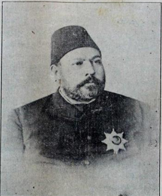
طرزون والیسی مرحوم قدری پک

مرحوم مشارالیه اورادن مالیه مستشارلقه ترفع مأموریت ایله ریک درسماده کش واقدار و رویتی بومأموریتدخی کوسترین ایدی. مالیه مستشارلقده ایکن ۳۰۸ تارخنده عواطف عالی شمول حضرت پادشاهین عهدسته طرزون والیگی توجیه واحسان بیوروش و اونور بخدمت بری طقوزسنه دروظایف مأموریتی سادقانه، مستقبانه اغا ایئت ایدی. مرحوم طرزون والیکننده هر کوی، هر دقیقه سی براتر اداره ایله امرار ایئت. کیجه بی کوندوزه قاهره و لایتنک و باخصوص طرزون کی مهم برولایتنک محتاج اولدی ایله مادیه و معنویه. سنک استحصاله بدل جهادیله ریک فی الحقیقه طقوزسنه نظرده لایتنک هر طرفده تقریر امن و اسایشه، اشقیابک، دکز و قره قیجا. قیجیلرینک لوٹ وجودارندن ولایتی نظهریم بدل مجهود ایئتدر.