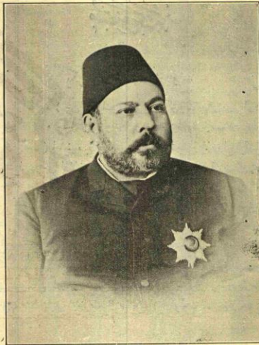
طبریز والی مرحوم قدری بك Feu Ca bri Bey, gouo-raar ginar d de Tbriz oñd