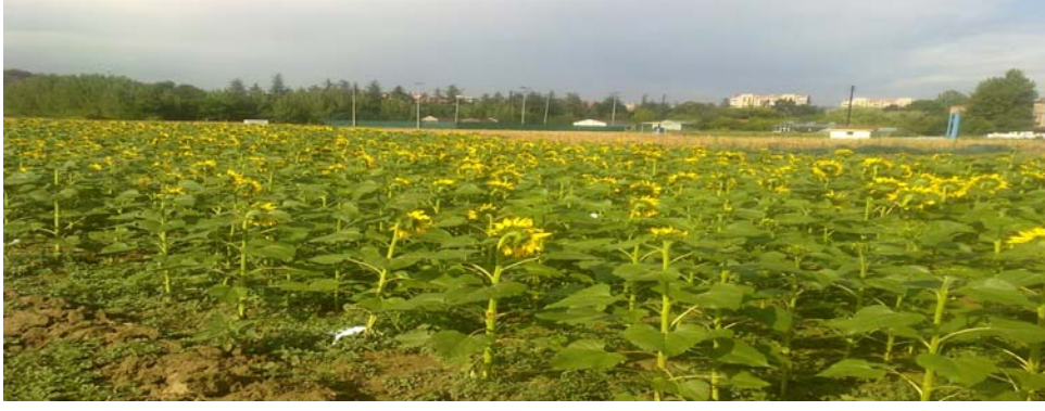
Şekil 1.1 Ayçiçeđi denemesinin genel görünüşü