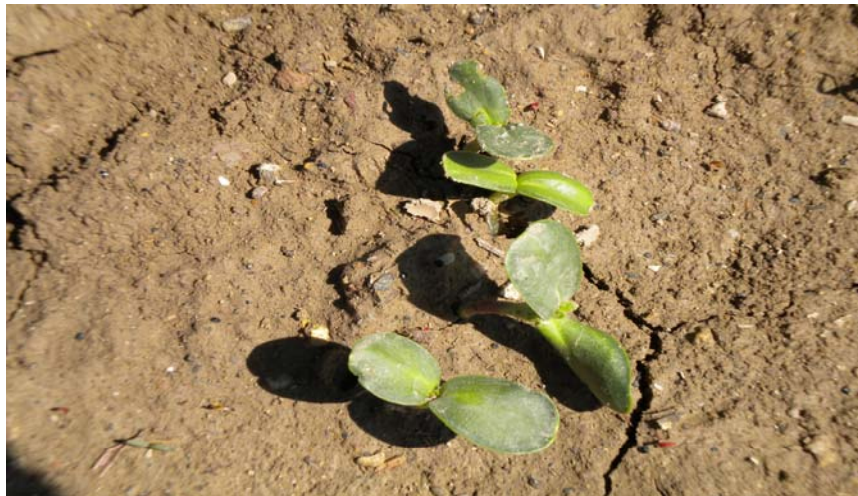
Şekil 4.2 Ayçiçeği bitkisinin çıkışı

Gübre uygulamaları ile birlikte çeşitler karşılaştırıldığında; en fazla bitki sayısı Sanbro MR çeşidinde Hümkik asit uygulaması yapılan parselde 138.04 adet olarak, en az bitki sayısı ise yine aynı çeşidin kontrol parselinde 114.55 adet olarak saptanmıştır.