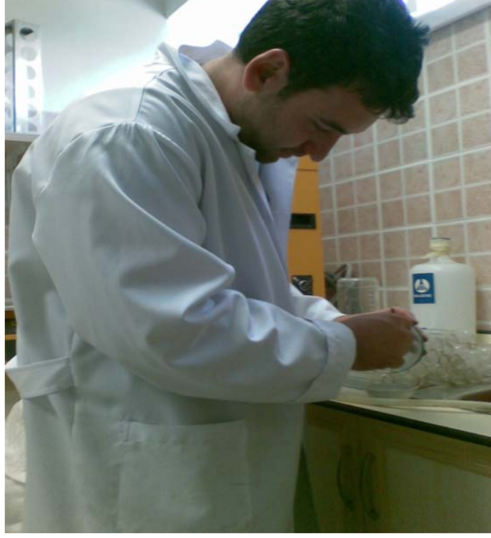
Şekil 4.5 Yağ analizlerinin yapılması

tohumların 60 g HA/100 kg tohum ile muamele edilmesinin ayçiçeğinde fide gelişimini olumlu yönde etkilediği sonucuna varmışlardır.