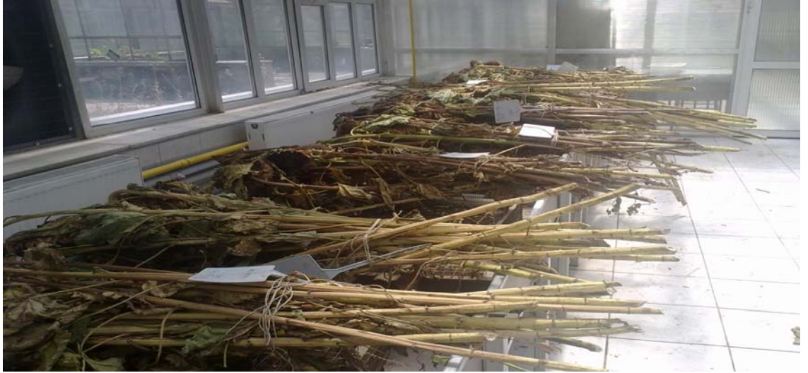
Şekil 3.4 Hasat edilmiş bitkilerin genel görünüşü

Fizyolojik olumu tamamlayarak hasat olgunluğuna gelen parsellerde gerekli gözlemler yapıldıktan sonra parsel verimi için kenar tesirleri atıldıktan sonra kalan bitkiler hasat edilmiştir (Şekil 3.4). Kuruyan bitkilerin tablalarından tohumlar alınarak tohum verimleri belirlenmiştir.