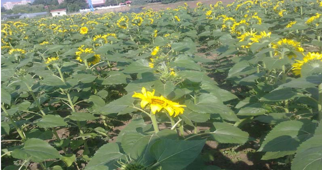
Şekil 4.3 Ayçiçeği bitkisinde yaprak sayısı

Dursun vd. (1997), sera koşullarında domates ve patlıcan fidelerinin yetiştiriciliğine hümik asidin etkisini belirlemek amacıyla yaptıkları çalışmada, yaprak sayısı, genişliği, kök ve gövde yas ve kuru ağırlıkları ile gövde uzunluğu için en iyi sonuçların 50 ve 100 ml/l hümik asit dozlarından elde edildiğini bildirmişlerdir.