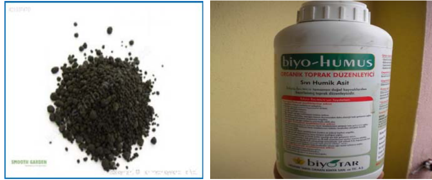
Şekil 3.1 Denemede kullanılan toz leonardit ve sıvı hümik asit.

Araştırmamızda bitki materyali olarak Oleko ve Sanbro MR ayçiçeği çeşitleri kullanılmıştır. Oleko ve Sanbro MR çeşitleri; melezleme ile elde edilmiş, fizyolojik olumları farklı, kendine döllenesi iyi, oval-orta irilikte tanelere ve yüksek yağ verimine sahip çeşitlerdir. Ayrıca Biyotar A.Ş tarafından üretimi gerçekleştirilen pelet şeklinde leonardit (biyoorganik SR) ve sıvı hümik asit (biyo-humus), kimyasal ticari gübre (üre ve 3.15) kullanılarak, tek çeşit leonardit (100 kg/da) ve tek çeşit hümik asit (1 lt/da) ayçiçeği çeşitlerine uygulanmıştır (Şekil 3.1). (Çizelge 3.1) (Karaca 2005)