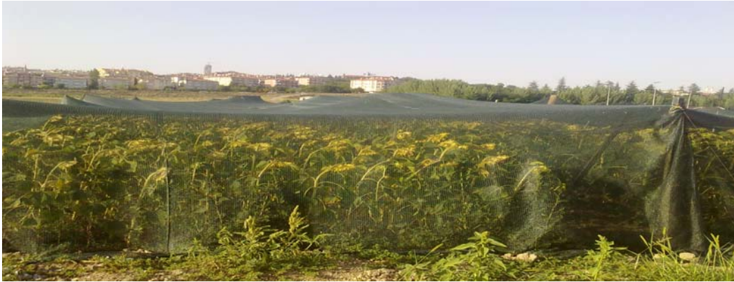
Şekil 3.3 Ayçiçeğinde tane dolmuş ve fizyolojik olgunluk döneminde kuş zararına karşın file (ağ) ile yapılan koruma

Denemenin yürütüldüğü dönemlerde en önemli sorunlardan birisi kuş zararidir. Kuşlar ilk çıkışların olduğu dönemlerde bitkinin kotiledon yapraklarını yiyerek zarar vermektedirler. Deneme alanının şehir merkezinde olması ve çevrede yeşil alanların az olmasından dolayı deneme yoğun kuş saldırısına maruz kalmıştır. Ayçiçeği yalnız ilk çıkışlarda değil, aynı zamanda tane dolmuş ve fizyolojik olgunluk döneminde de yoğun kuş zararına uğramaktadır. Bu zararların önlenmesi için özel olarak 2.5x2.5 cm boyutlarında gözenekleri olan file (ağ) yaptırılarak deneme alanındaki kuş zararının en aza indirilmesi sağlanmıştır (Şekil 3.3).