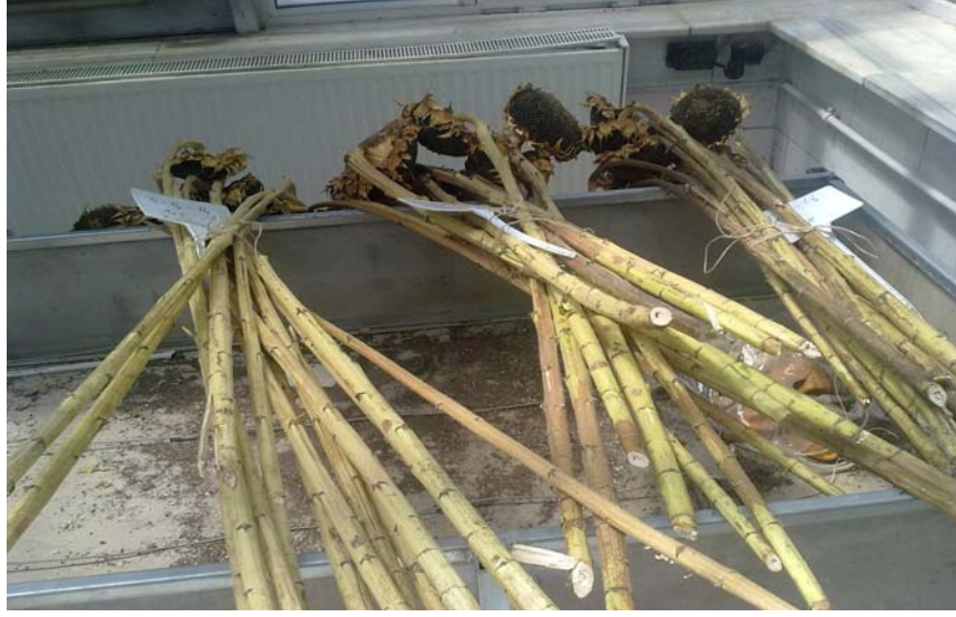
Şekil 4.1 Ayçiçeği bitkisinin boy ölçümleri