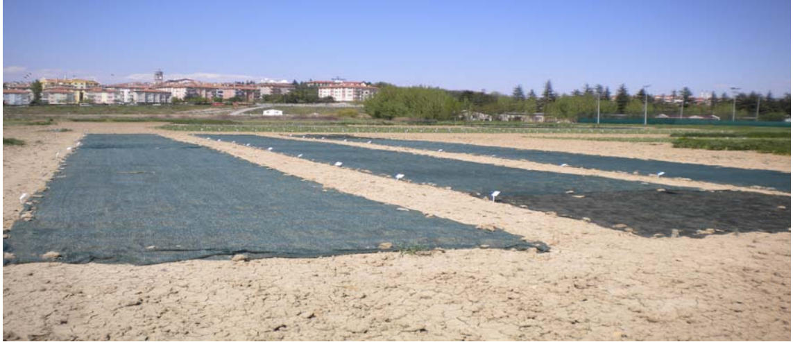
Şekil 3.2 Ekimden sonra çıkışa kadar deneme tarlasının ağ ile kapatılması

Tarla toprağı ekime hazır hale geldiğinde, deneme planına uygun olarak tekerrürler ve parseller belirlenmiştir. 9 Nisan 2010 tarihinde, sıra arası (70 cm) ve sıra üzeri (30 cm) mesafeler markörle çizilerek belirlenen noktalar, çapa ile ocak halinde açılmış ve açılan her ocağı 2-3 tane tohum atılarak üzeri toprakla örtülüp, tohumların toprağın içine tamamen girmesi için ayakla bastırılmıştır. Kuş zararının engellenmesi için tohum ekiminden sonra tarla yüzeyi ağ ile kapatılmıştır (Şekil 3.2). Daha sonra bitkiler toprak yüzeyine çıktıktan ve 10-15 cm'e geldikten sonra en güçlü ve iyi gelişen fideyi tarlada bırakıp, diğer bitkiler sökülerek seyreltme işlemi yapılmıştır.