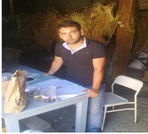
Şekil 4.4 Parsellerden hasat edilen tohumların tartılması