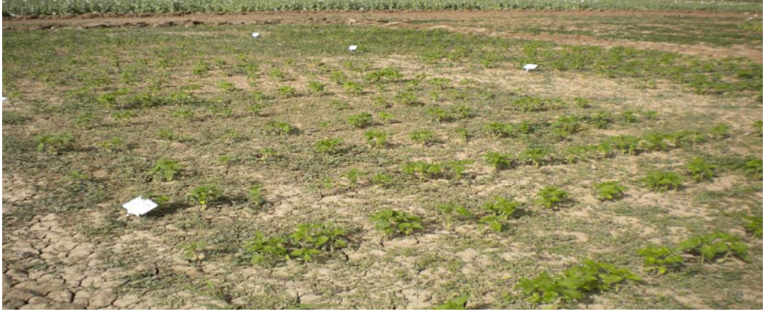
Şekil 3.5 Deneme yerinin genel görünüşü