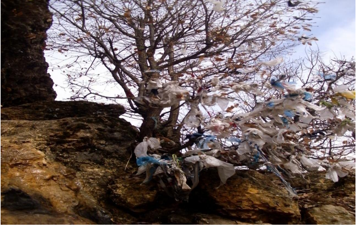
Resim 21- Hızır Gölü'ndeki ağaçlara bağlanan adak bezleri