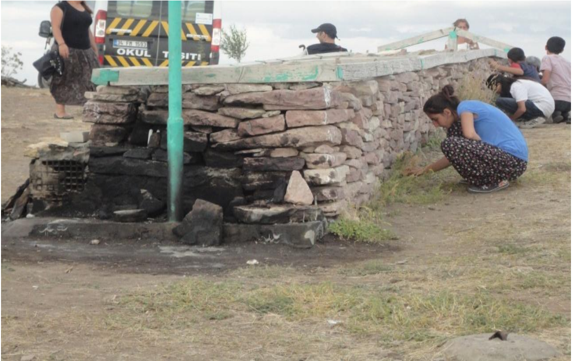
Resim 26- Sarı Saltık'ın mezarına dilekte bulunarak taş yapıştırma inancı