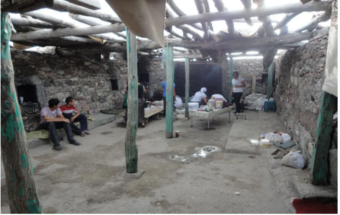
Resim 23-Kesilen kurbanların ve yemeklerin pişirildiği üstü açık türbe