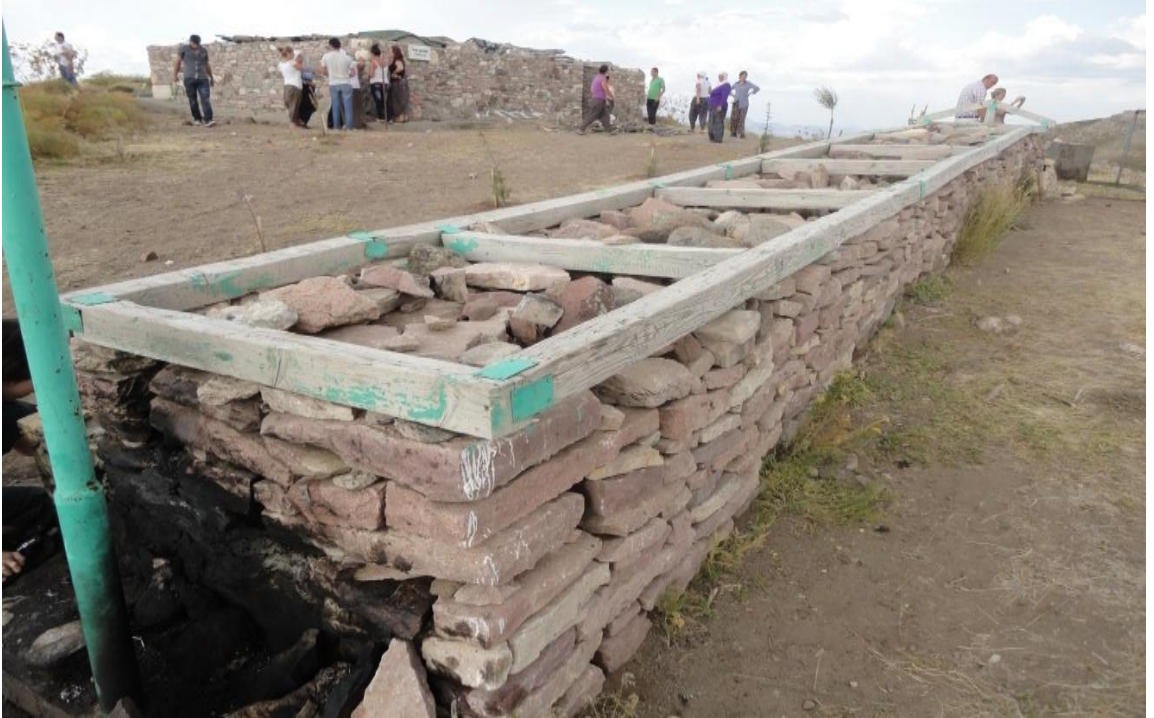
Resim 2- Sarı Saltık'ın mezarı