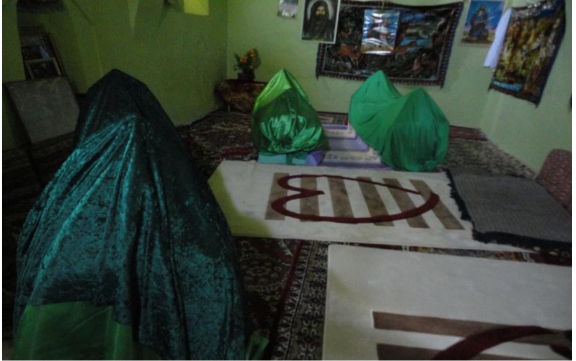
Resim 12- Ağıuçan (öndeki) ile karısı ve oğluna (arkada) ait olduğu iddia edilen mezarlar.