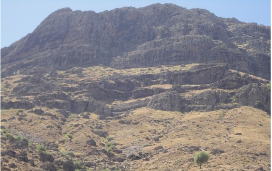
Resim 14- Dűzgűn Baba Dađı