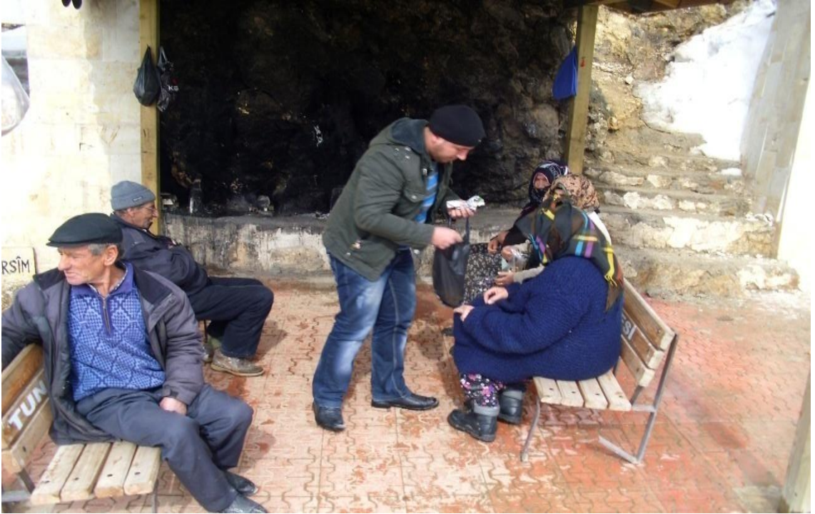
Resim 20-Hızır Gölü'nde niyaz ve lokma dağıtımı