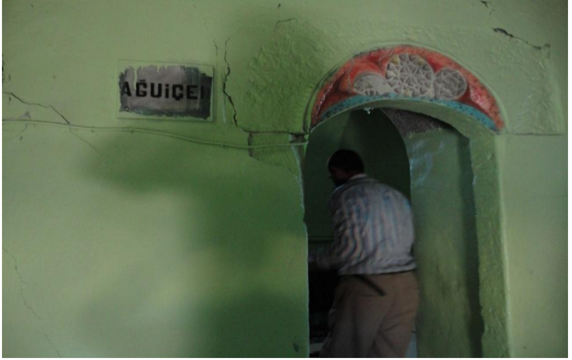
Resim 11- Ağıuçan (Ağıuçen) Türbesinin girişi