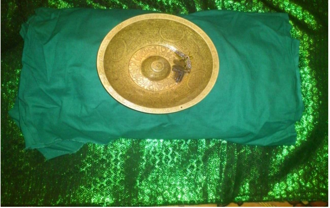
Resim 5- Yeşil bez içerisinde muhafaza edilen Seyyid Nesimi'nin pabuçları.