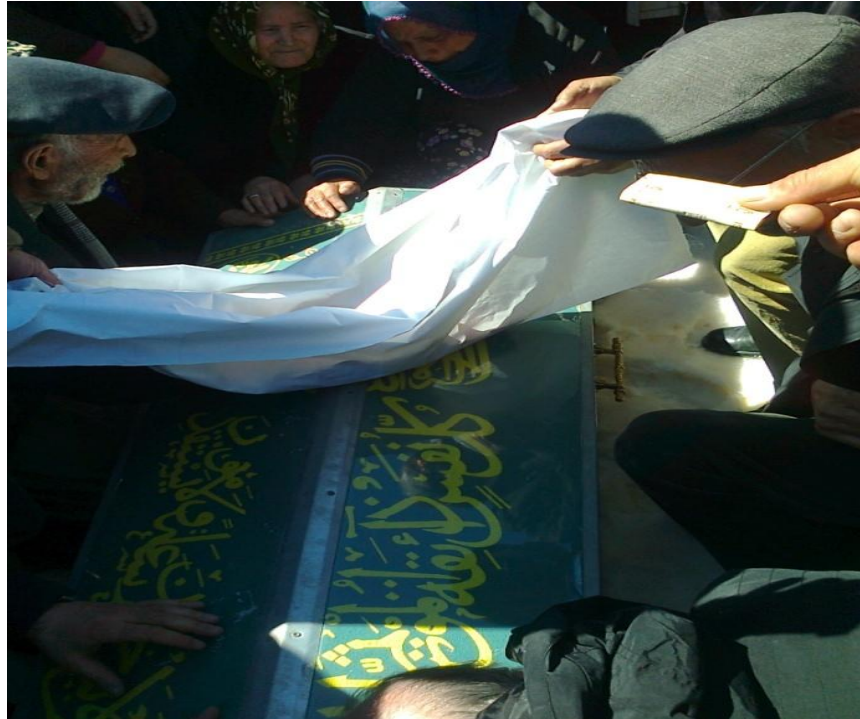
Resim 30- Tabut üzerine bırakılan beze para atılması