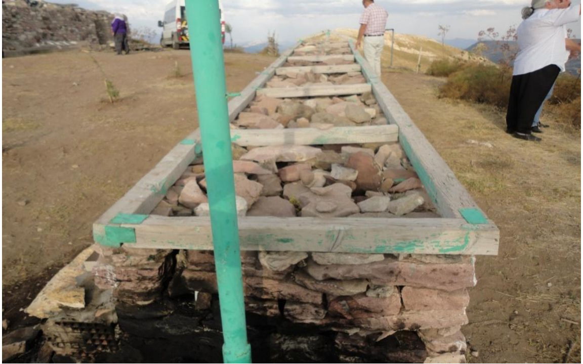
Resim 10- Sarı Saltık'a ait olduğu iddia edilen mezar