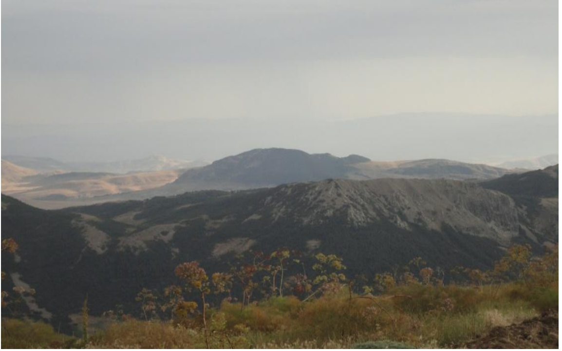
Resim 1- Sarı Saltık Dağı'ndan çevrenin görüntüsü