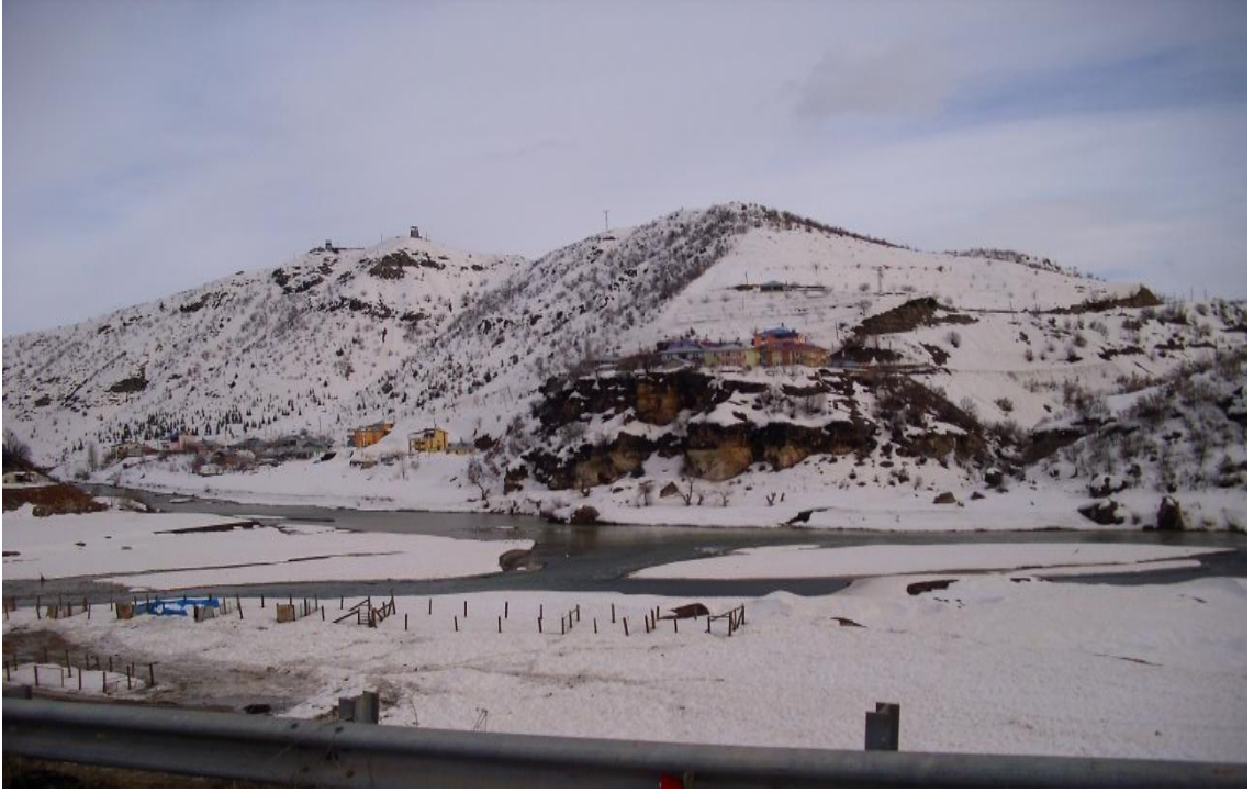
Resim 19-Hızır Gölü'nün karşı cepheden görünümü