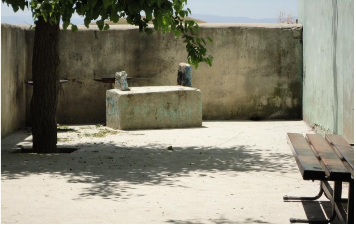
Resim 13- Ađuan'ın kızına ait olduđu iddia edilen tőrbe bahesindeki mezar.