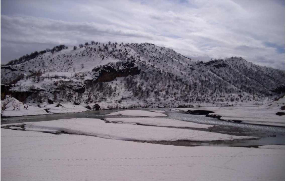
Resim 18- İki suyun birleştiği yerde bulunan Hızır Gölü'nden (Gola Çetu) çevrenin görünüşü