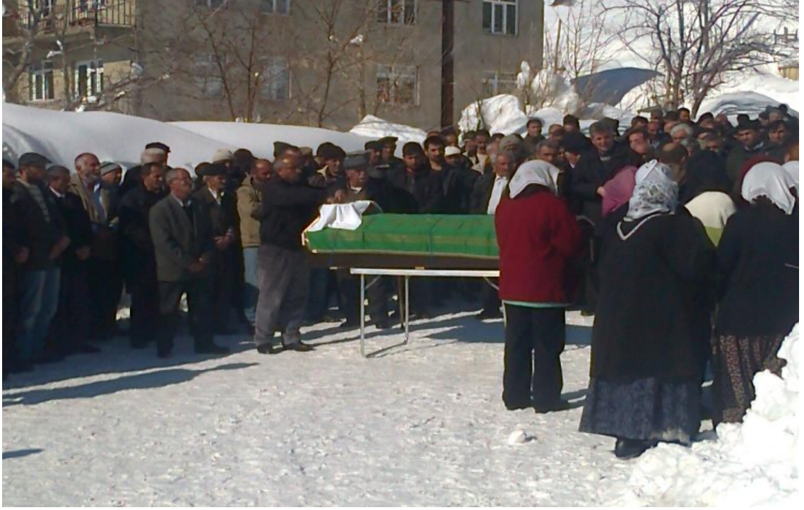
Resim 29- Gerçekleştirilen cenaze törenlerinde tabut üzerine bırakılan kasnak içerisine para atılması