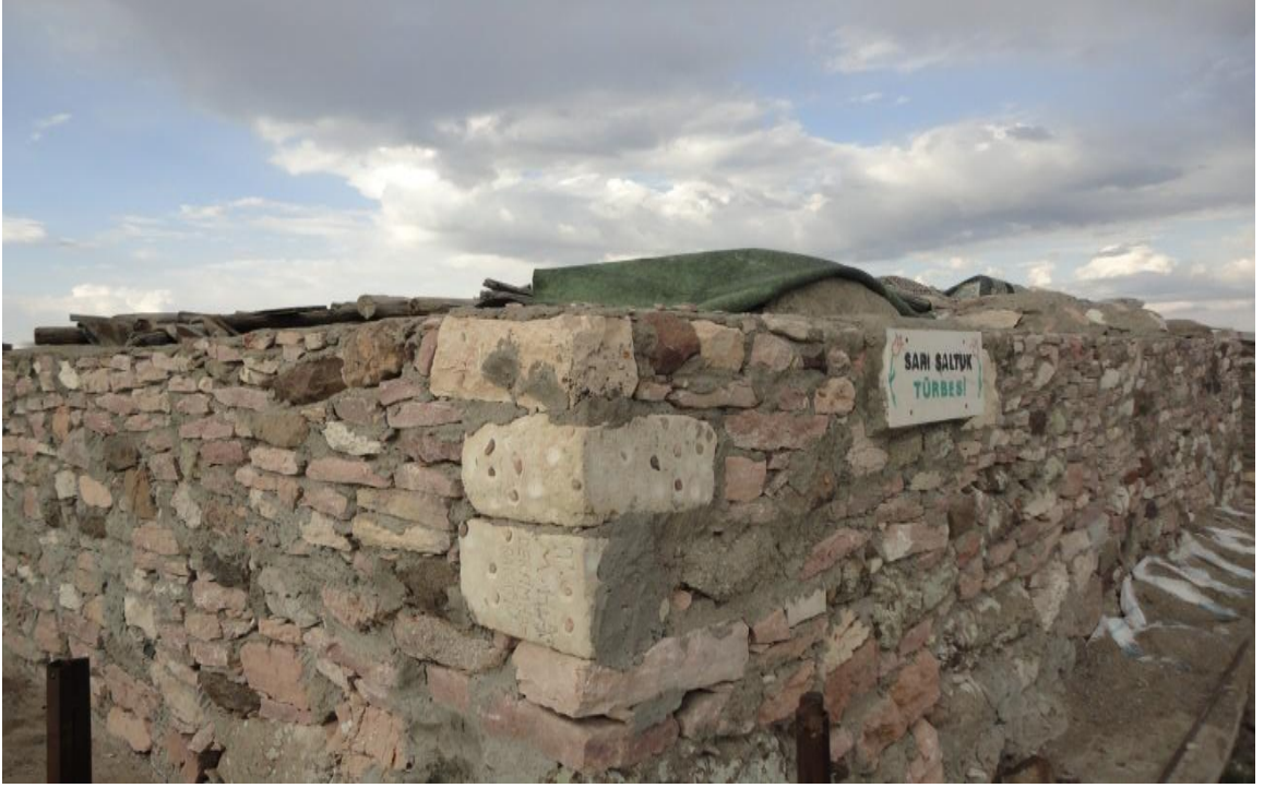
Resim 3- Sarı Saltık'ın mezarının yanında bulunan dinlenme ve aş pişirme yerinin dışarıdan görünümü.