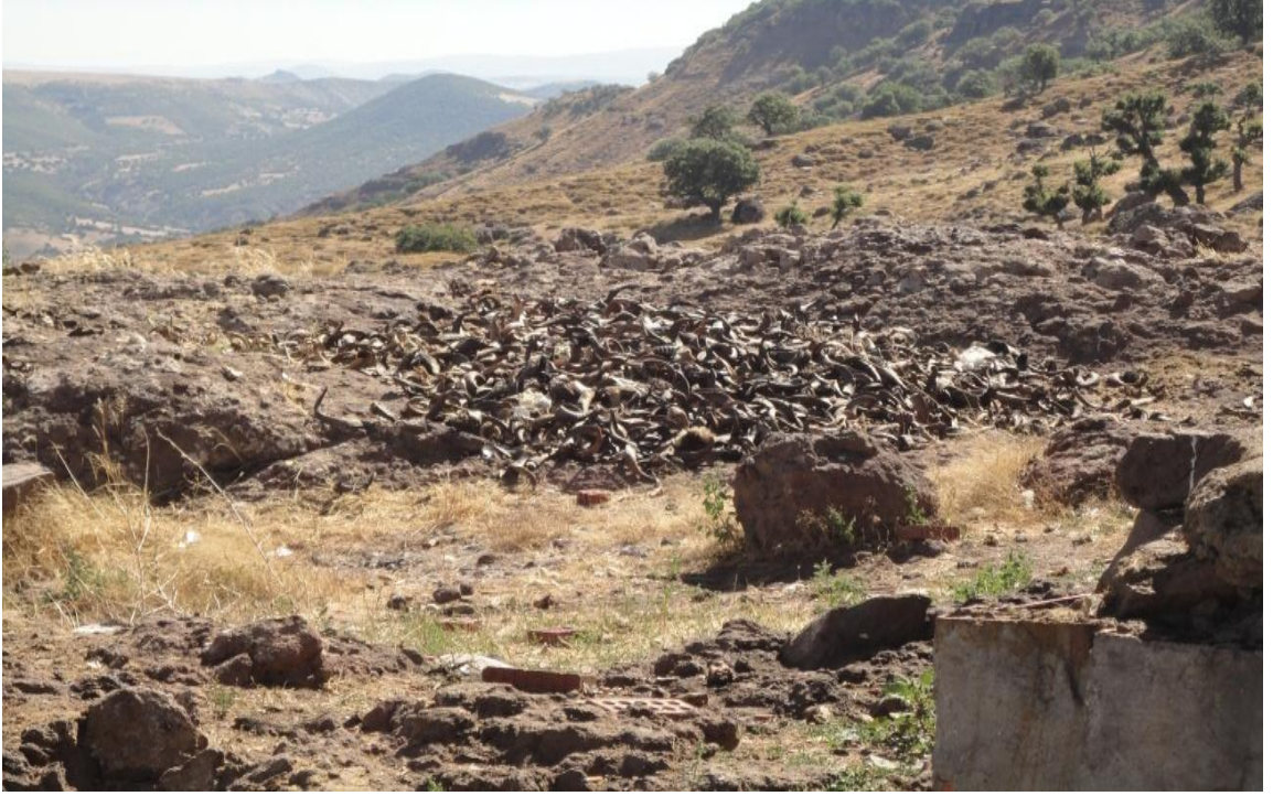
Resim 15- Kesilen kurban boynuzlarının atıldığı bir alan