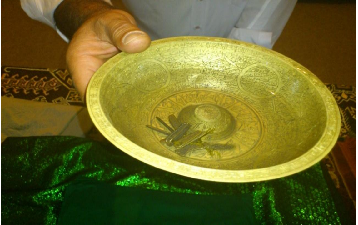
Resim 6- Kutsal olduğuna inanılan madeni tas ile 12 İmamı temsil eden 12 anahtarlık