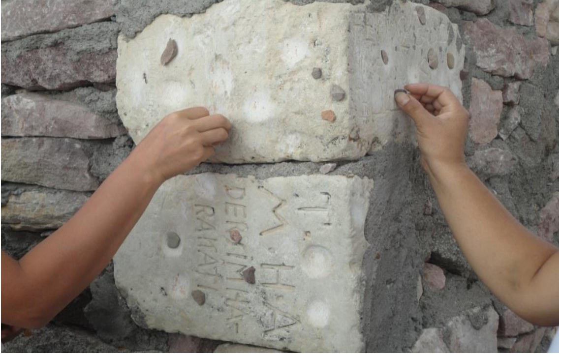
Resim 25- Sarı Saltık Dağın'daki dinlenme ve aş pişirme yerinin duvarına dilekte bulunarak taş yapıştırma inancı