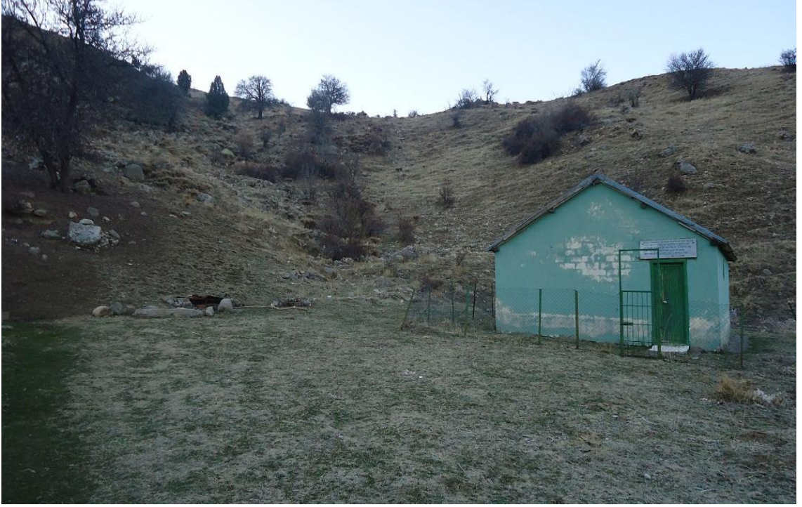
Resim 7- 1937-38 olaylarında öldürülen Sarı Saltıklı ailelere ait mezar yerinde yapılan türbe