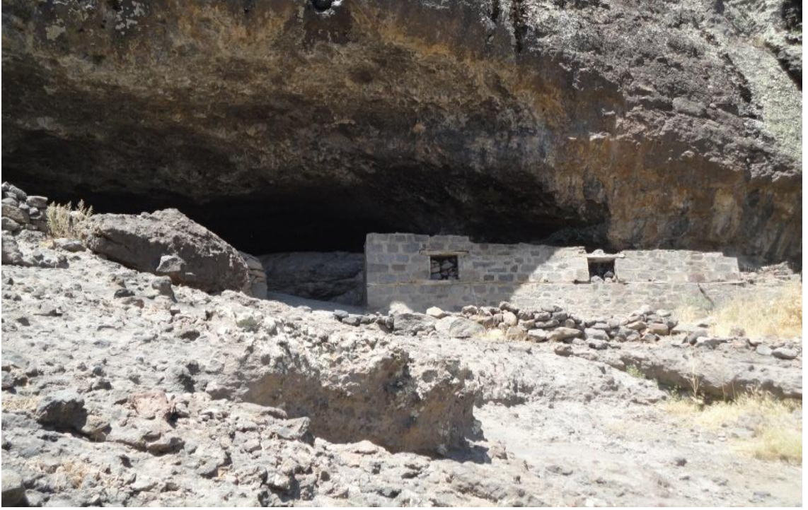
Resim 17- Düzgün Baba'nın kaldığı mağara