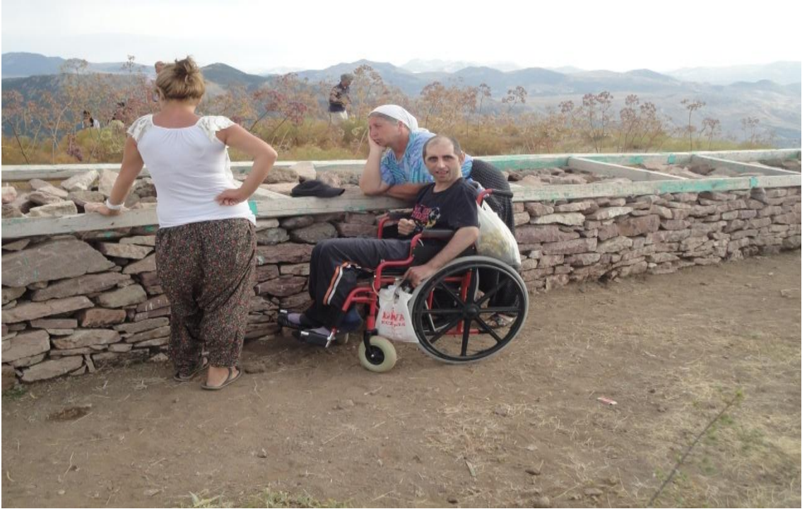
Resim 22- Getirdikleri hastaları ile Sarı Saltık'ın mezarı başında dilekte bulunan bir aile