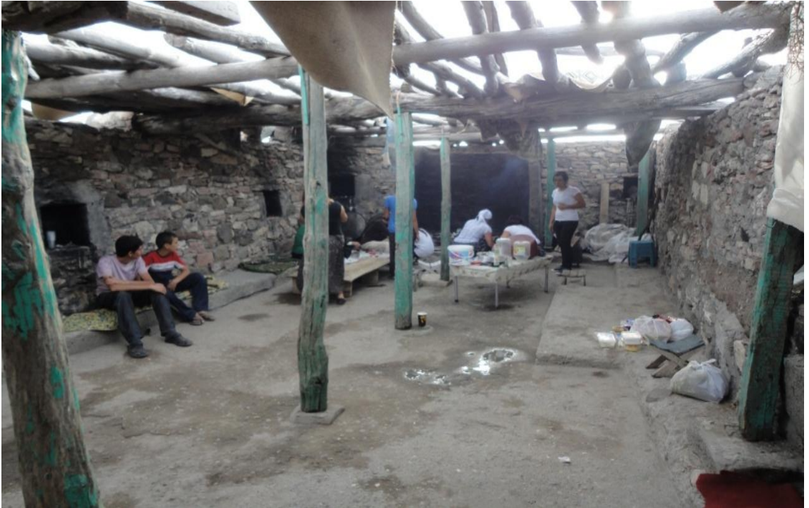
Resim 4- Dinlenme ve aş pişirme yerinin içeriden görünümü.