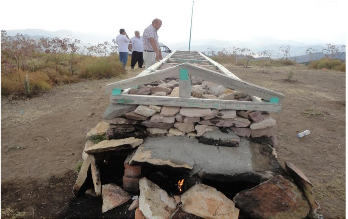
Resim 24- Sarı Saltık'ın mezarı başında yakılan mumlar