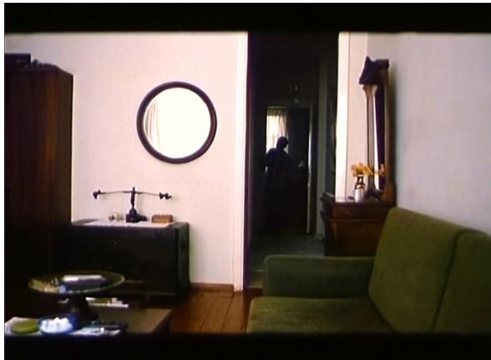
Resim 2.1.1.9 Kamera önüne konulan engeller ya da duvar görüntüyü daraltır

Bazı sahnelerde film karesi bir duvarın gerisine yerleştirilir ve böylece görüntü dikey olarak bölünür. Bölünmüş çerçevede iki tarafta geçen olayı takip edebiliriz. Bu çekim tekniği görüntüyü daraltırken aynı zamanda iç mekâna garip bir estetik duygu da katar. Böylece köhne, eski, kapalı iç mekân sıkıntı duygusunu daha da vurgulayan bir işlev üstlenir. Olayların odanın köşesinden ya da başka bir noktasından alçak ya da yüksek açıyla gösterilmesi, çarpıtılmış bir görme açısı sunduğundan dolayı seyircide bir rahatsızlık yaratır. Kameranın bu şekilde konumlanması ve açılması duvarların da varlığı belirginleştirerek kapalılık duygusunu güçlendirir.