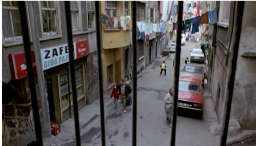
Resim 2.3.7. İstanbul'un demir parmaklıklar ardından görüntüsü

gittiklerini Yusuf'un hapisneden arkadaşı Orhan'ı bulma istediğinden anlarız. Orhan'ın babasıyla birlikte İstanbul'da bir kahvehane işlettiğinden bahsetmiştir Yusuf daha önce. Böylece Yusuf Çilem'i de alarak İstanbul'a, hapisneden arkadaşı Orhan Kara'yı bulmaya gider. Orhan'ın Uğur'un sevgilisi Zagor Orhan olduğunu Yusuf bilmemektedir. Bu detay Yusuf'a ve aynı anda seyirciye, televizyondan Zagor'un cinayete karıştığı haberlerde resminin gösterilmesi aracılığıyla verilir. Böylece anlatıya bir girdap daha eklenmiş olur. Cinayete karışan Zagor Orhan ile İstanbul'da geldikleri yerde resmi bulunan Orhan'ın aynı kişi olduğu görülür. Böylece Zagor Orhan ve Yusuf'un arkadaşı Orhan Kara'nın aynı kişi olduğunu anlarız. Yusuf ve Çilem İstanbul'a geldiklerinde genel bir İstanbul görüntüsü yine görmeyiz. İstanbul demir parmaklıklar arkasından ya da çok kalabalık bir şehir olarak gösterilir. Böylece karakterlerin özgür oldukları halde tutsak hayatlar yaşadıkları ve beliren tesadüflerle kısır döngü duygusu yinelenmiş olur.