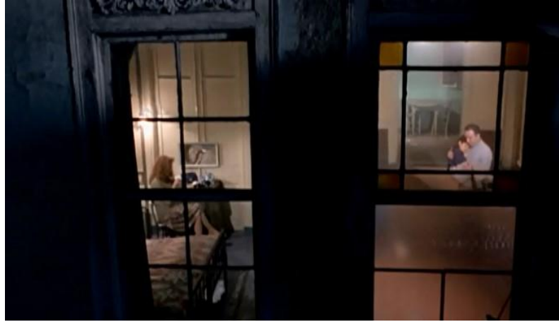
Resim 2.1.1.8 Çerçeve içinde çerçeve ile daraltılan görüntü

Bazı sahnelerde film karesi bir duvarın gerisine yerleştirilir ve böylece görüntü dikey olarak bölünür. Bölünmüş çerçevede iki tarafta geçen olayı takip edebiliriz. Bu çekim tekniği görüntüyü daraltırken aynı zamanda iç mekâna garip bir estetik duygu da katar. Böylece köhne, eski, kapalı iç mekân sıkıntı duygusunu daha da vurgulayan bir işlev üstlenir. Olayların odanın köşesinden ya da başka bir noktasından alçak ya da yüksek açıyla gösterilmesi, çarpıtılmış bir görme açısı sunduğundan dolayı seyircide bir rahatsızlık yaratır. Kameranın bu şekilde konumlanması ve açılması duvarların da varlığı belirginleştirerek kapalılık duygusunu güçlendirir.