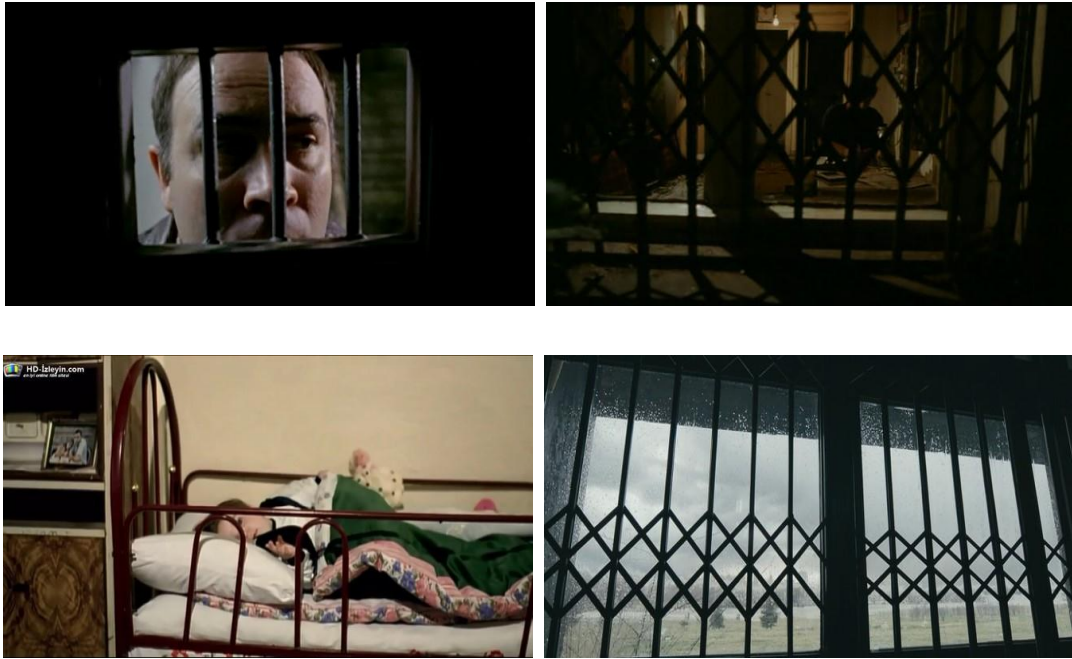
Resim 3.2. Demir parmaklıklar ve karakterlerin demir parmaklıklar ardındaki görüntüleri

ait, ya da belki dışarıdaki hayatın da bir tür “içeridelik” olduğunu imleyen bir öge olarak kullanılır. Dolayısıyla bu motif de sık tekrar edilmesinden dolayı yukarıda bahsedilen döngüsel rotayı destekler. Örneğin Masumiyet 'te Yusuf'un hapisanede olduğunu ilk başta anlamayız. Hapishane müdürü ile olan konuşmasında dışarı çıkmak istemediğini, dışarıda kimsesinin olmadığını anlatan Yusuf'u daha sonra dışarıda yani özgür hayatta parmaklıklar ardında görürüz. İlginç bir biçimde özgürlüğü hapseden bir motif olarak demir parmaklıklar kullanılmıştır. Ya da Üçüncü Sayfa 'da Meryem ile İsa parkta gelecek hayali kurarken parkın oyun aletlerinden biri olan demir zincirlerin arkasında konumlandırılmıştır. İsa'yı evinin dışından gösteren yönetmen onu yine pencerenin demirleri arkasına hapsedmiştir. Aynı şekilde Kader 'de Uğur'un bebeği ile ilk karşılaştığımız sahnede Çilem beşiğinde yatmaktadır, bebek beşiğin demir parmaklıkları arasından seyirciye görünmektedir. Yeraltı 'nda Muharrem iş yerindeyken sürekli camdan gökyüzüne bakar, tabi camların önündeki demir ferforjelerin ardından.