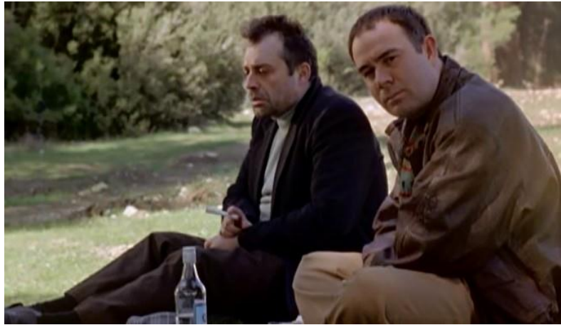
Resim 2.3.5. Bekir ve Yusuf kır gezintisi 2

Filmin son sahnelerine doğru Zagor'un peşinden giden Uğur, Bekir'e haber göndererek, Çilem'i alıp Ankara'da bir pavyona gitmesini, Zagor'un onları orada bekleyeceğini söyler, Çilem'i Zagor'a teslim etmesini ister. Yusuf ve Çilem'in Ankara'ya geldiğini küçük bir Ulus heykel sahnesinden anlarız. Fakat yine Ulus'taki heykeli bilmeyen bir seyirci için buranın hangi şehir olduğunu anlamak zordur. Bu görüntüde de çerçeve ön tarafa yerleştirilen bir takım bitkilerle bölünmüş, Yusuf ve Çilem kalabalığın içine karışıp tek tipleştirilmiştir. Onları kalabalıktan ayıran tek şey Çilem'in kırmızı paltosudur.