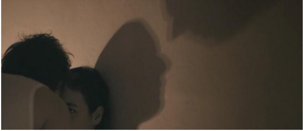
Resim 2.3.5. Gölgeler ve fahişe kadın

davranışlar olacaktır. Fakat aslında bu olumsuz bir durum değildir; zira insanın insan olmaya en yakın olduğu zaman bir hayvanla birebir empati kurabildiği andır ve bir yerde insanın akli olduğu kadar akıldışı bir varlık olduğuna da göndermedir bu hırılda ve havlama meselesi. Oteldeki kadına karşı hırlarken, havlarken kadının kendisinden korktuğunu, sindiğini gördükçe diş dokunur bir rakip olmadığını anlar ve tahakküm kurmaya çalışır. Bu güç savaşı da görsel düzlemde müthiş bir gölge oyunu ile gösterilir. Sadece mum ışıkları ile çekilmiş bu sahnede karakterlerin gölgesi duvarda büyür ve Muharrem fahişe kadını yiyecekmiş gibi üzerine çullanır.