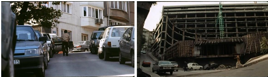
Resim 2.3.9. İsa ve dar sokaklar ve inşaatlar ile kuşatılmışlık

Üçüncü Sayfa 'da az sayıda dış mekân kullanılmasına rağmen filmin kapalılık ve sıkışmışlık duygusu bu sahnelerde de üretilmiştir. Bu filmin, İstanbul'da geçtiği yine dış mekân görüntülerinden hiçbir şekilde anlaşılmaz. İsa bir yapım şirketinde figüranlık yapmaktadır. Oyuncu seçimleri yapılan bir sahnede sorulan sorulara cevap verirken askerden sonra İstanbul'a geldiğini ve yerleştiğini öğreniriz. Dış mekân çekimleri çoğunlukla sıkışık ara sokaklarda yapılmıştır. Çift taraflı park eden araçlar sokağı iyice daraltmış, arka plandaki inşaat halinde olan yapılar, karakterlerin kentleşme ve apartmanlaşma olgularıyla çevrelendiği hissini uyandırmıştır. Bu sahnelerin hemen hiç birinde gökyüzü ya da bir açıklık gözükmez. Karakterler dış mekânda olmalarına rağmen evlerindeki gibi çevrelerindeki araçlar, binalar, nesnelere tarafından kuşatılmış, dört bir yanları çevrelenmiştir. Daraltılan görüntüler kentsel eşitsizlik ve yabancılaşmayı vurgulamaktadır. Film içinde zengin ve yoksulun karşılaştığı hiçbir sahne olmamasına rağmen Lefebvre'in bahsettiği kent içinde üretilen homojenlik ve hiyerarşiklik çok net hissedilir. Karakterler ne yaparsa yapsınlar yoksulluklarından kurtulamayacaklardır.