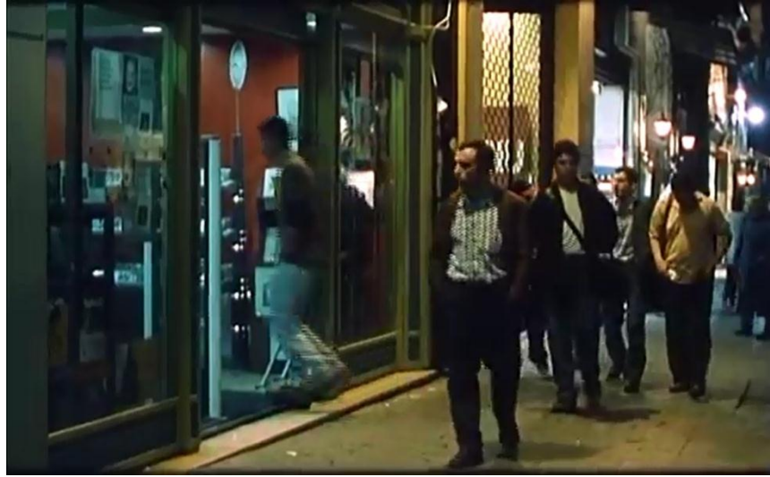
Resim 2.3.11. Musa şehrin sokaklarında yalnız gezer