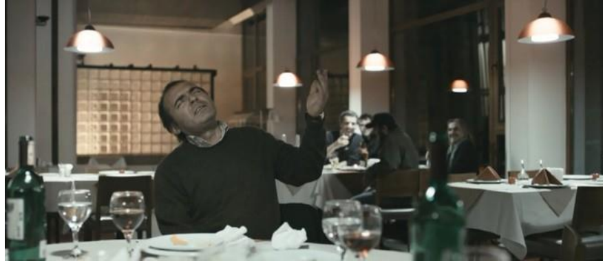
Resim 2.2.9. Ben & Biz: Muharrem tek başına türkü söyler