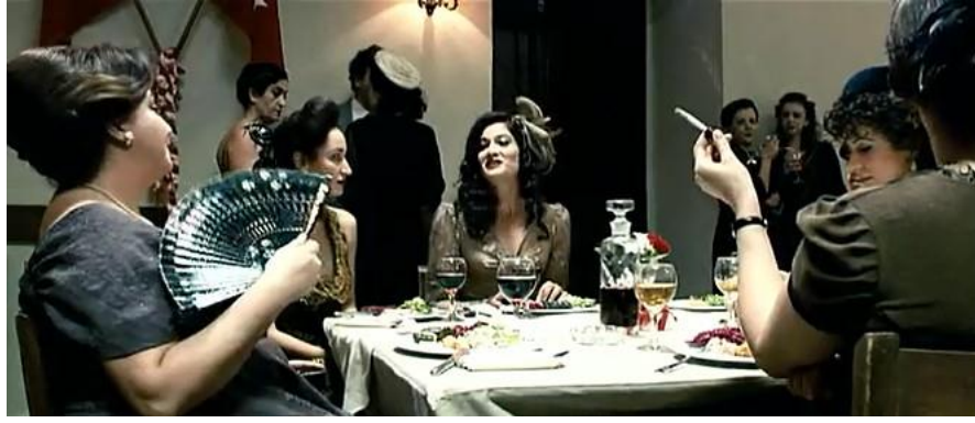
Resim 2.3.9. Cumhuriyet balosundan görüntüler

Üçüncü Sayfa 'da az sayıda dış mekân kullanılmasına rağmen filmin kapalılık ve sıkışmışlık duygusu bu sahnelerde de üretilmiştir. Bu filmin, İstanbul'da geçtiği yine dış mekân görüntülerinden hiçbir şekilde anlaşılmaz. İsa bir yapım şirketinde figüranlık yapmaktadır. Oyuncu seçimleri yapılan bir sahnede sorulan sorulara cevap verirken askerden sonra İstanbul'a geldiğini ve yerleştiğini öğreniriz. Dış mekân çekimleri çoğunlukla sıkışık ara sokaklarda yapılmıştır. Çift taraflı park eden araçlar sokağı iyice daraltmış, arka plandaki inşaat halinde olan yapılar, karakterlerin kentleşme ve apartmanlaşma olgularıyla çevrelendiği hissini uyandırmıştır. Bu sahnelerin hemen hiç birinde gökyüzü ya da bir açıklık gözükmez. Karakterler dış mekânda olmalarına rağmen evlerindeki gibi çevrelerindeki araçlar, binalar, nesnelere tarafından kuşatılmış, dört bir yanları çevrelenmiştir. Daraltılan görüntüler kentsel eşitsizlik ve yabancılaşmayı vurgulamaktadır. Film içinde zengin ve yoksulun karşılaştığı hiçbir sahne olmamasına rağmen Lefebvre'in bahsettiği kent içinde üretilen homojenlik ve hiyerarşiklik çok net hissedilir. Karakterler ne yaparsa yapsınlar yoksulluklarından kurtulamayacaklardır.