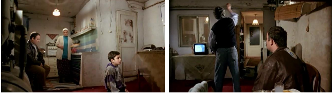
Resim 2.1.1.7 Yusuf'un ablası ve eniştesinin şiddet yüklü evi

Demirkubuz'un sinema evreninde her şey insana düşmandır: zaman, mekân, dünya, insanlar, hayat, kader, ev... hatta kendisi bile. Dört yanı cehennemle, düşmanla çevrili tekinsiz bir dünyada insanın biricik varlığı ise dehşettir; insan o dehşet içinde doğar, dehşet içinde yaşar ve ölür. Bir mikrokozmos olarak düşündüğümüzde Demirkubuz sinemasında ev, dışarıdaki dehşetin mikro ifadesidir. Karakterlerdeki aidiyet, insanın karanlığına, zaaflarına, hasılı karanlığın, tekinsizliğin, bilinmez, kötülüğün ilmek ilmek ördüğü dehşetidir (Pay, 2010, s. 42).