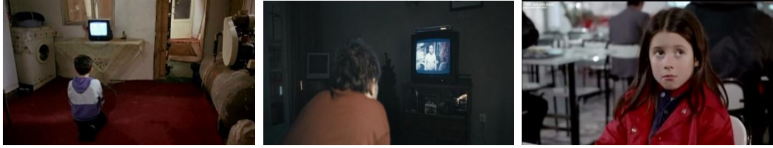
Resim 3.1. Karakterlerin hareketsiz ve ifadesizce televizyon izlemeleri

Örneğin Masumiyet 'te Yusuf otele ilk giriş yaptığı zaman arka fondaki Yeşilçam filmi onu “Hoş geldin!” diye karşılar. Yine Masumiyet 'te Uğur'u terk etmeyi kafasına koyan Yusuf akşama bu eylemi gerçekleştirememiş, tekrar otele dönüp gelmiştir. İçeri girince Yeşilçam filminde “Öff, bıktım usandım artık...” cümlesi duyulur. Karakterin çıkışsızlığını artıran bir etki yaratır bu ses. Aynı şekilde geceyi karakolda geçirip falakaya yatırılan Yusuf sabah kanlar içinde otele dönünce televizyonda çizgi filmdeki Casper'in “Ne oldu sana?” sesini işitiriz.