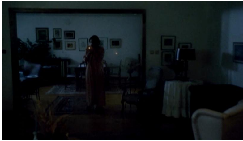
Resim 2.1.1.2 Tülay salonda çerçeve içinde çerçevenilmiş ve doğal ışık kullanımı

Tülay'ı sıklıkla Demirkubuz sinemasının temel özelliklerinden biri olan çerçeve içinde çerçeve görüntü düzenlemesi içinde görürüz. Bu kullanım karakterin film çerçevesi içine iyice hapsolması, özgürlüğünün kısıtlanması, kaçışının mümkün olmaması etkisini arttırır. Ayrıca bu teknik derinliği de iyice azaltarak kişinin mekân ile tamamen bütünleşmesine, o mekânın bir “parçası”, cansız bir “nesnesi” haline gelmesine neden olur. C Blok 'un görsel tonu zaten gri ve karanlıktır. Yine benzer şekilde Tülay'ın arkadaşı Fatoş (Ülkü Duru) ile ya da kapıcı Halet (Fikret Kuşkan) ile olduğu sahnelerde de çoğu zaman ışık ya çok düşüktür ya da doğal ışık kullanılmıştır; ki çekimlerin çoğu akşam saatleri ya da sabaha karşı, doğal ışığın da oldukça düşük olduğu zaman dilimlerinde gerçekleşmiştir.