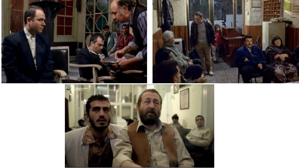
Resim 2.1.2.1 Otel odaları ve bekleyen karakterler

Anlamsız boş gözlerle televizyona bakan karakterlerde bir yandan trajik bir taraf da sezilir. Karakterler otel lobisiyle, zamanın geçmesini beklercesine, her ne kadar dövüş sahnesi ya da aşk sahnesi izleseler bile öyle bir hayata asla dâhil olamayacaklarını bilircesine, çaresiz kaderlerine boyun eğercesine bütünleşirler. Bu otellerin sakinleri bir mülksüzler ordusu gibi oturmuş, edilgenlikleri içinde boğulmaktadır. Aslında otel odalarının ve bekleme salonlarının, lobilerin oluşturduğu duygu da tam olarak budur: mülksüzlük, yersizlik, yurtsuzluk, “hiçbiryerlilik”. Yusuf gibi “gidecek yeri olmayan”, ucuz otellerin lobilerinde oturup hiçbir yerine dâhil olmadıkları filmleri, melodramları izleyen insanların dünyasıdır oteller. Lobiler mekân olmayan mekânların, mekânı olmayan insanların, hiçbir yere ait olmayan salonları gibidirler. Fondaki Yeşilçam anlatıları ise, salonda açık unutulmuş bir televizyonun, zamansal ve dairesel bir bugünü yaşayan insanlara kurmaca bir hayat hazırlayan bir imgesidir.