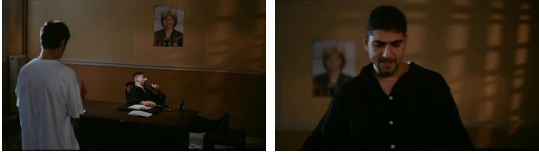
Resim 3.4.1 Tansu Çiller, mafya “babası” ve İsa

Mafyanın dayacağından parayı üç gün içerisinde ödeyeceğine dair söz verip paçayı kurtaran İsa, bodrum katındaki evine zor atar kendisini. İsa’yı ağzı burnu kan içerisinde evinin kapısında gördüğümüzde dikkatimizi ilk çeken şey, duvarda asılı olan Cüneyt Arkın’ın film afişi “Dört Yanım Cehennem” olur. Afişin mesajı dâhilinde şiddetin ve cehennemın İsa’nın dört bir yanını sardığı duyumsanır. Bu cehennemden kaçışın tek yolu ölüm olacaktır çünkü parayı ödemesini herhangi bir yolu yoktur. Bunun için patronunun ofisinden çaldığı tabanca ile intihar etmeye karar veren İsa arkasında bir mektup bırakarak silahı başına dayar. Tam tetiği çekecekken gelen ev sahibi kirayı istemektedir. Ev sahibinin mafya adamı ile aynı şiddet dolu eril dili kullanması dikkat çekicidir. “İbne”, “göt veren” küfürleri aynen tekrar edildikten sonra ev sahibi İsa’yı kirayı ödemesi için son kez uyarır: “Ya vereceksin, ya vereceksin!” Mafya adamının ofisinde Tansu Çiller’in imgesiyle üretilen şiddet, evin kapısında ev sahibi imgesi olarak çıkar karşımıza. “Dört Yanım Cehennem” afişi, İsa’nın izbe tek göz odalı evi, tartışmanın kapının eşiğinde geçiyor oluşu ve arkadan aralıksız gelen su sesleri, şiddetin kaçınılmaz olduğunu göstermektedir.