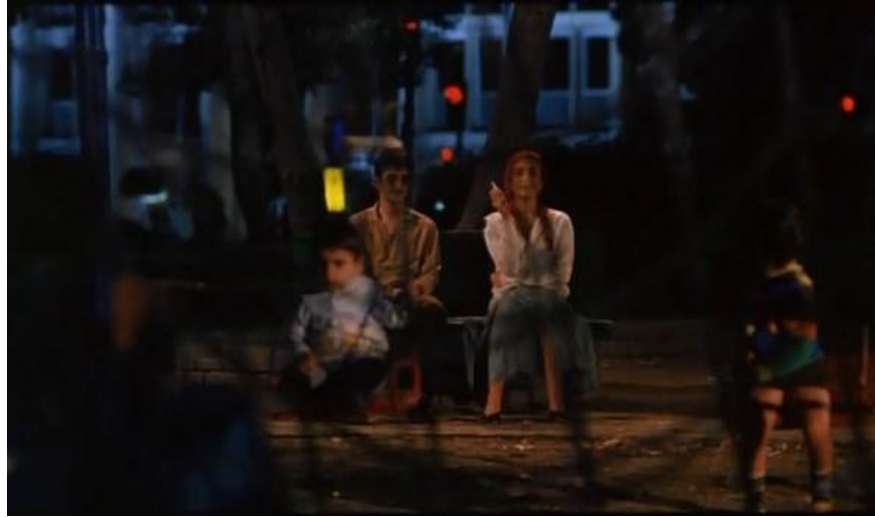
Resim 2.3.10 İsa, Meryem ve çocukların demir zincir ardından görüntüleri

Albert Camus'nün Yabancı'sı (1942) ve Dostoyevski'nin Yeraltından Notlar'ı (1864) dönemleri için çok önemli romanlardır. Yabancı İkinci Dünya Savaşı sonrası Fransız toplumunda gerçekleşen ahlaki ve toplumsal değişimleri hedef alır ve eleştirel bir yaklaşım sunar; Yeraltından Notlar Rusya'da başlayan modernizm ve batılılaşmayı hedef alır. İki dönemin toplumları için söylenebilecek ortaklıklar rasyonelleşme, pragmatizm ve toplumsal ilerleme fikirleri çerçevesinde yaşamalarıdır. Camus'nün Dostoyevski'den varoluşsal anlamda etkilendiği zaten bilinmektedir ve iki yazarın da romanlarında yarattıkları karakterler Meursault ve Dostoyevski'nin adı bilinmeyen memuru, modernizm ile yaratılmış rasyonelleşme, pragmatizm ve toplumsal ilerleme fikirlerine karşı akıl dışılığın akılcılığını kullanırlar. Özellikle Dostoyevski, “İnsan başarılı, iyi ve yararlı olmalıdır” diyen düşüncenin egemen olduğu bir dönemde, insanın sadece bunlardan ibaret olmadığını, insanı insan yapan özelliklerinin bilimsel yasalarla açıklanamayacağını, “insanda, insan olmaktan daha fazla bir şeylerin” var olduğunu söyler. Dolayısıyla her şeyin iki kere iki dört eder gibi neden-sonuçlara indirilemeyeceğini, hele hele insan ve eylemlerinin hiçbir şekilde neden-sonuç çerçevesi içinde düşünülmemeyeceğini vurgular.