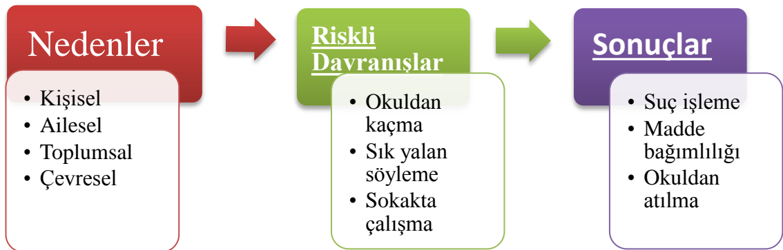
Şekil 1: Riskli Davranışlar, Nedenleri ve Sonuçları

Koruyucu ve önleyici tedbirler olmadığı için riskli davranışlar ortaya çıkmakta ve bunlar çocuklar için iyilik hallerini olumsuz etkileyen şekil 1 de görüldüğü gibi durumlara yol açmaktadır.