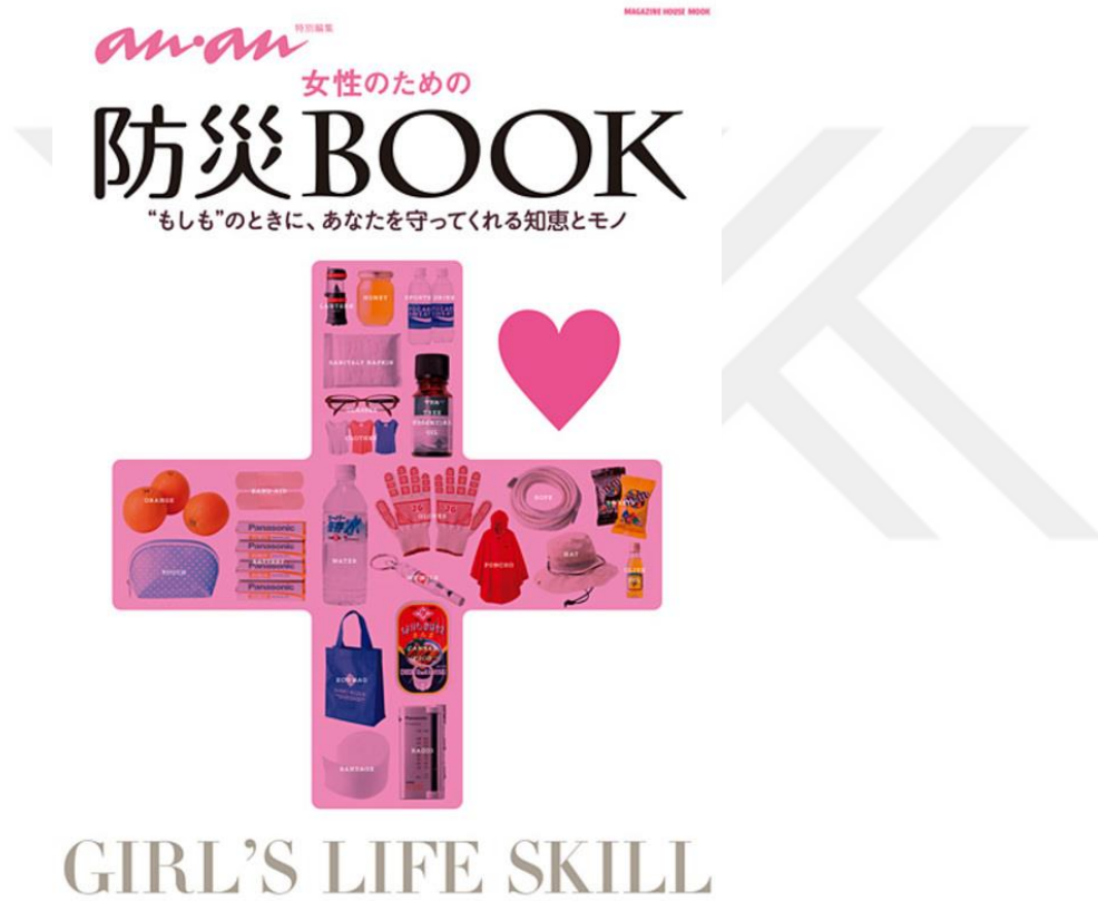
Şekil 2. Japonya'da kadınlar tarafından hazırlanan afete hazırlık broşürü

sırasında çadırda yatma, su ve elektrik olmadan idare edebilme ve bunun gibi konularda bilgi vermişlerdir.(Koikari, 2013) Ayrıca, çocukların afetler konusunda bilinçlendirilmesine yönelik olarak çeşitli merkezlerde (üniversitelerde ya da yerel yönetimlerde) eğitim araçları hazırlamışlardır. Bunlar arasında çocukları sevdiği geleneksel oyunlar ya da popüler animasyon karakterleri kullanılarak çocukların afete hazırlık ve afetleri önleme konusunda bilinçlendirilme faaliyetleri de yer almıştır. (Şekil 2) (Koikari, 2013).