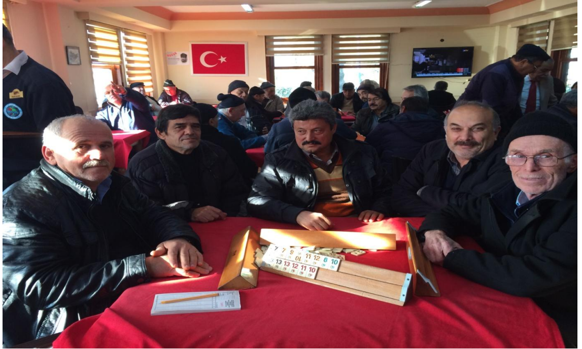
Fotoğraf 4: Emekli madencilerin vakit geçirdikleri Kdz Ereğli İhtiyarlar ve Gençler Evinde kaynak kişilerle görüşmemizden bir görüntü.