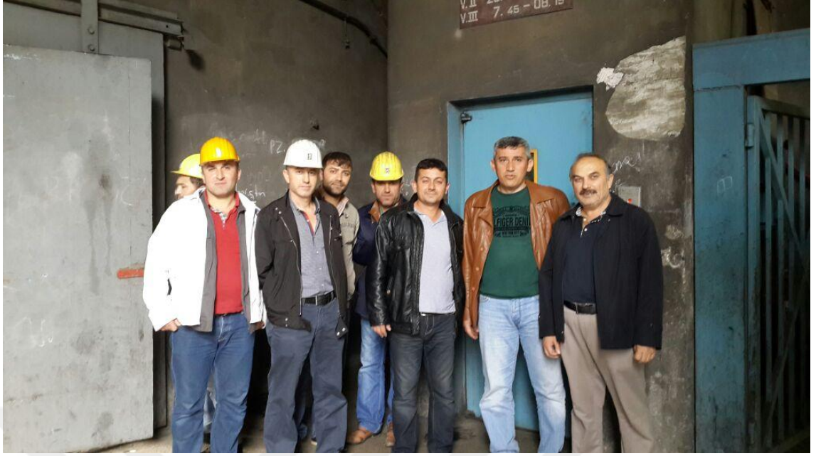
Fotoğraf 3: Amirler ve işçilerle birlikte kaynak kişilerimizden bir görüntü.