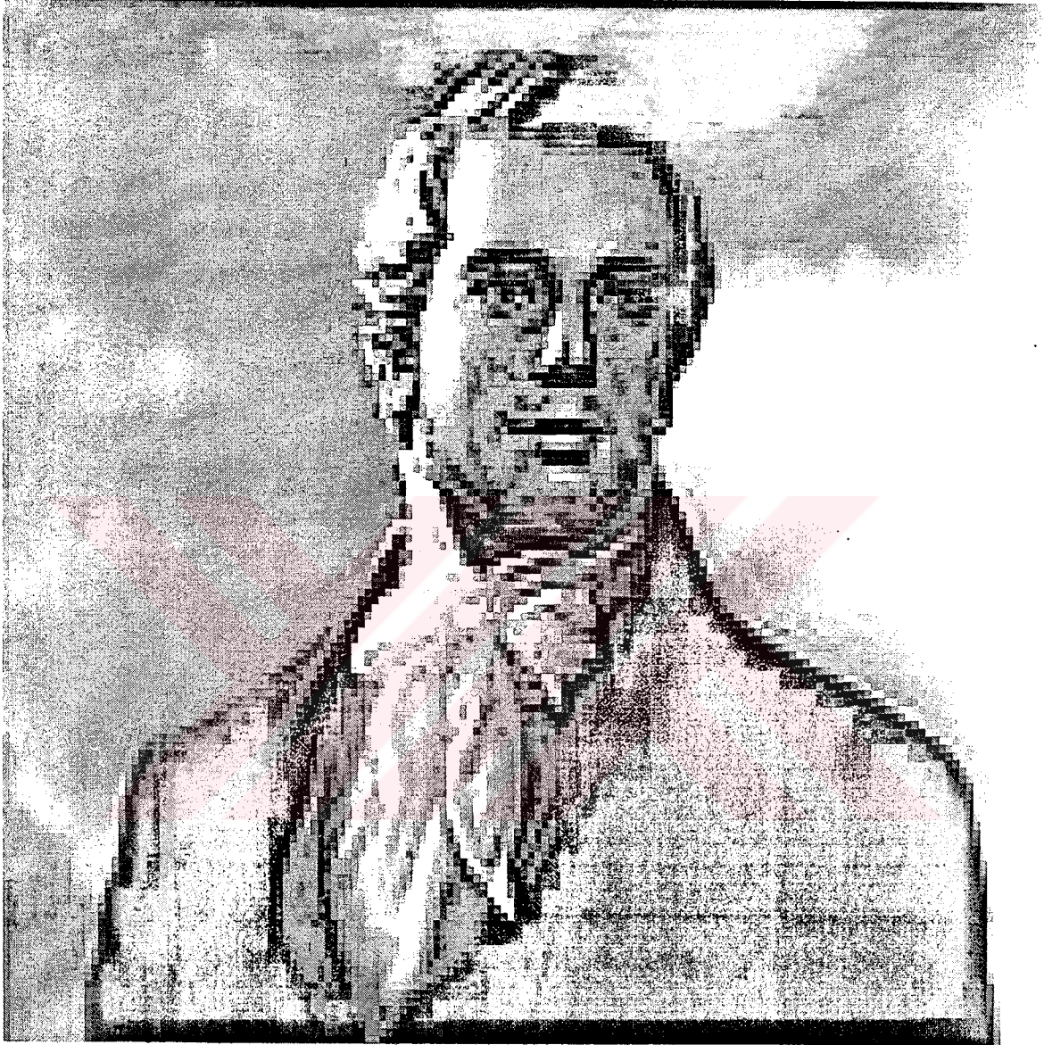
JOSEPH SMITH (1805-1844)