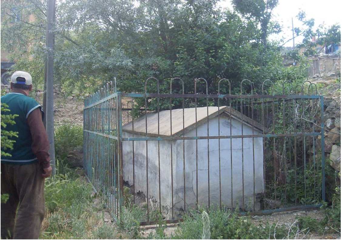
Fotoğraf: 7 Göçeri köyünde Samet Dede'ye ait olduğu söylenen mezar