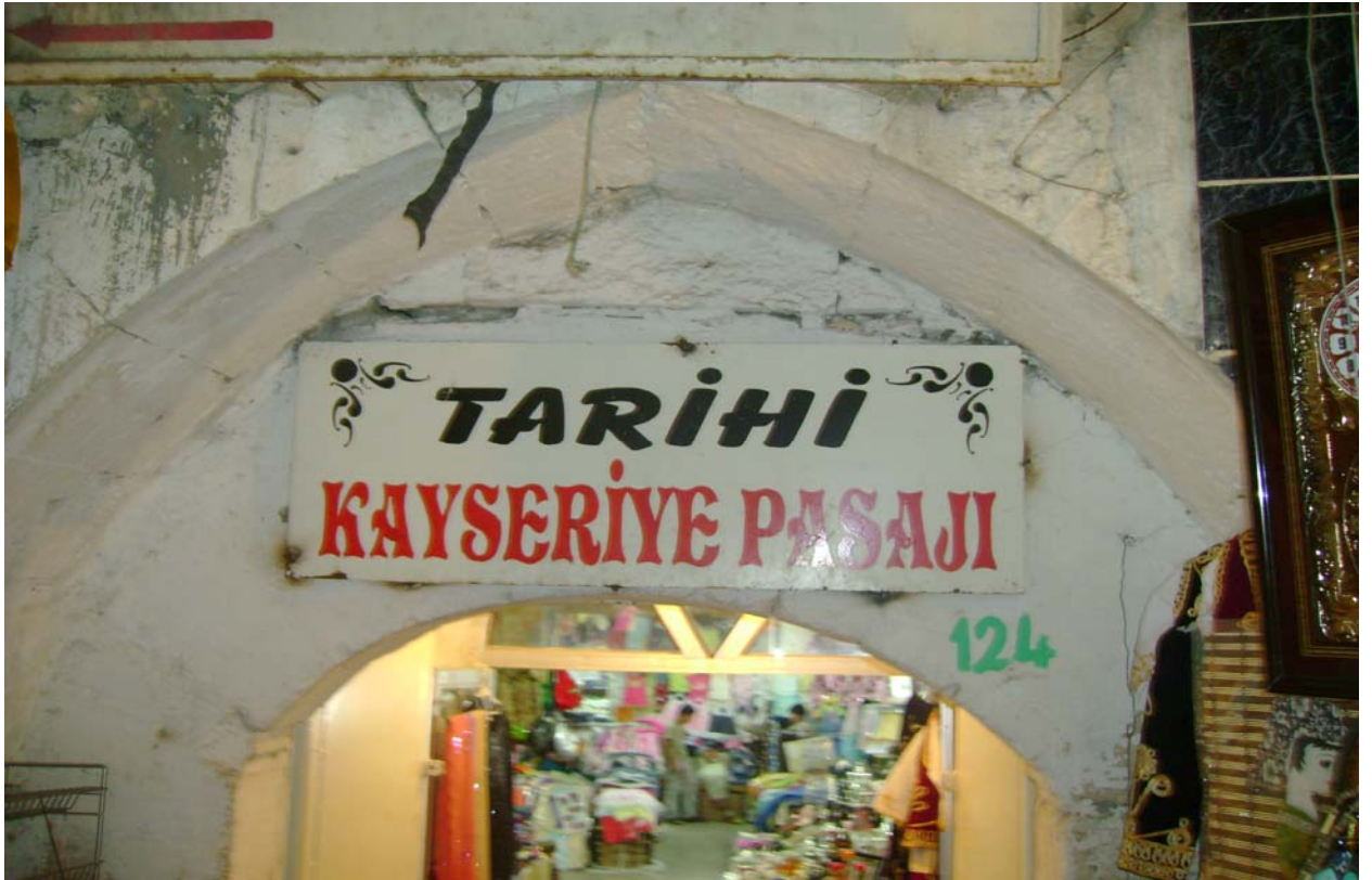
Resim-9-10: Mardin'deki Kayseriye Pasajı