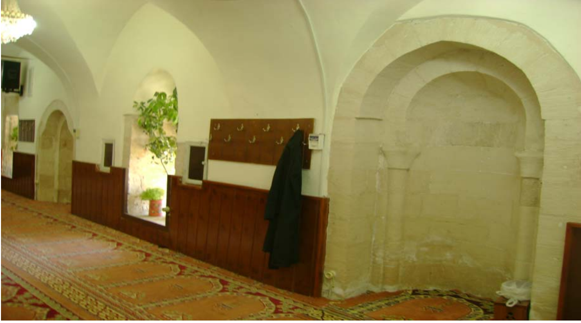
Resim-3 : İki Mihraplı Mardin Şeyh Çabuk Camii

Yukarıda da belirtildiği üzere, Mardin çevresi beyaz taşlarının, ilk etapta yumuşak, işlenmeye elverişli olması ve zamanla sertleşmesi, taş tezyinatında harika örneklerin verilmesine zemin hazırlamıştır. Mardin’de geometrik ve bitkisel süslere yer verilmiştir. Anadolu Selçuklu sanatkarlarının da sıkça başvurduğu bu süslemeye ek olarak, her iki ülke sanatçıları Kur’an’dan ayetlerle süslemeler yapmışlardır.