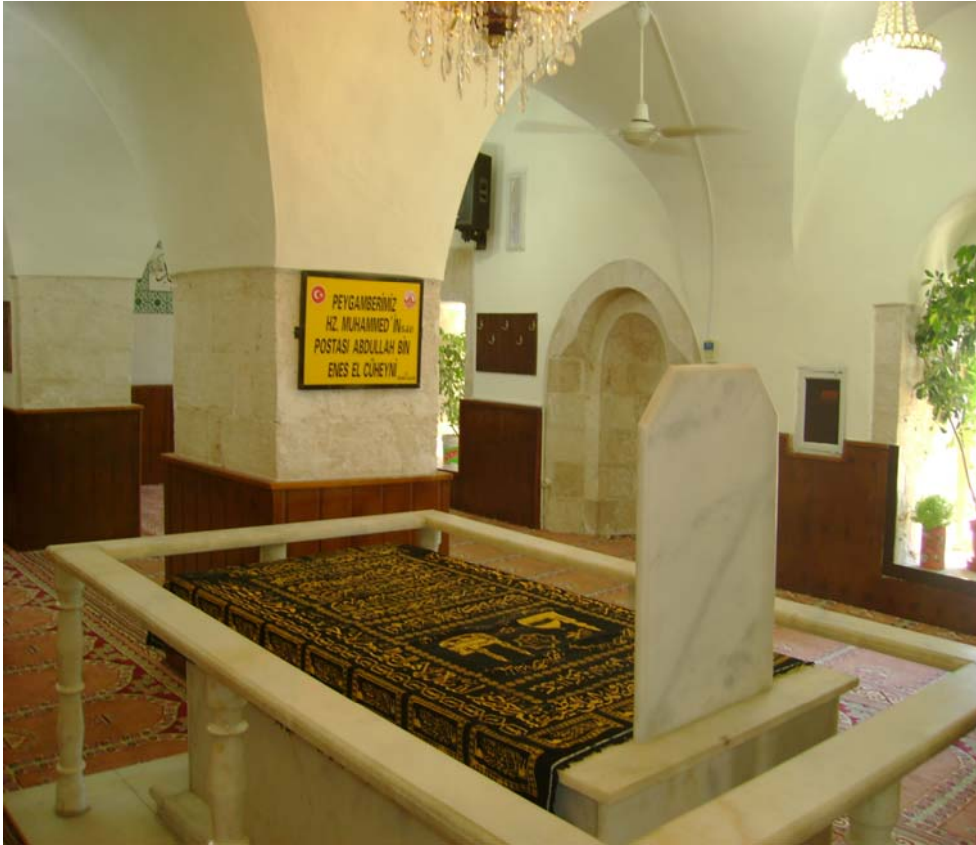
Resim-2: Şeyh Çabuk Camisinde Bulunan Türbe