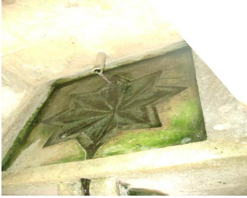
Resim-4 : Mardin Melik Mahmut Camii Selsebilindeki 8 Kollu Yıldız