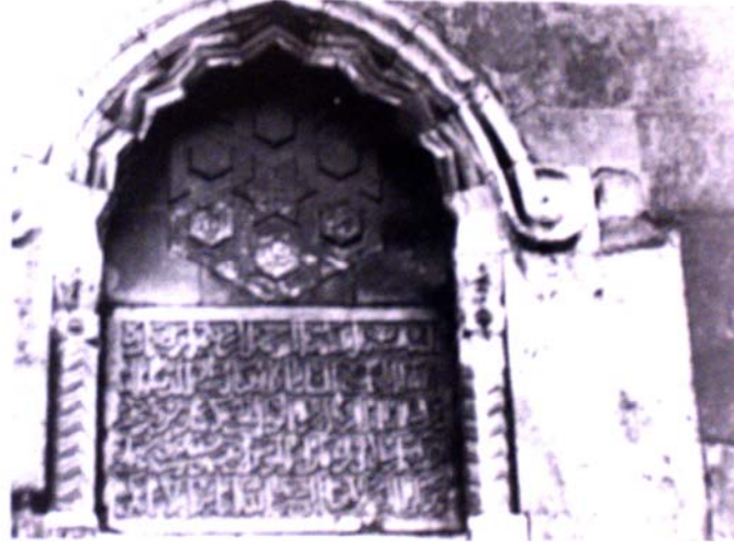
Resim-8: Konya Alaeddin Cami Kitabesi

(1220-1237) dönemlerinde çalışmış ve Alaeddin cami kitabelerine göre, caminin yapımında etkin rol almıştır 244 (Bkz. Resim:8).