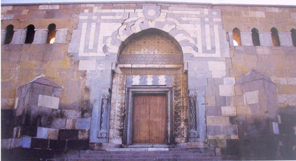
Resim-8 : Konya Alaeddin Cami Kapısındaki İki Renkli Taşlar.