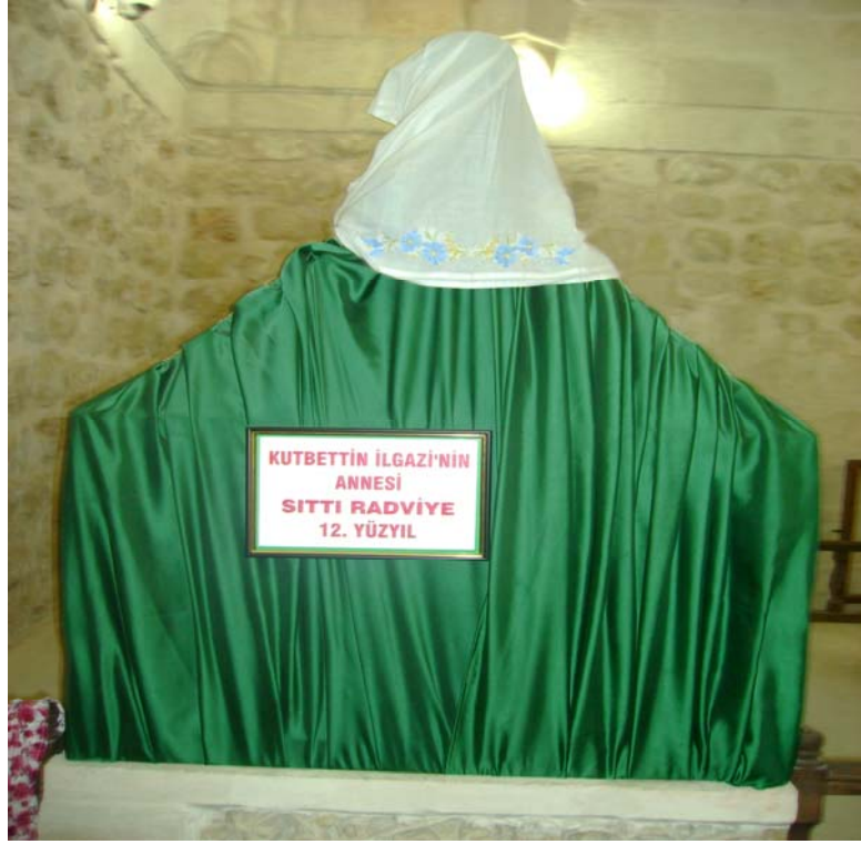
Resim-1: Hatuniyye Medresesinde Bulunan Sıttı Radviyye Hatun