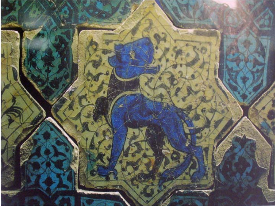
Resim-5: Konya Kubadabad Sarayı Çinilerinde 8 Kollu Yıldız