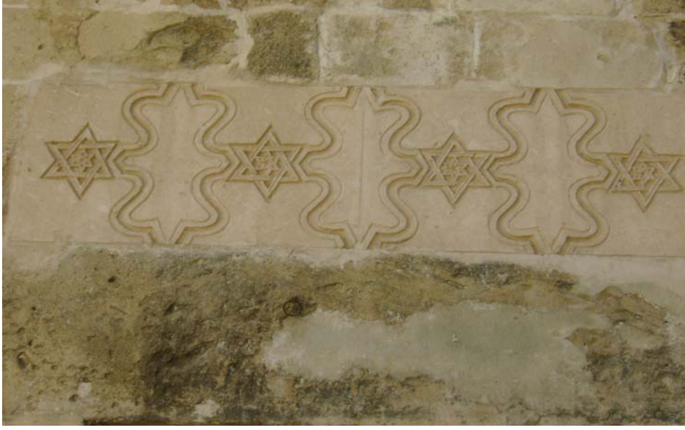
Resim-6 : Mardin Melik Mahmut Camiinde Geçmeli Taş Örneği