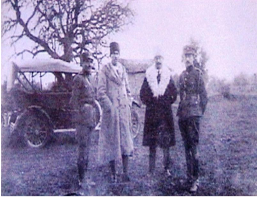
Ek-15 Dereköy 28 Ocak 1921 Çerkez Ethem Yunan Kuvvetleriyle Protokol İmzaladıktan Sonra