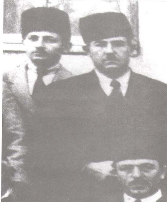
Ek-17 İzmirli Küçük Ethem