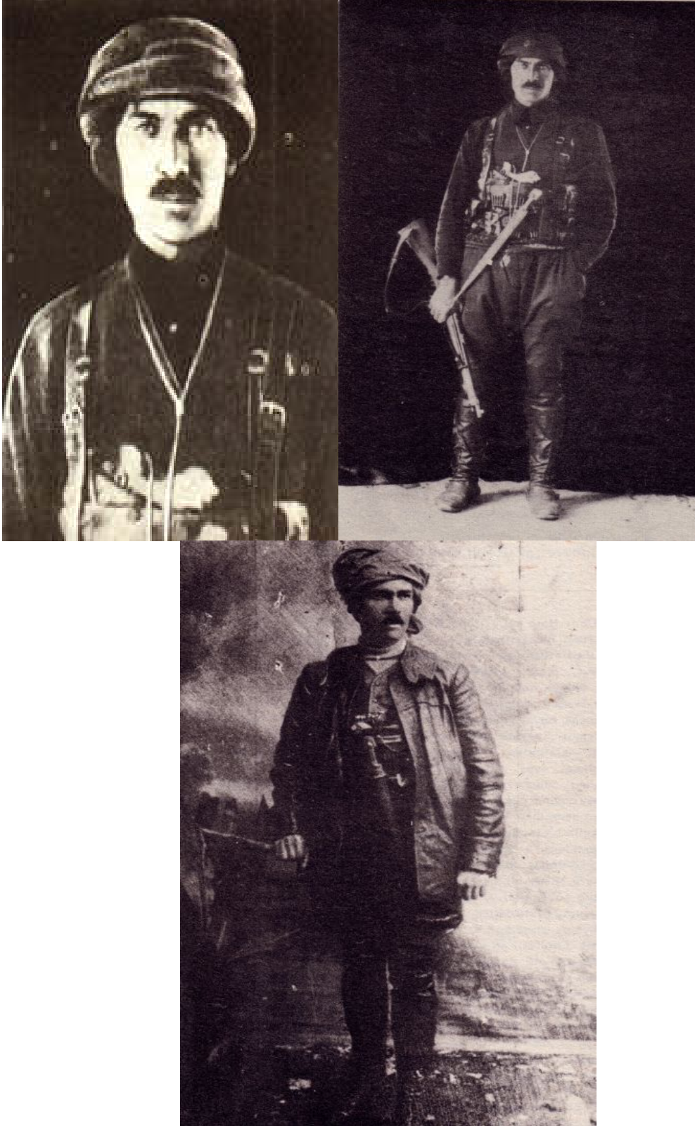
Ek-11 Çerkez Ethem