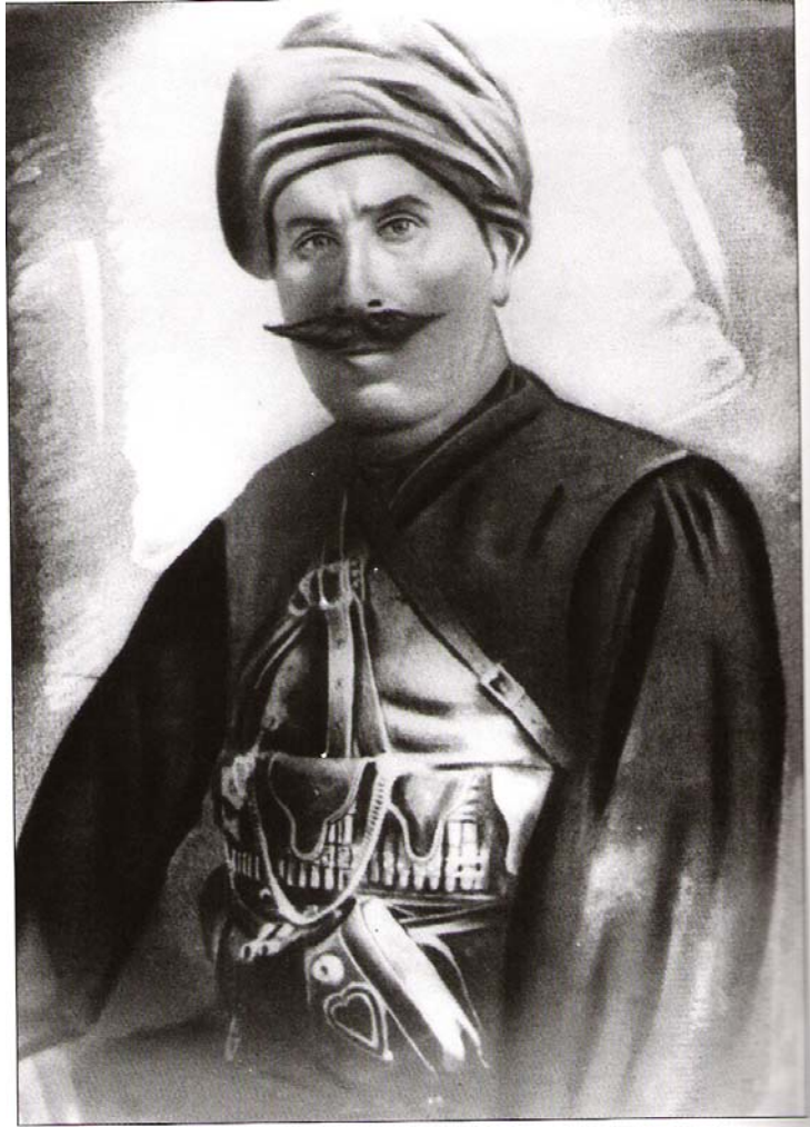
Ek-18 Parti Pehlivan