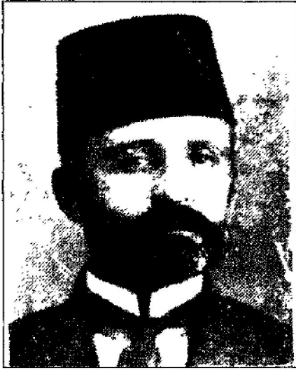
MEHMET HAŞİM BEY (APAYDIN)