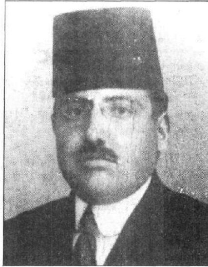
MEHMET FUAT BEY