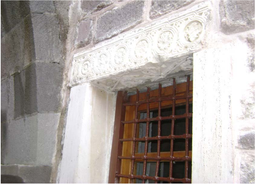
Fot. 11: Seyyid Harun Veli Camii duvarlarında Vervelit harabelerine ait parçalar