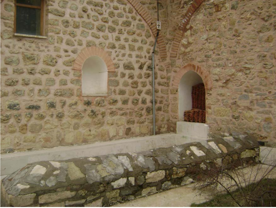
Fot.12: Cemile Hatun Dârü'l-Hadisi'nin yıkılan bölümlerinden bir kesit (Muallimhane Camii)