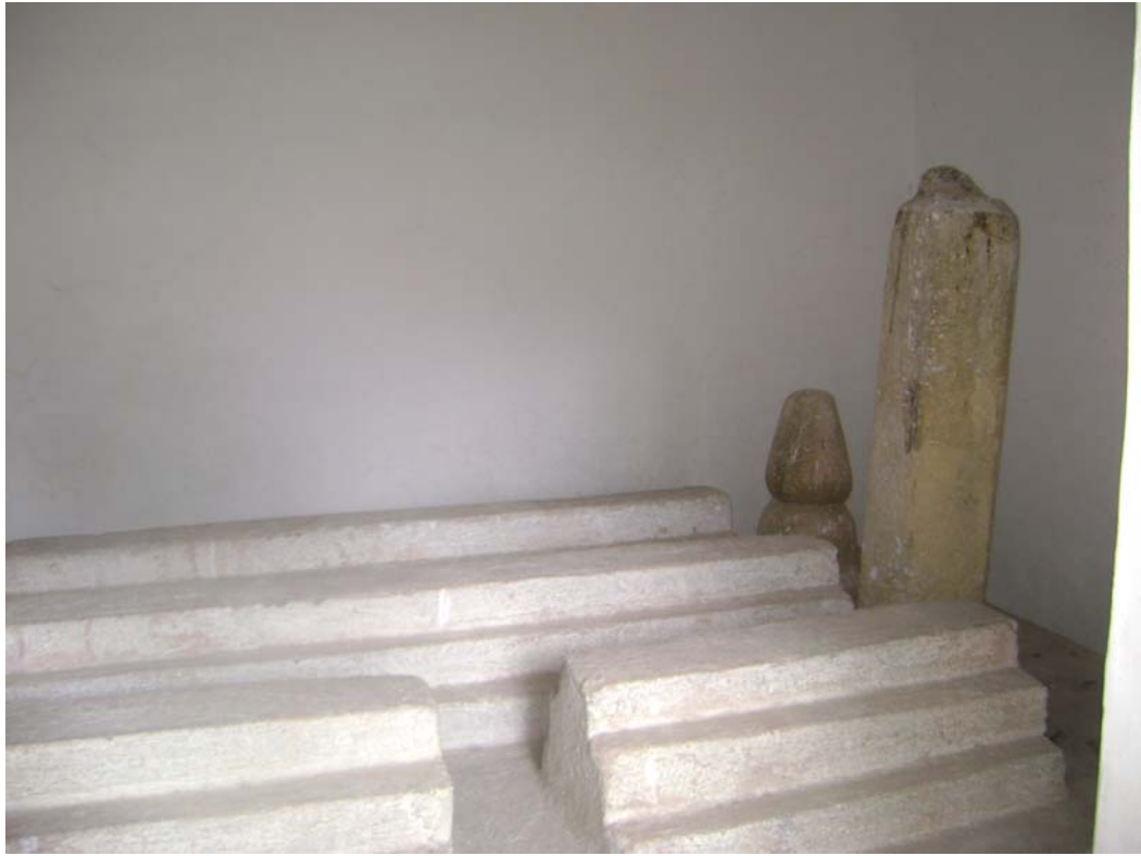
Fot.8: Hoca Recep Türbesi