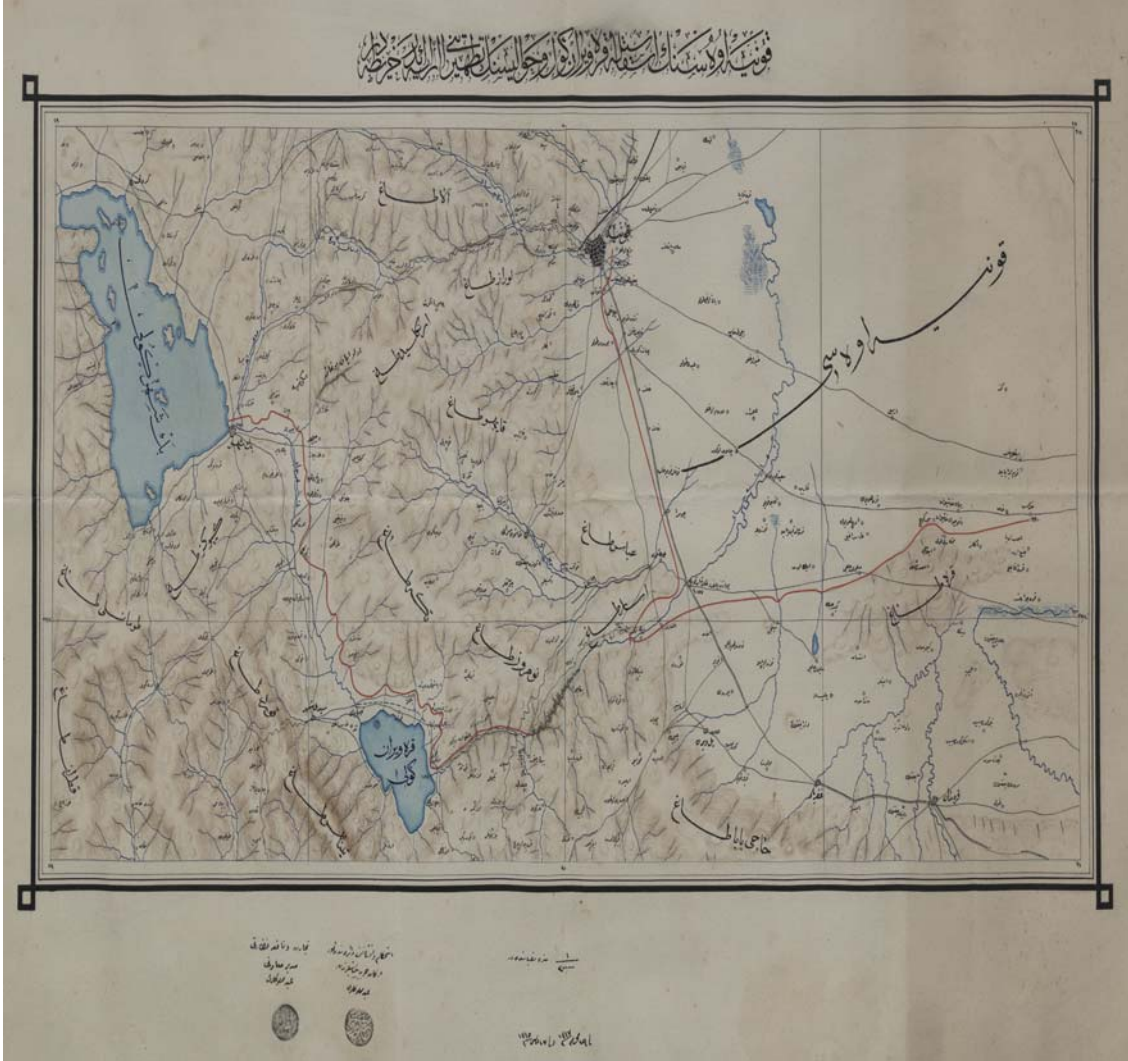
Şekil: 1 Beyşehir sancağı 830