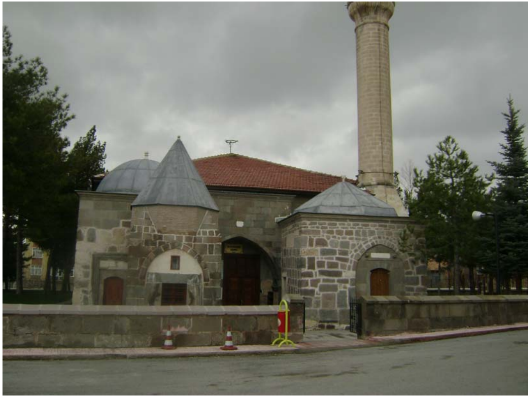
Fot.10: Seyyid Harun Veli Camii