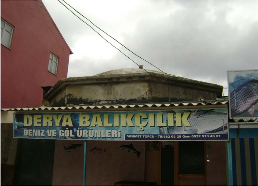
Fot.6: Hacı Nasuh Hamamı