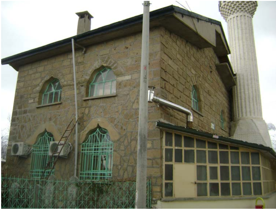
Fot. 2: Değirmenci Mahallesi Camii