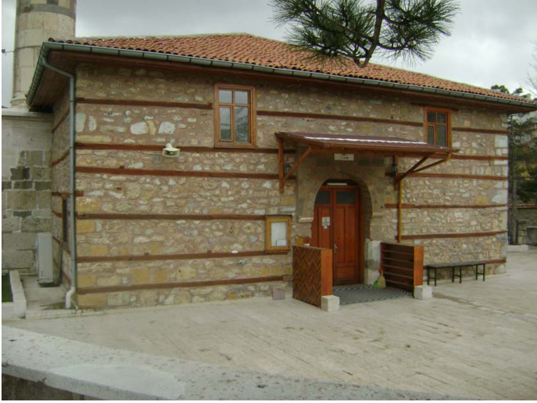
Fot7: Muallimhane Camii