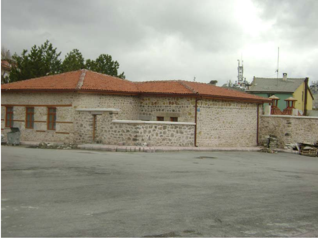
Fot.9: Seyyid Harun Hamamı