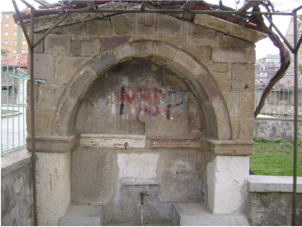
Fot.4: Yeni Cami Çeşmesi