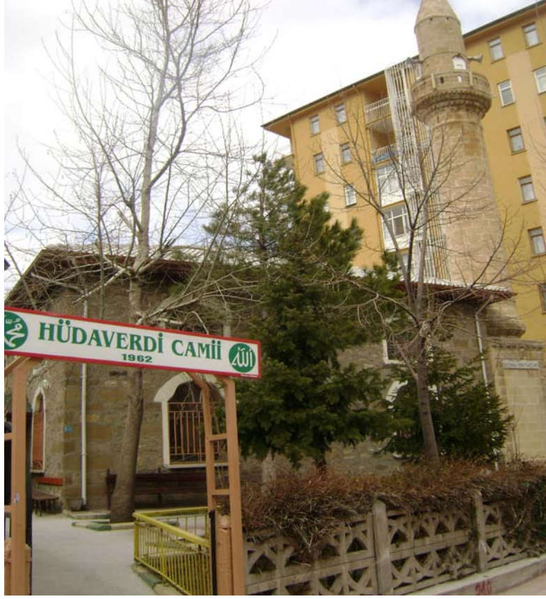
Fot5: Hüda verdi Camii