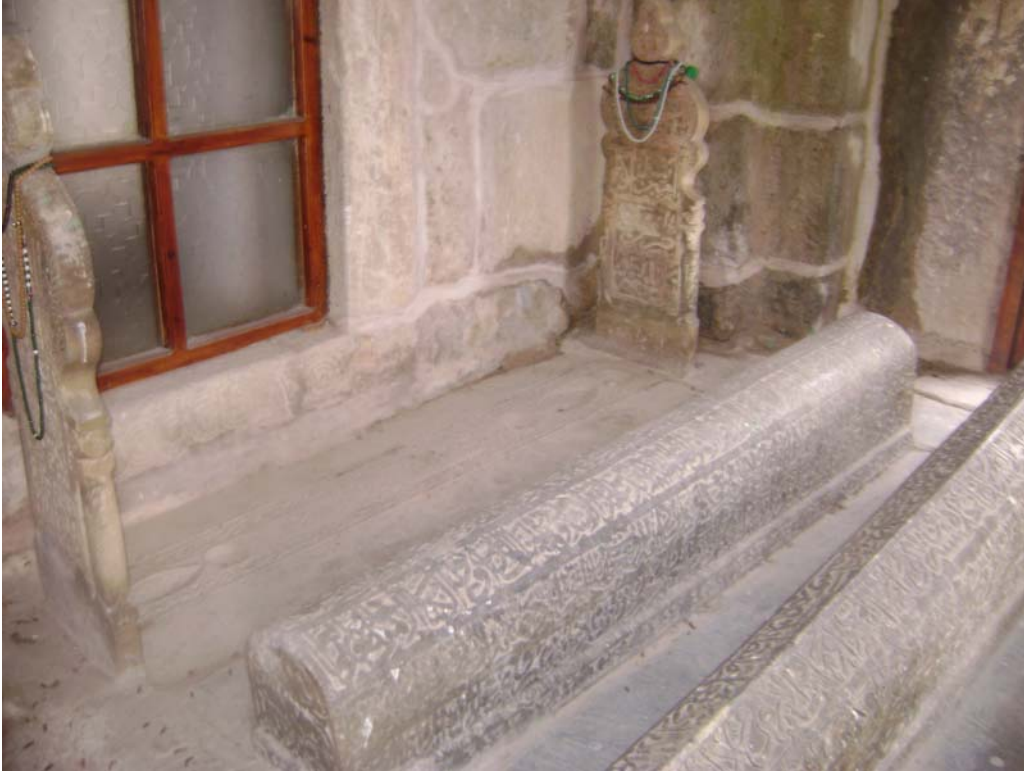
Fot.3: Rüstem Bey Türbesi