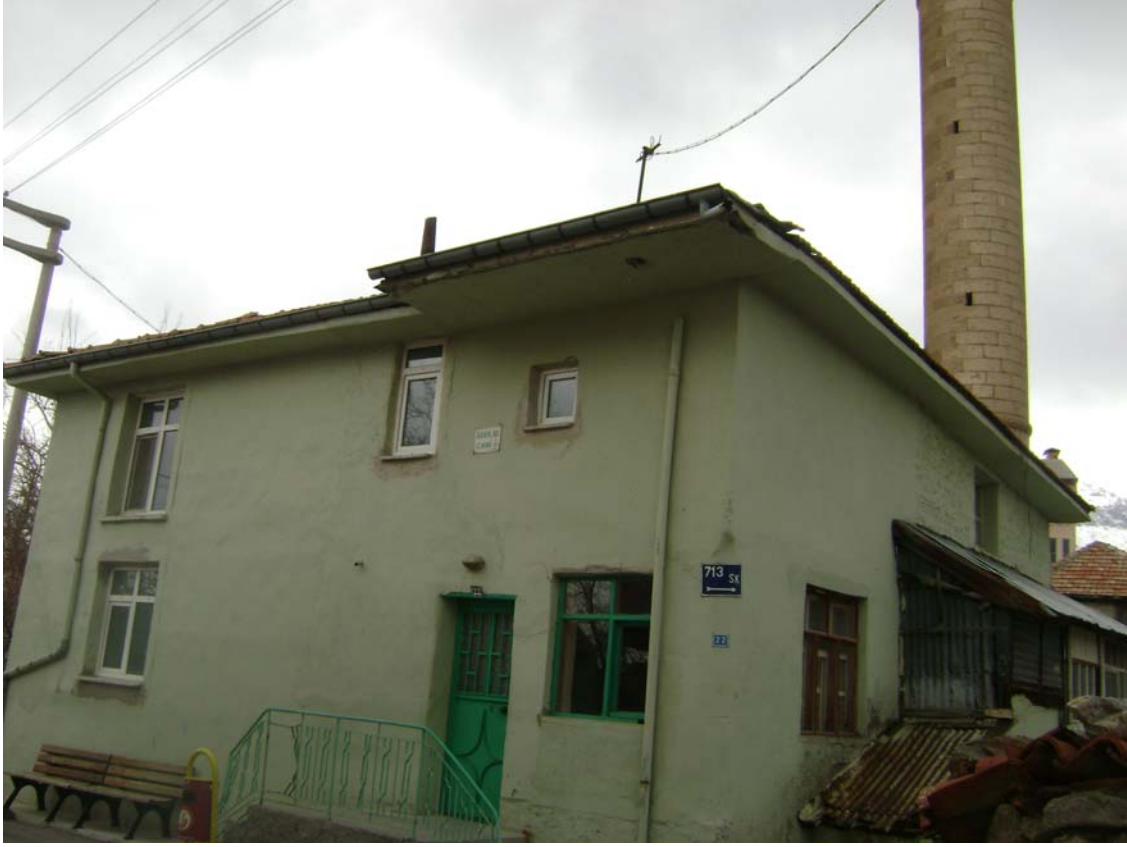
Fot.1: Arpacı Mescidi