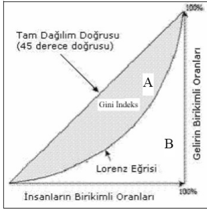
Şekil 2: Gini İndeksi- Lorenz Eğrisi

alanına oranıdır. Yani A/B dir. Gini katsayısı; 0 ila 1 arasında değer almaktadır. Bir ülkedeki gelir dağılımı adaletsizliği ne kadar fazlaysa Gini katsayısı o kadar büyük olmaktadır. 26