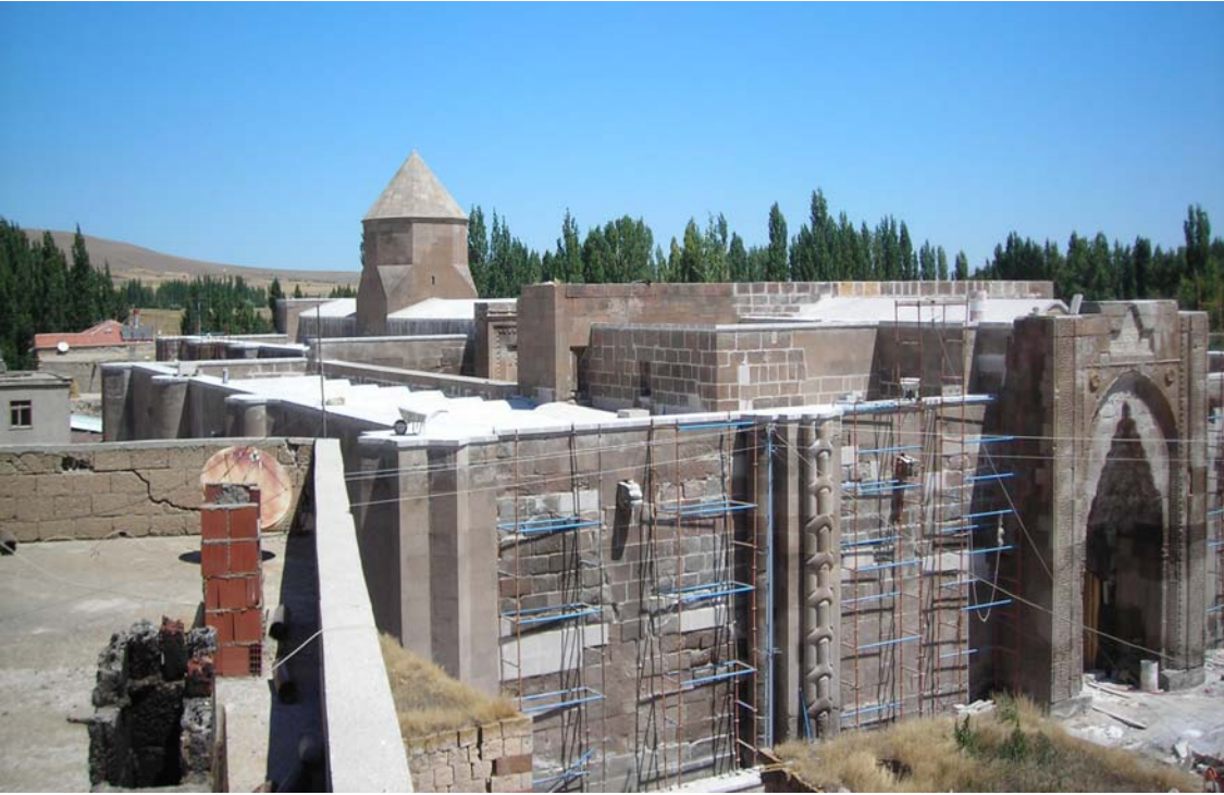
Resim 2: Karatay Hanı