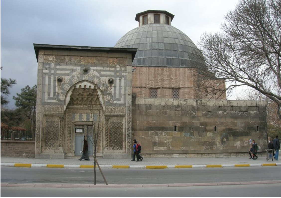
Resim 5: Karatay Medresesi