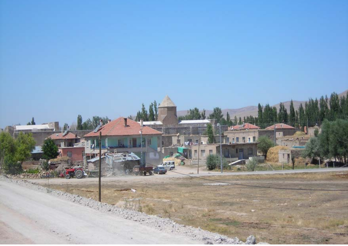
Resim 1: Karadayi Köyü ve Karatay Hanı