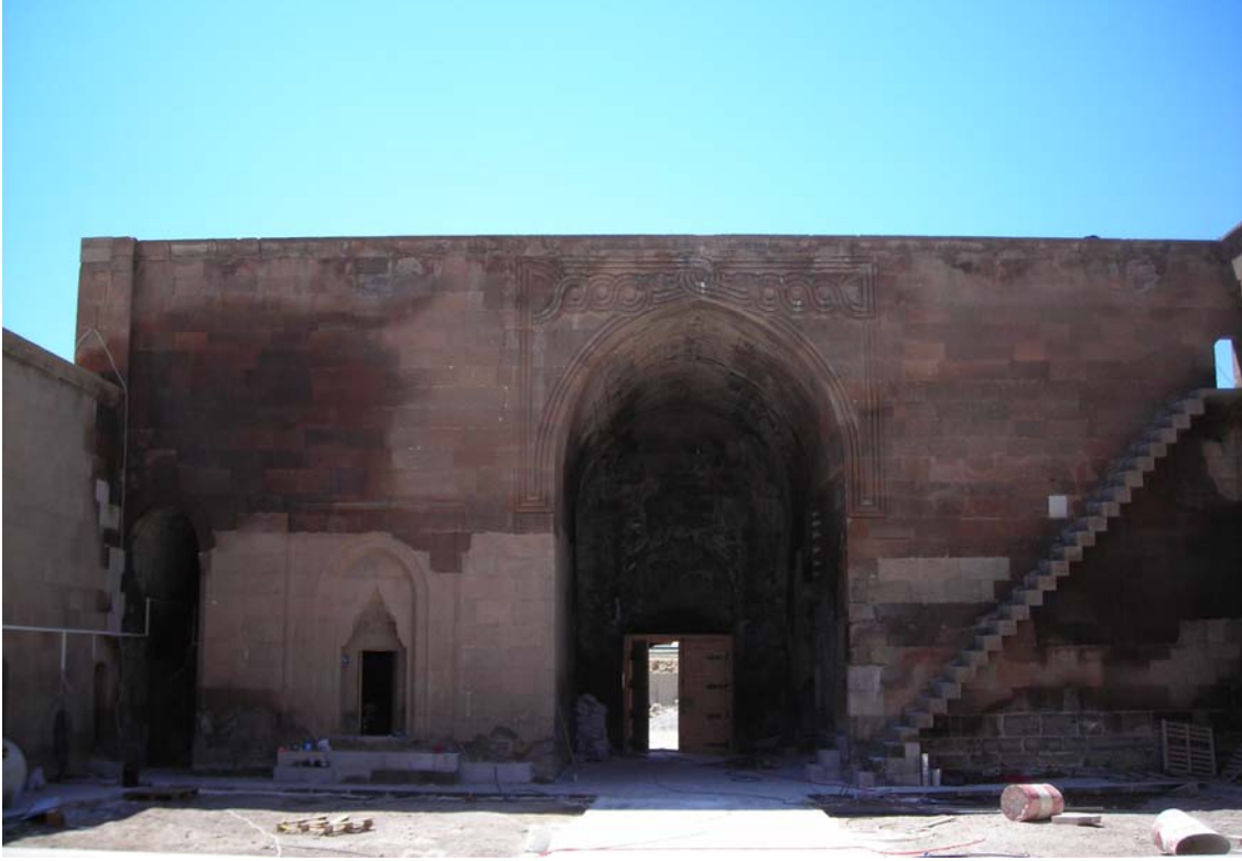
Resim 3: Karatay Hanı