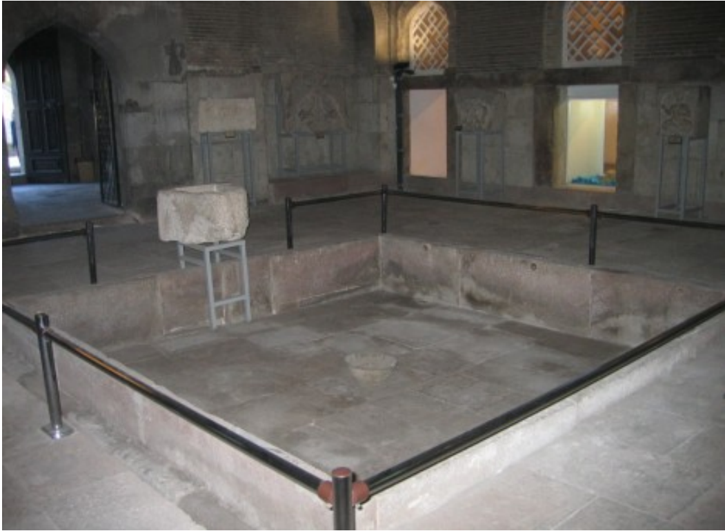
Resim 6: Karatay Medresesi'nin avlusundaki havuz