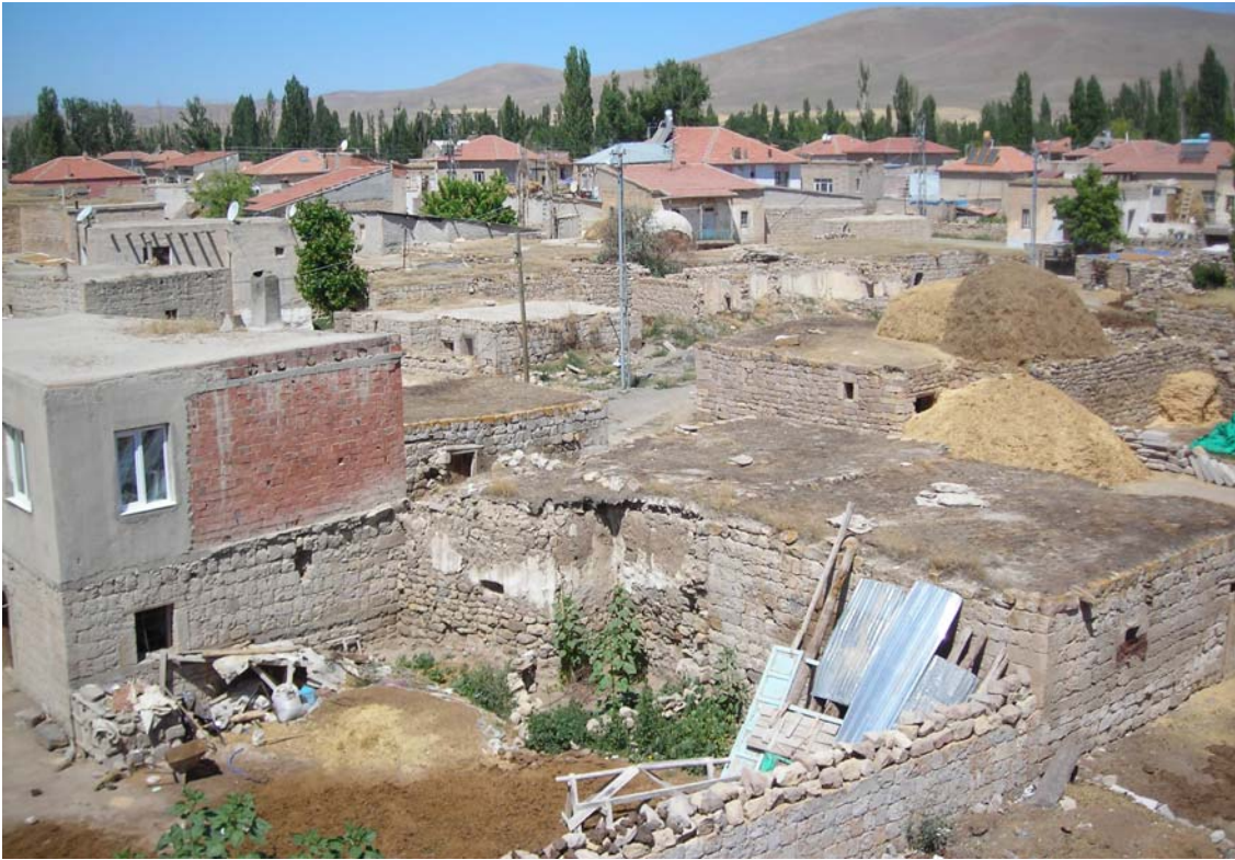
Resim 4: Karadayı Köyü