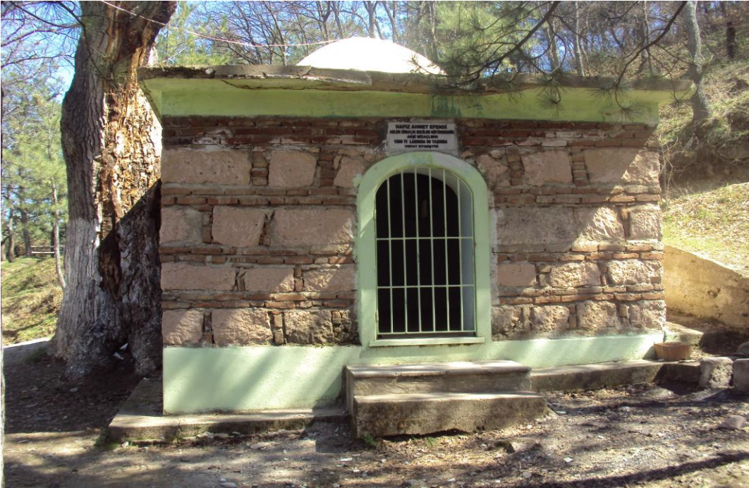
Resim 14: Hacı Ahmet Efendi Türbesi