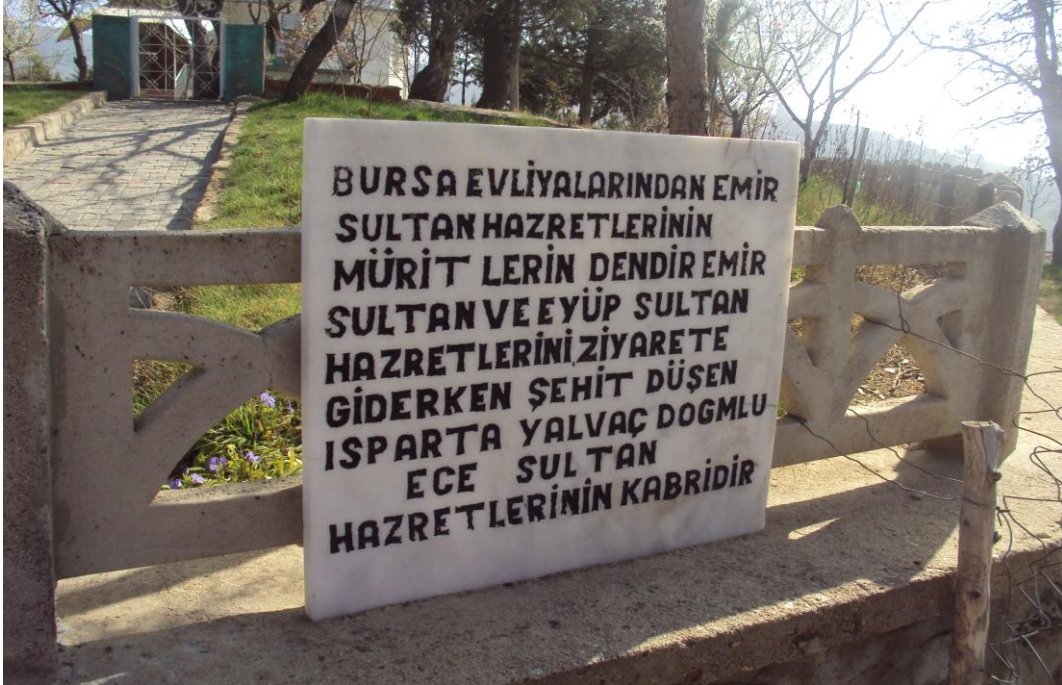
Resim 2: Ece Sultan Türbesi