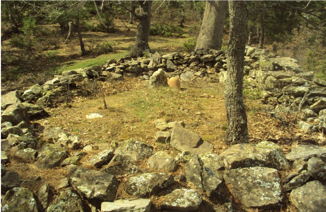
Resim 22: Küçükdede-Yenidede