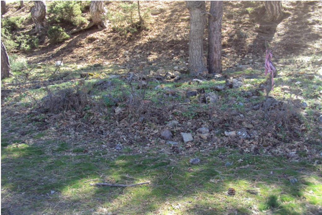
Resim 8: Küçük Yeren Dedesi