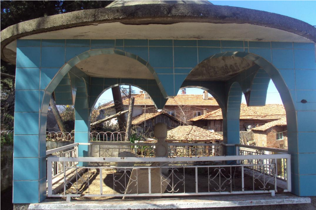
Resim 12: Doğan Bey Türbesi