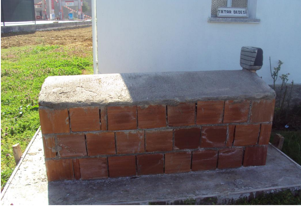
Resim 7: Tatar Dedesi