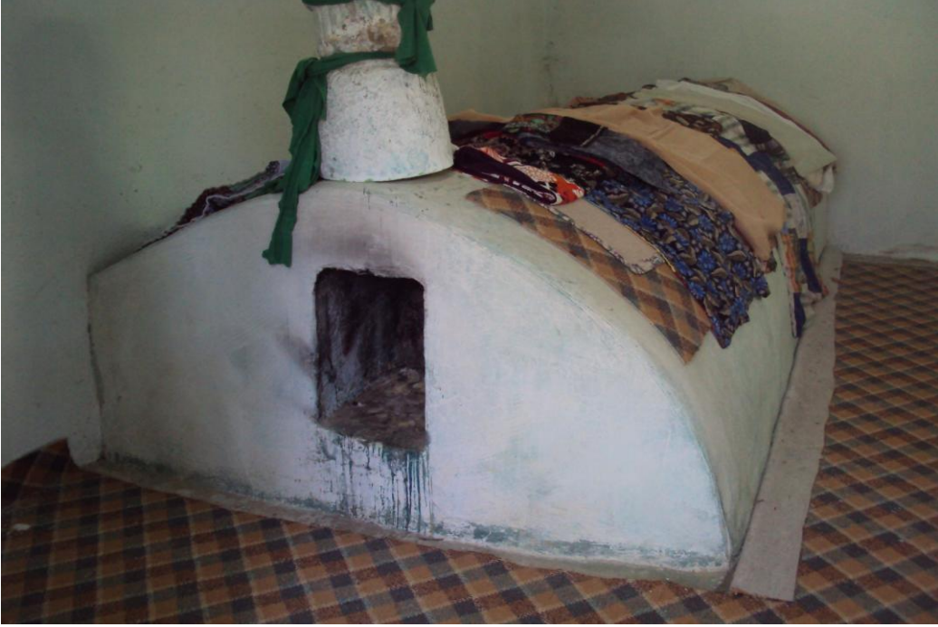
Resim 15: Hacı Ahmet Efendi Türbesi'nin İçeriden Görünümü