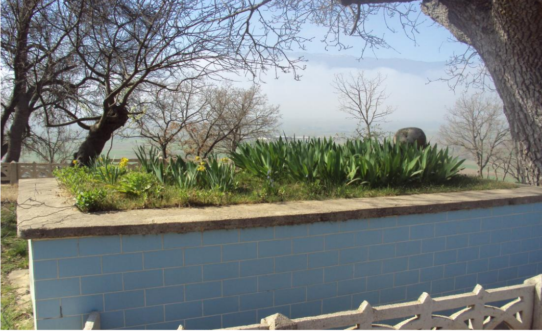
Resim 1: Çitgöllü Hacı Mehmed Efendi'nin Mezarı