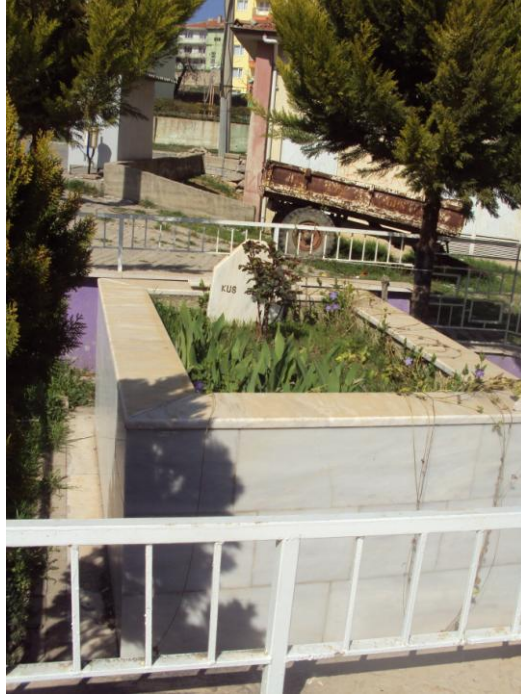
Resim 6: Kuş Dedesi