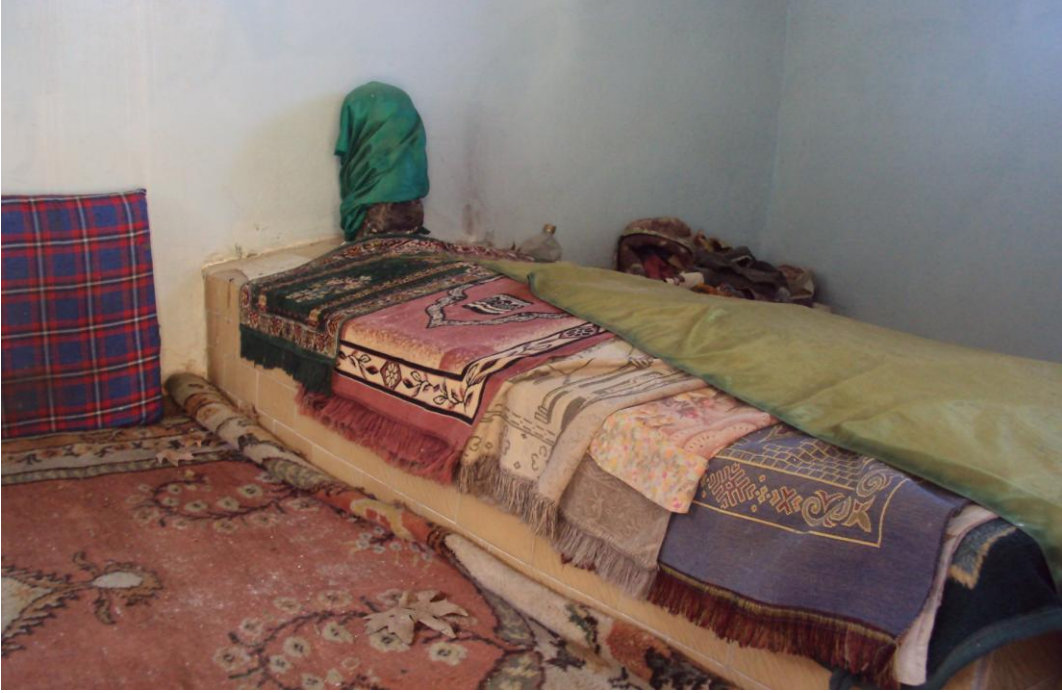
Resim 19: Zekeriya Efendi Türbesi'nin İçeriden Görünümü