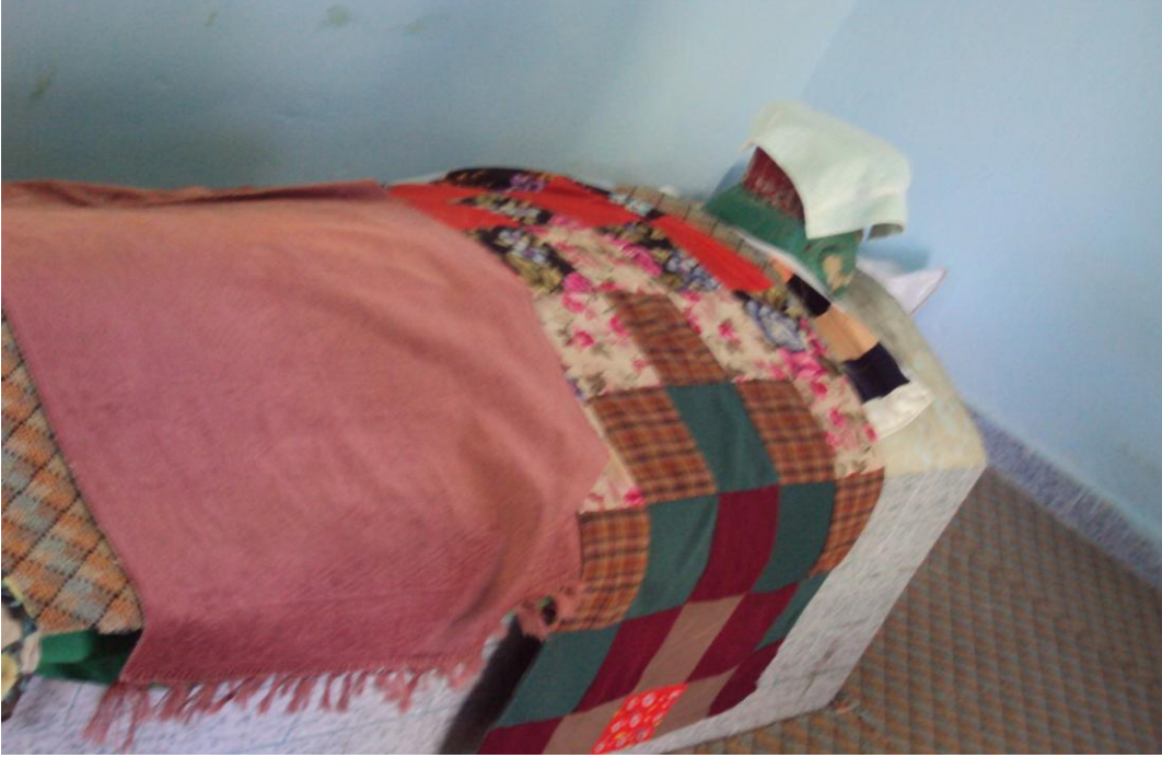
Resim 21: Acembaba Türbesi'nin İçeriden Görünümü