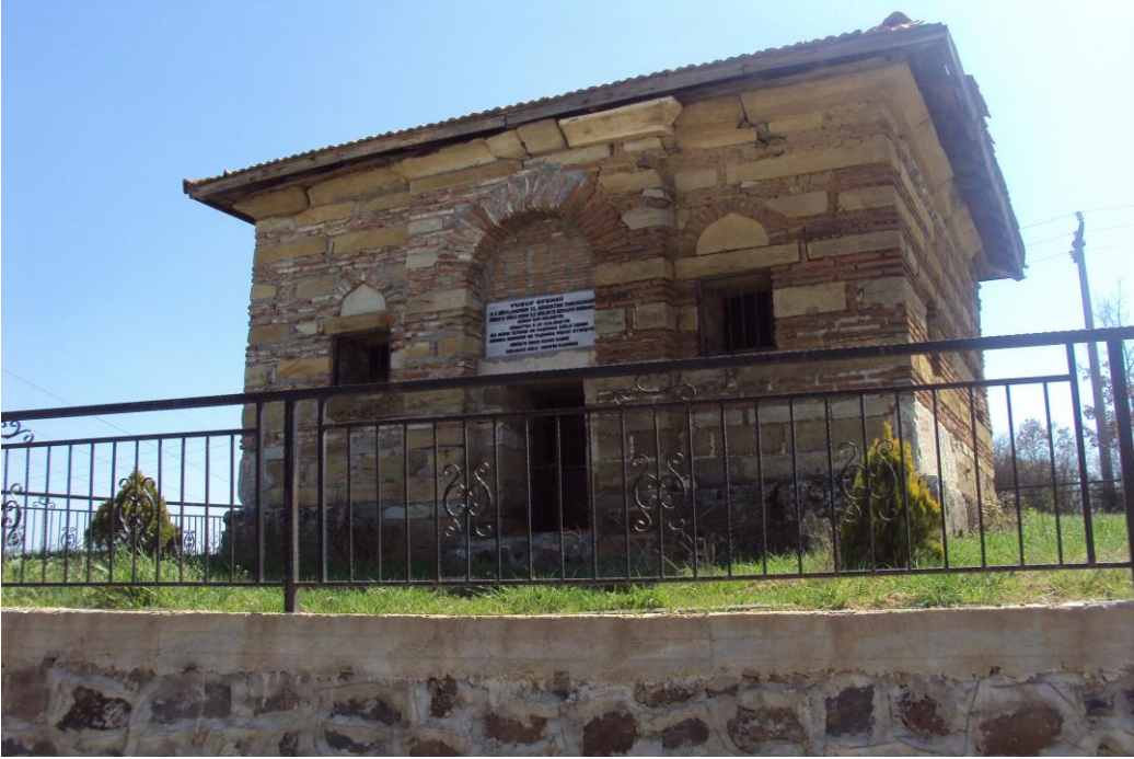
Resim 10: Yusuf Efendi Türbesi