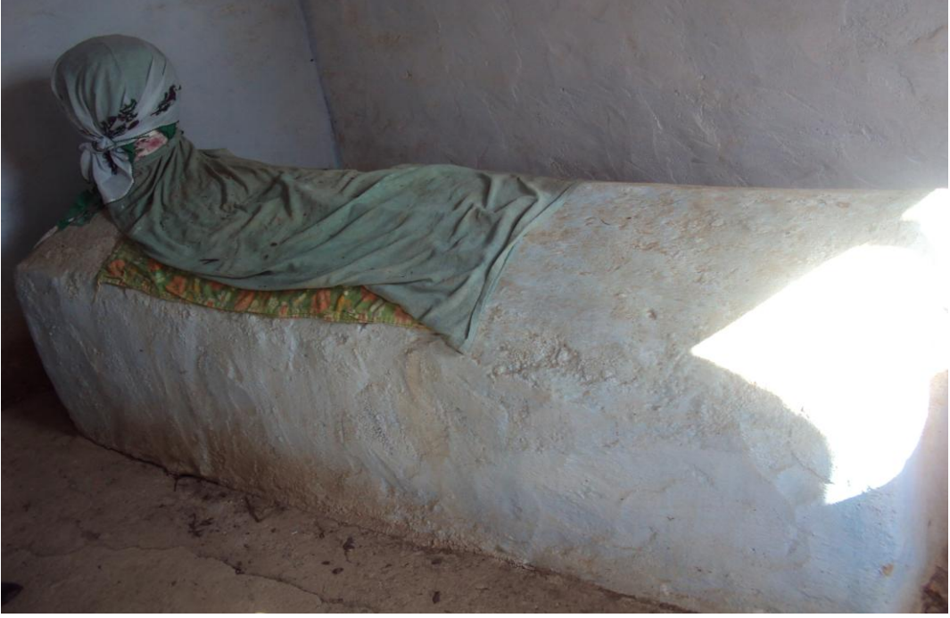
Resim 5: Bedrettin Türbesi'nin İçeriden Görünümü