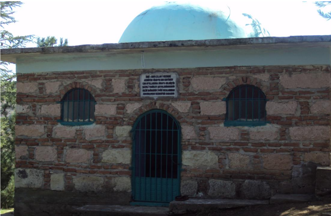
Resim 20: Acembaba Türbesi