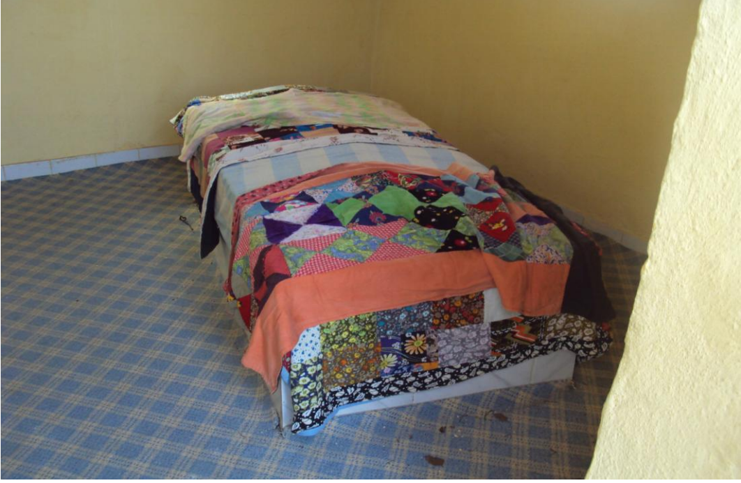
Resim 17: Sabire Sultan Türbesi'nin İçeriden Görünümü