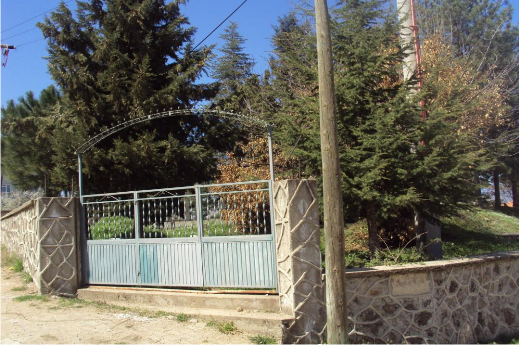
Resim 13: Mezarlıkta Bulunan Karaca Ahmet Türbesi Yeri