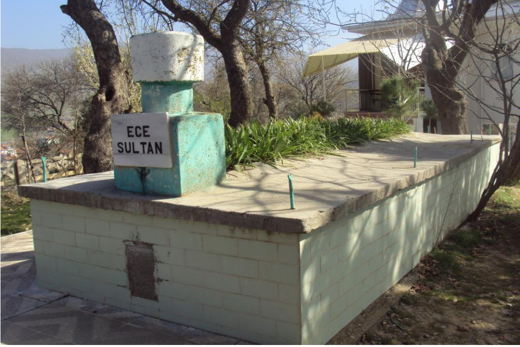
Resim 3: Ece Sultan Türbesi'nin Bir Başka Görüntüsü