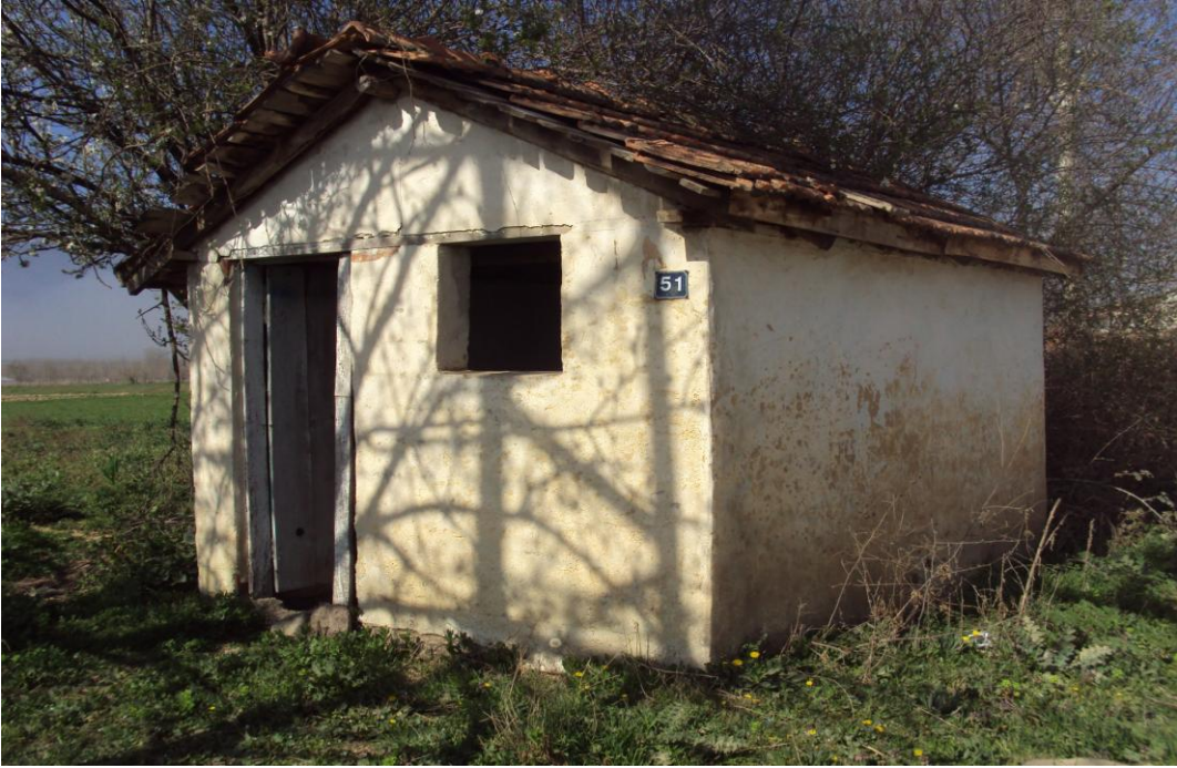
Resim 4: Bedrettin Türbesi'nin Dışarıdan Görünümü