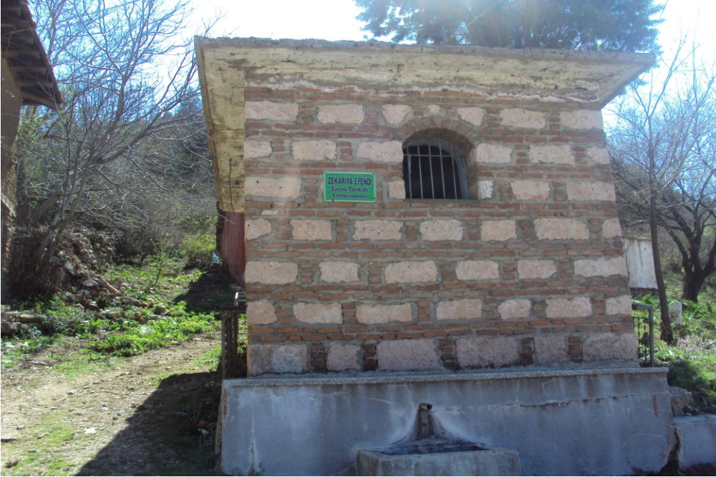
Resim 18: Zekeriya Efendi Türbesi