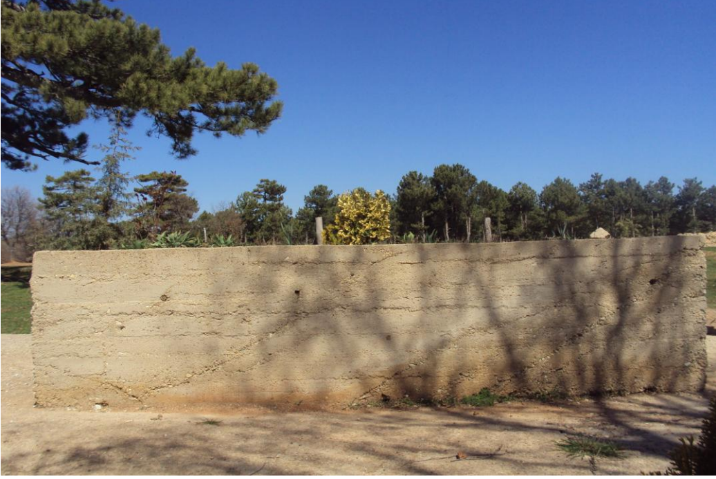
Resim 9: Koca Yeren Dedesi