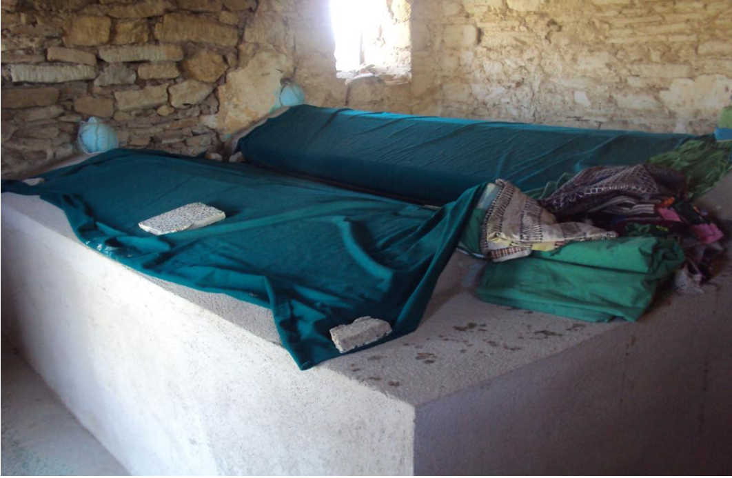
Resim 11: Yusuf Efendi Türbesi'nin İçeriden Görünümü