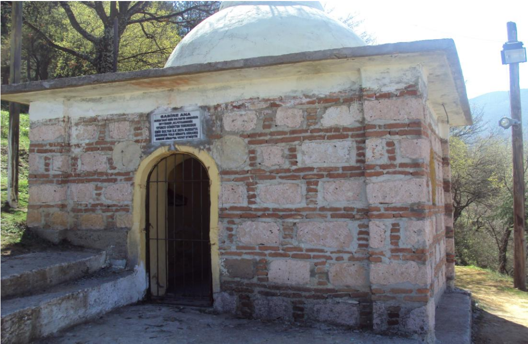
Resim 16: Sabire Sultan Türbesi