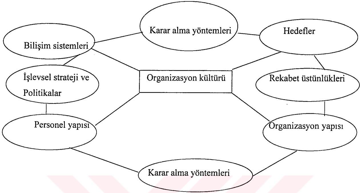
Şekil : 2. Organizasyon kültürünün şekillenmesine etki eden unsurlar

Bir işletmenin organizasyon kültürünün şekillenmesine etki eden unsurlar şekil 2’de gösterilmektedir.