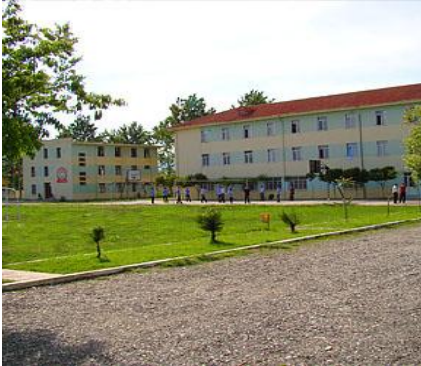
Elbasan, Cerrik Liria erkek medresesi