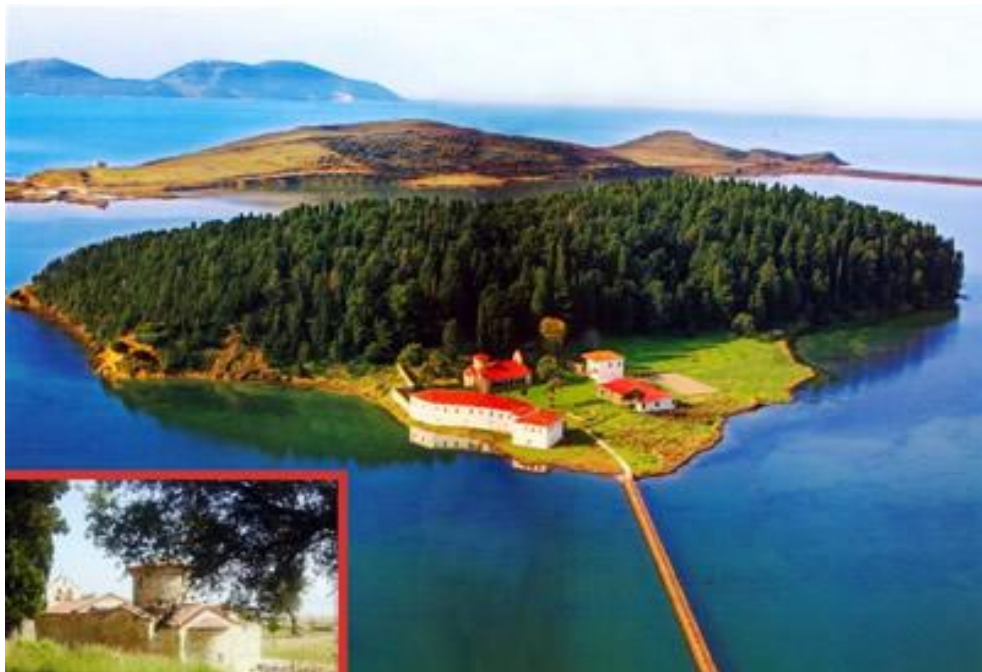
Zvernec “Fjetja e Hyjlindëses Mari” Manastırı