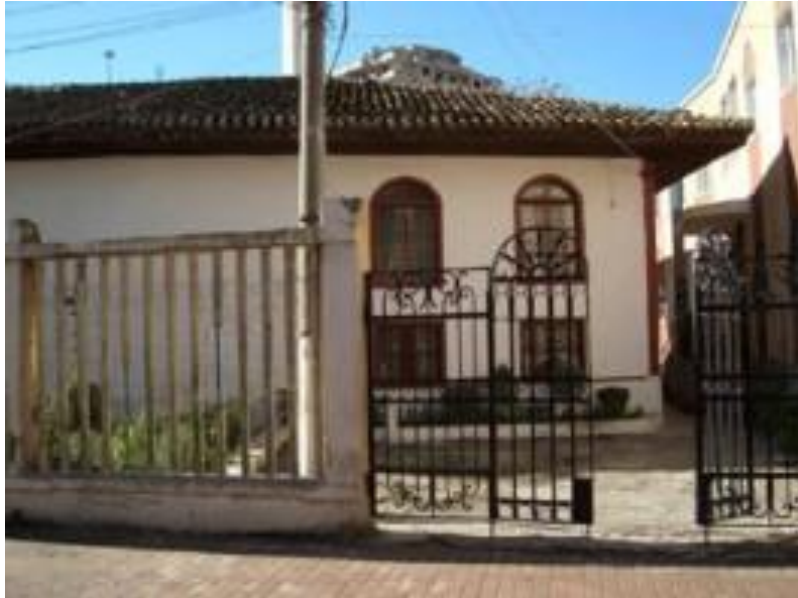
Durres, Mustafa Varoshi (yan bina) Kız medresesi.