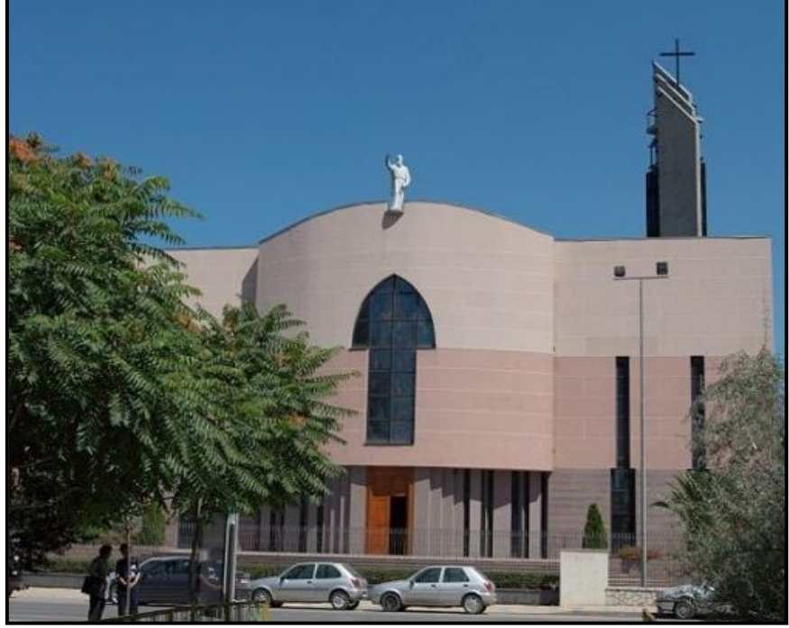
Tirana'da St. Paul Kilisesi