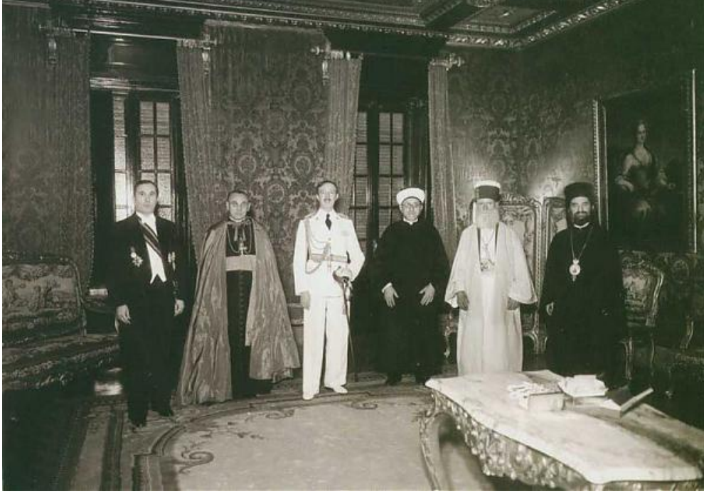
Ahmet Zogu (1928-1939 Arnavutluk'un kralı) 1936 yılında dinî liderlerle birlikte