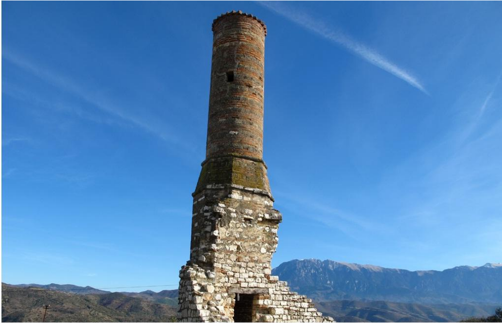
Berat'ta Kirmızı Minareli Camiisi