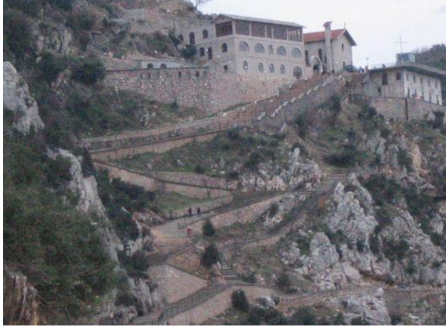
Lezha şehri ve dağında Shen Ndou kilisesi