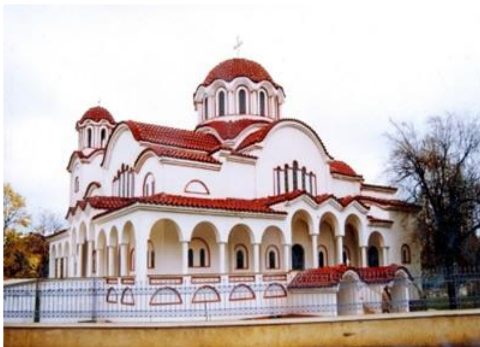
Pogradec'de “Ngjallja e Krishtit” & Qendra shpirtërore e saj” Katedralesi