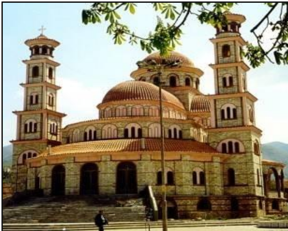
Korça'da "Ngjallja e Krishtit" & Qendra shpirtërore e saj" Katedralesi