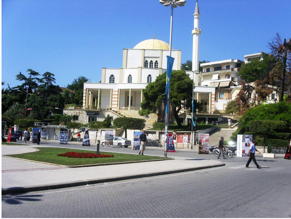
Durrës'te İliria bulvarından Xhamia e Madhe