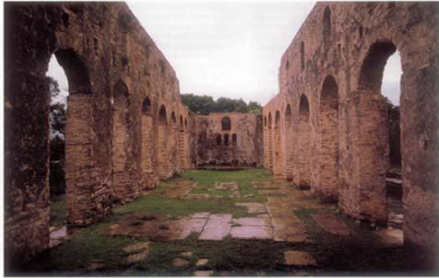
Butrinti'de Paleokristiane Kilisesi