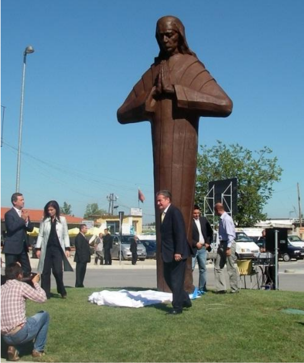
Rahibe Teresa'nın Arnavutluk Uluslararası Havaalanının önünde Başbakan Sali Berişa tarafından açılışını gösteren resim.