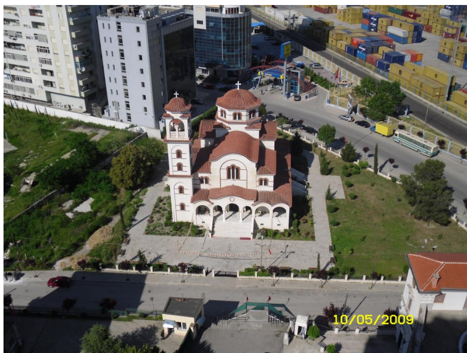
Durrës'te “Apostull Pavli dhe Shën Asti” & Qendra shpirtërore e saj Katedralesi