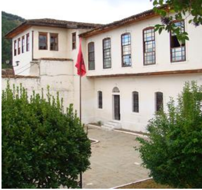
Berat, Veci Buharaya erkek ve kız medresesi