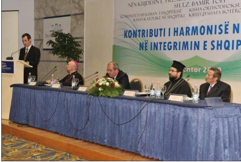
Dinler arası Diyalog'un gerçekleştirdiği konferansların birinde görüntüler.

büyük bir örneklik taşıyor. Bu faktör, Arnavut toplumunun ve devletinin ilerlemesi ve gelişmesinde büyük bir önem taşıyor. 501