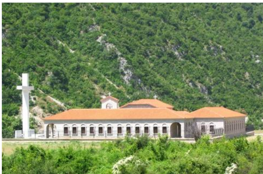
Kelcyre'de “Shën Nikolla” Manastiri