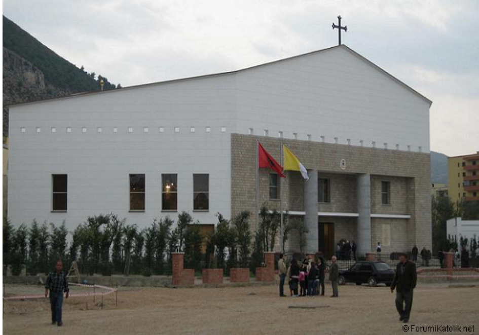
Lezha'da Shen Nikolla Katedralyası