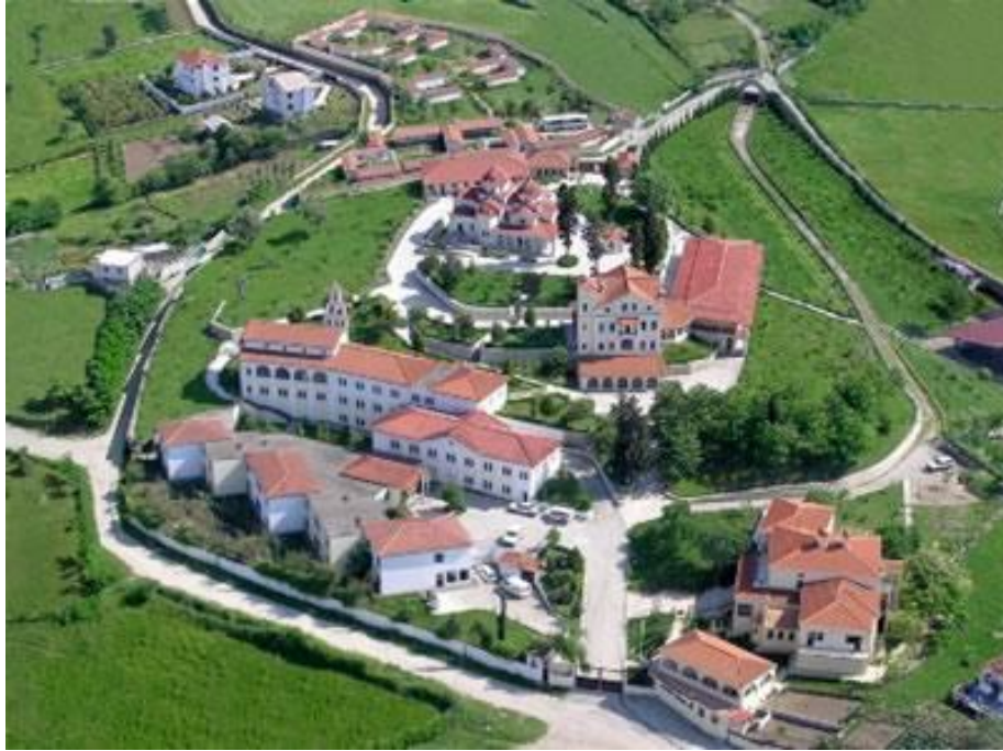
Durrës'te "Shën Vlash" Manastırın Kompleksi (Manastırı ve Kilisesi).