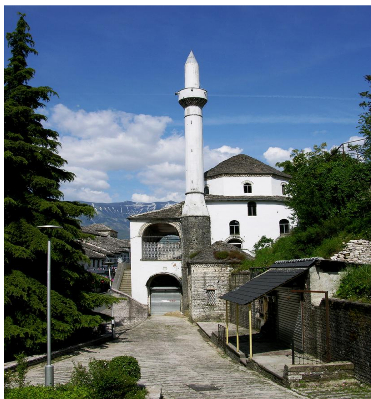
Gjirokastra'da Pazar Camiisi