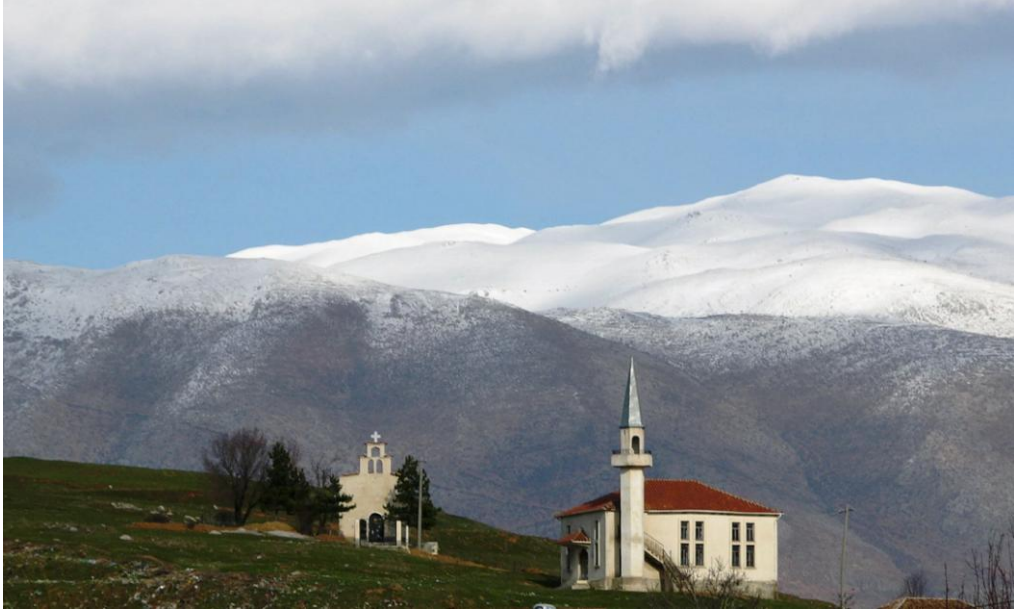
Korça - Maliq'te Cami ile Kilise yan yana