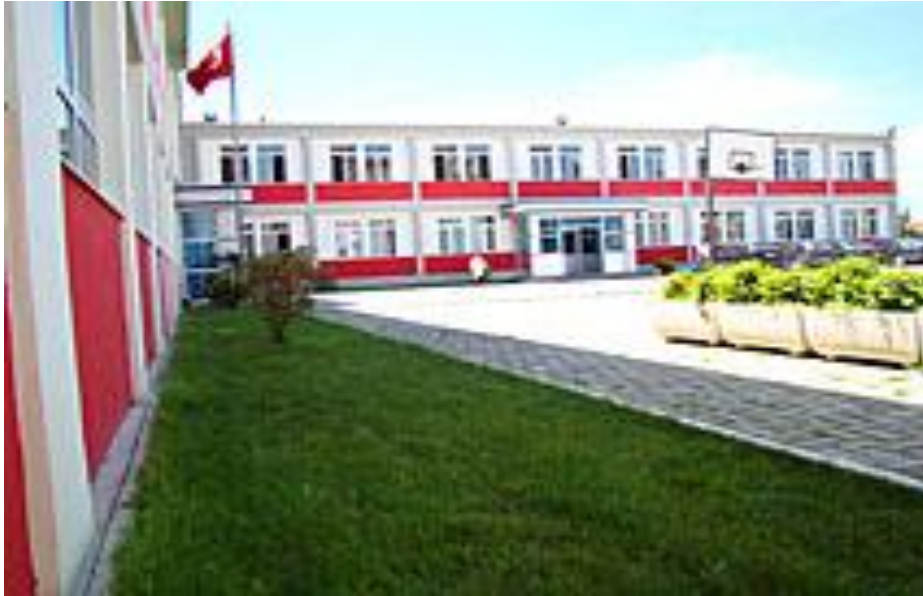
Hafız Ali Korça Kavaya Erkek-Kız Medresesi