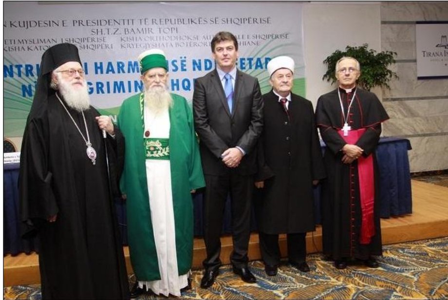
Arnavutluk'ta İslâm, Ortodoks ve Katolik Hıristiyanlar, Bektaşî liderini ve Arnavut Cumhurbaşkanı Dinlerarası Diyalog Konferansların birinden görüntü.