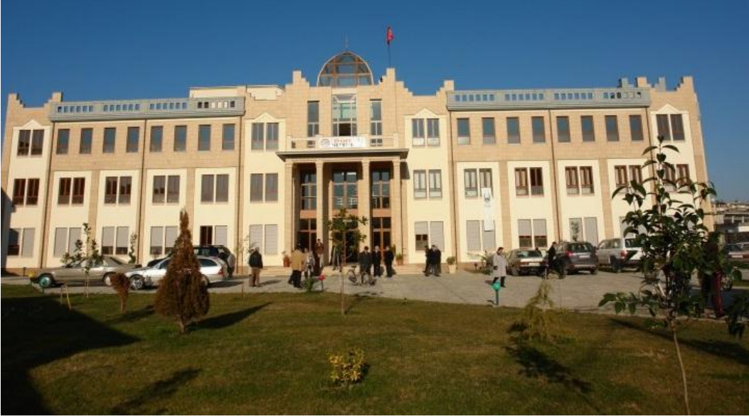
Şkdra Sheh Shamia Erkek Medresesi Kompleksi (camisi, yurdu vs yanlarında bulunuyor. Arnavutluk'un en büyük ve modern medresesi).