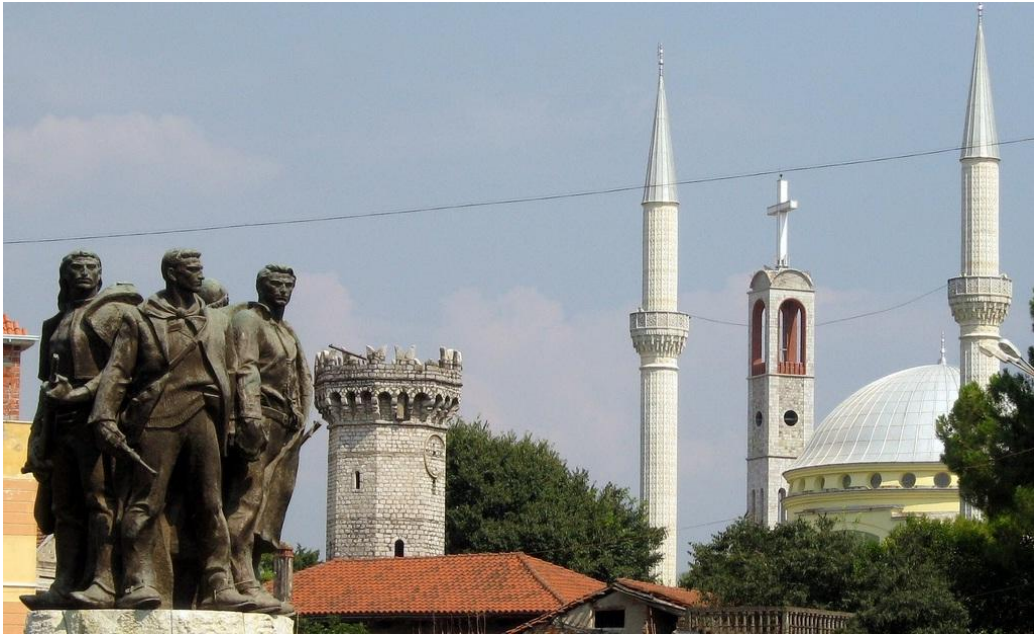
İşkodra'da Cami ile Kilise yan yana