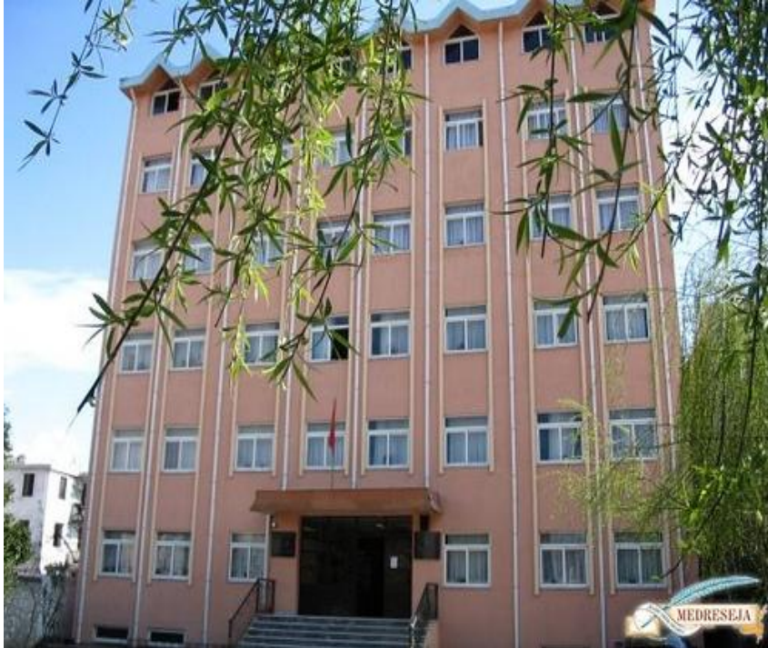
Şkdra Sheh Shamia Kız Medrese Kompleksi (yurdu, mescidi vs. bulunan Arnavutluk'ta en modern kız medresesi).