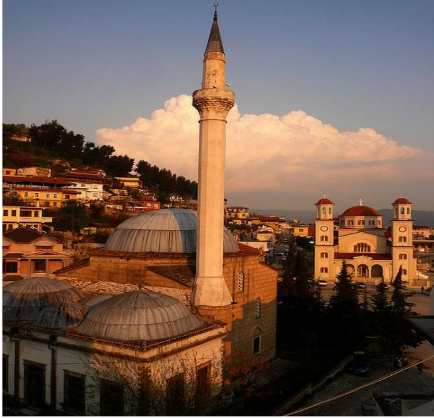
Berat'ta camii ile kilise yan yana