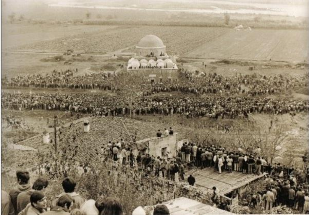
16 Kasım 1990 yılında ilk Cuma kılındığından bir görüntü

Komünizmin 1990 yılında yıkılması ile birlikte İşkodra'da İslamî faaliyetler hızlı bir şekilde başladı. Arnavutluk'un köklü medreselerinden biri olan H. Sheh Shamia Erkek medresesi faaliyetlerine başladı. Daha sonra İşkodra'da Kız Medresesi binası yapıldı ve en az 10 yıldır faaliyetlerini devam ettirmektedir. 281 H. Sheh Shamia erkek ve kız medreselerin binaları birbirinden ayrı ve aralarında epey bir mesafe bulunuyor. Her iki medrese Türkiye'den gelen bir vakıf tarafından sponsor ediliyor ve her ikisi de modern okullardır. Her ikisine Arnavutluk'un medreselerinin en büyükleri diyebiliriz. Her ikisinde 1000 öğrenciden fazla öğrenci vardır.