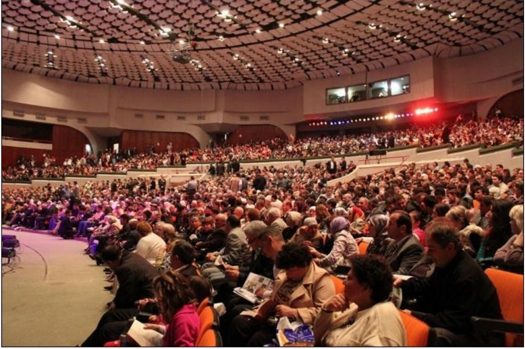
2010 Kutlu Doğum haftasında gerçekleştirilen etkinlikten bir görünüm.

Medreselerin eğitim standartlarını yükselterek, uluslararası Kur'an-ı Kerim yarışmaları düzenleyerek eğitime ayrı bir önem vermiştir. Ayrıca Tiran, İşkodra, Kavaya; Cerrik ve Korça'daki Kompleks medreselere milyonlar € (Euroya) varan yatırımlar yapmıştır. Bunların hepsi AİK'in kendi gelirlerinden ve Türk, Arap v.b hayırsever yardımlaşma vakfı ve derneklerle yapmış olduğu anlaşmalar neticesinde meydana geldi.