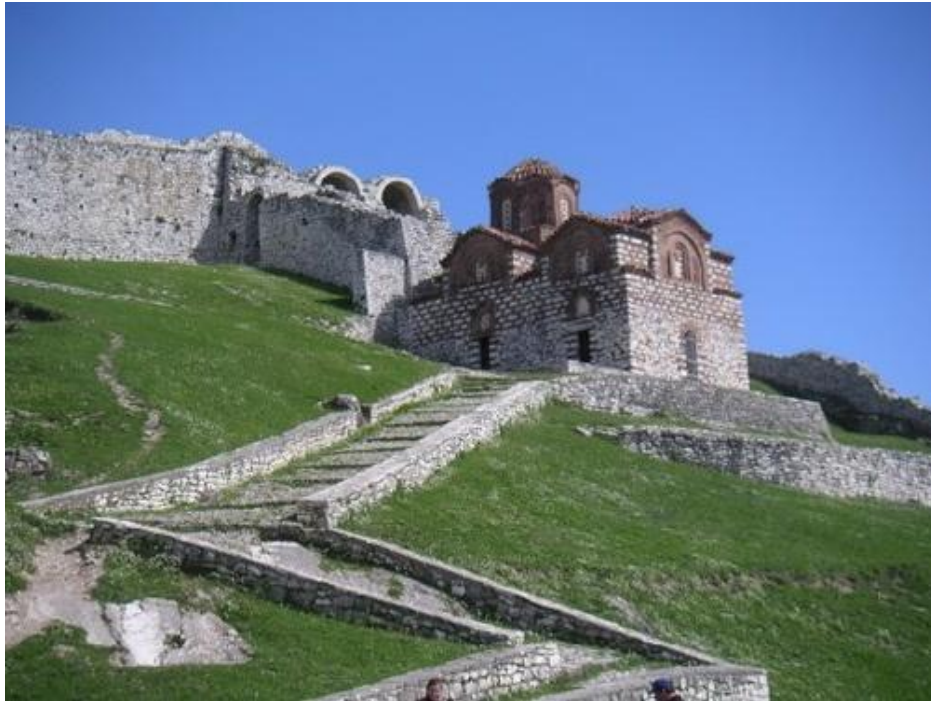
Berat Kalesinde Bizans Kilisesi