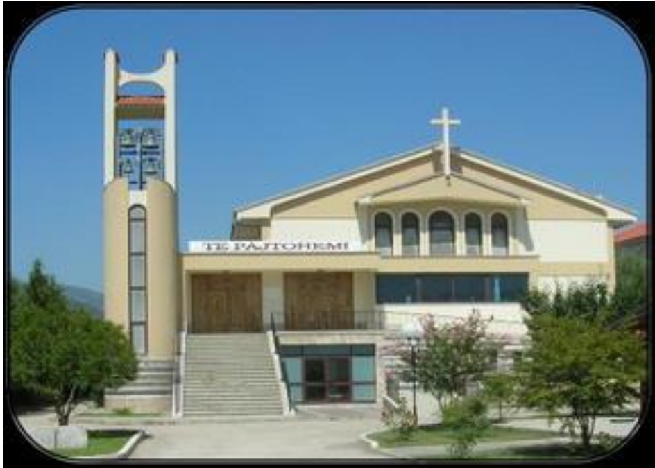
Elbasan'da Shen Piu X Kilisesi