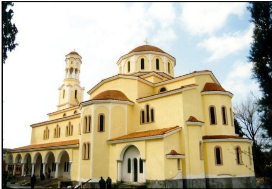
Fieri'de “Shën Gjergji” & Qendra shpirtërore e saj” Katedralesi