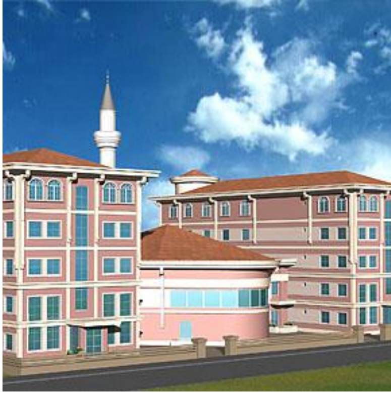
Korça, Abdullah Zemblaku erkek medresesi kompleksi