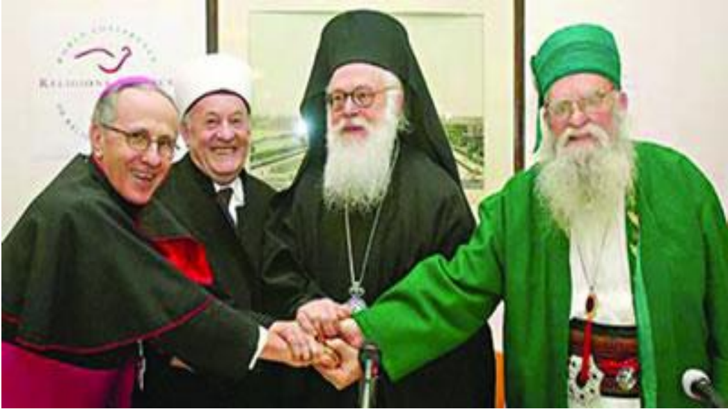
Arnavutluk'ta inançların liderleri bir arada geldiklerini gösteren bir görüntü.