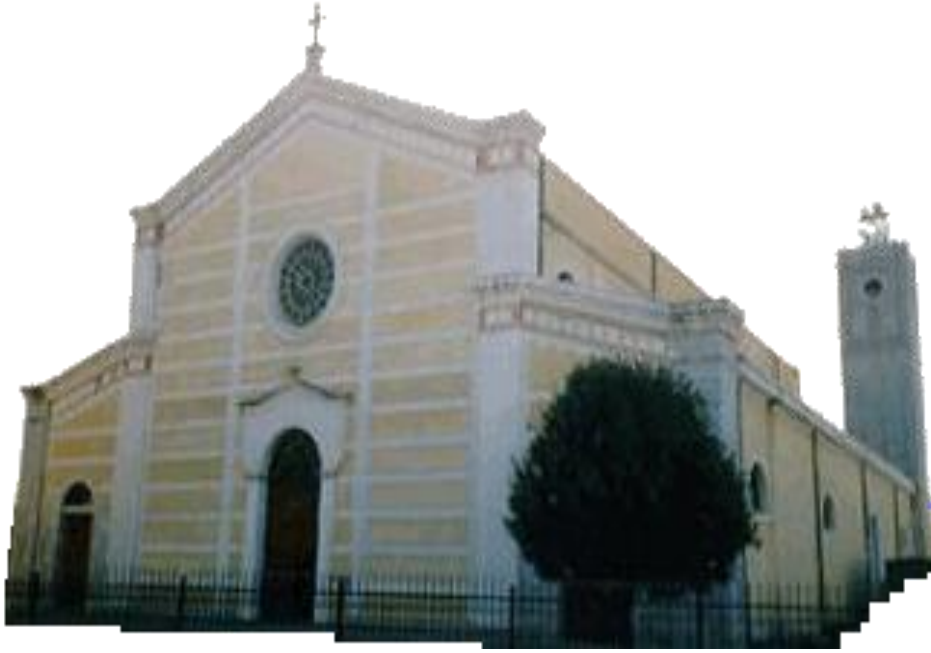
İşkodra'da Büyük Kilise veya Shën Shtyefni Katedralyası