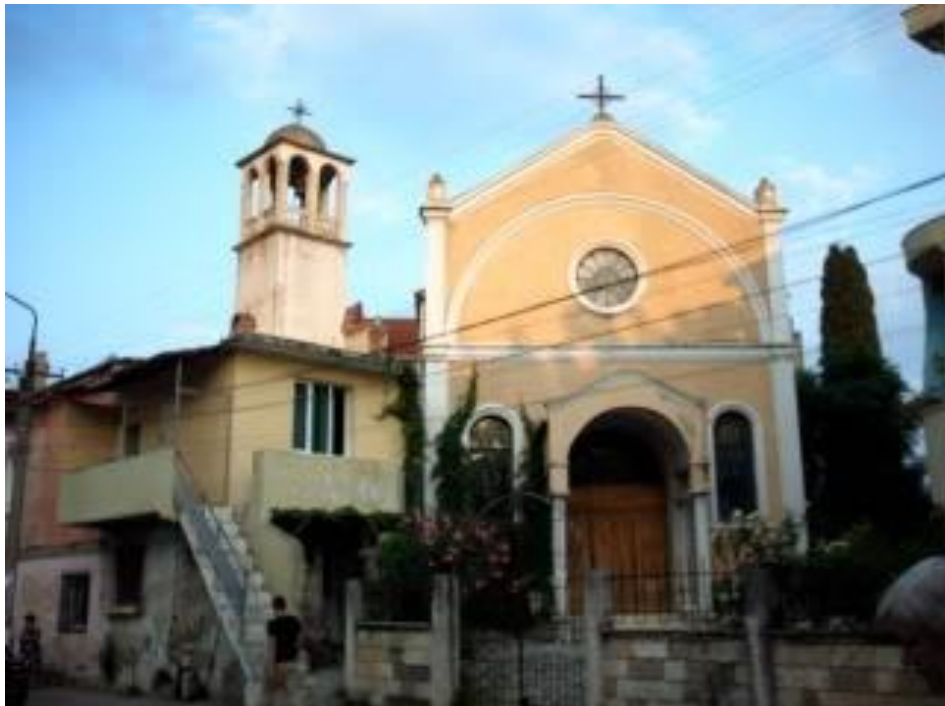
Lezha'da Shen Nikolla Katedralyası