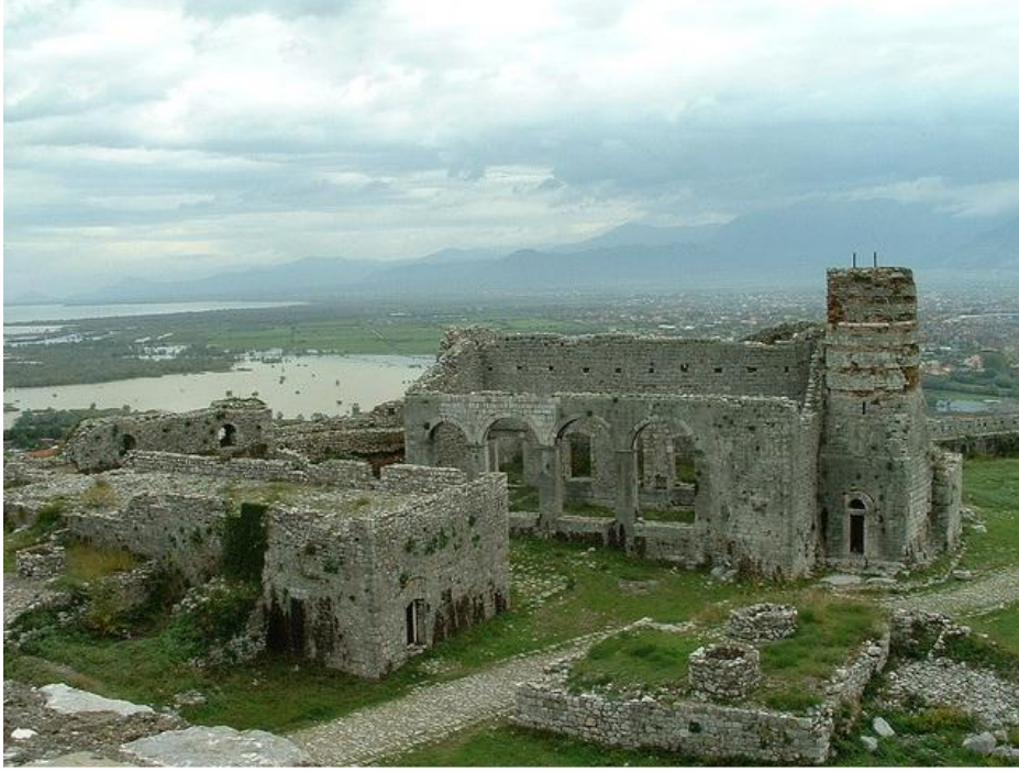
İşkodra'nın Rozafa kalesinde ilk olarak klise olmuş ve 1479 yılında Osmanlılar tarafından Bizans Kilisesinden Camiye dönüştürülmüştür.