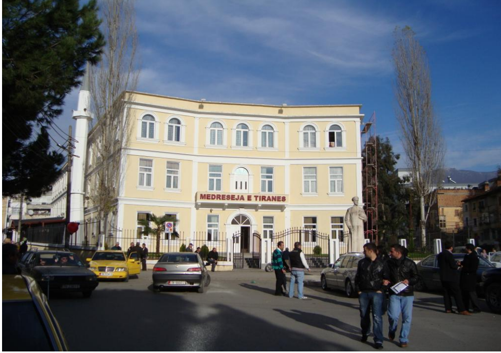
Hafız Mahmud Dashi/Daşı Tiran Erkek ve Kız Medresesi