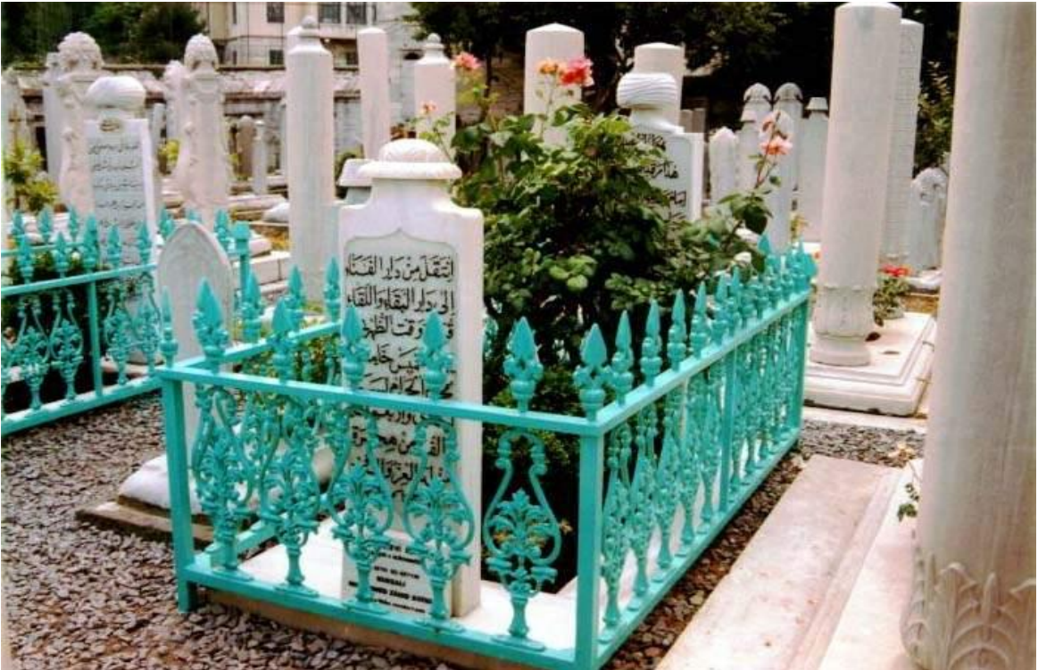
Mehmet Zahit Kotku'nun Süleymaniye Camii ablusundaki kabristanı.

Resimler Mahmut Esat Coşan araştırma merkezinden alınmıştır.