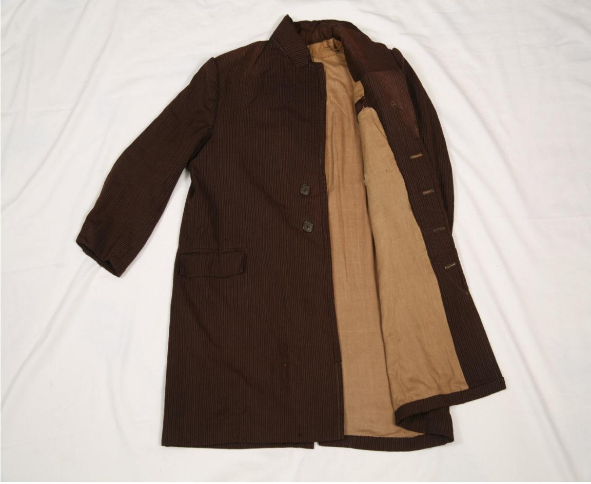
Mehmet Zahit Kotku'nun Cübbesi.