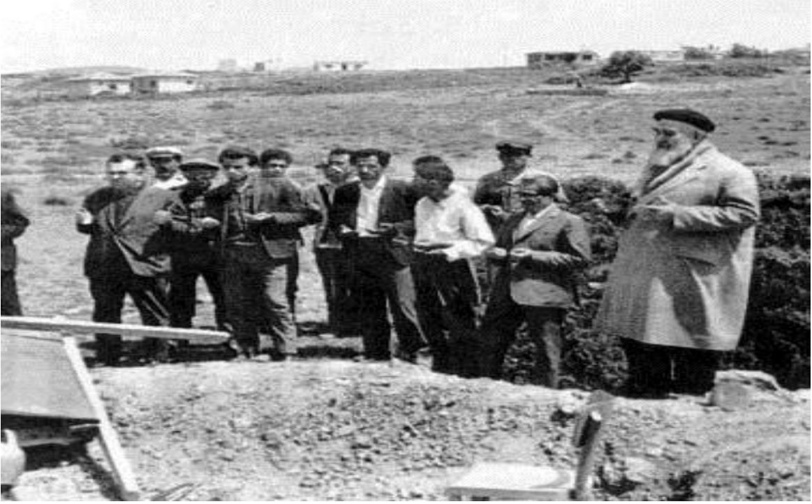
Fabrika temel atma töreni.