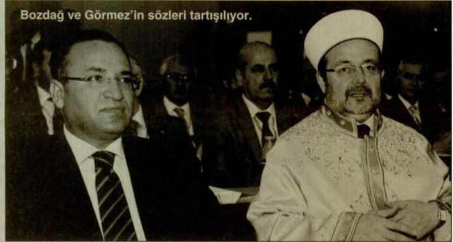
Bozdağ ve Görmez'in sözleri tartışılıyor.

Başbakan Erdoğan, nisan ayında CHP'yi, geçmiş iktidarları döneminde camileri ahıra çevirmekle suçlamıştı. CHP Genel Başkanı Kılıçdaroğlu da Erdoğan'ın bu açıklamalarına