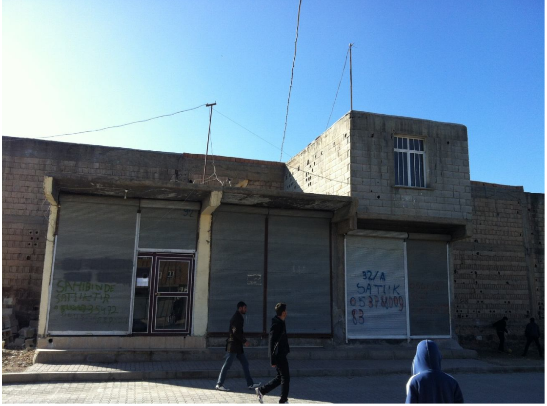
Şekil8. Eyyubiye'deki Evlere Bir Örnek