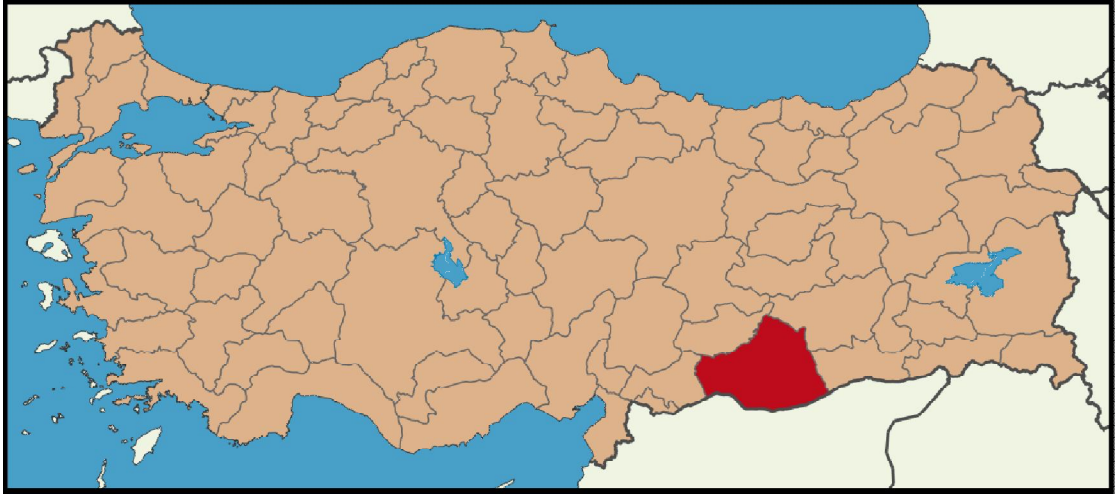
Şekil 1. Türkiye Haritasında Şanlıurfa'nın Konumu

Dolayısıyla Şanlıurfa, nüfusu yüksek olan, yoğun köy-belde nüfusuna sahip, genç nüfus oranı yüksek olan ve nüfus artışı yüksek olan bir karaktere sahiptir. Bu özellikler kentin kendine özgü ve güçlü bir kırsal kültürün oluşmasını kolaylaştırmaktadır. Şehrin genç nüfusu iş gücü konusunda bir avantajdır ancak, şehir, bu bağımlı nüfus için yeterli hizmetleri, özellikle de eğitim hizmetini sağlamakta zorlanmaktadır.