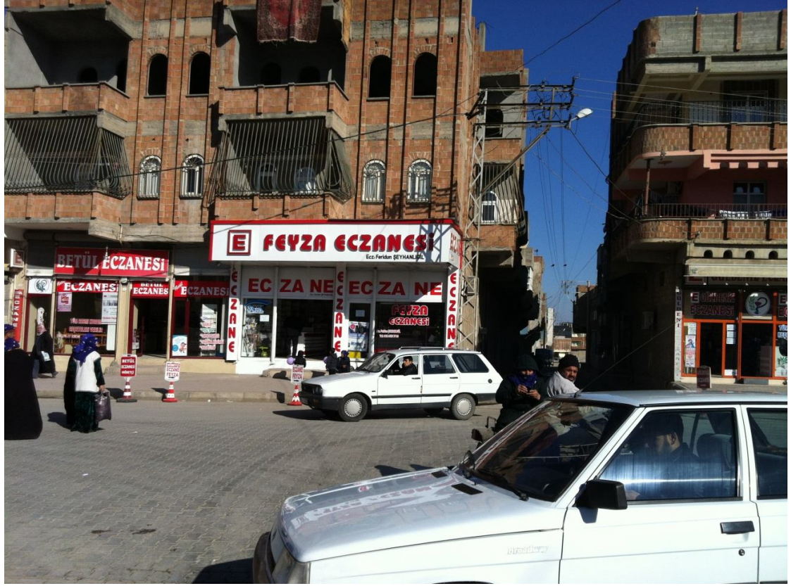
Şekil 16. Eyyubiye Sokaklarında Dolaşan Mahalleliler