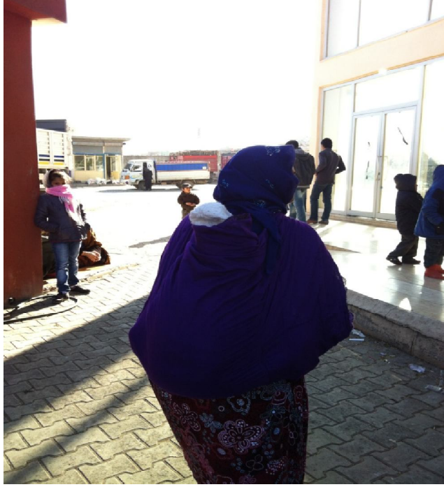
Şekil 14. Eyyubiye’de Bebeğini Sırtında Taşıyan Bir Anne ve Sokaktaki İnsanlar