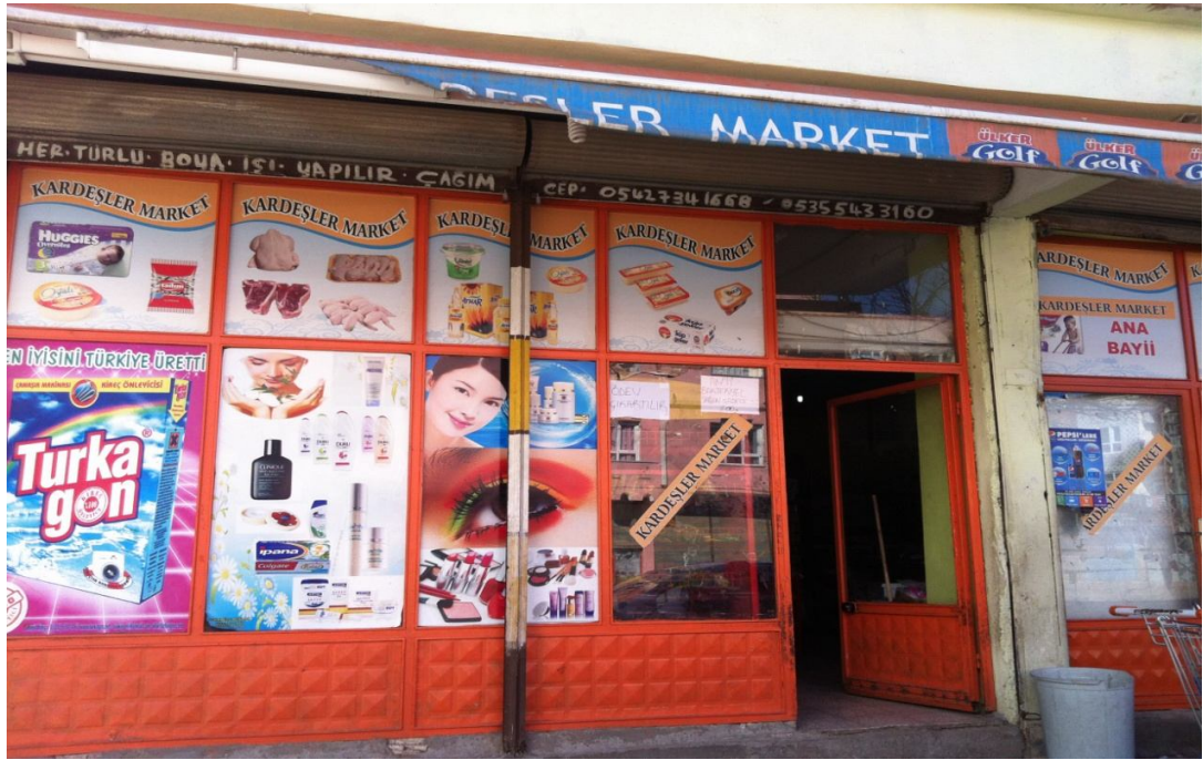
Şekil12. Eyyubiye’de Bir Market

ürünler buraya zamanında ulaşırsa buradaki insanların bir kısmının bu tarz ürünleri tercih edebileceği ancak bu kesimin, bu ürünlerden kar edilmesini sağlayacak kadar geniş bir kesim olmayacağı görülmektedir. Zira hem buranın yaşam tarzı ve giyim kültürü farklıdır, hem de burada yaşayanların önemli bir kesiminin maddi koşulu iyi değildir. Ayrıca Eyyubiye’de bulunan büyük ve önemli yapıların mahallelilerin hayatını büyük ölçüde etkilediği, çevrenin fiziki yapısını ve kokusunu değiştirdiğini görmekteyiz. Yine mahallenin daha küçük birimleri olan, ev, sokak, kapı önleri gibi mekanları kullanma biçimlerinin yine mahallelinin birbiriyle ilişki kurma sıklığını etkilediğini görmekteyiz. Mahalleli birbrinden haberdar bir biçimde yaşamakta, sokağı gözetlemekte, oradan haberdar olmaktadır. Yine mahallelerdeki park eksikliği nedeniyle mahallelilerin sokak ve kapı önlerini daha yaygın bir şekilde sosyalleşme aracı olarak kullandığını görmekteyiz.