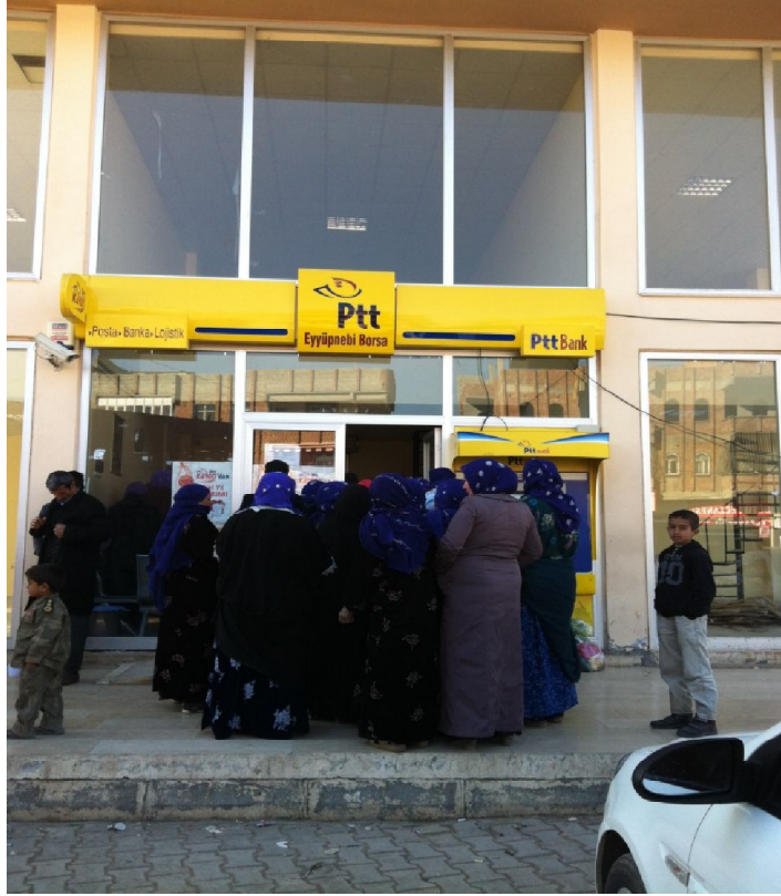
Şekil11. Eyyubiye’de PTT’nin Önü