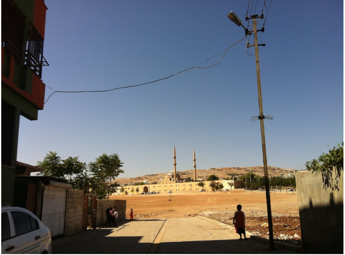
Şekil6. Hz. Eyüp Peygamber Makamının Mahalleden Görünüşü