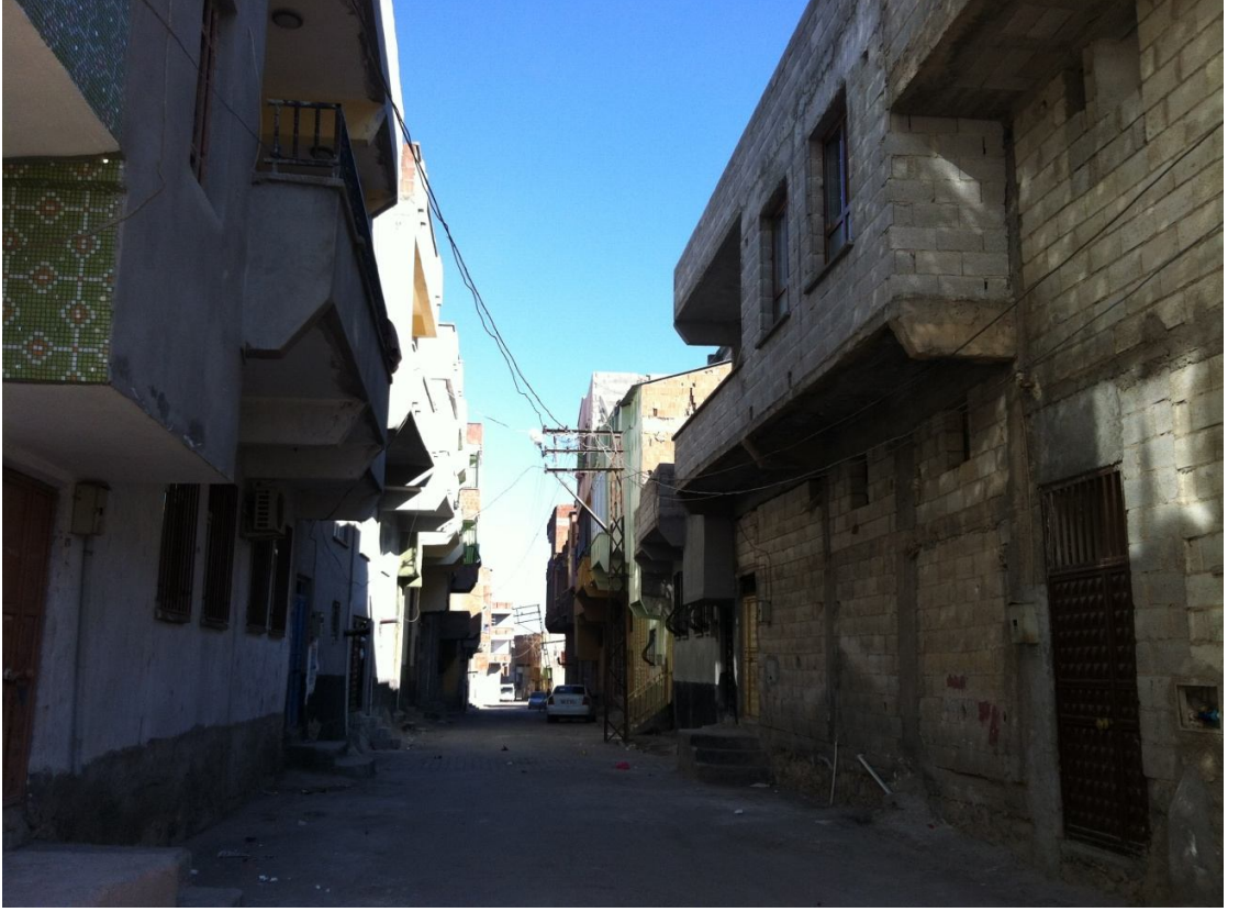
Şekil9. Eyyubiye'nin Sokakları

büyümektedir. Mahalleli sokakta çocukların oynamasını yaşam tarzlarının, mahalledeki park eksikliğinin bir sonucu olarak görmekte ve kabullenmektedir.