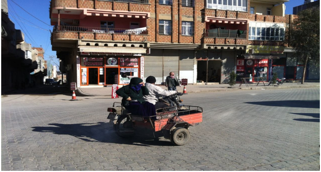
Şekil 10. Eyyubiye’de bir SepetliMotor