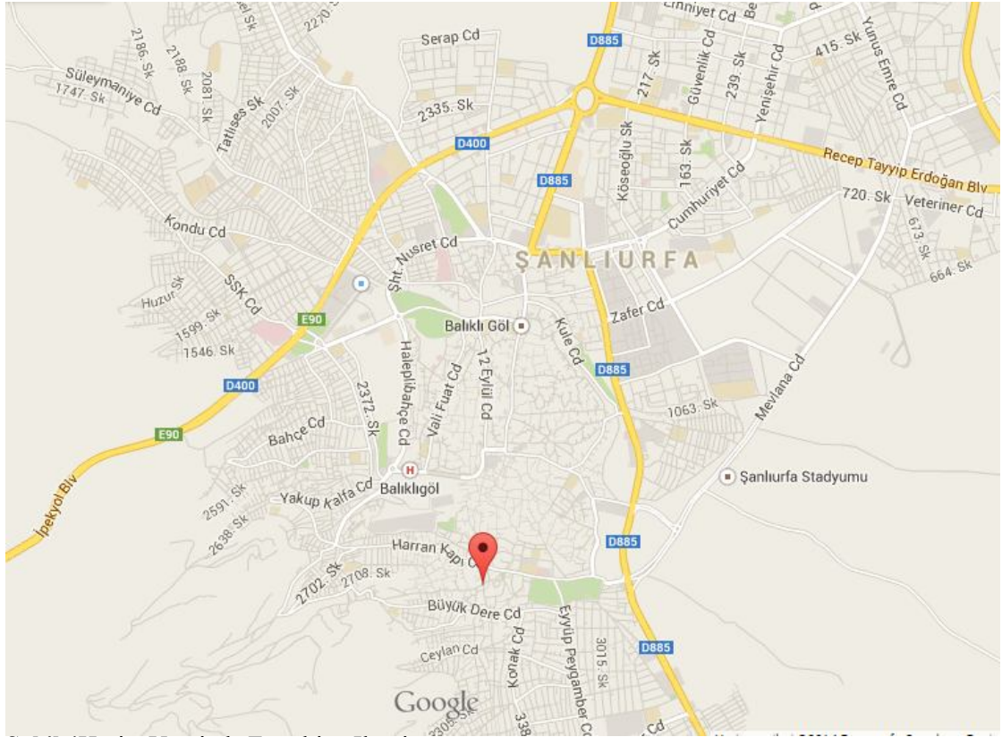
Şekil.4 Harita Uzerinde Eyyubiye İlçesi