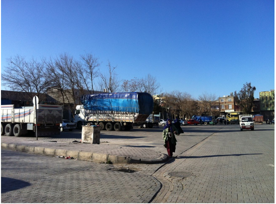
Şekil7. Eyyubiye Buğday Pazarı