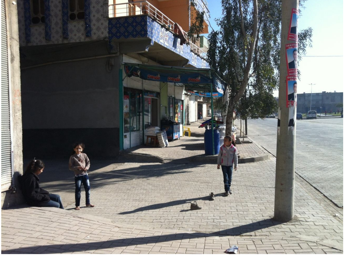
Şekil13. Eyyubiye’de Çocuklar