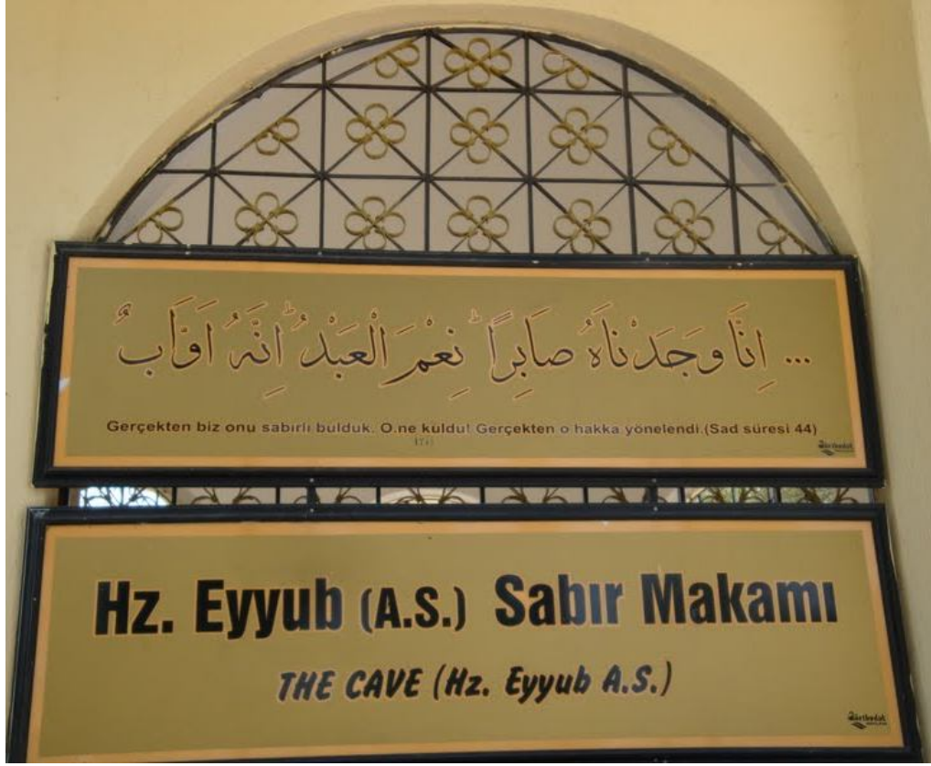
Şekil 5.Hz Eyüp Peygamber'in Makamı (Eyyubiye)

Eyyubiye'ye adını “Eyüp Peygamber (Sabır) Makamı” vermiştir. Bu makam Eyüp Nebi mahallesinde bulunmaktadır. Burada Hz. Eyüp A.S.'ın türbesi, bu türbenin güneyinde Elyasa Peygamberin türbesi, Kuzeyinde ise; Eyüp A.S.'ın hanımı olan Hz. Rahime'nin türbesi bulunur. Ayrıca; burada Eyüp A.S.'ın sırtını dayadığı bazalttan sabır taşı da yer almaktadır. Hz Eyüp A.S.'ın hastalığı boyunca kaldığına inanılan mağara da burada bulunmaktadır ve ziyarete açıktır. Bahse konu alanın son çevre düzenlemesi Vali Ziyaettin AKBULUT zamanında yapılmıştır. 14