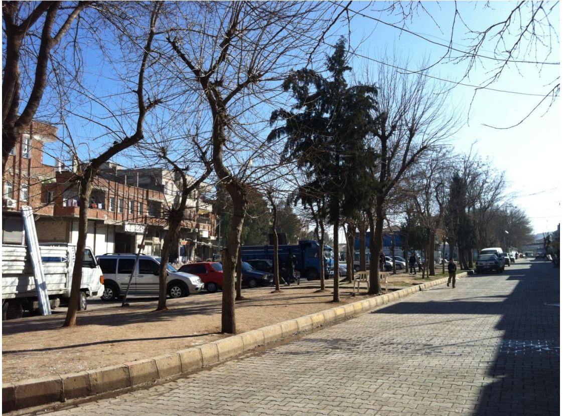
Şekil 15. Eyyubiye Sokakları

gidebiliyor, önemli olan, maddi güçlerinin ve sağlıklarının el vermesi ve bu konularda bir çok insan sıkıntı çekmekte. Yoksulluk burada yaşayanların yaşam koşullarını zorlaştıran önemli bir faktör olarak görülmekte. Mahallenin bizzat kendi ortamı olmasa da burada yaşayan bir çok insanın içinde bulunduğu ağır yoksulluk ve zor yaşam şartları yoksulluk, suç ve şiddet üretmektedir. Başlarına ailevi ciddi sıkıntılar gelen iki görüşmeci mahalleden ve mahallelilerden “nefret etmekte” ve orayı “çok tehlikeli” bir yer olarak tanımlamakta. Öte yandan görüşmecilerin çoğu kendi mahallelerinin, sokaklarının “temiz”, “güvenli”, “sessiz” olduğunu söylüyor. Böylece insanların mahalleyi, yaşadıkları, tecrübe ettikleri olaylar üzerinden tanımladıkları görülmektedir. Sonuç olarak, mahallenin sorunları olsa da bir suç mahallesi olmadığı, belirli bir düzeni olduğu göz önüne alınırsa mahalle sakinlerinin mahalleyi olduğundan çok farklı göstermeye çalışmadıkları görülür.