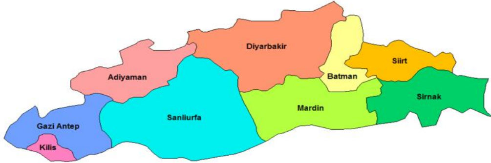
Şekil 2.Güneydoğu Anadolu Bölgesi