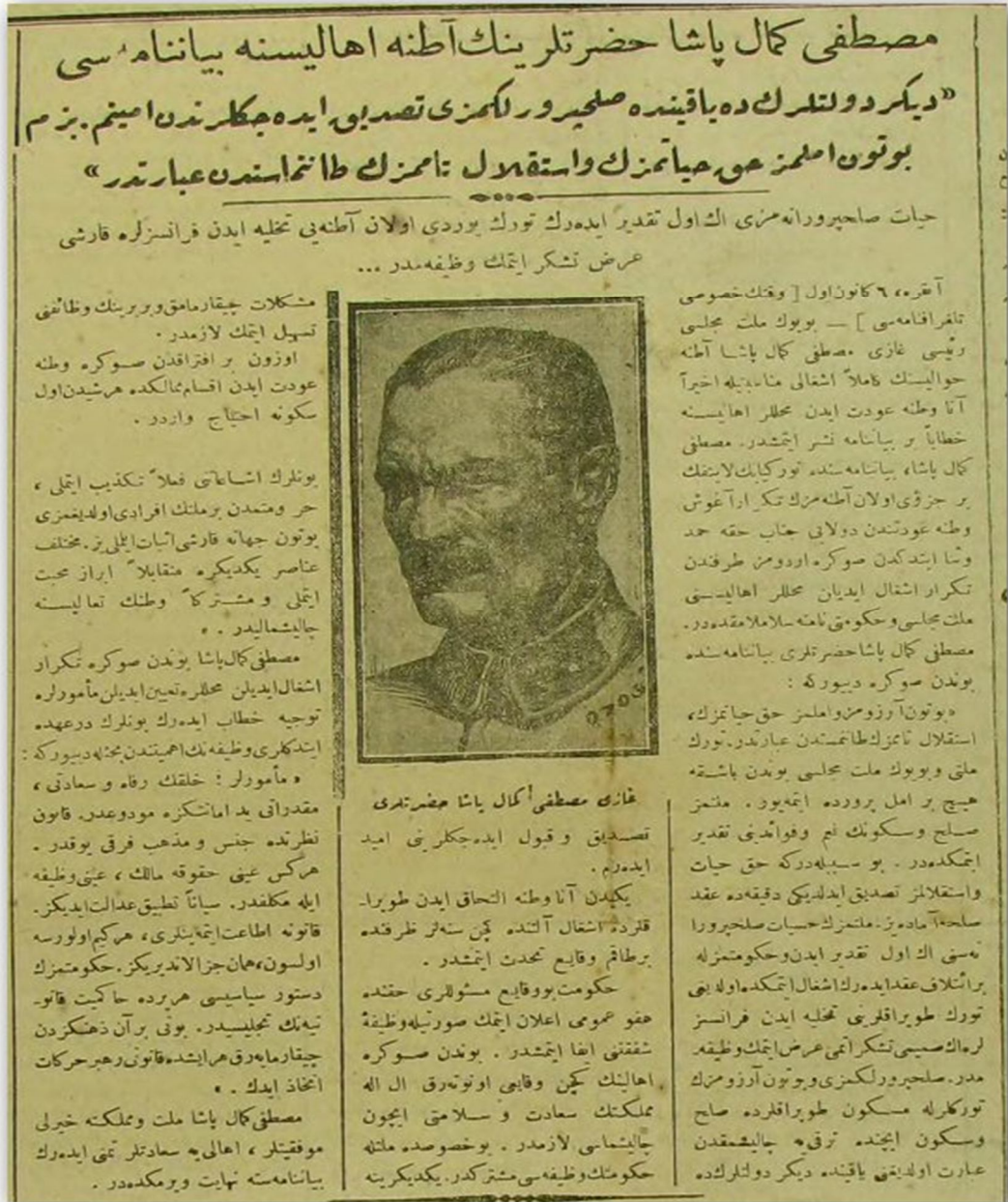
Ek 11: Akşam , 7 Kanun-ı Evvel 1337 (7 Aralık 1921), nr. 1152, s. 1. Mustafa Kemal Paşa'nın 20 Ekim 1921 tarihinde Fransızlar ile imzalanan Ankara Antlaşması'nın ardından işgal bölgesinin tahliyesi ve çıkarılan aflla ilgili yayınladığı beyanname.