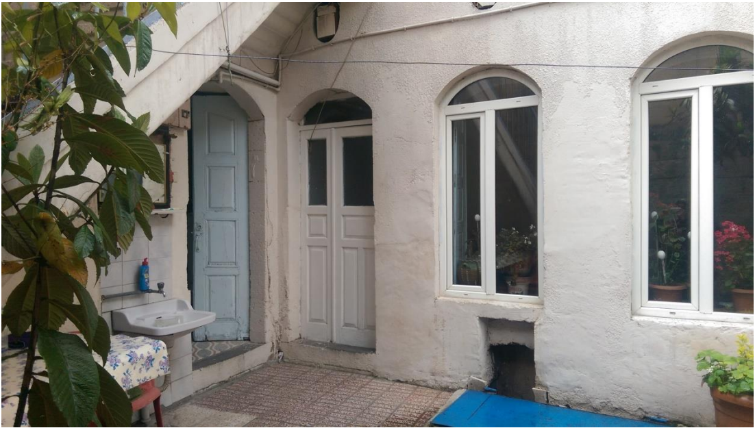
Şekil 11: Avlulu (hayatlı) eski bir ev

“Burada aile ziyareti şeklinde oluyor. Seninle komşuyuz biz, müsaitse akşam olunca ailece gidiyoruz. Öbür bir iki komşu da geliyor. Hep beraber oturup çay içiyoruz. Beş on gün sonra diğer bir komşuda buluşuyoruz. Kekler, pastalar yapılıyor. Bizim buradaki gidiş gelişler evlere oluyor. Geniş bir parkımız yok, mahalle dar bir alana sıkışmış. Evlerde buluşmanın iyi tarafı, evin sıcak ve samimi ortamında insanların kaynaşması.”(18. Kişi, E, 67)