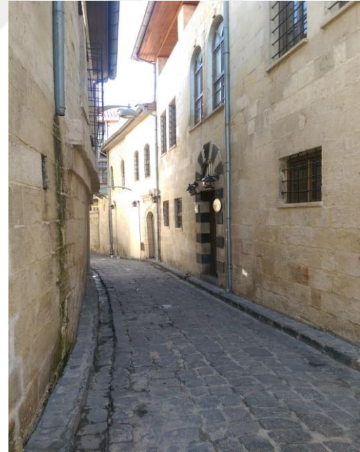
Şekil 3: Dar sokak/Bey Mahallesi

Ev ve sokaktan başka mahalleyi oluşturan bir başka unsur ise caddelerdir. Sokaklar evleri birbirine bağlarken cadde de birden fazla mahalleyi kapsamakta ve bu bağlamda mahalleleri birbirine bağlamaktadır. Mahallede yaşayanların çok fazla