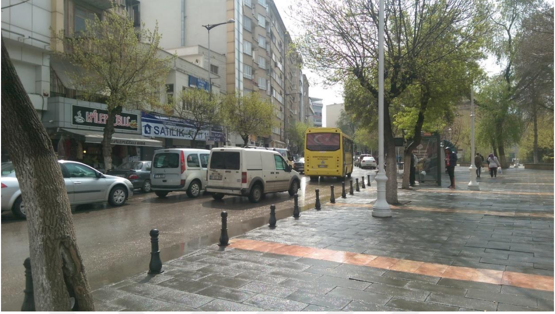
Şekil 10: Atatürk Bulvarı

“Bu mahalle belirli bir mahalle olduğu için genelde zengin kimseler oturmuş. Cenani Konağı deriz şu karşı konak, o konakta Cenaneler, az aşağıda Şerafettinoğulları, Özmimarlar vardı bunlar hep mahallenin zengin insanları. Bunlar otururlarmış, hep evlerini zamanında sattılar ve gittiler. Bazıları da satmadılar kiraya verdiler. Mesela Özmimarların babası ölünce Bursa’ya taşındılar. Yani buranın yıllar önceki hali daha iyiydi, canlıydı. Abim söylerdi, şu otoparkın olduğu yer hep dükkanmış, burada öyle bir alışveriş varmış ki o zaman Pazar gibi, sebze hali gibi. Bütün mahalledeki bakkallar gelir buradan alırlarmış. Mobilyacılar, marangozlar vardı, onların hepsi yıkıldı. O zaman Antep’in en hareketli alışveriş merkezi gibiydi burası, ama şimdi hiçbir şey kalmadı. Nüfus vardı şu ilerde, onun için de çok canlıydı. Şimdi buranın yaşamı bitti.”(2. Kişi, E, 69)