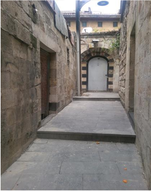
Şekil 2: Çıkmaz sokak/Bey Mahallesi

Evlerin oluşumları sokakların oluşumlarını da etkilemiştir. “Antep kenti ve çevresinde iklimin sıcak ve kuru olması, yılın büyük bölümünün yağışsız geçmesi nedeniyle yapı dışında özel düzenlemelere gidilmesi gerekmiştir. Bunun için sokaklar dar tutularak, günün her saatinde sokağın iki yanında yer alan yapıların ve avlu duvarlarının sokağa gölge vermesi sağlanmıştır” (Başgelen, 1999: 72). Yer yer sokakların üstünden geçen kabaltları hem gölge sağlamış, hemde rüzgar koridoru sağlayarak yaz sıcaklarında serin hava imkânı sunmuştur. Aynı etkenler evlerin tasarımında da söz konusudur. Bunların dışında arsa mülkiyeti, evlerin yerleştirilmesindeki bireyci tutum, iklim ve arazi gibi etkenler de çıkmaz sokak oluşumunda rol oynamıştır.