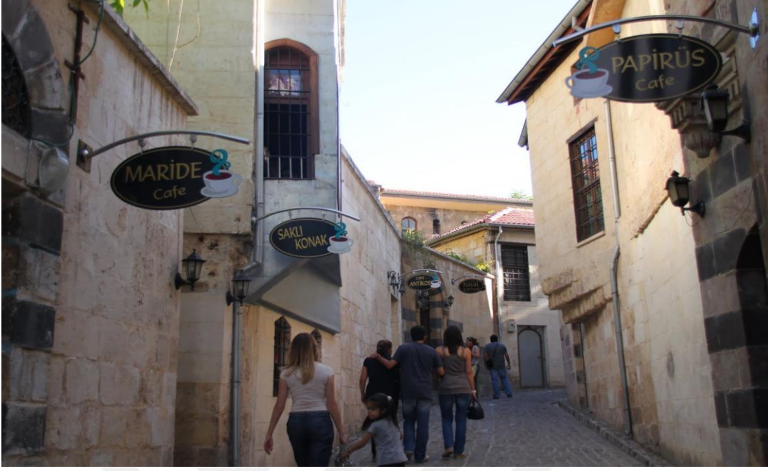
Şekil 13: Bey Mahallesi'nde bulunan kafeler

Bu şekilde düşünenlerin yanı sıra müzelerin mahalleleri açısından faydalı olduğu, şehrin ve mahallenin kültürünü tanıtmada etkisi olduğu ve bu durumun kendilerini mutlu ettiği, müzelere gelenlerden rahatsızlık duymadıkları da belirtilen düşünceler arasındadır. Müzeleri faydalı bulanların arasında kafeleri mahalleleri açısından olumsuz bir durum olarak görenler de mevcuttur. Kafelerin mahalleye hareket ve canlılık kattığını, öncesinde ıssız ve sakin olan sokakların canlandığını ayrıca yaşanan yer ile işyerlerinin iç içe geçmiş olmasının kaçınılmaz bir durum olduğunu ifade edenler gündelik hayatları açısından bu gibi yerlerin olumlu etkilerine vurgu yapmışlardır.