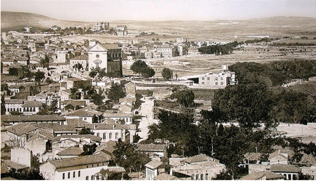
Şekil 6: Bey Mahallesi sınırları dahilindeki Kendirli Kilisesi'nin eski görüntüsü

Mahalleler bir dini yapı etrafında, organik olarak gelişmişlerdir. Birkaç mahalle hariç hemen bütün mahalleler isimlerini bir cami veya mescitten almaktadır. Gündelik hayat ve diğer sosyal ilişkiler de Osmanlı şehir mahallerini yansıtmaktadır. Zamanla nüfusun artması ve özellikle 1950'lerden sonra yoğun göç ile birlikte eski mahalleler merkeze yerleşirken kenar mahalleler ortaya çıkmaya başlamışlardır. "1990'lı yıllara kadar süren bu göç trendi ile göç edenler kuzeyde Karşıyaka, güneyde Düztepe ve Hoşgör gibi mahallelere yerleşmişlerdir. 'Eski kentin' yani Osmanlı İmparatorluğu yıllarında ve Cumhuriyet'in ilk yıllarında kale etrafında gelişen kentin, böylece kuzey ve güneyinde yer alan tepelerinde yeni yerleşim alanları oluşurken, çevre köy ve illerden göç eden alt gelir grupları bu yeni bölgelerde oturmaya başlamıştır" (Karadağ, 2011: 400).