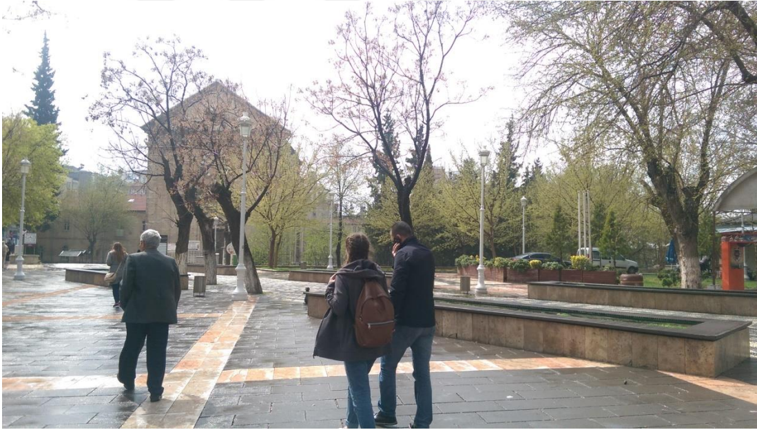
Şekil 4: Yeşilsu Meydanı/Gaziantep

manevi ilişki kurduğu bir unsur değildir cadde. Çünkü cadde büyüktür, herkes geçer, sadece bilinen değil bilinmeyen de vardır, bir yerden bir yere gitmek için kullanılan güzergâhtır, birkaç mahalle boyunca uzanır, daha geniş yollara ve nihayetinde şehre ulaştırır. Caddede olmak bir nevî şehirde olmak demektir. Şehirde olmak ise herkesle olmak, karmaşanın kargaşanın içinde olmak demektir. Cadde bilinmezliğe açılan bir kapıdır, daha fazla kamusaldır, caddede mahremiyet kalmamıştır çünkü kamuya dahil olunmuştur. Çocuklar caddeye gönderilmez, kadınlar, aileler caddede sokaktaki gibi rahat olmaz, rahat hareket edemez. “Şehir caddeleri birbirine benzer. Banka levhaları, giyim, gıda, araba, kargo firmaları vs.. Her kent, her cadde bunlar ile doludur. Düzensiz trafik koşulları, yaygaracı satıcılar ve parklarda patlayan su fiskiyeleri, salkım söğütler ve büyümeye direnen çam ağaçları. Caddeler tek düze, caddelerdeki sökülmüş kaldırımlar, caddelerdeki eskimiş ayakkabı gölgeleri.. Şehir bıkkın insanlar dünyası, caddeler en büyük kaçışların, yanmış düşlerin nezarethanesi..” (Arıbaş, 2010: 133).