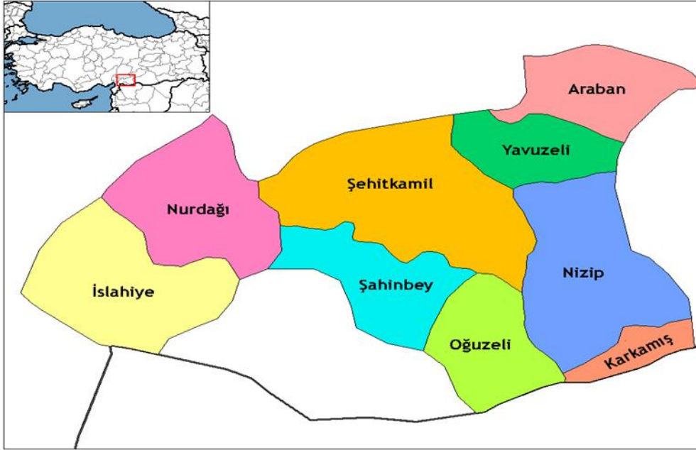
Şekil 5: Gaziantep'in ilçeleri

Antep, ticaret yolları üzerinde yer alan bir şehir ve kavşak noktası olduğundan çok çeşitli yaşam tarzlarına sahne olmuş bir şehirdir. Öncesinde de birçok devletin himayesi altına girmiş ve her biri kendinden izler bırakmıştır. “Antep şehrinde ilk yerleşme ile beraber sokak ve mahallelerin imarı kale çevresinde olmuştur. Bu durum herhangi bir saldırı karşısında mahalle halkının hemen kaleye sığınarak korunma düşüncesinden ileri gelmektedir. Mahallelerin gelişimi kaleden çevreye daireler şeklinde büyüyen bir yapı göstermez, ana yol akslarının çevresinde ve Alleben Deresi’ni sınır olarak alan bir yerleşim düzeni oluştururlar” (KUDEB, 2011: 15). Önceden kale çevresinde büyüyen şehir Cumhuriyet ile birlikte imar planlarındaki değişiklik ile dere boyunca uzanmıştır. “Ankara, Mersin, Adana, Ceyhan ve İzmit kentlerinin de imar planını hazırlayan Jansen’in Gaziantep için hazırladığı imar planına göre Suburcu, Gaziler ve Karagöz caddeleri genişletilirken, Atatürk Bulvarı ve İsmet İnönü Caddesi açılır. Böylece kentin kale etrafında gelişen geleneksel gelişimi batı ve güneydoğuya doğru kaymıştır” (Karadağ, 2011: 398). Günümüzde de şehre bakıldığında iki merkez ilçenin Alleben Deresi boyunca uzadığı görülmektedir. Şahinbey ve Şehitkamil ilçeleri isimlerini Antep Savunması’nda kahraman olan önemli kişilerden almaktadır.