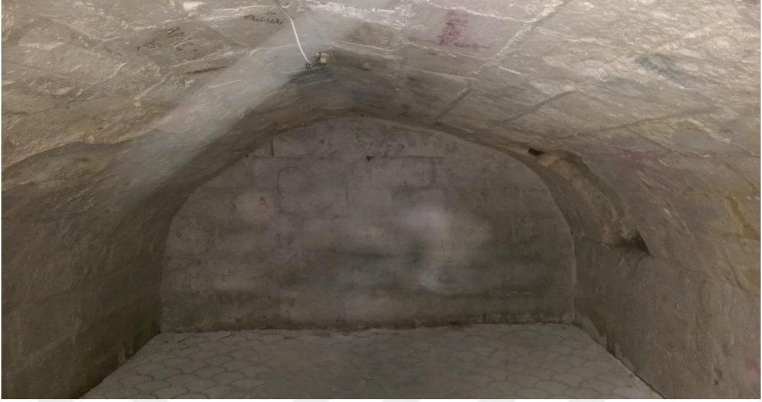
Şekil 9: Evlerin altında yer alan mağara

Yapılan görüşmelerde, zamanla varlıklı ailelerin mahalleden ayrıldıkları, evlerini sattıkları veya kiraya verdikleri, dar gelirli ailelerin mahallede kaldıkları ifade edilmiştir. Bunun sebebi ise mahallenin şehir merkezinde kalması ve koruma altına alınmasıdır. Ayrıca Suriyeli göçmenlerin yoğun yaşadığı yerler arasındadır Bey Mahallesi. Şu anda mahallede mevcut hane sayısı oldukça azdır. Mahallede evlerin çoğunda kafeler, müzeler, sanat merkezleri, dernekler ve butik oteller bulunmaktadır. Eyüpoğlu Caddesi'nde birçok eski terzi, saatçi gibi esnaflar bulunmakta, mahalleyi bölen Atatürk Bulvarı'nda ise baharatçılar, çeyizciler, tatlıcılar bulunmaktadır ve şehrin en hareketli bölgelerinden birini oluşturmaktadır. Mahallenin diğer kısmını apartman veya müstakil evler oluşturmakta ve oralarda da genellikle orta halli ve emekli olanlar ikamet etmektedir.