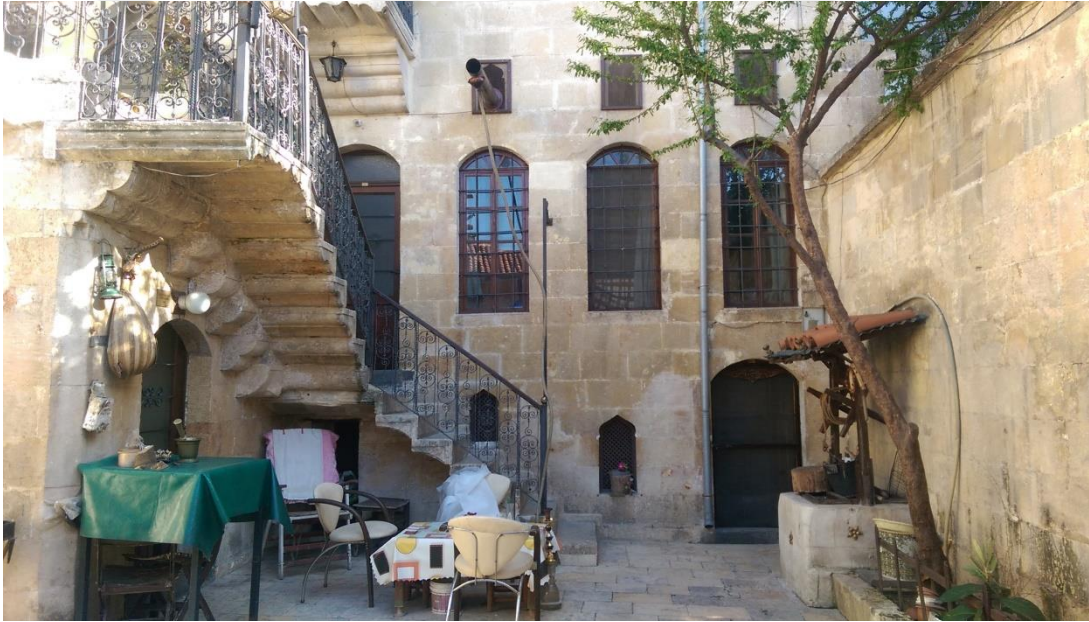
Şekil 1: Eski bir Antep evi

Evin bir besin üretim merkezi işlevi görmesi de söz konusudur. “Bahar güneşi dişlenmeye yüz tuttuğunda, avluya önce yağ tulumları, peynir torbaları sökün eder;