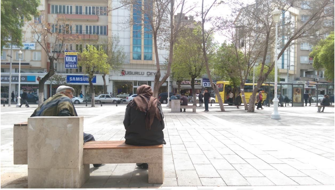
Şekil 12: Yeşilsu Meydanı

“Benim buradan taşınmama sebebim güzelliği olması. 30 yıldan beri oturuyorum. Pencereyi açtığımda insan görüyorum, orada(sitelerde) ev, araba görüyorsun. Daha bir resmiyet var, insanlar daha bir kibirli. Burada hayatla iç içesin, o yüzden buradan gitmek istemiyorum, pencereden baktığımda hayatın içinden insanları görüyorum. Elinde simidi olan da geçiyor, pastası olan da kolunda altını olan da geçiyor hiçbir şeyi olmayan da geçiyor yani hepsi sana bir ders veriyor. İnsanların telaşını gördüğümde iyi ki böyle bir telaşım yok, otur canın sıkılmasın diyorum kendi kendime, oradan bir mutluluk duyuyorum. Akşama kadar bir sürü şey görüyorsun.”(17. Kişi, 50, K)