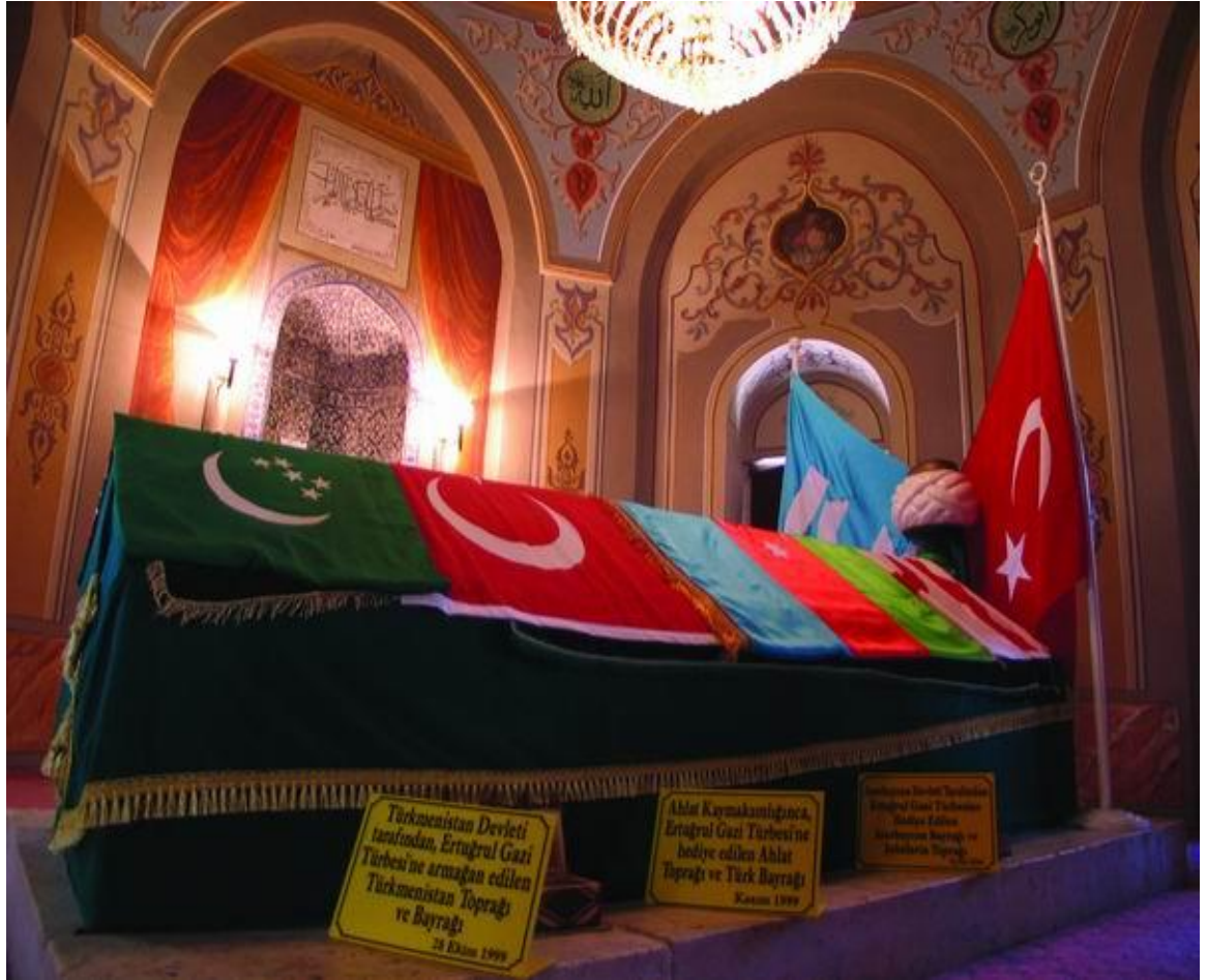
Resim 10: Ertuğrul Gazi'nin medfun bulunduğu sanduka.