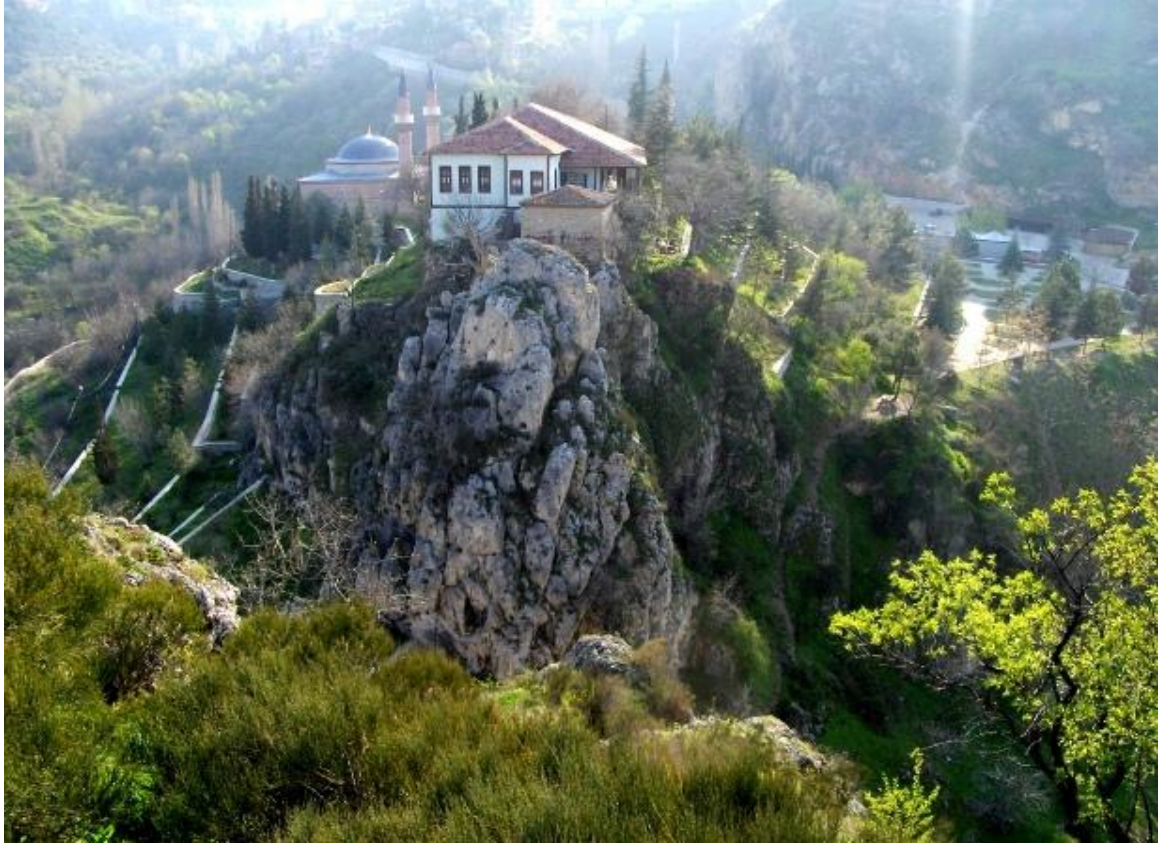
Resim 2: Orhangazi Camii ve Şeyh Edebali Türbesi'nden bir görünüm.