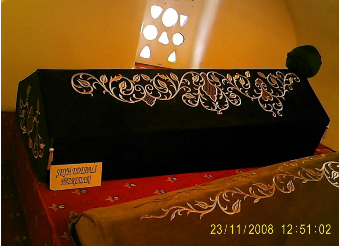
Resim 3: Şeyh Edebali'nın medfun bulunduğu sanduka.