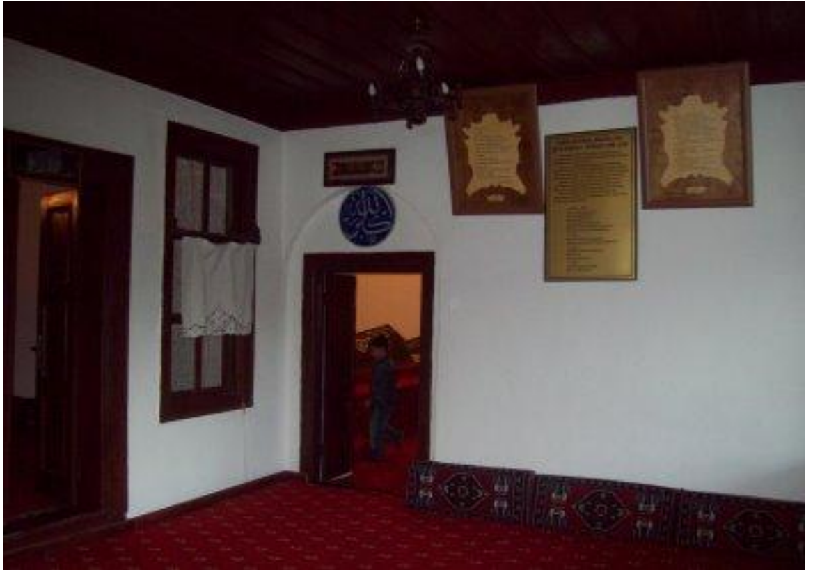
Resim 4: Şeyh Edebali Türbesi'nin salonundan bir görünüm.