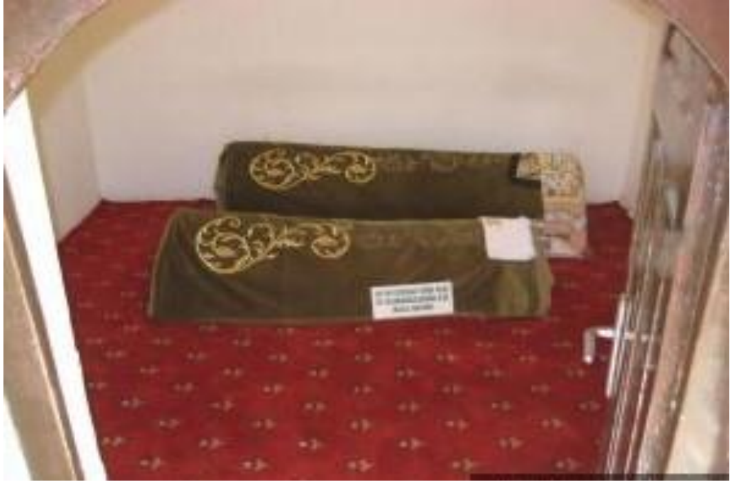
Resim 7: Şeyh Edebalı'nın hanımı ve kızının sandukaları