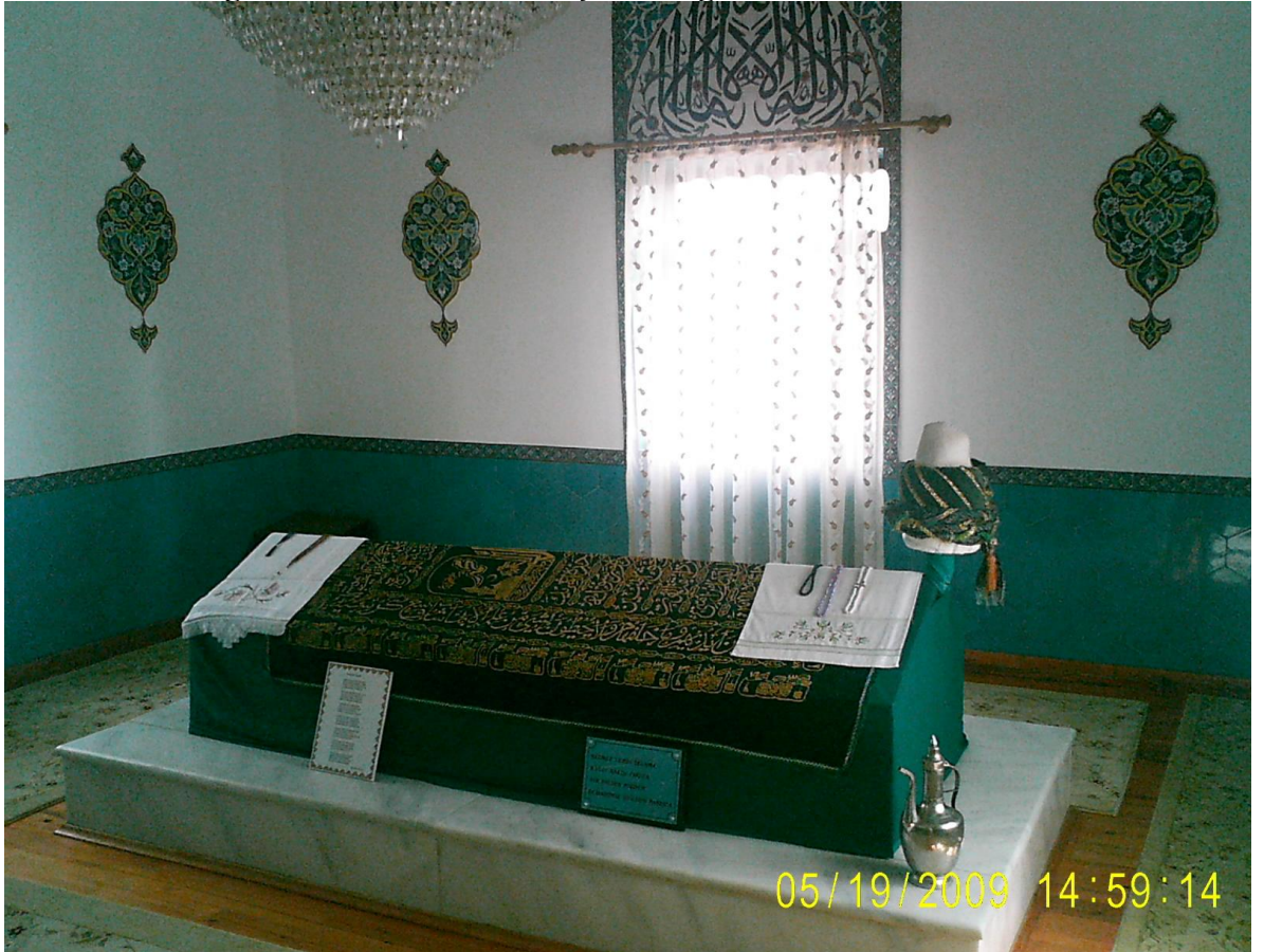
Resim 12: Dursun Fakih'in medfun bulunduğu sanduka.