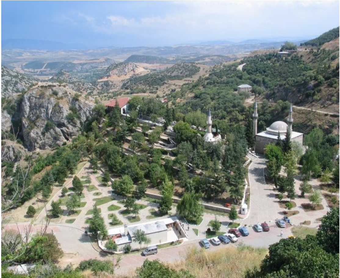
Resim 8: Türbeye girişte belediye tarafından düzenlemesi yapılan alandan bir görünüm.