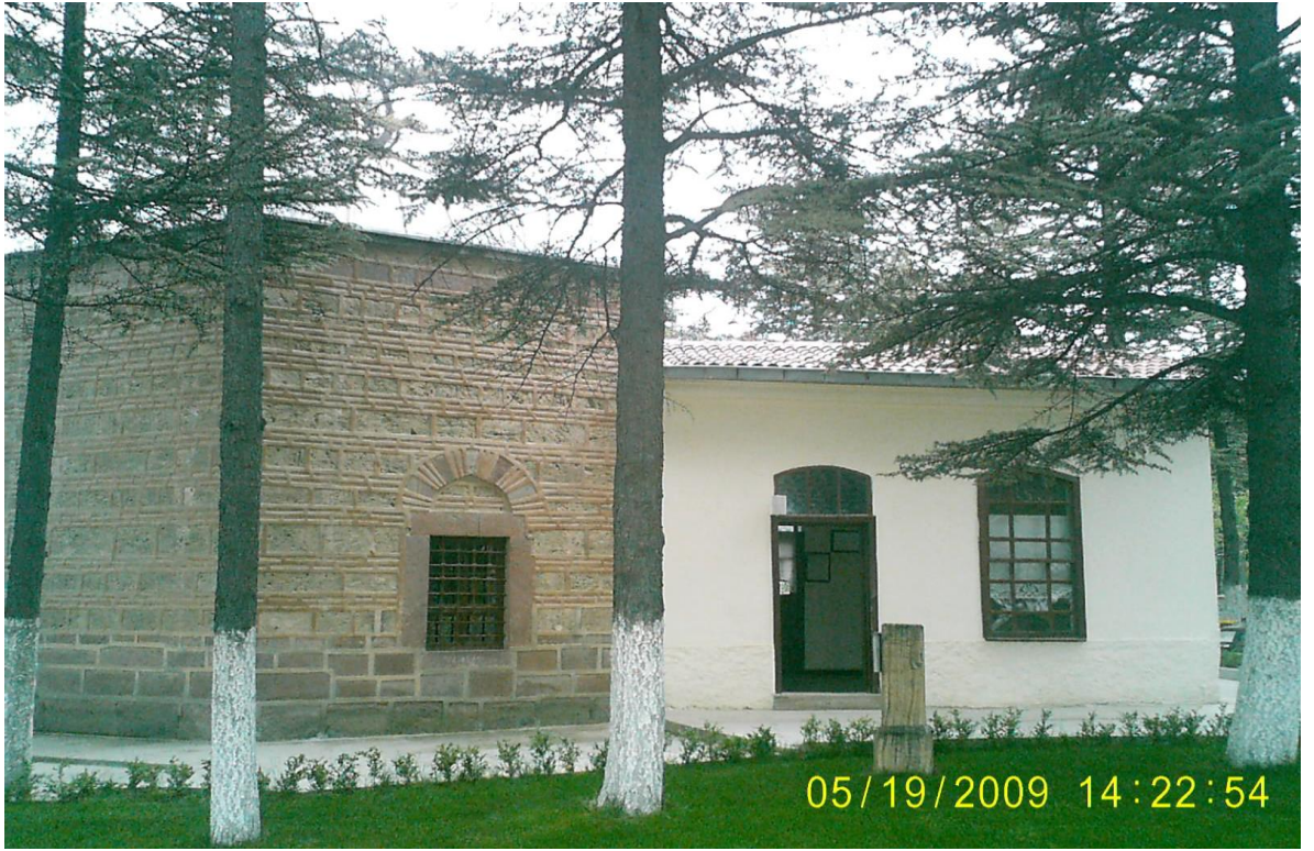
Resim 11: Ertuğrul Gazi Türbesi'nin dıştan bir görünümü.