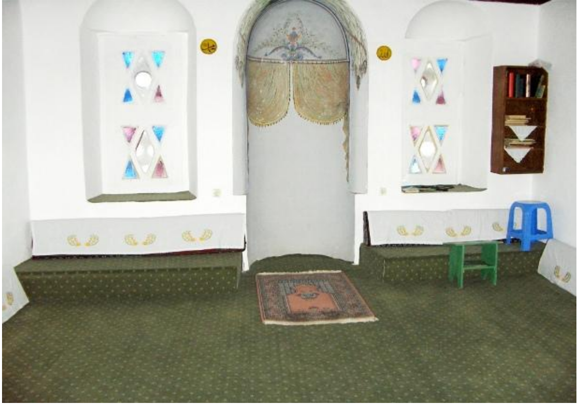
Resim 5: Türbenin içerisinde mescit olarak kullanılan bölüm.