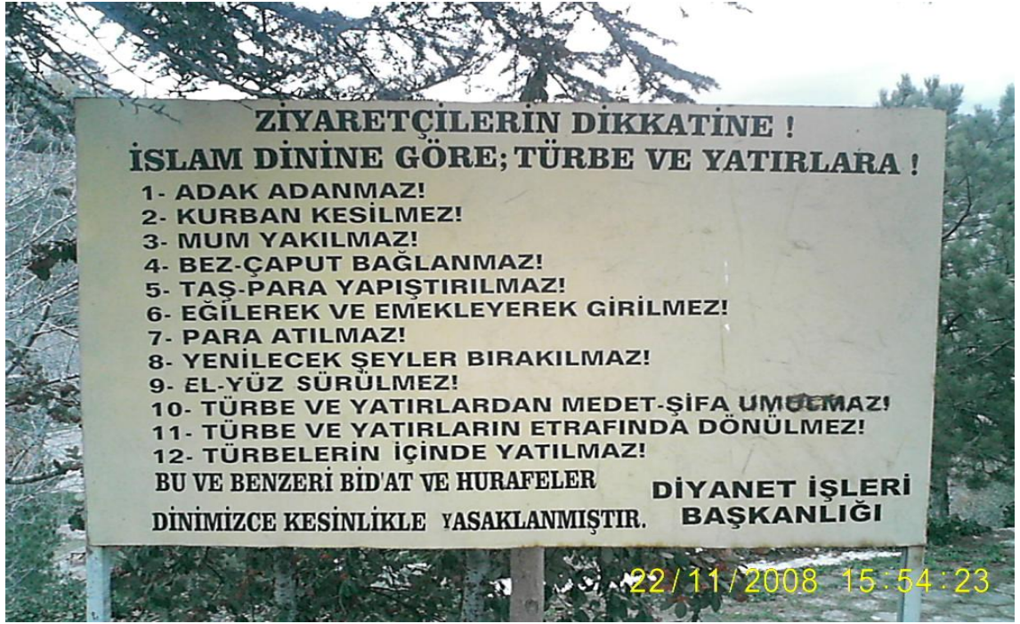
Resim 9: Türbe ziyaretlerinde yapılmaması gerekenleri belirten tabela.