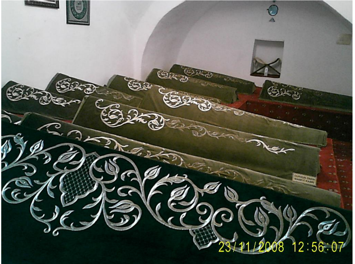
Resim 6: Şeyh Edebalı ve yakınlarının medfun bulunduğu mekân.