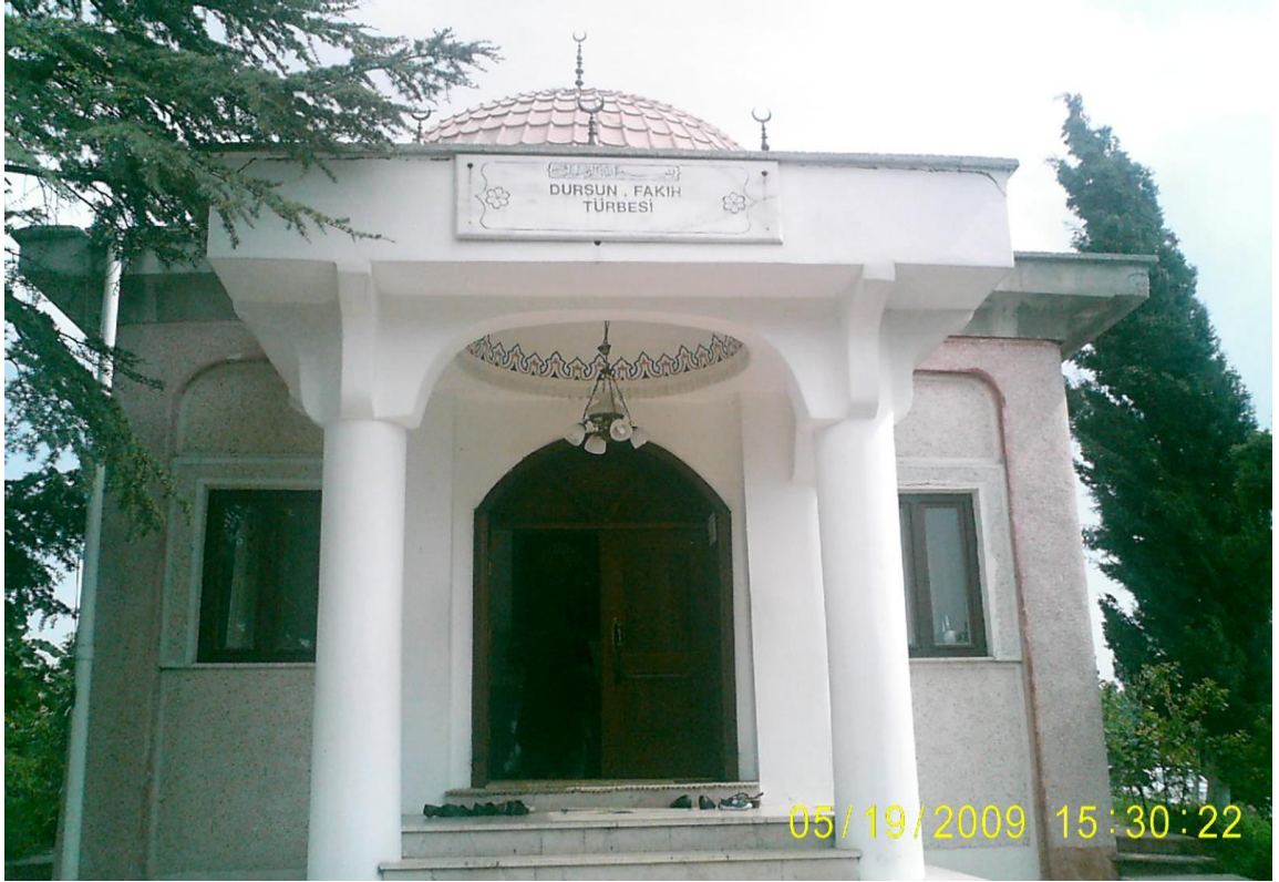
Resim 13: Dursun Fakih Türbesi'nin dıştan görünümü.