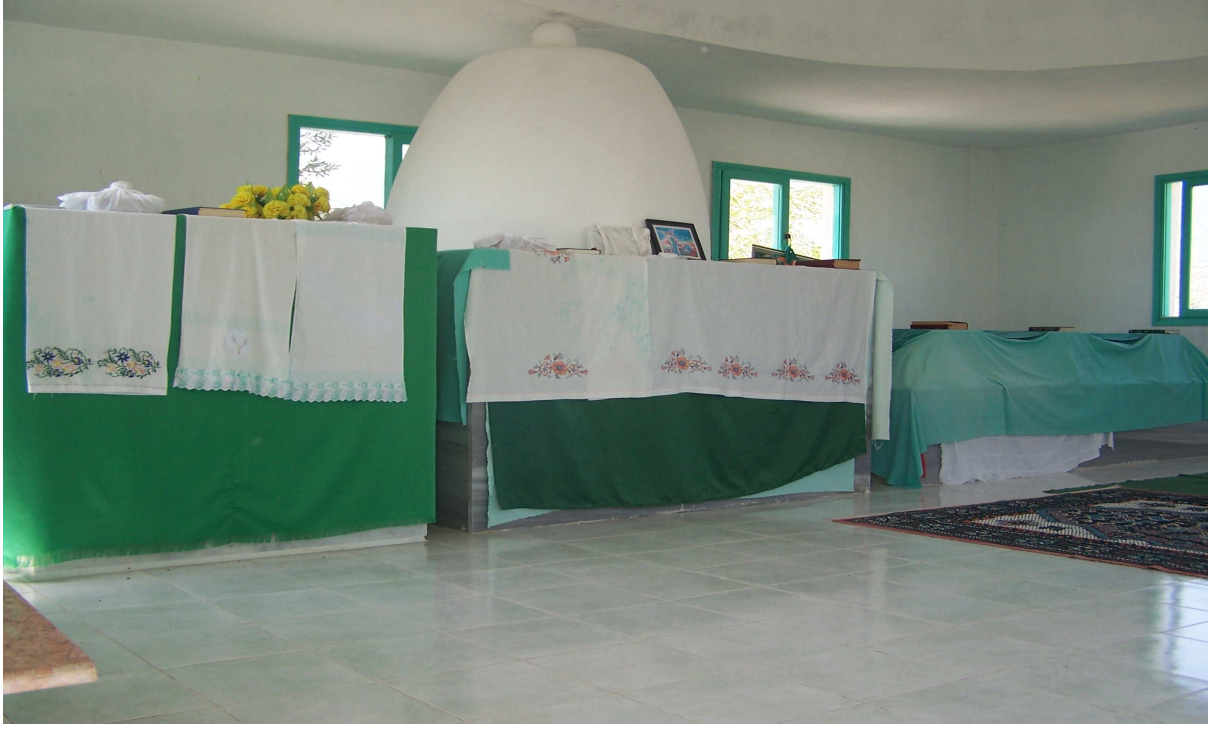
Fotoğraf 9: Seyidna Şeyh Ali Nürene-Seyidna Mıgdat Yemin-Seyidna Şeyh Hasan Sincere-Seyidna Hıdır Türbesi