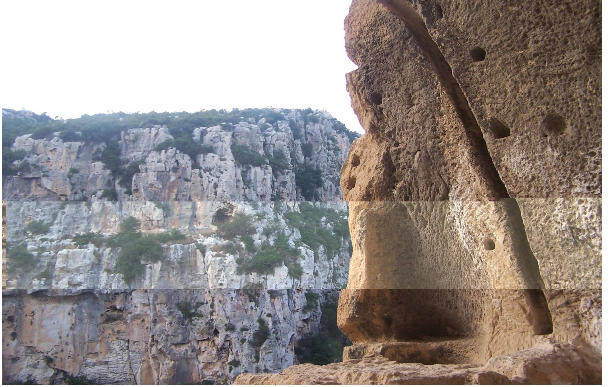
Fotoğraf 59: Hz.Ali'nin Kılıncının ve Atının Nal İzi (Aşuk Maşuk Ziyareti)