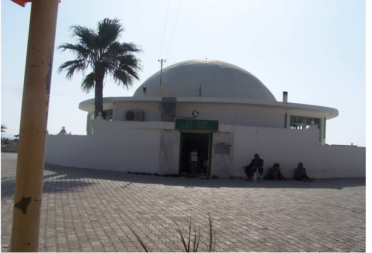
Fotoğraf 56: Hz.Hızır ve Hz.Musa'nın Buluştuğu Hz.Hızır Türbesi (dış görünüm)