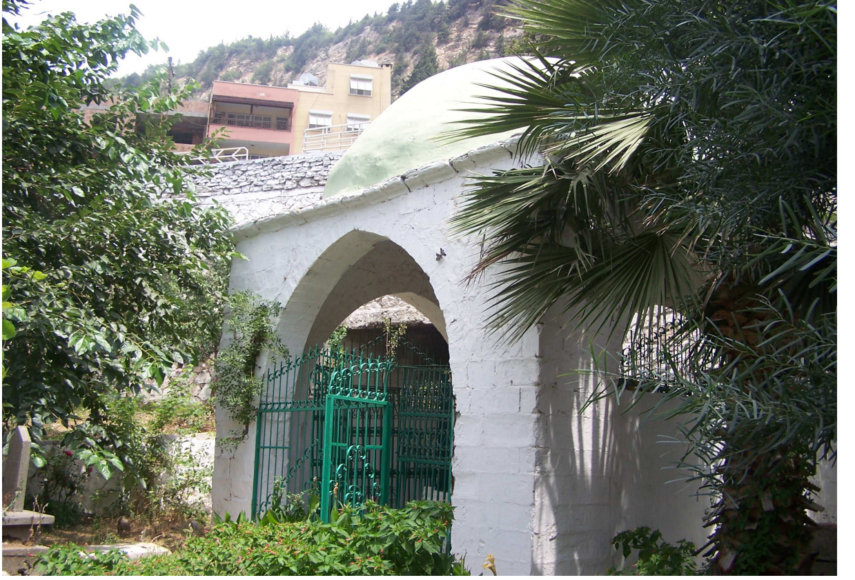
Fotoğraf 27: Gazi Abdurrahman Paşa (Belenli Şeyh Ahmed Bilen) Türbesi