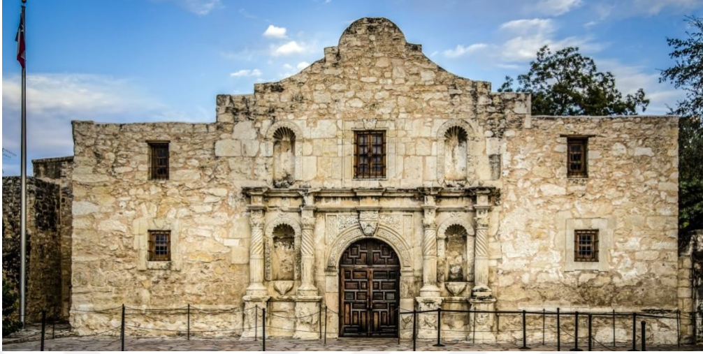
Resim 7. Alamo Kalesi