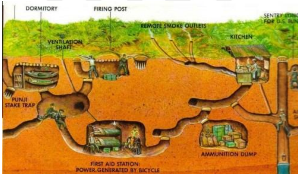
Resim 9. Cu Chi Tünelleri Şeması

Bu tüneller 1940'lı yıllarda Vietnam'ın güneyinde Fransa karşısında Vietnamlıların bağımsızlıklarını kazanmak amacıyla elleriyle kazdıkları tünellerdir (www.haberturk.com, 2016). Amerikalılar özellikle bazı askerlerini tünel faresi olmaları için eğitmesine rağmen başarılı olamamıştır. Çözüm olarak kimyasal silah kullanan Amerika güçleri, gelecek nesilleri de etkilemiş, kimyasal silahtan her iki tarafta etkilenmiş ve tünelleri korumak için 45 000 Vietnamlı hayatını kaybetmiştir (tr.wikipedia.org, 2016).