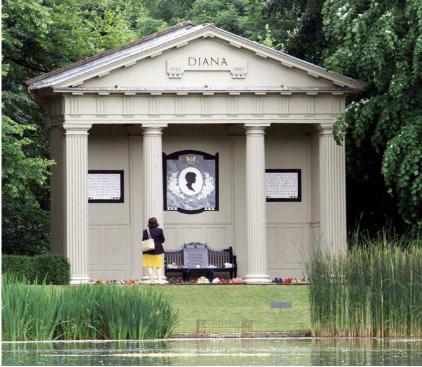
Resim 2. Prenses Diana'nın Mezarı