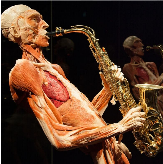
Resim 4. Body Worlds- Saksafon Çalan Adam

Body Worlds sergisi, insan vücudunun yapısını keşfetmek, stres altında ve hastalık zamanında nasıl bir yapıya sahip olduğunu ve sağlıklıyken de nasıl olduğunu ziyaretçilerine göstermektedir. Alman bilim adamı Gunther von Hagens tarafından 1977 yılında geliştirilen "plastination" denilen bir yöntem ile insan vücudunda bulunan kan ve suyun yerine silikon ve plastik enjekte edilerek çürümez hale getiren yöntemdir. 200'den fazla insan bedeni parçasının sergilendiği Body Worlds'te kaslar, damarlar ve organlar, yaşayan vücudun içinde olduğu gibi, bozulmamış haliyle sergilenmektedir (www.bodyworlds.com, 2016).