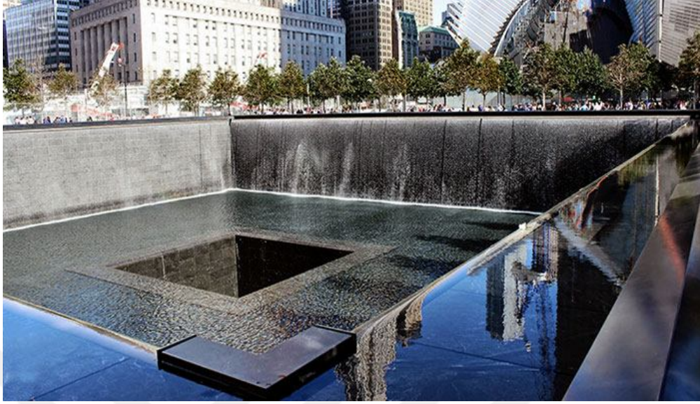
Resim 6. Ground Zero