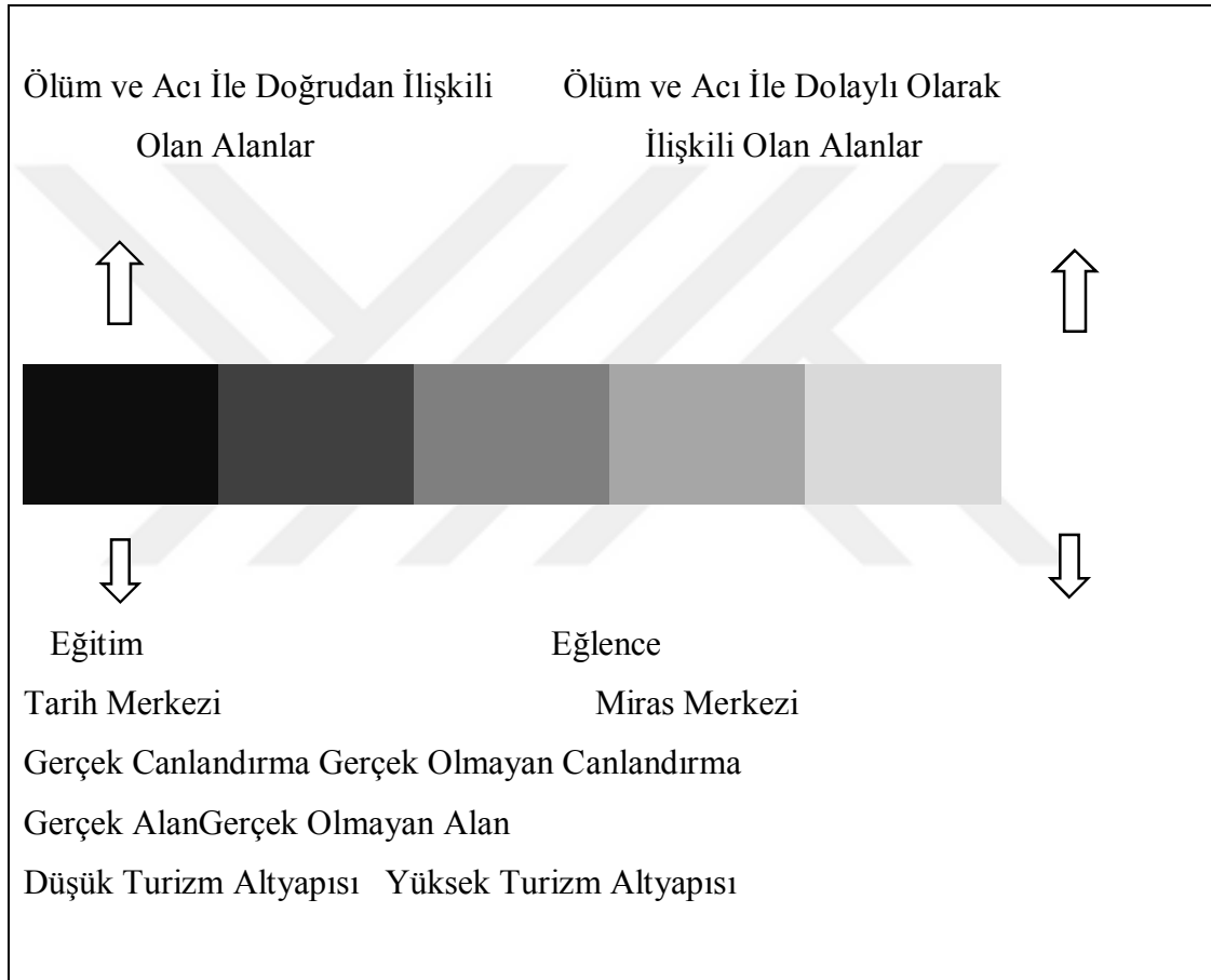
Şekil 2: Hüzün Turizmi Dizisi

Kaynak: Stone, 2006: 151, Sharpley, 2009: 20-21.