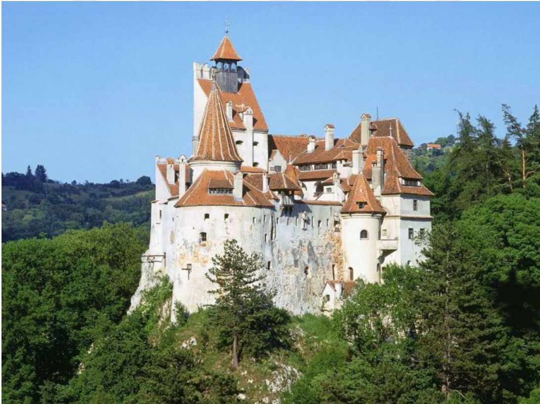
Resim 8. Bran Şatosu

Kale 20. yy'a kadar önemli bir askeri nokta olmuş ve daha sonra Romanya Krallığı'nın Beyaz Saray'ı olmuştur. 1947 yılında komünist rejim kaleyi ele geçirmiş monarşiyi devirmiş ve 1957 yılında müze dönüşmüştür (tr.wikipedia.org, 2016).