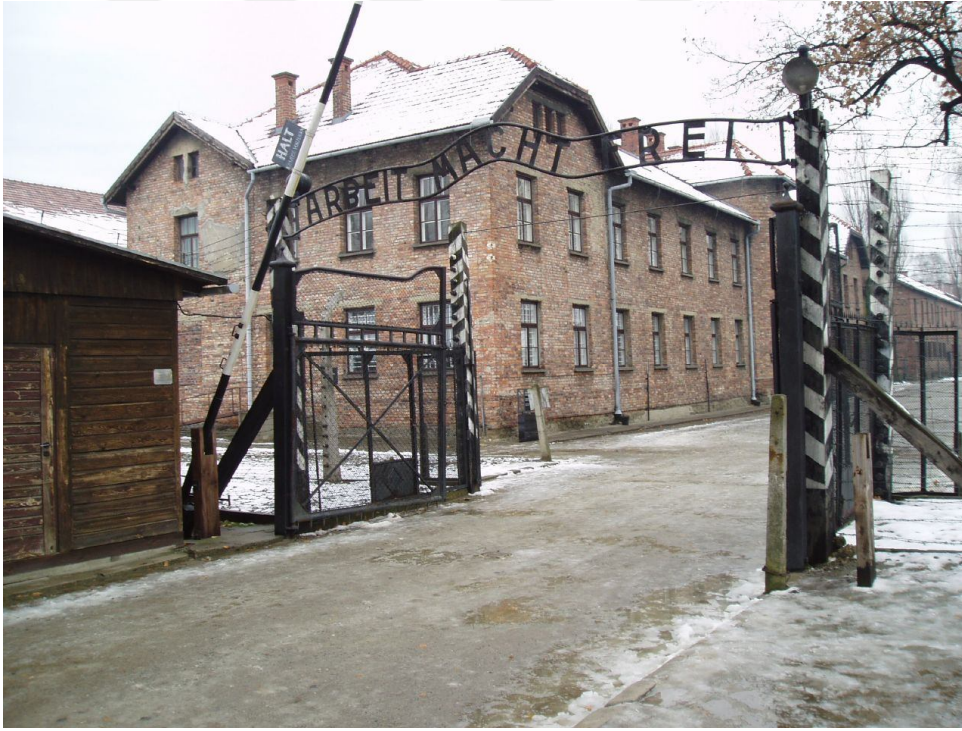
Resim 5. Auschwitz-Birkenau Kampı

II. Dünya Savaşı döneminde Nazi Almanya'sı tarafından kurulmuş olan en büyük toplama, zorunlu çalışma ve imha kampı durumundadır. İlk kurulan ana kamp olan Auschwitz I, Polonya'nın Krakow şehrinin 60 km batısında küçük bir şehir olan Oświęcim'in güneybatısında, kurulmuştur. İkincisi kamp olan Auschwitz II ise Oświęcim'in 3 km batısında Brzezinka (Birkenau) köyünde kurulmuştur. I.G. Farben, Krupp, Siemens gibi fabrikalar için yapılan Auschwitz III ise Oświęcim doğusunda bulunan Monowice (Monowitz) köyünde inşa edilmiştir (arsiv.ntv.com.tr, 2016).