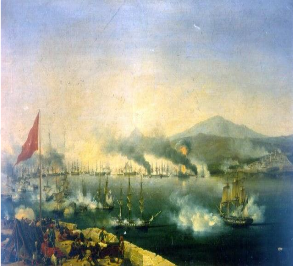
Ek 1: Navarin Deniz Savaşı, 20 Ekim 1827