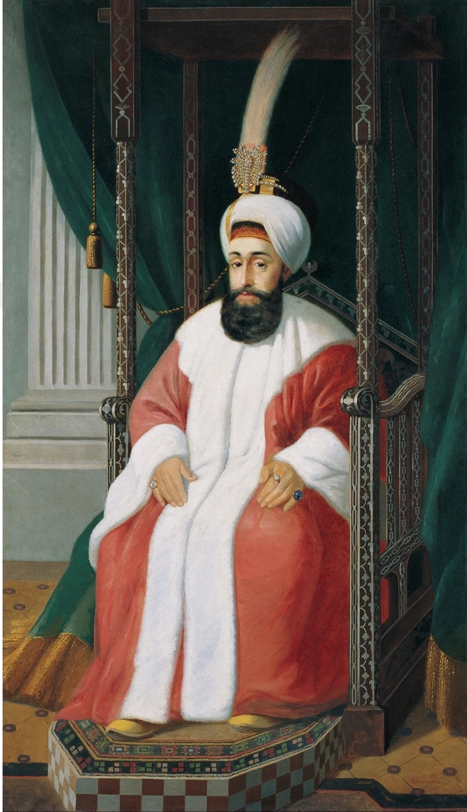
Ek 2: Osmanlı Devletinde yenilik hareketlerinde öncü padişahlardan III. Selim (24 Aralık 1761 – 28 Temmuz 1808)