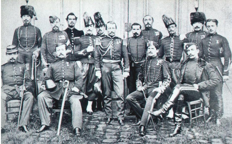
Ek 10: Tokugawa Şogunluđuna Eđitime gelen Fransızlar (Ocak 1868 - Haziran 1869)