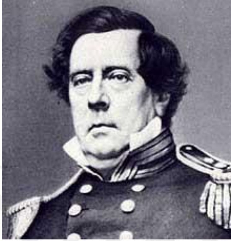
Ek 9: Komodor Mathew Perry (10 Nisan 1794 – 4 Mart 1858)