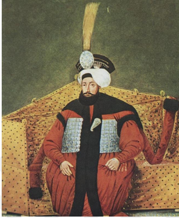
Ek 3: IV. Mustafa (8 Eylül 1779 – 17 Kasım 1808)