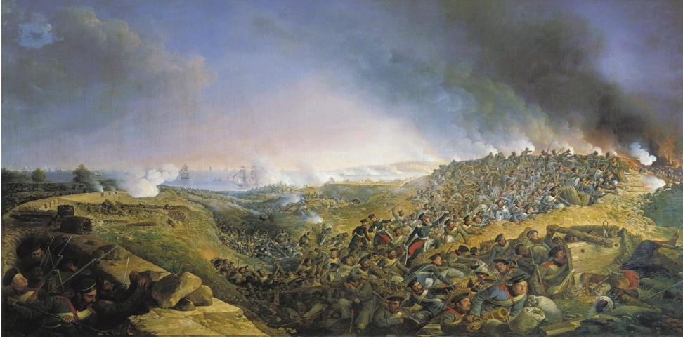
Ek 6: 1877-1878 Osmanlı-Rus Savaşı (93 Harbi)