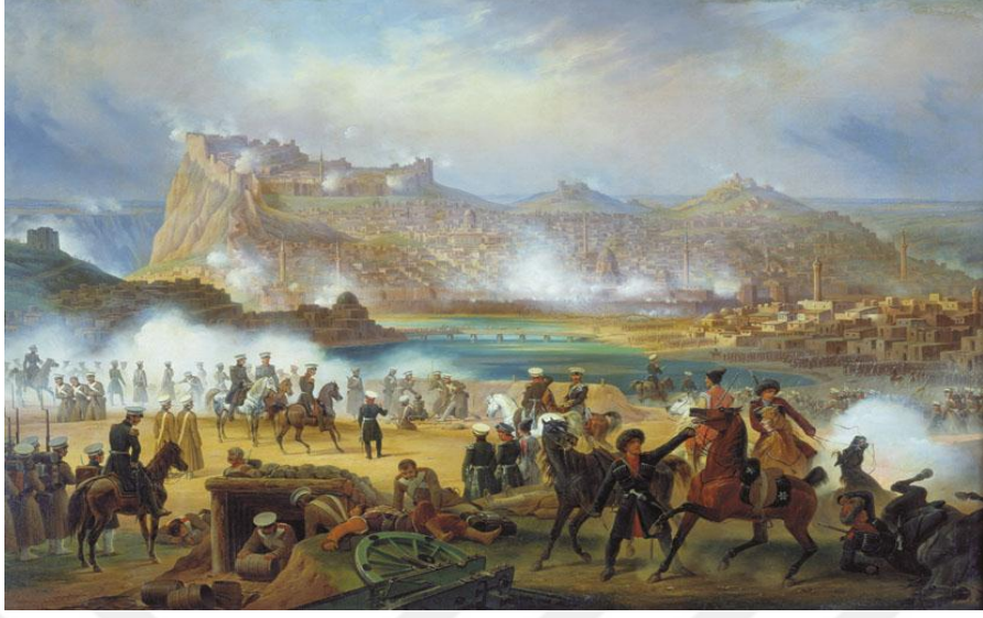
Ek 5: 1828-1829 Osmanlı-Rus Savaşı