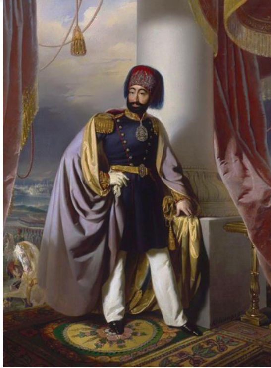
Ek 4: Yenilikçi padişahlardan II. Mahmud (20 Temmuz 1785 – 1 Temmuz 1839)