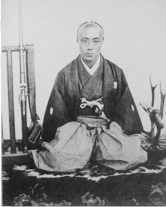
Ek 8: Şogun Tokugawa Yoshinobu, solunda samuray kılıcı, sağında ise modern bir tüfek ile birlikte. (28 Ekim 1837 – 22 Kasım 1913)