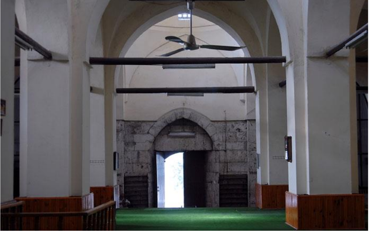
Ek 5: Amasya Gök Medrese Cami İç Kısmı