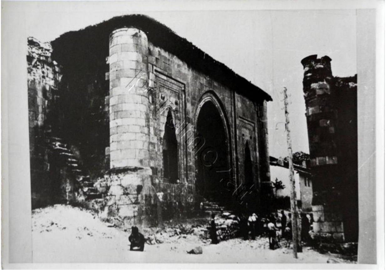
Ek 1: Gök Medrese Cami'nin Dışarıdan Görünümü

( https://www.peramezat.com/peramezat/dosyalar/yeniurun/1273/30.JPG?m=1535786967 ,