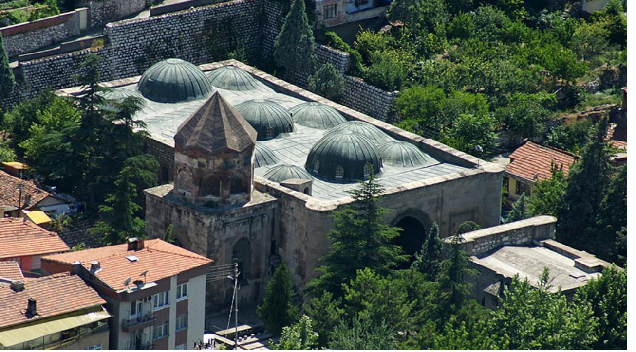
Ek 2: Amasya Gök Medrese Cami ve Türbesi