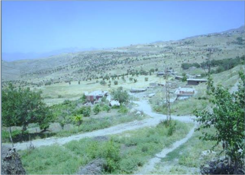
Resim 9: Şırnak İline Bağlı Seksenler Köyü

mekân, Müslümanlarca yüzyıllar boyu bir festival alanı olarak kabul edilerek binlerce kişinin katılımıyla dini yönü baskın bir kültür festivaline ev sahipliği yapmıştır (Baz, 2015: 287). Kuran'da ise Nuh Peygamber'le birlikte tufandan kurtulanların sayısı kesin olarak belirtilmemiş, yalnızca bunların sayısının oldukça az olduğu (Hud, 11/40) haber verilmektedir. Müfessirler ise Nuh Peygamber ve beraberinde kurtulanların sayısı ile ilgili seksen, kırk ve sekiz sayısını vermektedir. Hz. Muhammed'in amcaoğlu Abdullah bin Abbas'tan gelen bir rivayete göre de gemiden seksen kişi inmiştir. Günümüze kadar Cudi Dağı eteklerinde Seksenler isminde bir köyün yer alması da oldukça dikkat çekicidir. Nitekim tarih kitaplarında bu köyden bahsedilirken tufan olayından sonra Nuh Peygamber tarafından kurulduğu, buranın el-Cezire yani Mezopotamya'da inşa edilen ilk şehir olduğu belirtilmektedir (Arpa ve Dilek, 2014: 113).