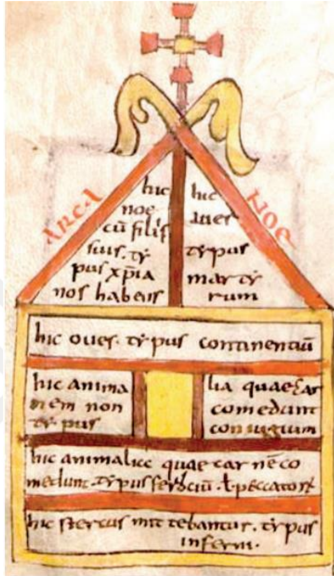
Resim 7: 9. Yüzyıldaki Kroniğe Göre Nuh'un Gemisi (İstek ve İstek: 2017a: 93)

Resim 7'de geminin yerleşim planının verildiği 9. yüzyıla ait Hristiyanlık öğretilerini içeren el yazması eserden İstek ve İstek (2017a: 93)'in aktardığına göre ise gemi, çatı katı, üst kat, kapının bulunduğu kat, orta kat ve aşağı kat olmak üzere beş bölümden oluşmaktadır. Sol tarafta Nuh ve oğulları, sağ tarafta eşi ve gelinleri bulunmaktadır. Onun altındaki katta kanatlı hayvanlara yer verilmiştir. Ortadaki sarı ile boyalı kısım ise geminin kapısını temsil etmektedir. Kapının sağında insanlar ve hayvanların ihtiyacı için yiyecekler, solunda ise yırtıcı olmayan büyük baş hayvanlar yer almaktadır. Bunun altındaki kısımda ise orta boylu hayvanlar, en alt kısımda da