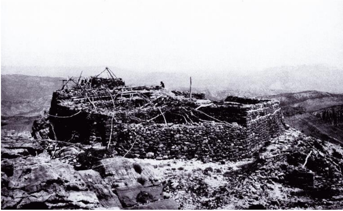
Resim 8: Sefine; Hz. Nuh'un Gemisinin İndiği Yer, Gertrude Bell'in Çekiminden, 1910 (docplayer.biz.tr)

ziyaret tepesi” yer alır. Ziyaret tepesinin ortasında etrafı taşlarla çevrili bir alan ise “Sefine” yani gemi ismiyle bilinir. İslamiyet’ten önce Sasani topraklarında yaşayan Doğu Süryaniler, yani Nasturiler, sefine bölgesinde “Geminin Manastırı” adında bir mabet yapmışlardır. Mezopotamya’da İslam’ın yayılması ile bu manastırın yerine “Sefinet Nebi Nuh” adında bir mescit yapılmıştır (Arpa ve Dilek, 2014: 113).