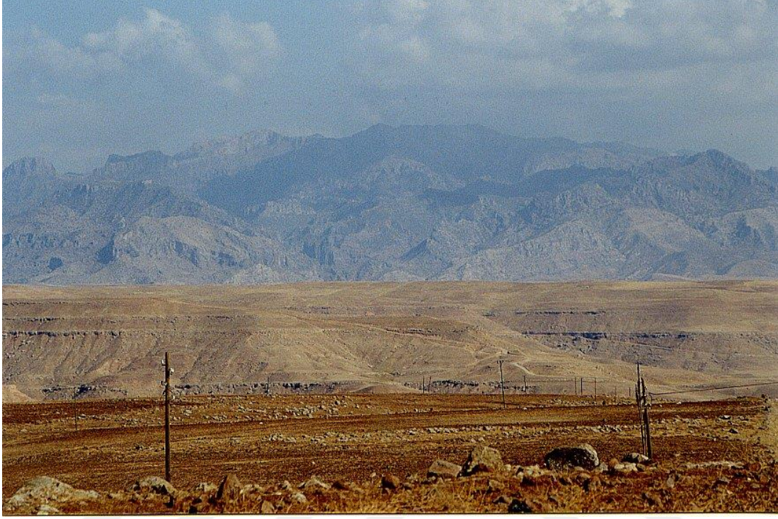
Resim 6: Cudi Dağı'nın Uzaktan Görünümü (Pakman, 2016: ?)

ya da topluluğa gönderildiği anlaşılmaktadır. Bu da tufan olayını belli bir topluluğun yaşadığını, tufan olayının evrensel olmadığını göstermektedir.