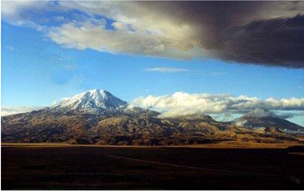
Resim 4: Tevrat'ta Geçen Ararat Dağı Olduğu İddia Edilen Ağrı Dağı 6