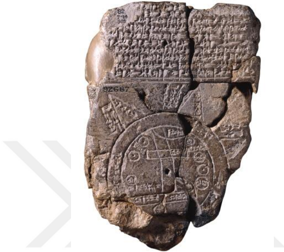
Resim 2: Babil Dünya Haritası ( www.uralakbulut.com.tr )

Haritanın hemen üstünde ve tabletin arka yüzündeki çivi yazılarında Babil dünyasına ait bazı bilgiler yer almaktadır. Ön yüzde çeşitli şehir ve yer isimlerinden söz edilmiştir. Arka yüzde okyanusun çevresinde çizilmiş olan (üçü gözlenebilir, dördü kırılmış durumda) Yedi Ada'ya ilişkin bilgiler yer almaktadır: Örneğin adaların tümünün Babil'e olan uzaklığı eşittir, Okyanusun ötesindeki yerlerde efsanevi canavarlar yaşamaktadır ve bu adalardan beşincisi (en üst noktada olan) "güneşin görünmediği yer"dir (Özcan, 2013: 59). Ryan ve Pitman (2011: 289)'a göre bu harita Tufan'dan kurtulan Nuh'a atfedilen yeni vatanını göstermektedir. Köksoy (2003: 99)'a göre ise haritanın kuzeybatısında "Habban" olarak geçen yer, "Harran"dır. Dolayısıyla tufandan sonra Nuh'un yerleştiği bölge Harran'dır.