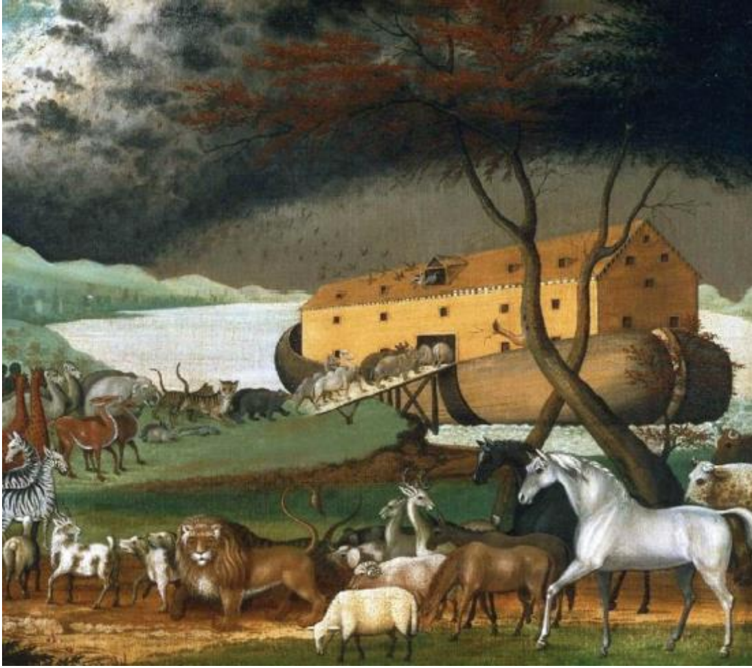
Resim 5: Ressam Edward Hicks'e Ait, Nuh'un Gemisine Hayvanların İkişer İkişer Alınışını Gösteren Tablo (Yaman, 2015: 61)

Şu halde Tevrat'a göre tufan, insan türünün tümünü kapsamakta ve Tanrı tarafından yeryüzünde yaratılmış olan bütün canlı varlıklar ortadan kaldırılmış olmaktadır. Yine ona göre, bütün insanlar, Hz. Nuh'un üç oğlu ile onların üç karısından türemiş olmalıdırlar. Öyle ki, bu olaydan yaklaşık üç asır sonra doğan Hz. İbrahim, çeşitli toplumlar halinde yeniden düzenlenmiş bir insanlık bulmuş olmalıdır. Bu teşkilatlanmanın, bu kadar az bir zamanda meydana gelebilmesi pek olası gözükmemektedir. Tarihi verilere göre de Tevrat'ta belirtildiği gibi tufan şayet İbrahim peygamberden üç asır önce meydana gelmiş olsaydı, m.ö. 21. ve 22. yüzyıllarla tarihlendirilebilirdi. Fakat bu yüzyıllara bakıldığında uygarlıkların yeryüzünden tamamen silindiği değil, pek çok uygarlığın yeşerdiği bir dönem olduğu dikkat çekmektedir. Örneğin Mısır için bu devir, Orta İmparatorluk öncesine rastlayan dönemdir (m.ö. 2100 yılı). Yani yaklaşık olarak, 11. sülaleden birinci ara