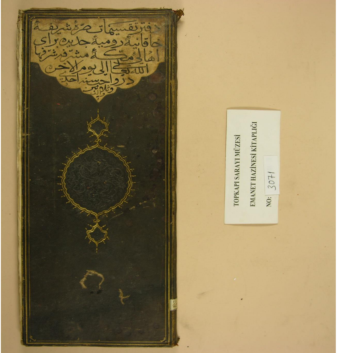
Resim 4: Çalışılan surre defterinin kapak sayfası