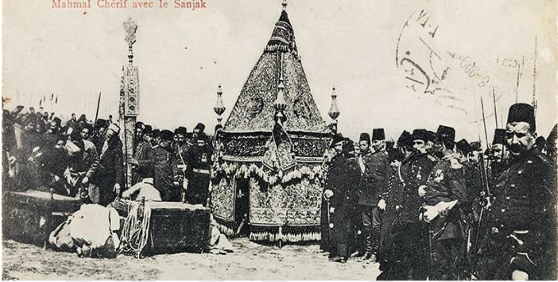
Resim 3: Mahmel-i Şerif

Mahmel Arapça haml'dan gelmektedir. İki kişinin oturmasına imkan sağlayan bir nevi sepettir. 68 Aynı zamanda her yıl Hac döneminde hacı kafilesi ile Haremeyn bölgesine gönderilen hediyelerdir. 69