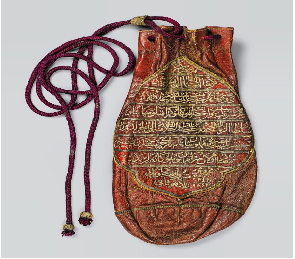
Resim 1:Surre Kesesi

Akça kesesi, para çıkımı 10 anlamına gelen surre kelimesi terim olarak her yıl hac döneminden önce genellikle Mekke ve Medine halkına dağıtılmak için yollanan para, altın, kürk, inci, giyecek, yiyecek ve diğer eşyaları ifade eder. 11 Surre kelimesinin çoğulu “surer”dir. 12 Padişahlar tarafından gönderilen surrenin diğer bir adı da mâlumiye'dir. 13