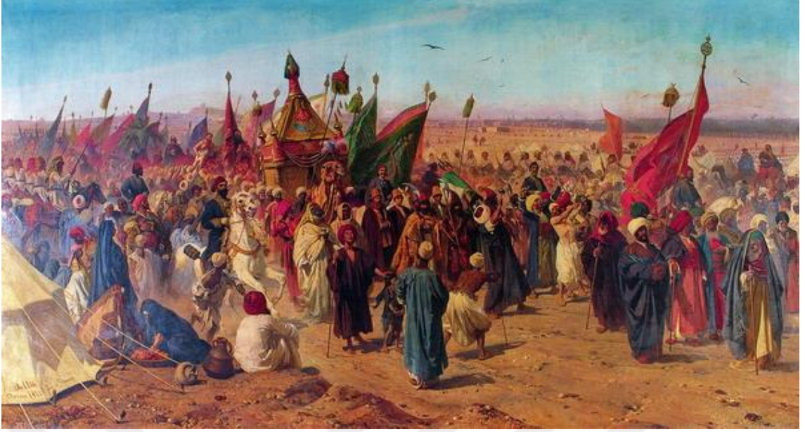
Resim 2:Surre Alayı

( https://www.google.com/search?q=surre+alay%C4%B1&source=lnms&tbn=isch&sa=X&ved=0ahUKEwja2bSb1KDhAhWmxQBHaTFBQwQ_AUIDigB&biw=1350&bih=608#imgrc=KiN51egA_ZxHaM: e.t.26.03.2019 )