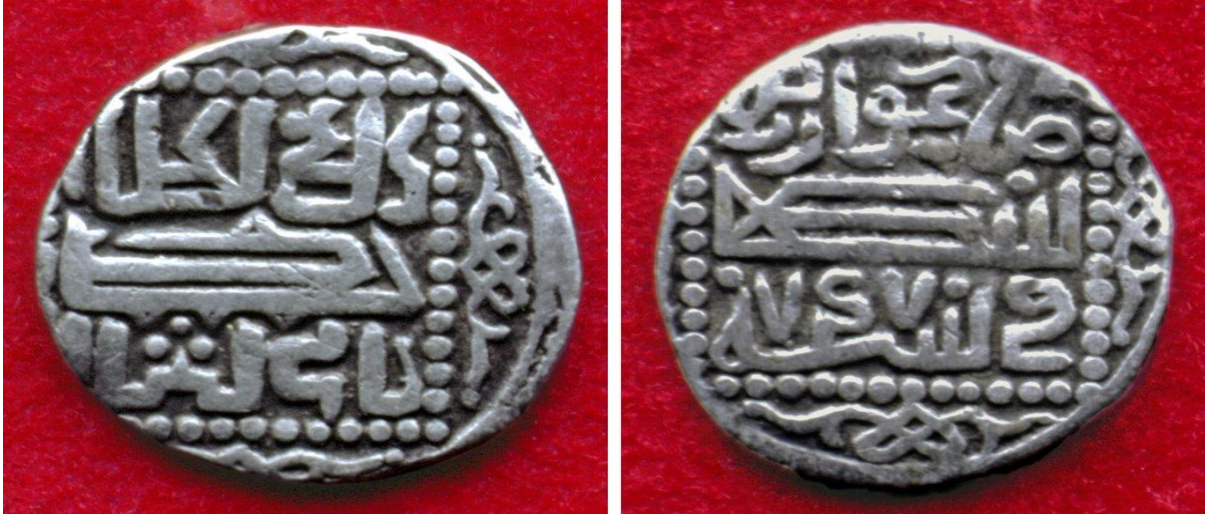
Ek 8: Canıbeg Han adına basılmış Altın Orda Devleti parası (1346)

https://www.google.com/search?rlz=1C1SQJL_trTR856TR856&q=alt%C4%B1n+orda+paralar%C4%B1&tbm=isch&source=univ&sa=X&ved=2ahUKEwi718CX663jAhU56KYKHskpBYAQsAR6BAgGEAE&biw=1366&bih=657#imgrc=OkHnro_bNpRloM: