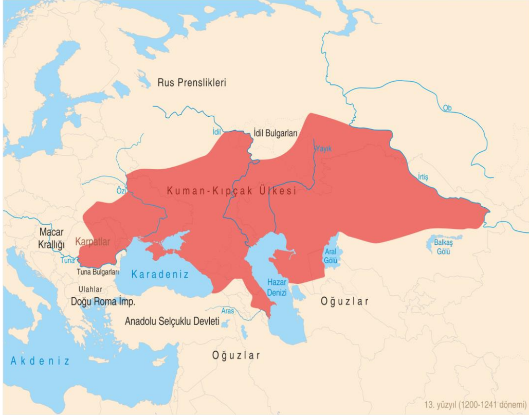
Ek 5: Büyük Deşt-i Kıpçak Haritası

https://www.google.com.tr/search?q=alt%C4%B1n+orda+devleti+haritas%C4%B1&biw=1366&bih=677&source=lnms&tbn=isch&sa=X&ved=0ahUKEwjC_NKW7frRAhWCCMAKHTbLBBkQ_AUIB#imgc=pZYVULCl4hDjcM: