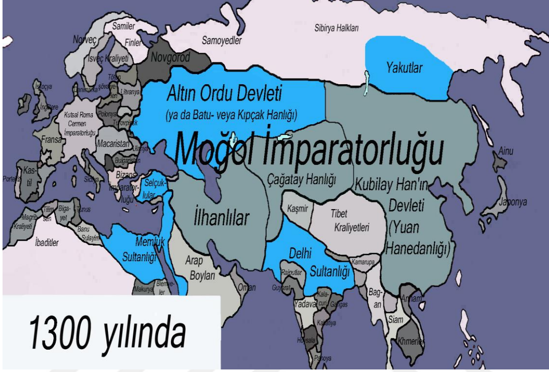
Ek 1: Büyük Moğol İmparatorluğu Haritası

https://www.google.com.tr/search?q=alt%C4%B1n+orda+devleti+haritas%C4%B1&biw=1366&bih=677&source=lnms&tbn=isch&sa=X&ved=0ahUKEwjC_NKW7frRAhWCCMAKHTbLBBkQ_AUIBigB#imgrc=pZYVULCl4hDjcM: