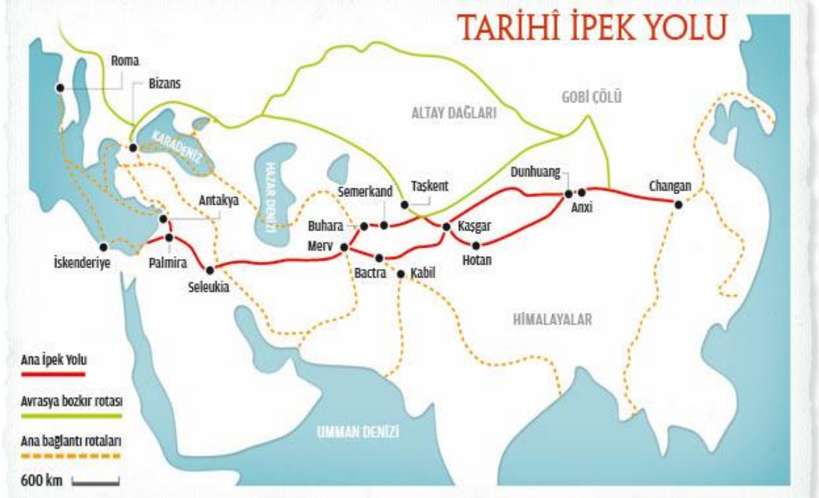
Ek 6: İpek Yolu Haritası