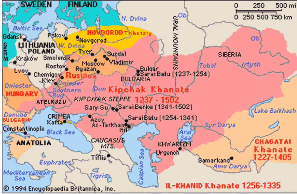
Ek 4: Altın Orda Devleti ( Kıpçak Kağanlığı) Haritası-2

( https://www.google.com.tr/search?q=alt%C4%B1n+orda+devleti+haritas%C4%B1&biw=1366&bih=677&source=lnms&tbn=isch&sa=X&ved=0ahUKEwjC_NKW7frRAhWCCMAKHTbLBBkQ_AUIBigB#imgrc=pZYVULCl4hDjcM: )