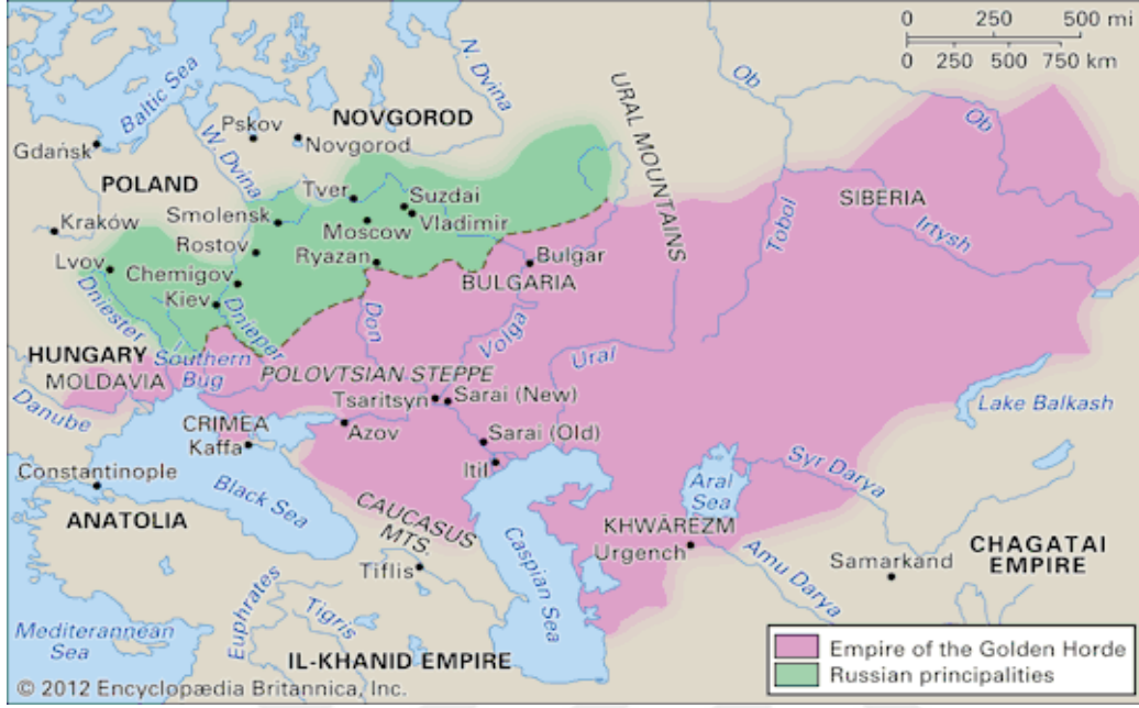
Ek 3: Altın Orda Devleti Haritası