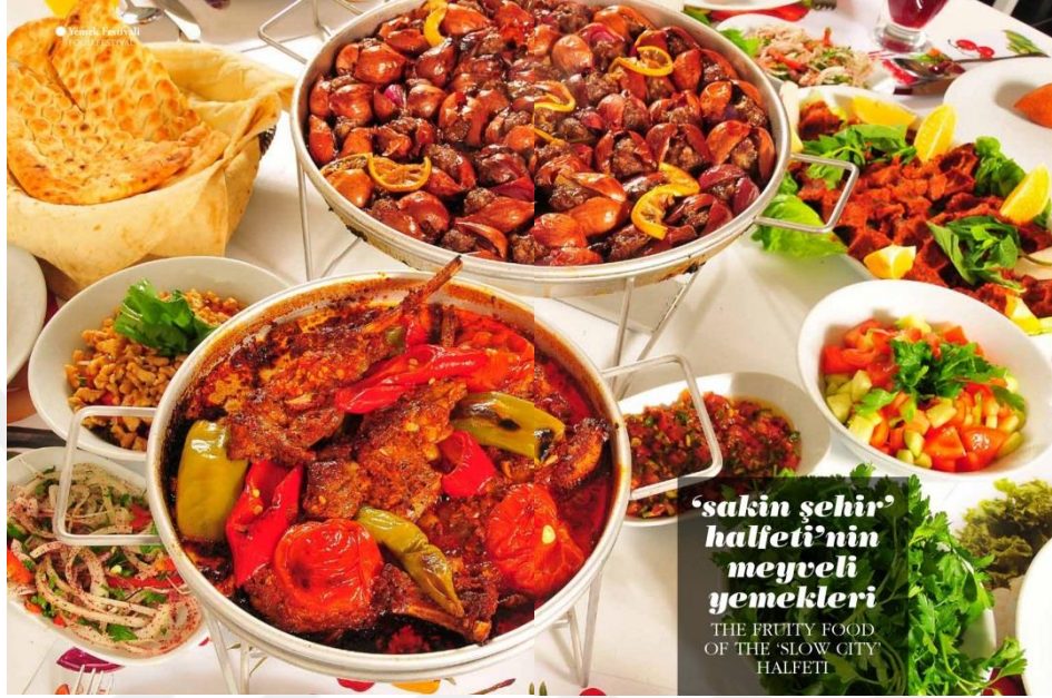
Fotoğraf 10: Sakin Şehir Halfeti’de Meyve Yemekleri Festivalinden Bir Kare

mirası canlı tutularak yaşatılmaya ve tanıtılmaya çalışılmaktadır. Bu tür organizasyonlarla amaçlanan ilçede özgün yerel kültürün popüler tüketim kültürü karşısında tutunabilmesini sağlamak olarak değerlendirilebilir.