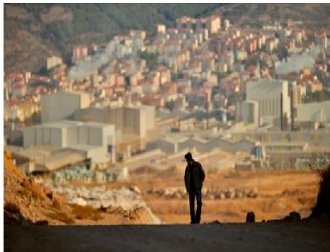
Resim 3.38. Ahlat Ağacı/Sinan'ın yaşadığı kasaba

Film, Çanakkale'nin Çan ilçesinde geçmektedir. Filmin temel mekânı da burasıdır. Küçük, sıkıcı ve durağan olan bu taşra ilçesi karakterlerin sınırlarını da belirlemektedir. Özellikle taşra, Sinan için memnun olunmayan ve bir an önce kaçıp kurtulmak istenen mekânsal bir söyleme sahiptir. Kentin gösterişinden ve imkânlarından uzak olan bu mekânın küçük olmasından kaynaklı olarak insanlar birbirini kolayca tanımaktadır.