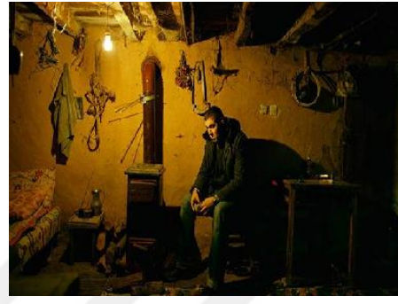
Resim 3.40. Ahlat Ağacı/Köy evi

Filmin bir diğeri önemli mekânı da İdris'in bir kaçış olarak sığındığı köy evidir. Taşra ev yapısının özelliklerini barındıran bu ev, eski, tek katlı ve oldukça küçüktür. Sinan ne kadar taşradan kaçmaya çalışsa da babası taşraya köyüne dönme arzusu içerisinde. Filmin sonunda ise Sinan'ın başlangıçtaki taşradan kurtulma isteğinin evrilip taşraya sığınma haline dönüştüğü gözlemlenmektedir.