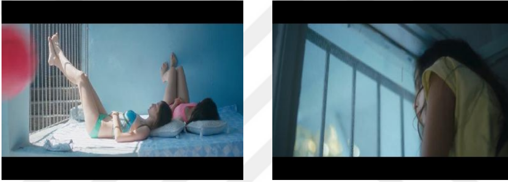
Resim 3.31. Mustang /Tutsaklık

Karadeniz İnebolu’da çekilen film, genel olarak kızların yaşadığı evde geçmektedir. Bölgede sıklıkla görülen ahşap ev filmin de temel mekânıdır. Evin birkaç katlı olması ise özel alandaki hiyerarşik yapıyı göstermektedir. Erkek ve kadının bu özel alan içerisinde belirlenen sınırlar dâhilinde alanları belirlenmektedir. Kızların arkadaşlarıyla oyunu sonrası ev bir hapisane görünümü almaktadır. Tellerle ve parmaklıklarla çevrilen evde kızlar sınırlandırmakta, baskılanmakta ve istismar edilmektedir. Bu yüzden kızların kaçmalarını önlemek için yapılan müdahaleler ile kaldıkları ev bir baskı mekânına dönüşmekte, onların tutsaklığını göstermektedir. Evin etrafına saran teller ve duvarlar da muhafazakârlığı simgelemektedir.