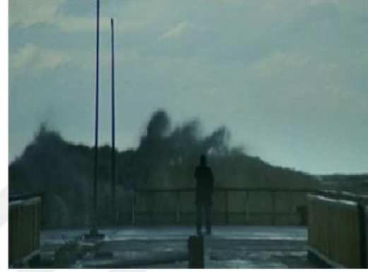
Resim 3.4. Sonbahar/Deniz durgun ve sakin Resim 3.5. Sonbahar/Deniz dalgalı ve hırçın

Filmin önemli mekânlarından birisi de iskeledir. Burada Yusuf'un duygu durumu deniz metaforu ile verilmiştir. Karakterin ölümünü beklediği ve hayattan kendini soyutladığı, içine kapanık durumda olduğu zaman deniz sakin ve durgun, Elka ile yakınlaşmaya başlayıp ona âşık olduktan ve onu kaybettikten sonra deniz dalgalı ve hırçın gösterilmiştir.