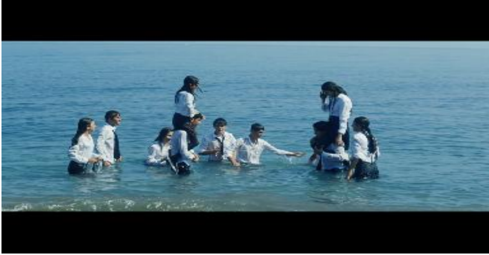
Resim 3.32. Mustang /Taşrada ahlaksızlığa bakış

Kızların amcaları da akşam eve geldiğinde Lale ve Nur (yaşları küçük olduğu için) dışında diğerlerini odada toplayarak “ Hanginizdi o? Yoksa hepiniz miydiniz? Hanginiz orospuluk yapıyor lan? Yoksa hepiniz mi? ” diyerek sabah babaanneleri gibi şiddet uygulamaktadır. Fakat bu sefer kızların babaanneleri oğlunun elinden onları kurtararak ona tokat atar. Adam “ Anne bu kızlar bozuk çıkarsa sorumlusu sensin ” diyerek karşılık verir. Amca’nın bu cinsiyetçi söylemi kadını bekâret üzerinden değerlendirerek değersizleştirmektedir. Sabah olduğunda amcaları kızları doktora götürmektedir ve Sonay, Selma ve Ece’ye bekâret testi yaptırmaktadır. Hastaneye girmeden önce de Ece’nin ağzındaki sakızı atmasını söylemektedir. Çünkü bir kadının toplum içinde sakız çiğnemesi ayıp karşılanmaktadır. Bu esnada kızların babaannesi evde Petek Hanımla dertleşmektedir. Komşu kadın oğlunun haklı olduğunu ve kadının babaannelik yapamadığını söylemektedir. Petek Hanım taşranın kadına biçtiği rolleri benimsemiş biri olarak babaanneye torunlarını namuslu yetiştirmediğinden dolayı tepki göstermektedir. Kızlar eve geldiklerinde ise amcaları bekâret testi sonuçlarını annesine verir ve kadın sonuçların temiz çıktığını görür. Kızlara sarıldığında Selma ona doktora göndermek zorunda olmadıklarını söyler. Kadın “ Hakkında en ufak bir kuşku olsaydı imkânı yok evlenemezdin yavrurum ” diyerek cevap verir. Bu sahnede de kadınlığın bekâret ve evlilik üzerinden tanımlandığı görülmektedir.