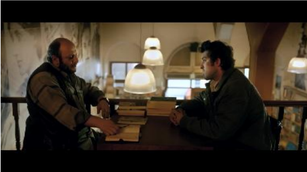
Resim 3.43. Ahlat Ağacı/Taşra üzerine bir tartışma

Taşraya karşı belirgin olan söylemler, Sinan'ın KPSS sınavına girdikten sonra gittiği kitapevinde tanınmış bir yazar olan Süleyman Bey'in yanına gidip sohbet