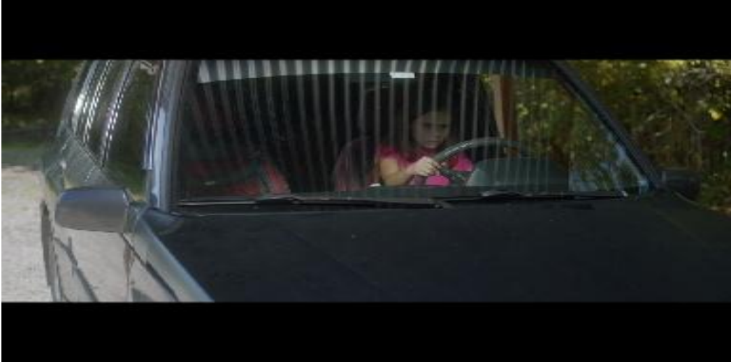
Resim 3.36. Mustang /Evden kaçma çalışmaları

tepki göstermemekte, filmin başında gördüğümüz Petek Hanım gibi sadece bunu bir dedikodu malzemesi haline getirmektedir. Bu sahne filmdeki bir diğer tutarsızlıktır. Dedikodu küçük yerleşim yerlerinde yaşayan insanlar için her ne kadar bir yaptırım unsuru olsa da filmin başından beri gösterilen taşranın burada yaşayanları baskılaması durumu göz önünde bulundurulduğunda Ece'nin etrafı kalabalıkken arabada sevişmesi böyle bir ortam için pek mümkün gözükmemektedir. Bu da başından beri filmin sorunlu anlatımına işaret etmektedir. Ece'nin bu hareketleri sergilemesinin sebebi ise amcasından gördüğü cinsel istismardır. Gece kızların odasına gelerek Ece'yi istismar eden amcaları filmin başından beri sergilediği muhafazakâr ve tutucu tutumuyla da çelişmektedir. Yönetmen bir nevi taşrada namussuzluk ve ahlaksızlık olarak nitelendirilen hususları gerçekleştirenlerin yine taşralı olduğu mesajını amca üzerinden vermektedir.