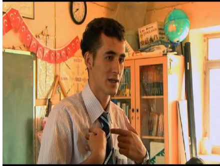
Resim 3.24. İki Dil Bir Bavul/Kürtçenin yasaklanması

İlk gün okula öğrencilerden hiçbiri gelmemiştir. Emre tek tek öğrencilerin evlerine gitmektedir ancak hiçbirini evde bulamamaktadır. Çocuklar tarlada çalışmaktadır. Taşrada geçim çoğunlukla tarımla sağlanmaktadır ve küçük büyük demeden evin her üyesi çalışarak eve katkı yapmaktadır. Emre'nin öğrencilerinden olan Eyüb'ü bularak yarın okula gelmeleri gerektiğini söylemesi ile çocuklar ertesi sabah hazırlıklarını yaparak okula gelmektedir. Okulda tek bir sınıf olmasından dolayı Emre 1. Sınıftan 5. Sınıfa öğrencileri gruplayarak ayrı sıralara oturtmaktadır. Emre ilk olarak öğrencilere “ Türkçe biliyor musunuz? ” diye sormakta, öğrenciler ifadesiz bir şekilde öğretmenlerinin yüzüne bakmaktadır. Karakterin yaşadığı ikinci kırılma da taşra da yaşadığı iletişimsizliktir. Emre öğretmen Türkiye toprakları içerisinde olmasına rağmen tamamıyla kendisine yabancı olan bir yerdedir. Öğrencilerini tanımak için sorduğu sorularda söyledikleri isimler ona çok garip gelmektedir. Örneğin bir öğrencisinin ismi Rojda, annesinin ismi ise Hanuz'dur. Emre ise isimleri duyduğunda “ O ne ya? ” diye tepki vererek bulunduğu yere olan yabancılığını ifade etmektedir. Oysa o yöre insanı için bu isimler çok normaldir. Emre'nin öğrencilerine yönelik yabancılığının yanında öğrencileri de öğretmenlerini, konuşması ve giyimiyle kendilerine yabancı görmektedir.