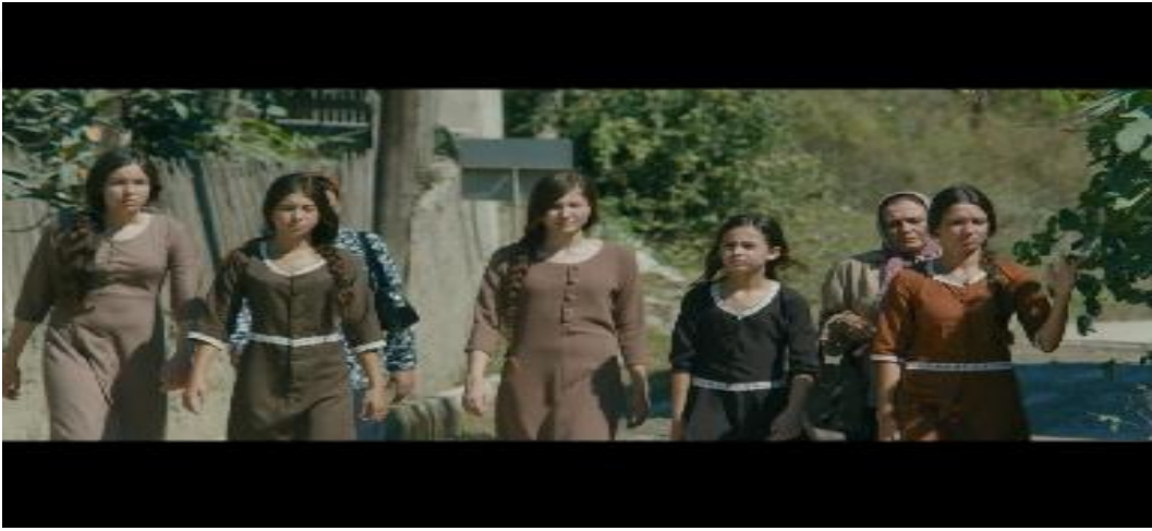
Resim 3.34. Mustang /Kızlar kasaba meydanında

Babaannesi ise kızları televizyondan görüp fenalık geçirir. Evdeki kadınlar, amcasının kızları televizyonda görüp şiddet uygulamaması için önce evin daha sonra kasabanın elektriğini keserler. Babaannesi de dâhil evdeki diğer kadınlar kızlara yardım etmiş olmasına rağmen beş kardeş evden kaçmanın bedelini eve döndüklerinde ağır ödemektedir. İlk olarak babaanne kızları limonata içme bahanesiyle kasaba meydanına götürmekte ve kızlar sanki bir malmış gibi potansiyel alıcıların karşısına çıkarmaktadır. Daha sonra da işçiler çağırıp evin etrafına duvarlar ördürerek kızların evden kaçmalarına karşı önlem almaktadır. Leyla'nın da anlatımıyla kızların kaldığı ev gerçek bir hapis hayatına dönüşmektedir.