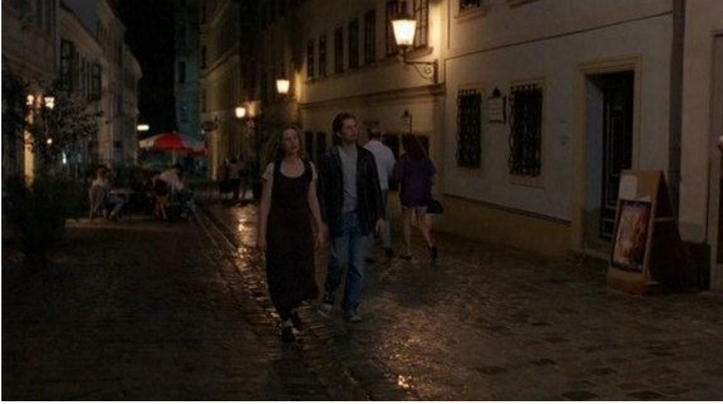
Resim 1.3. Before Sunrise, Richard Linklater, 1995.

Asıl eleman olarak kullanılan sinema mekânı ise filmin senaryo ve kurgusunu yönlendirme gücüne sahiptir. Bu tarz filmlerde sinemasal mekân filmin ana karakteri gibi davranmaktadır. Mekân filmle bütünleşmiş bir yapıdadır ve filmin ayrılmaz bir parçası olmaktadır (Köksal, 2015: 58). Örneğin; Before Sunrise (1995) filmi Viyana’da geçmektedir ve filmin mekânı anlatı yapısını da etkilemektedir. Karakterler Viyana sokaklarında dolaşırken, Viyana’yı beraber keşfederken izleyici de onlarla birlikte şehri deneyimlemektedir (Resim 1.3).