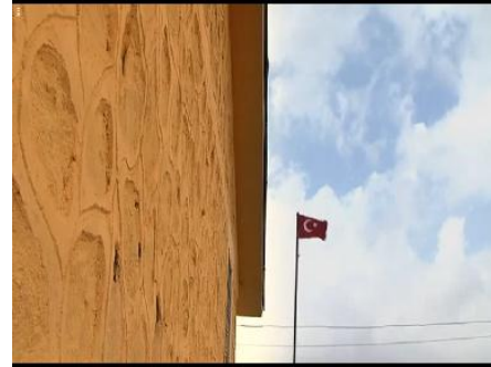
Resim3.25. İki Dil Bir Bavul/Türk Bayrağı

Öğrencileri ile tanışmak konusunda başarısızlığa uğrayan Emre, sınıf kurallarını sayarken ilk dediği şey sınıfta Kürtçe konuşulmasını istemediğidir. Emre'nin “ Kürtçe konuşmayın ” dedikten sonra alt açıdan dalgalanan Türk bayrağının ihtişamlı görüntüsü verilmektedir. Zafer Toprak (2012: 560), 1925'e kadar Kürtçe konuşulmasının Türk topraklarında bir problem teşkil etmediğini ancak Şeyh Sait isyanıyla birlikte Kürtçenin devletin ücra yerlerinde konuşulan bir dil olarak kaldığını ve bu halka Dağ Türkleri