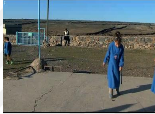
Resim 3.27. İki Dil Bir Bavul /Emre'nin çaresizliği ve yalnızlığı

Her ne kadar çocuklar çaba sarf etse de Emre istediği sonucu bir türlü alamamaktadır ve çaresizliğe kapılmaktadır. Bir gün teneffüs vaktinde diğer çocukların oyununa katılmayan öğrencilerin yanına giden Emre, “ Niye oynamıyorsunuz siz? Anlamıyorsunuz mu hiçbir şey? Anlamıyorsunuz de mi? İyi ben de sizi anlamıyorum zaten. Napacaz? ” diyerek içinde bulunduğu sıkıntılı ve zorlu duruma da bir nevi isyan etmektedir. Aslında Emre'nin iletişimsizliği sadece öğrencileri ile değildir. Onun iletişimsizliğinin bir sebebi de alışamadığı ve uyum sağlayamadığı bu ortamdır. Buradaki iletişimsizlik tek taraflıdır. Emre'nin çaba sarf ettiği tek şey öğrencilerine Türkçe öğretmektir. Fakat buradaki insanları anlamaya çalışmak konusunda bir çaba sarf etmemektedir. Öğretmenin beklediği şey kendisinin anlaşılması olmaktadır. Bu yüzden Emre ortama bir türlü uyum sağlayamamakta, bahçede öğrenciler oyun oynarken kendisi kıyıda köşede düşünceli bir şekilde oturmaktadır. Emre'nin tek iletişime geçtiği kişi de annesi olmaktadır. Nagihan Haliloğlu, Kürtçe konuşulan yerlere Türkçeyi öğretmek için Kürtçeyi bilen öğretmenlerin gönderilmesi gerektiğini, böylelikle daha başarılı sonuçlar alınacağını söylemektedir. Fakat böyle bir durumda da Emre gibi birçok eğitimcinin ülkede böyle hayatlar yaşandığından