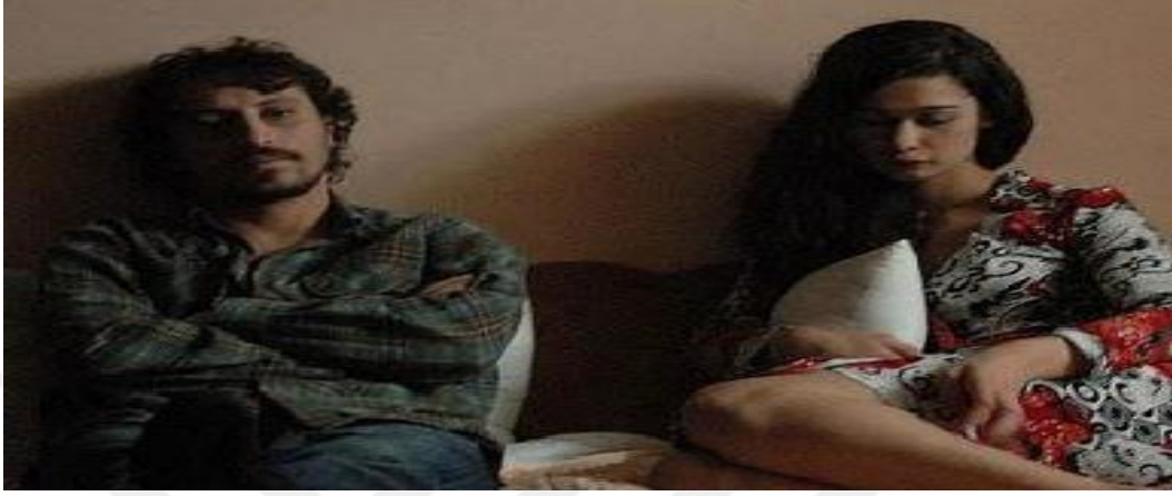
Resim 3.13. Sonbahar /İki ötekinin karşılaşması

dışlanmaktadır. Nuri Bilgin (2007: 187), “Ötekini meşrusuzlaştırma, otomatik olarak kendini meşrulaştırmayı sağlar” demektedir. Yusuf’un, kırtasiyecinin sözlerine sinirlenmesi de kendisi gibi ötekileştirilmiş, dışlanmış Elka ile özdeşleşmesinden kaynaklanmaktadır.