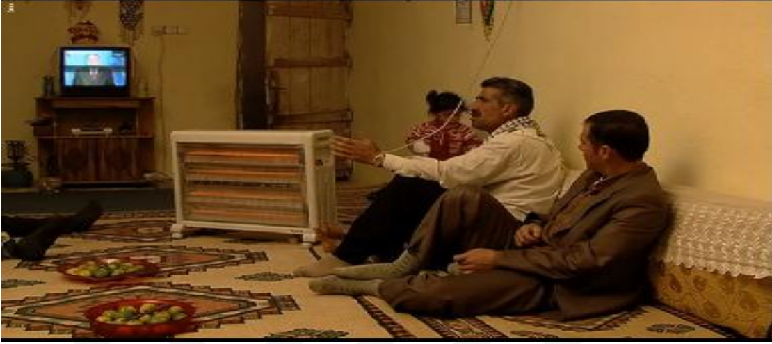
Resim 3.28. İki Dil Bir Bavul/Sorunla yüzleşme