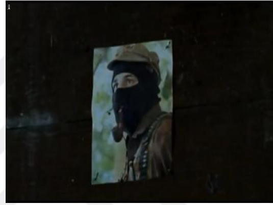
Resim 3.1. Sonbahar / Yusuf’un odası

Yusuf’un hayatını etkileyen Elka ile tanışması ise Mikail’in onu zorla götürdüğü meyhane ortamında gerçekleşir. Mikail’in sarhoş olması sebebi ile kasabada kalmak zorunda olan iki arkadaş geceyi geçirmek için otel odasına geçtiklerinde Elka, Yusuf’un odasına gelir. Yusuf kendisini diğer müşteriler gibi zannedip soyunmaya başlayan Elka’ya istediğinin bu olmadığını söyler ve iki karakter arasında duygusal bir bağ kurulur. Otel odasının bir diğer anlamı da Elka’nın hapsolmuşlüğü göstermesidir. Kadının otel odasının penceresinden dışarıya baktığı sahnelerin sık gösterilmesi de karakterin bir hücre içerisindeymiş gibi hissettiği ruh halini anlamak açısından önemlidir.