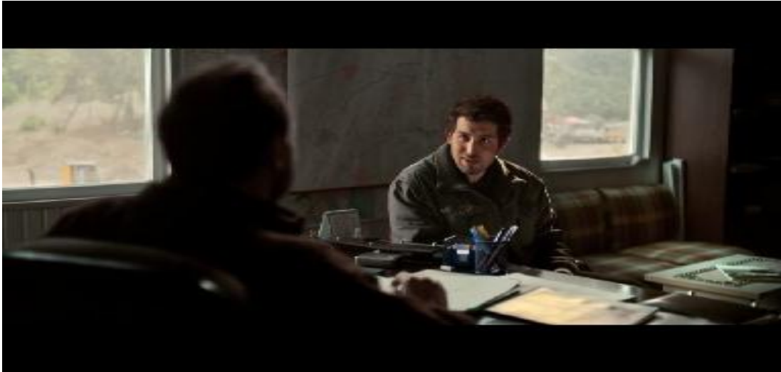
Resim 3.44. Ahlat Ağacı /Sinan'ın çabaları

Sinan'ın alaycı ve küçümseyici tavrı kitabının basımına sponsor olması için gittiği İlhami Bey ile konuşmasında da görülmektedir. Sinan'ın kitabını beğenen İlhami Bey, Çanakkale'deki şehitliğin ve bu tarz milli duyguları pekiştiren mekânların öneminden