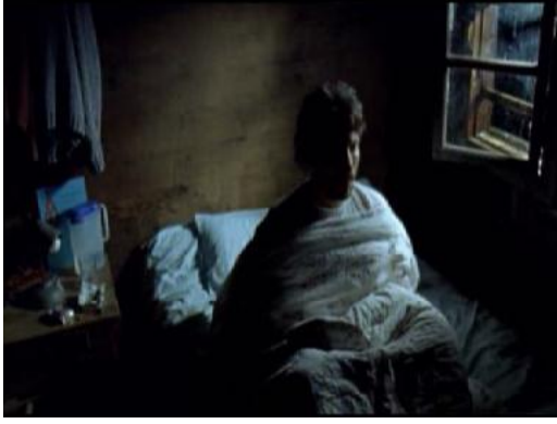
Resim 3.11. Sonbahar/Kâbus