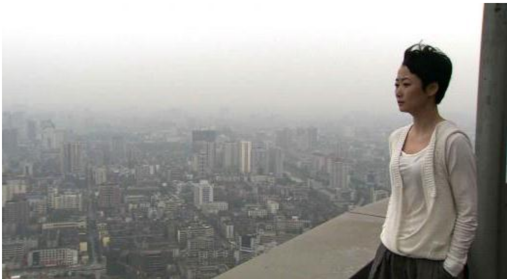
Resim 1.2. 24 City, Jia Zhangke, 2008.

Mekânın yardımcı eleman olarak kullanılmasından kastedilen ise yönetmenin filmde vermek istediği mesaj veya etki ifade edilirken mekânın da diğer elemanlar gibi kullanılmasıdır. Filmde gösterilen her mekân gerçekleşecek olaylar hakkında izleyiciye ipucu vermektedir. Örneğin; bir korku filminde karanlık bir sokağın vereceği tedirginlik hissi ya da diyalogsuz bir sahnede izleyiciye aktarılmak istenen duygu ve düşünce de mekân üzerinden verilmektedir. Özetle izleyici üzerinde oluşturulmak istenen duygu ve düşünce mekânın yardımcı bir eleman olarak kullanımı ile olmaktadır (İnce, 2007: 50-51). Mekanın fon olarak kullanımından farklı şekilde bu yöntemde mekan daha ön plana çıkmakta ve izleyicinin mekan algısını kuvvetlendirerek zihninde yer etmektedir (Resim 1.2).