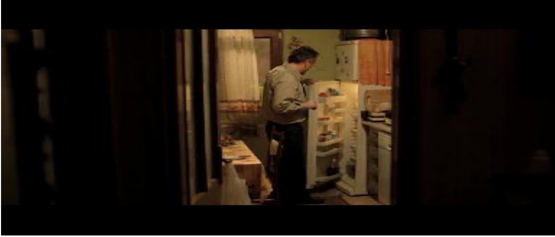
Resim 3.41. Ahlat Ağacı /Babanın umursanmaması