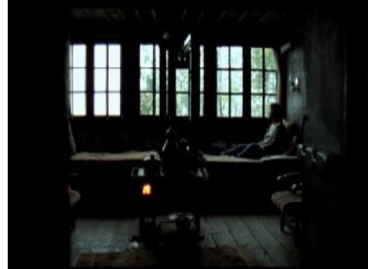
Resim 3.7. Sonbahar/Taşraya hapsolmuşlük Resim 3.8. Sonbahar/Dışarıdaki cezaevi

Yusuf eve geldiğinde annesini divanın üstünde dışarıyı seyredirken bulur. Bu bir anlamda karakterin annesinin de taşraya hapsolmuşlüğüne göstermektedir. Annesinin içerisinde yer aldığı dağ, taş, ev kendi sınırlarını çizmekte ve başka türlü bir cezaevinin içerisinde yer aldığını göstermektedir. Yusuf'un da durumu bundan farklı değildir. Karakterin odasının penceresindeki parmaklıklardan dışarıyı seyredişi onun sınırlılıklarını belirlemektedir. Yusuf'un odasında uyuyamayışı ve uyumak için dışarıya çıkışı da bir