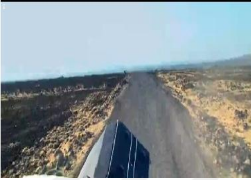
Resim 3.22. İki Dil Bir Bavul /Filmin açılışı

İki Dil Bir Bavul filmi, bir minibüsün taşranın engebeli yollarında ilerlediği görüntülerle başlamaktadır. Kameranın merkezinde Emre öğretmenin bavulu bulunmaktadır. Filmin açılışında ilk olarak Emre'nin bavulunun gösterilmesi bir yandan filmin adına işaret etmektedir, bir yandan da karakterin eşyalarını taşımasının yanında bir kültürü ve yaşam biçimini taşıdığını göstermektedir (Bostan, 2013: 198). Bu açıdan bavul metaforik bir anlama da sahiptir.