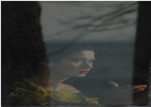
Resim 3.2. Sonbahar /Elka’nın tutsaklığı

Yusuf’un hayatını etkileyen Elka ile tanışması ise Mikail’in onu zorla götürdüğü meyhane ortamında gerçekleşir. Mikail’in sarhoş olması sebebi ile kasabada kalmak zorunda olan iki arkadaş geceyi geçirmek için otel odasına geçtiklerinde Elka, Yusuf’un odasına gelir. Yusuf kendisini diğer müşteriler gibi zannedip soyunmaya başlayan Elka’ya istediğinin bu olmadığını söyler ve iki karakter arasında duygusal bir bağ kurulur. Otel odasının bir diğer anlamı da Elka’nın hapsolmuşlüğü göstermesidir. Kadının otel odasının penceresinden dışarıya baktığı sahnelerin sık gösterilmesi de karakterin bir hücre içerisindeymiş gibi hissettiği ruh halini anlamak açısından önemlidir.