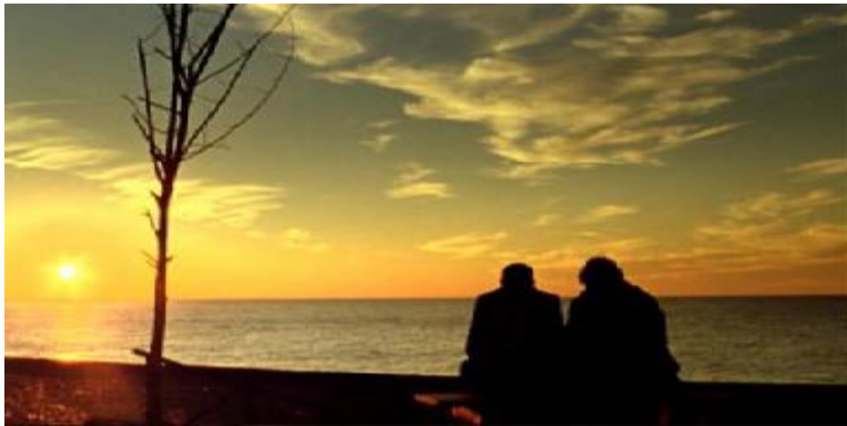
Resim 3.14. Sonbahar /Yusuf ve Cihan buluşması