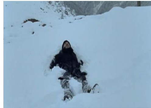
Resim 3.3. Sonbahar /Doğaya teslim olma