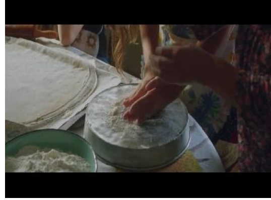
Resim 3.33. Mustang /Taşrada kadından beklenen

Doktor muayenesinden sonra sonuçlar “temiz” çıkmasına rağmen kızlar evin içine hapsedilmektedir. Onların ahlakını bozacak düşüncesiyle dar kıyafetlerden sakıza telefonda bilgisayara her şey yasaklanıp kaldırılmaktadır. Mahallelerindeki diğer kadınlarla birlikte babaannesi kızlara ev temizliğinden yemek yapmaya kadar kısaca nasıl iyi bir ev kadını olmaları gerektiğini öğretmektedir. Lale'nin tabiriyle bu eğitim içlerinden çıkamadıkları bir ev fabrikasıdır. Babaannelerinin onlara daha usturuplu kıyafetler dikip giydirilmesini de küçük kız “ Şekilsiz bok rengi elbiseleri giyme sırası bize gelmişti ” diyerek açıklamaktadır. Bu sahneler filmin adına da bir göndermedir. Mustang yabani, vahşi at anlamına gelmekte ve kızlar babaanne ve komşu kadınlar tarafından ehlileştirilmeye çalışılmaktadır.