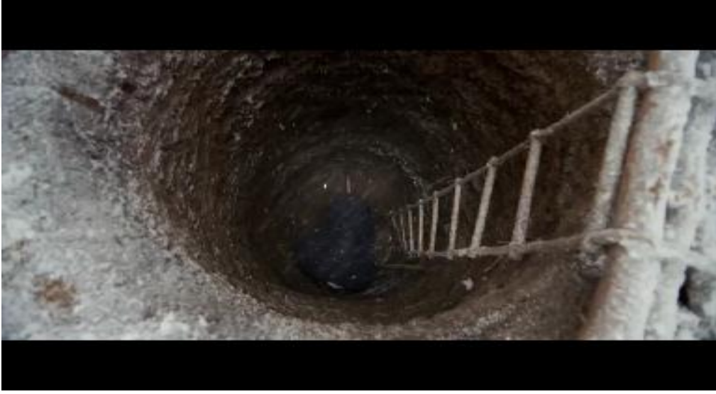
Resim 3.45. Ahlat Ağacı/Kabulleniş

başından beri ilk defa babasını anlamaya çalıştığı görülmektedir. İdris'te Sinan gibi ona dayatılan kurallara uymayan ve yaşadığı yerden uzaklaşmak isteyen bir karakterdir. Fakat İdris'in kaçma isteği merkeze değil taşraya yöneliktir. Orada kendini doğaya teslim etmek istemekte ve kafasında kurduğu ideal yaşamı (kuyudan su çıkarmaya çalışarak etrafı yeşillendirme ve üretime geçme isteği) gerçekleştirme peşindedir. Bu hayali gerçekleştirene kadar da sıkışıp kaldığı mekânda İdris, kaçıışı at yarışı oynamada bulmaktadır. Sinan da babası gibi yaşadığı mekândan kaçmak istemekte ve o da yazdığı romanla bunu gerçekleştirmeye çalışmaktadır.