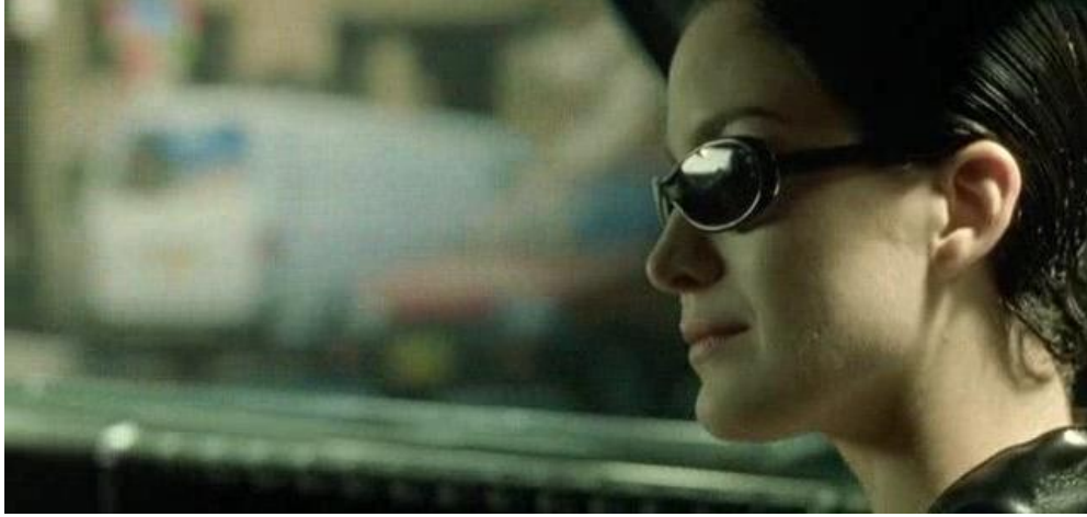
Resim 1.1. The Matrix, Wachowski Brothers, 1999.

Mekânın yardımcı eleman olarak kullanılmasından kastedilen ise yönetmenin filmde vermek istediği mesaj veya etki ifade edilirken mekânın da diğer elemanlar gibi kullanılmasıdır. Filmde gösterilen her mekân gerçekleşecek olaylar hakkında izleyiciye ipucu vermektedir. Örneğin; bir korku filminde karanlık bir sokağın vereceği tedirginlik hissi ya da diyalogsuz bir sahnede izleyiciye aktarılmak istenen duygu ve düşünce de mekân üzerinden verilmektedir. Özetle izleyici üzerinde oluşturulmak istenen duygu ve düşünce mekânın yardımcı bir eleman olarak kullanımı ile olmaktadır (İnce, 2007: 50-51). Mekanın fon olarak kullanımından farklı şekilde bu yöntemde mekan daha ön plana çıkmakta ve izleyicinin mekan algısını kuvvetlendirerek zihninde yer etmektedir (Resim 1.2).