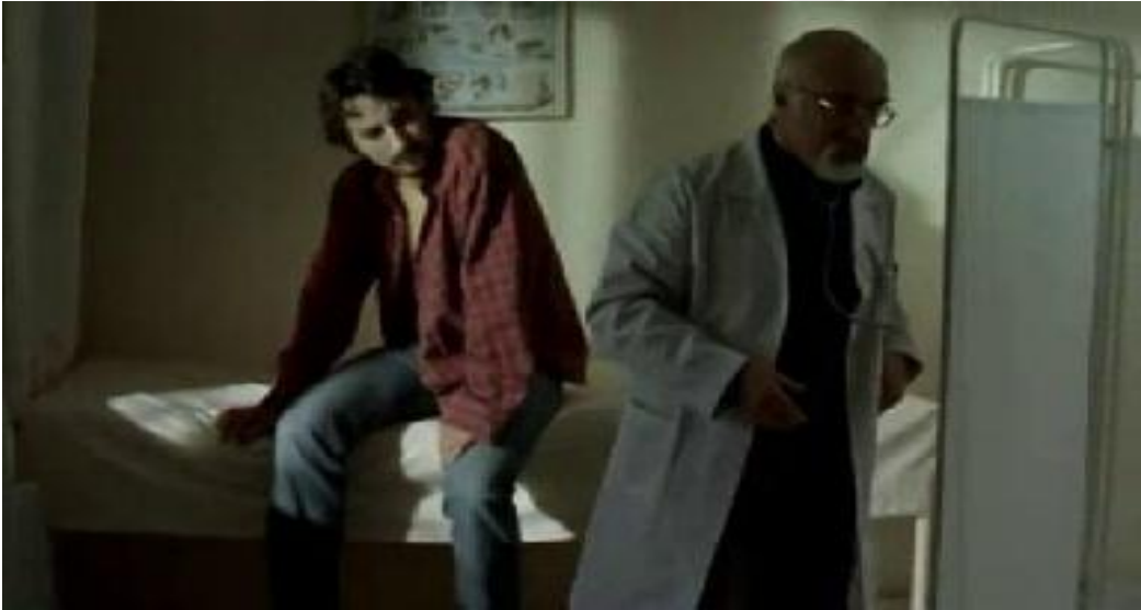
Resim 3.6. Sonbahar /Yusuf'un Hastalığı

egemen güçler tarafından baskılanmakta ve cezalandırılmaktadır. Bu noktada Bauman'ın öne sürdüğü “bahçıvan devlet” kavramını hatırlamakta yarar vardır. Kavram, sistemin dışına çıkanların cezalandırılması ve ötekileştirilmesi adına önemlidir. Yazara göre devlet, toplumdaki ahlaksal davranış kurallarını da belirlemektedir. Bu kurallar kutsal sayılmakta ve bunun dışına çıkanlar ötekileştirilmektedir. Devlet memurları ise bu kurallar çerçevesinde ahlak bekçisi rolüne bürünmekte, var olan düzenin değişmemesi için görevlerini yerine getirmektedir. Bauman (1997: 42, 84 ve 126) modern devleti bir bahçeye benzetmektedir ve zehirli bitkilerin bahçeden temizlenmesi gerektiğini söylemektedir. Devlet de kendisine karşı olan ve zararlı gördüklerini toplumdan ayıklamaktadır. Düzene aykırı olanlar toplum dışına itilmelidir. Bu yollar da işe yaramadığında devlet bu kişileri öldürme yoluna gitmektedir. Hayata Dönüş Operasyonu da bahçedeki ayırık otların ayıklanması için yapılan bir müdahaledir. Filmin ana karakteri de bahçedeki ayırık otlarından biridir ve Yusuf özelinde bir dönemin ötekileştirilmiş gençliğinin travmaları gözler önüne serilmektedir. Ayşe Batur (2011: 9), ülkenin hayata dönemeyen politik atmosferinin 1990'lardan günümüze kadar devam ettiğini söylemektedir.