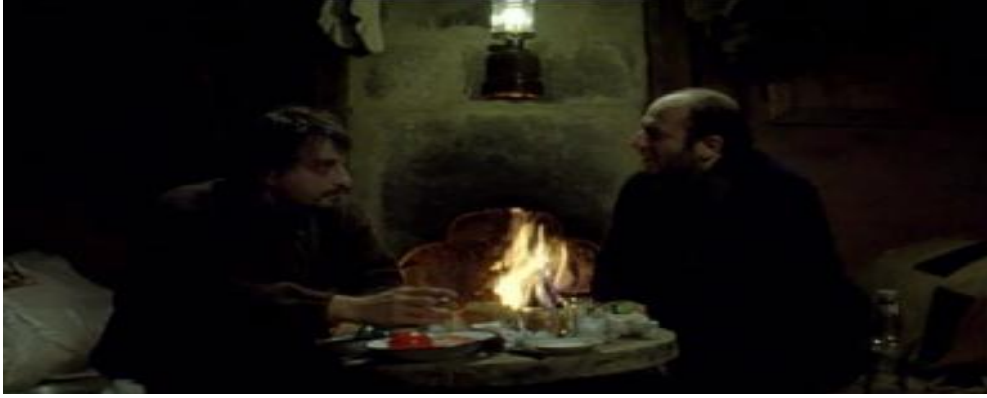
Resim 3.15. Sonbahar /Yusuf ve Mikail'in sohbeti