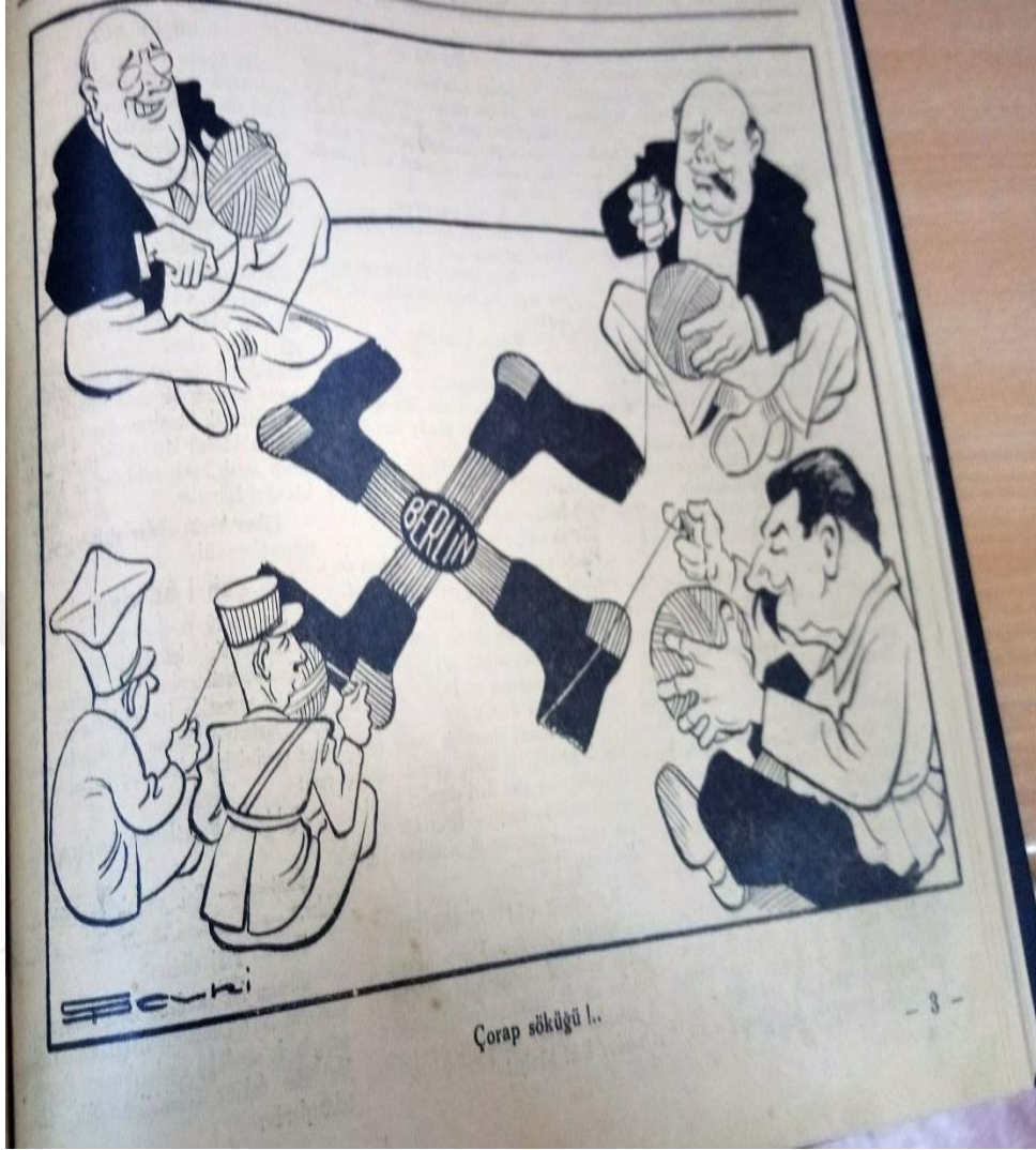
Ek 6: Akbaba Dergisi, 24 Ağustos 1944