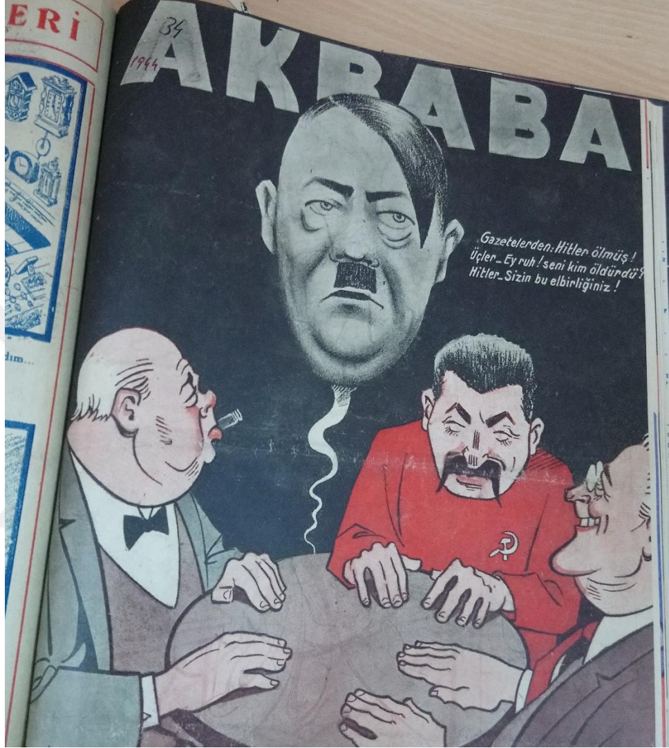
Ek 5: Akbaba Dergisi, 16 Kasım 1944