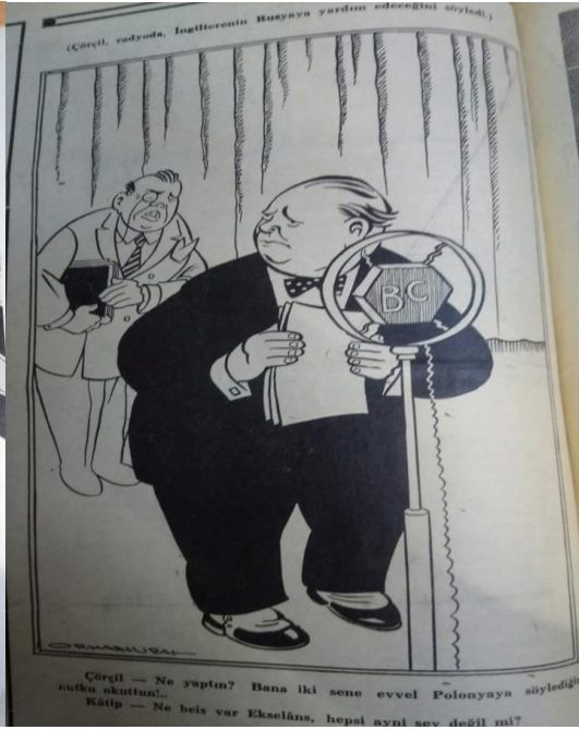
Ek 11: Akbaba Dergisi, 18 Mayıs 1939 Ek 12: Akbaba Dergisi, 3 Temmuz 1941