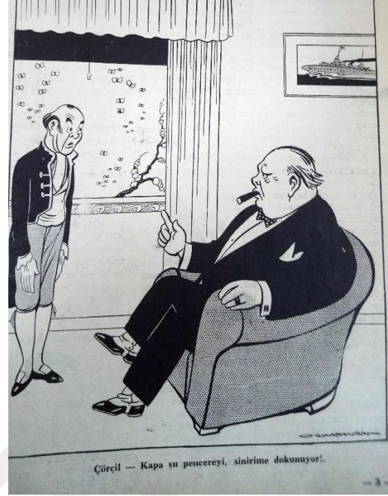
Ek 9: Akbaba Dergisi, 7 Ağustos 1941 Ek 10: Akbaba Dergisi, 5 Haziran 1941