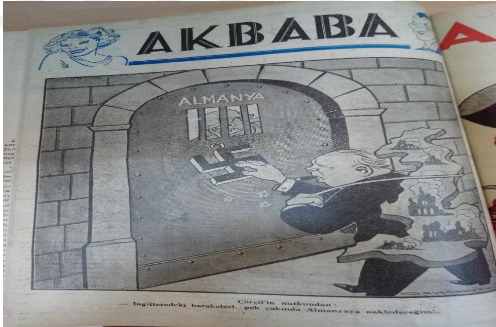
Ek 8: Akbaba Dergisi, 2 Ağustos 1941