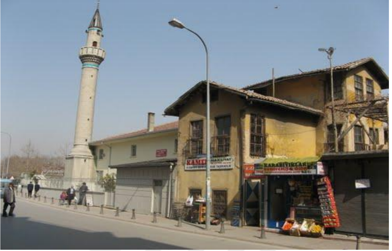
Ekler-1 Kadı İzzeddin Camii