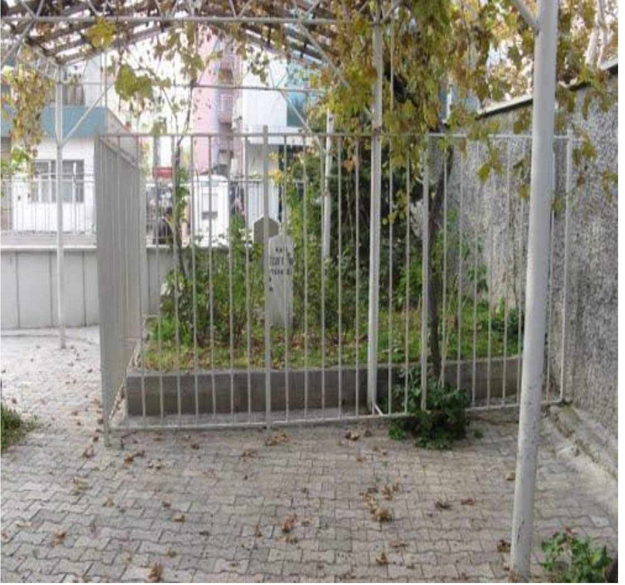
Ekler-2 Kadı İzzeddin Türbesi