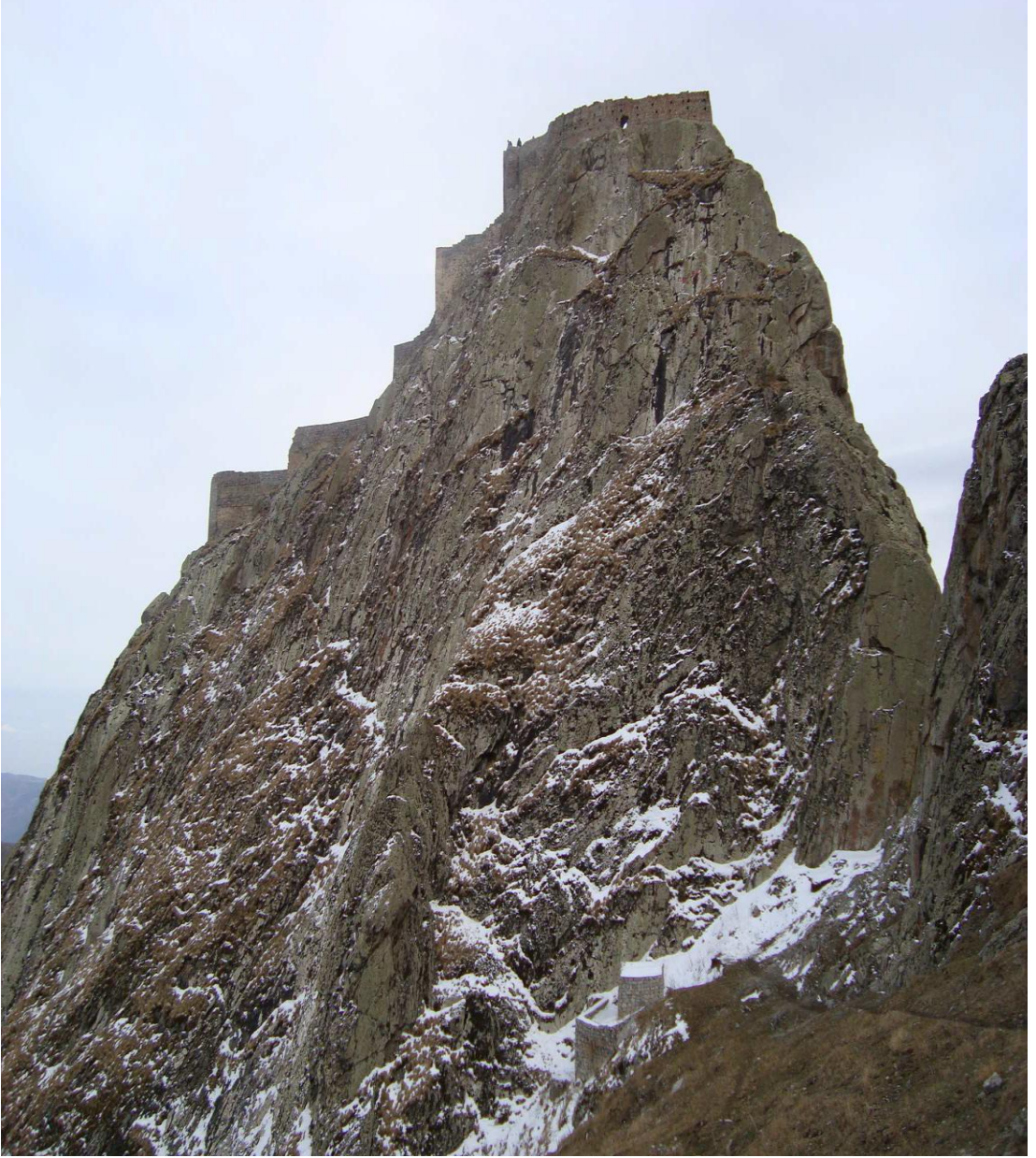
EK:1 Bâbek Kalesi

(Azerbaycan Sovyet Ansiklopedisi, Bâbek, Bakü 1976, s.180)