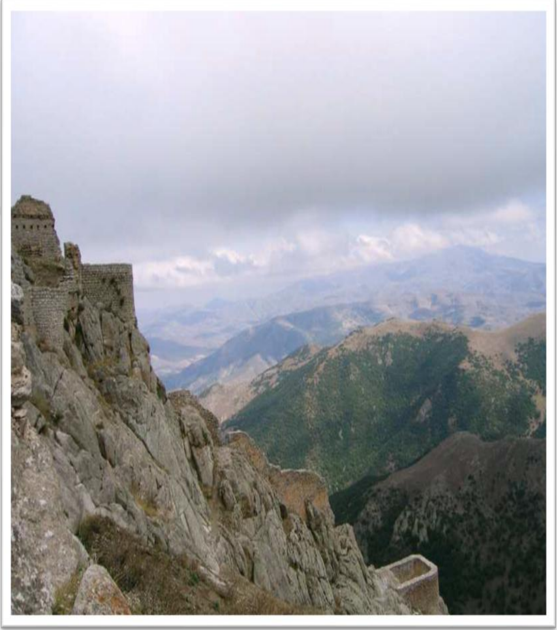
EK 2 : Bâbek Kalesi'nin Farklı Açılardan Görünümü

( https://www.wikiwand.com/tr/Bâbek_(%C5%9Fehir) , Erişim Tarihi: 20.07.2019)