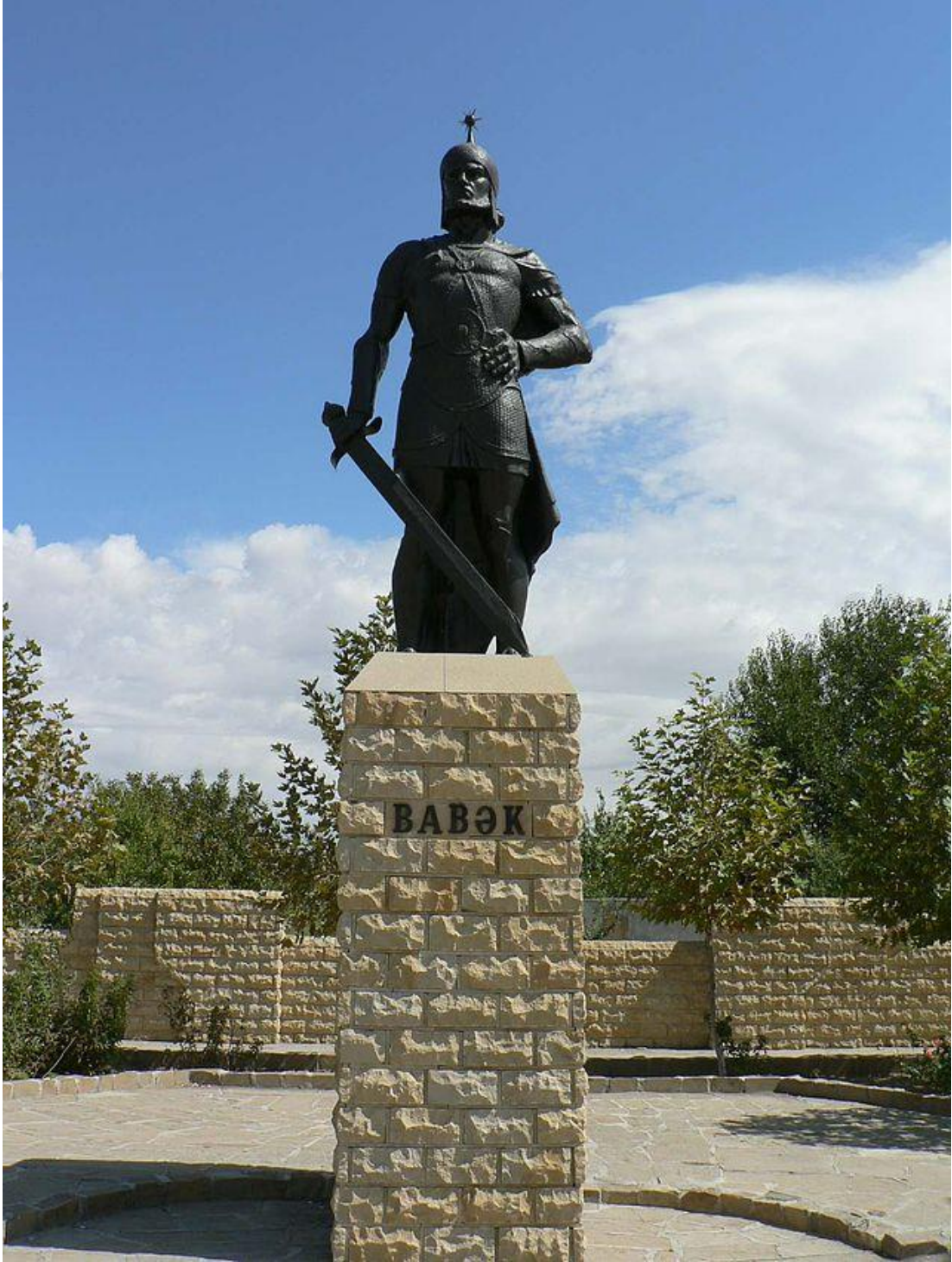
EK:5 Bâbek el-Hürremi'ye Ait Azerbaycan'da Bir Anıt

(Abdullah Işık, “Bâbek Hürremi”, https://abdullahabdurrahman.wordpress.com/2015/07/08/Bâbek-Hürremi-alintidir/ , Erişim tarihi: 20.07.2019)