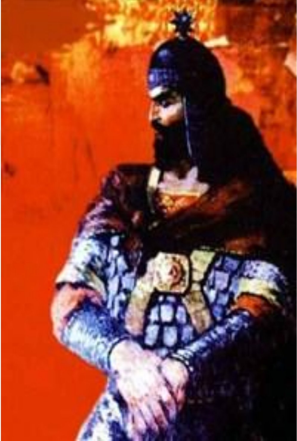
EK:4 Bâbek el-Hürremî'yi Temsil Eden Bir Resim