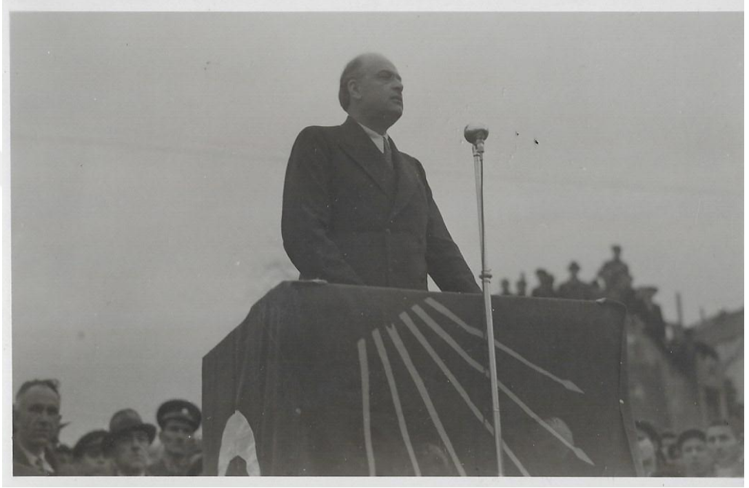
CHP adına bir konuşma yaparken.