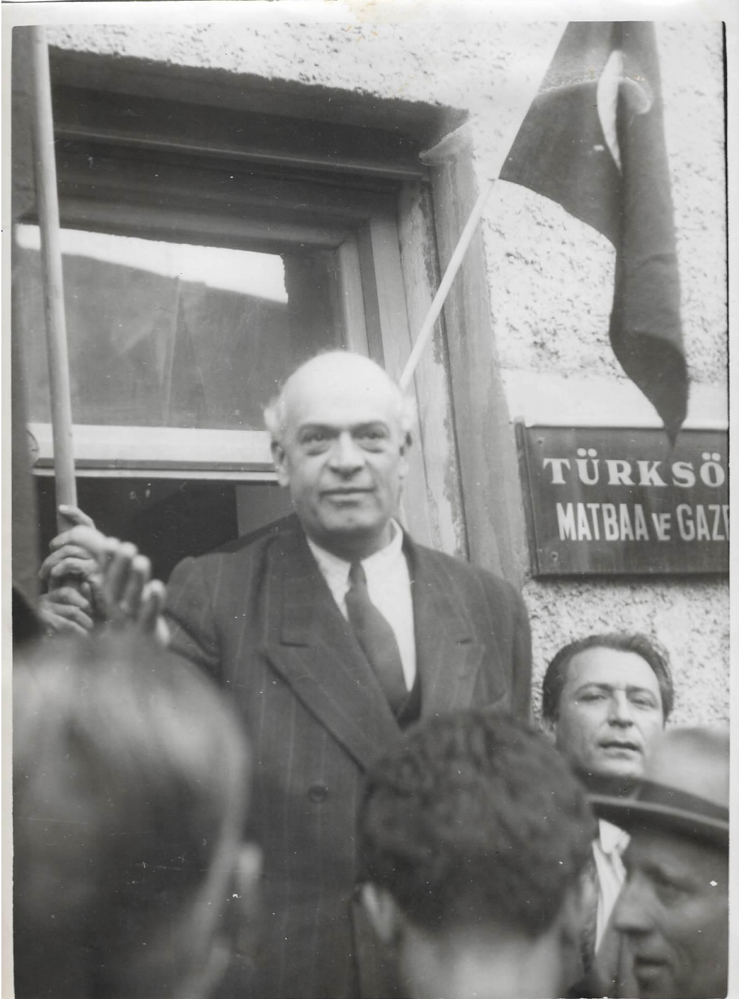
Kurucusu olduđu Türk Sözü Matbaa ve Gazetesi'nin önünde iken.