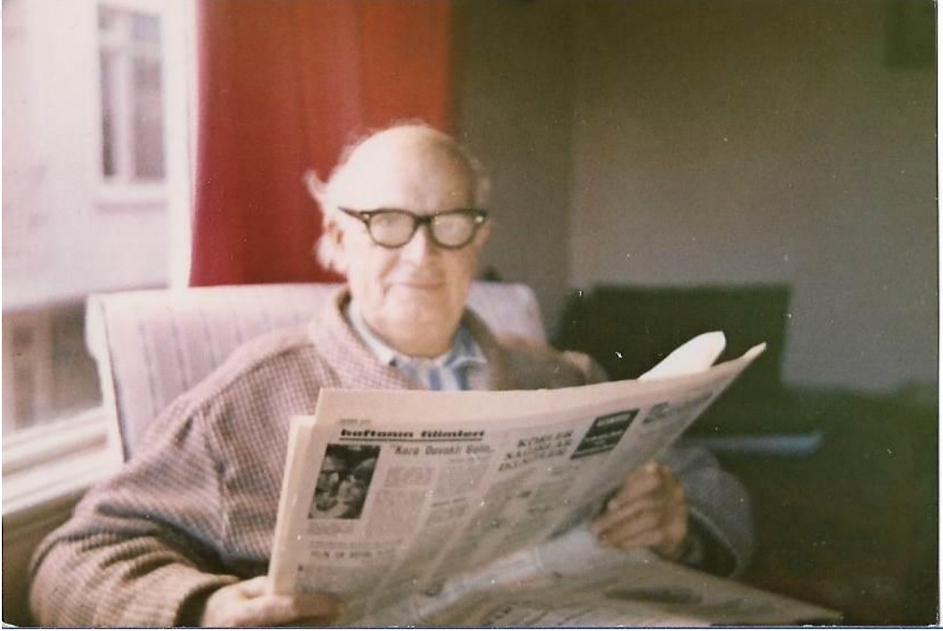
Hayatının son yıllarında ömrünü adadığı basınla iç içeyken.