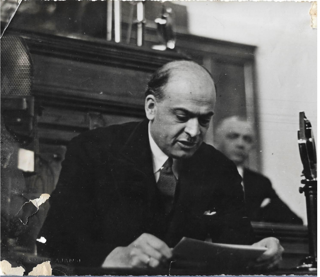
3 Nisan 1939'da TBMM'de milletvekilliği andını ederken. ( Ferit Celâl Güven Özel Arşivi )