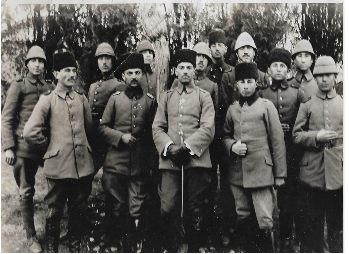
Milli Mücadele yıllarında iken, ön sırada soldan üçüncü kişi.