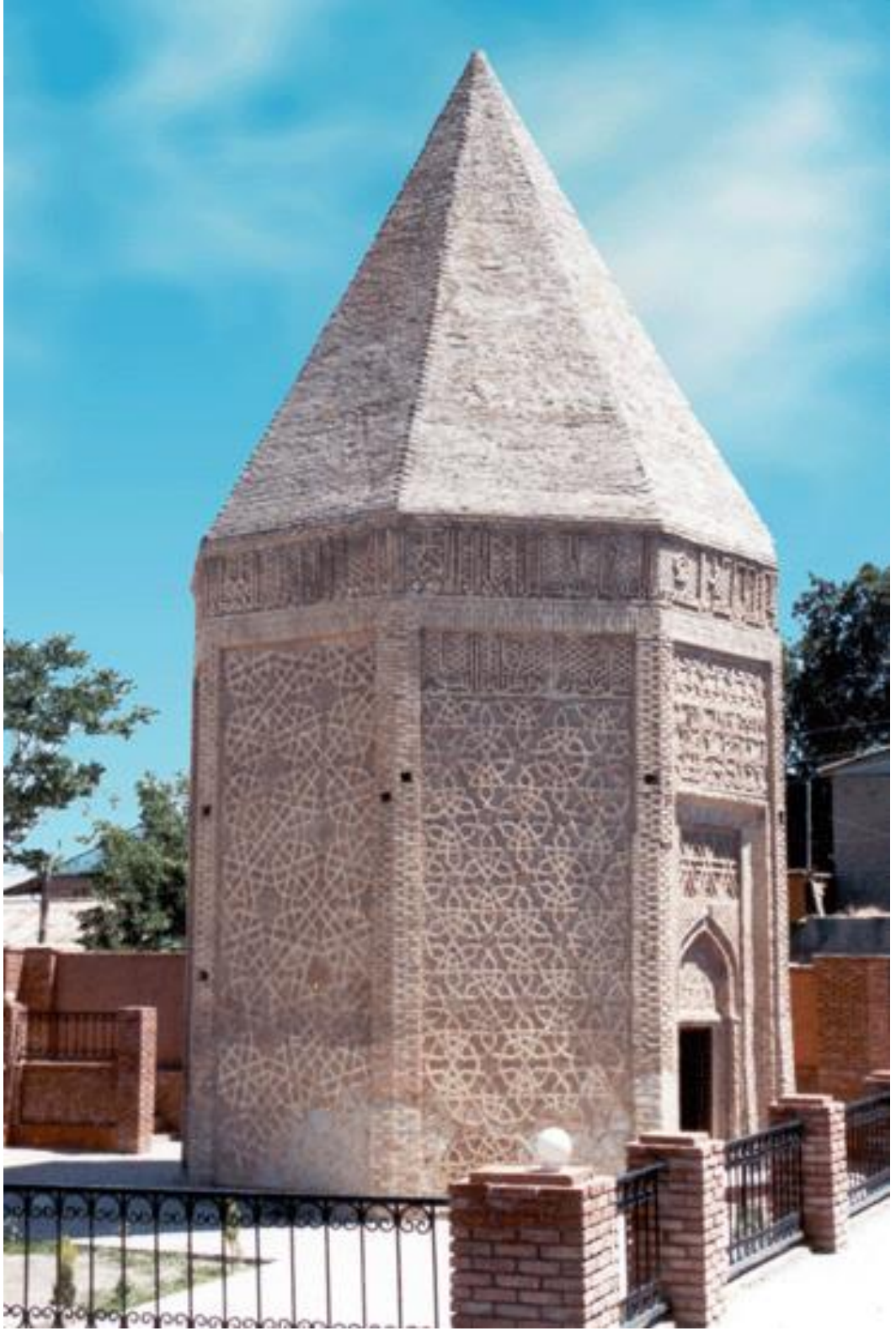
Resim 4: Yusuf bin Küseyir türbesi