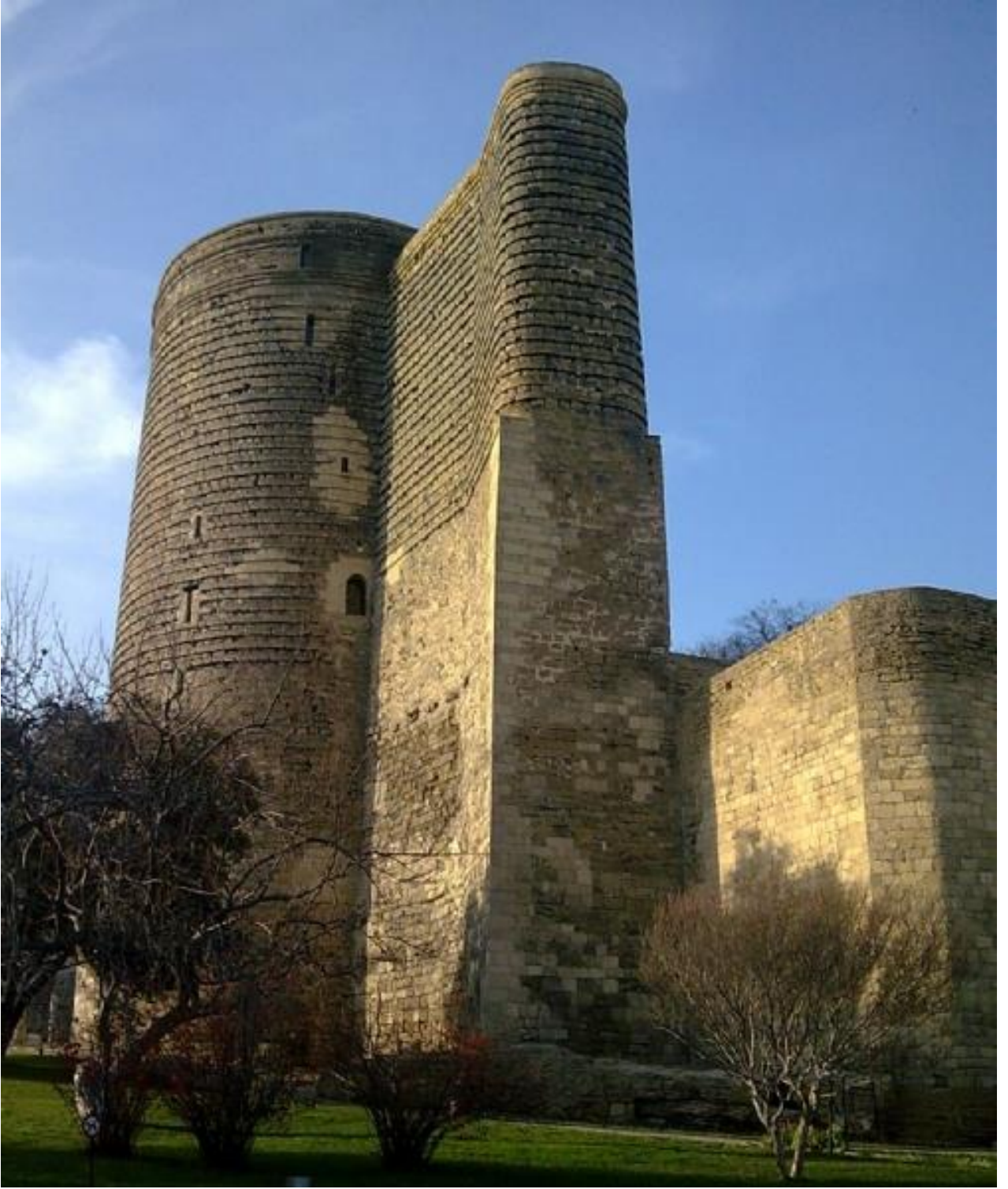
Resim 5: Kız Külesi (az.wikipedia.org, Erişim Tarihi: 08/07/ 2019)