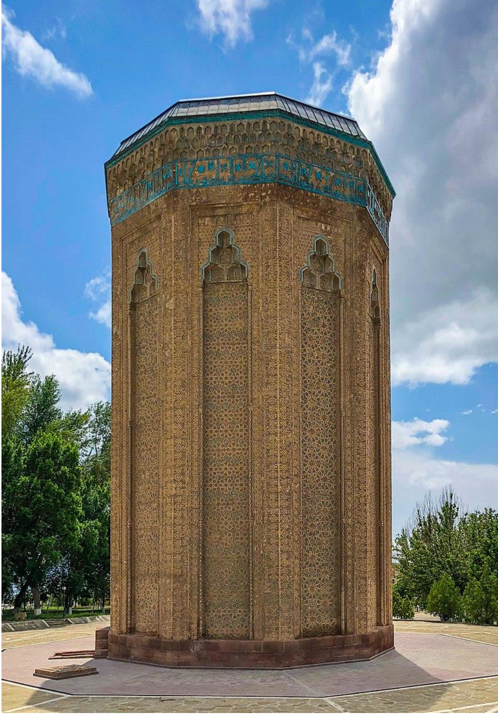
Resim 2: Mümine Hatun Türbesi ( az.wikipedia.org , Erişim Tarihi: 08/07/ 2019)