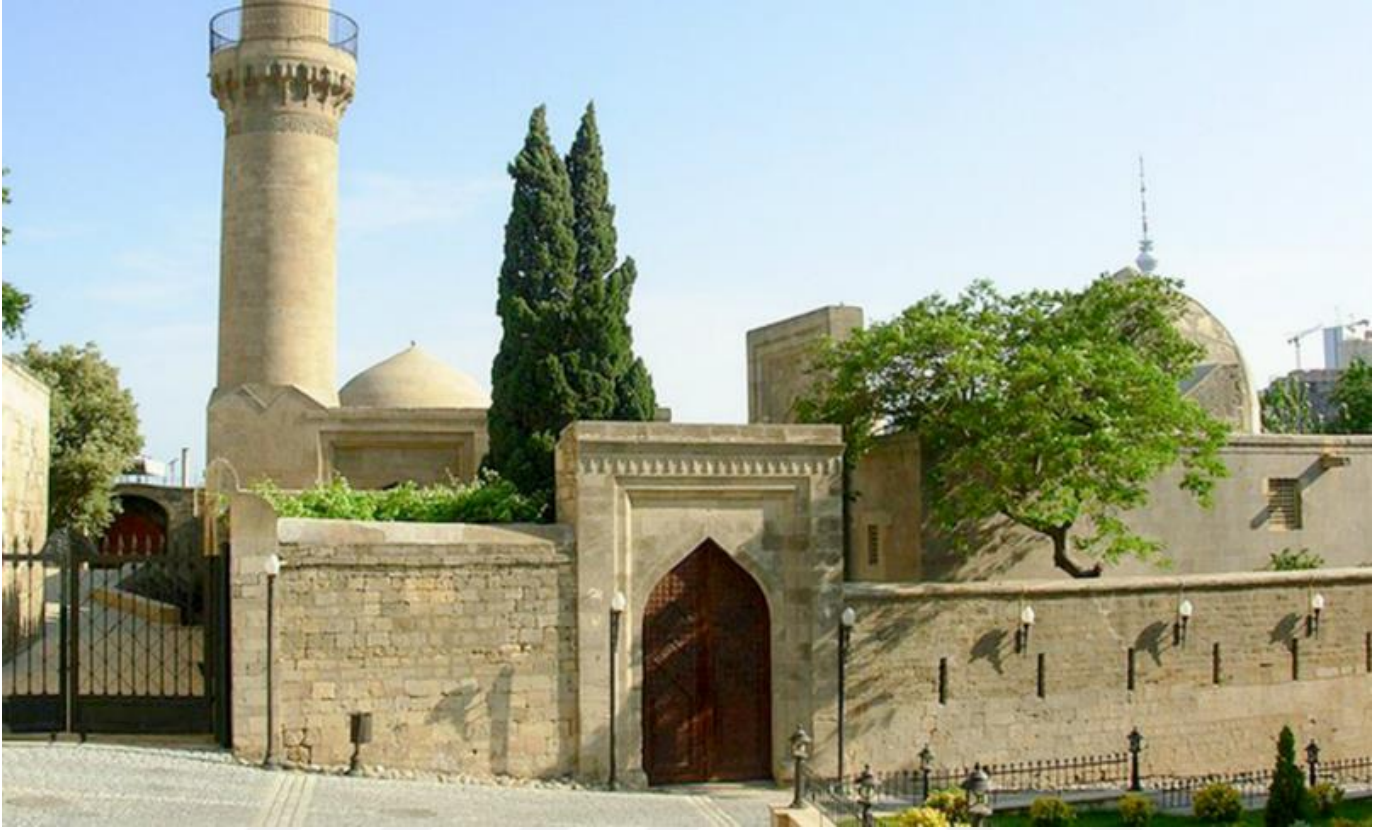
Resim 7: Şirvanşahlar Sarayı