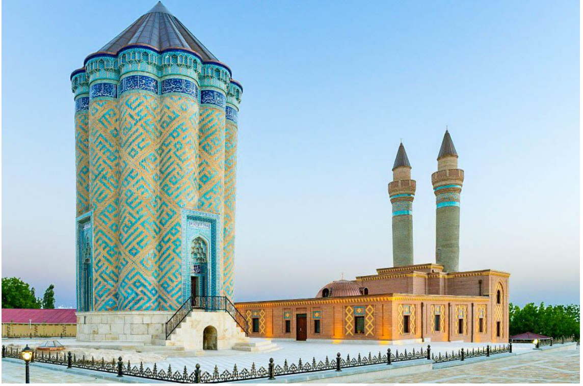
Resim 3: Goşa Minare