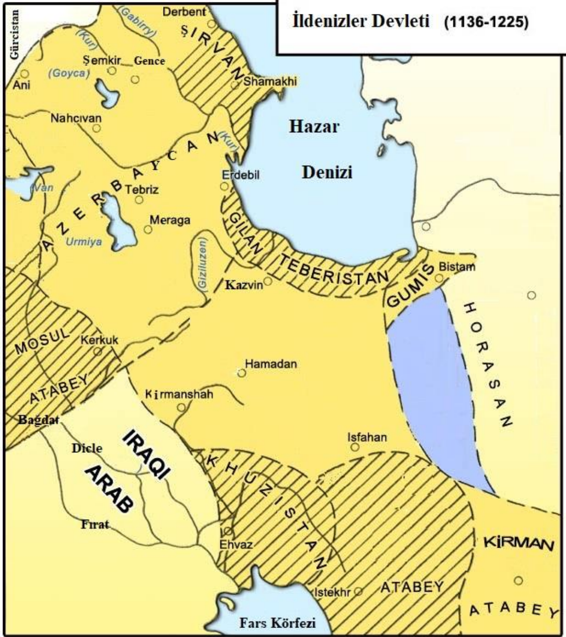
Resim 1: Atabeyler Devlet Haritası