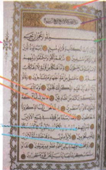
Resim 29: Bir surenin başlangıç sayfası

Ayet (Durak arasındaki cümleler birer ayettir.)