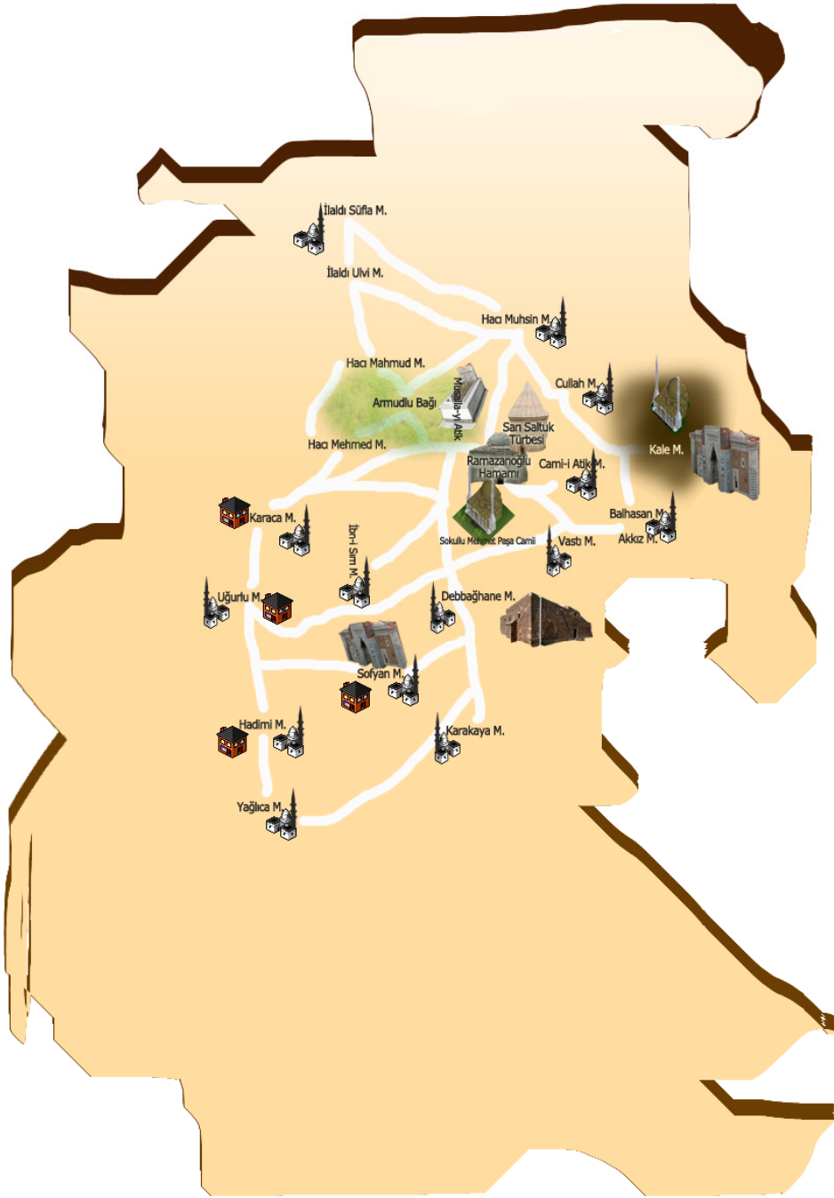
Çizim: 1 Hurufat Defterleri ışığında Bor Kazası haritası.