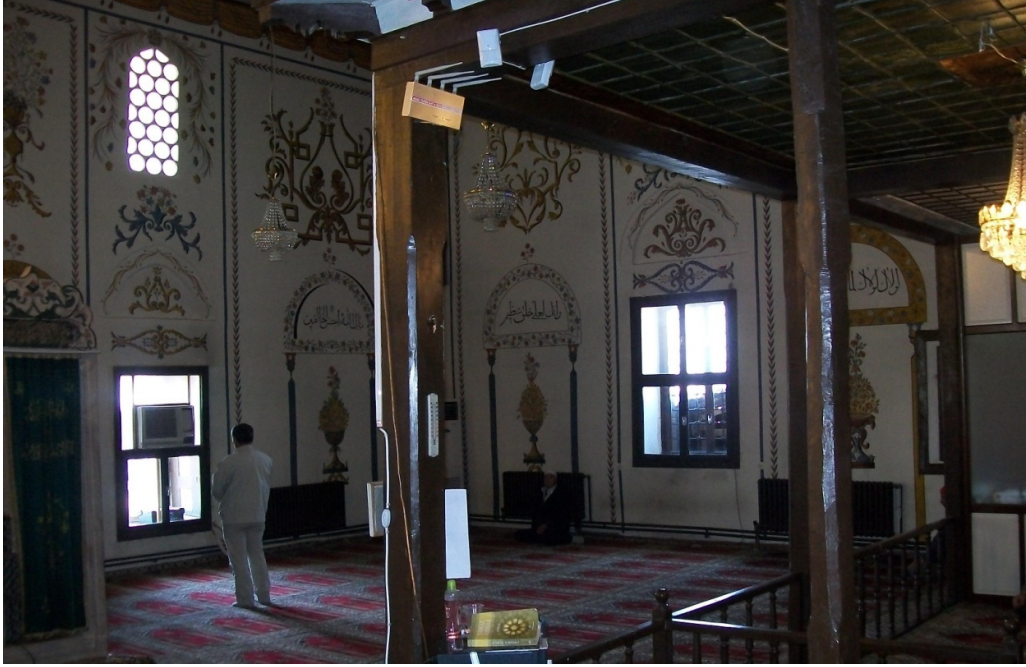
Fotoğraf: 9 Veziriazam Sokullu Mehmed Paşa Camii içinden bir görünüm.