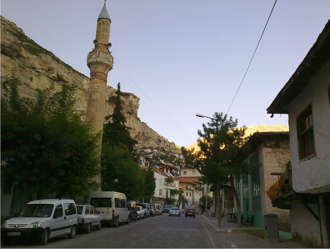
Fotoğraf: 10 Mimar Emir Rüstem Paşa Camii (sağda) ve minaresi (solda).