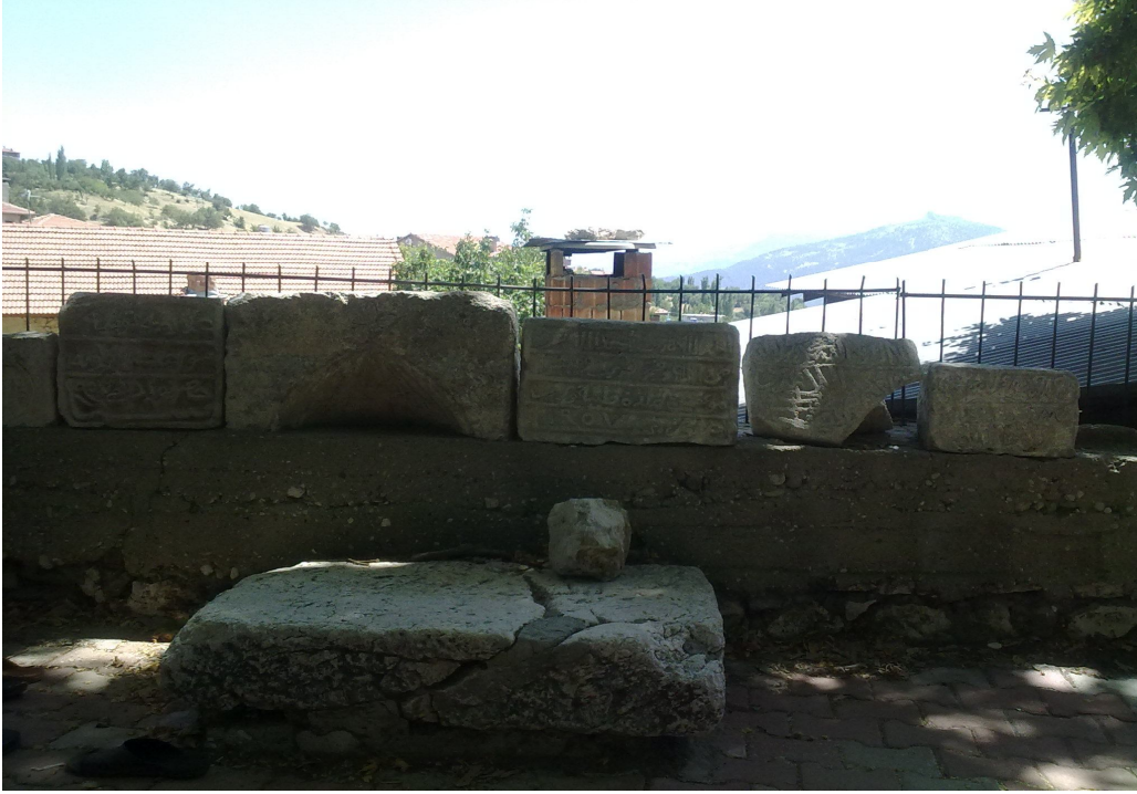
Fotoğraf: 16 Abdullatif Camii'nin yeniden yaptırılmadan öncekine ait kalıntılar.