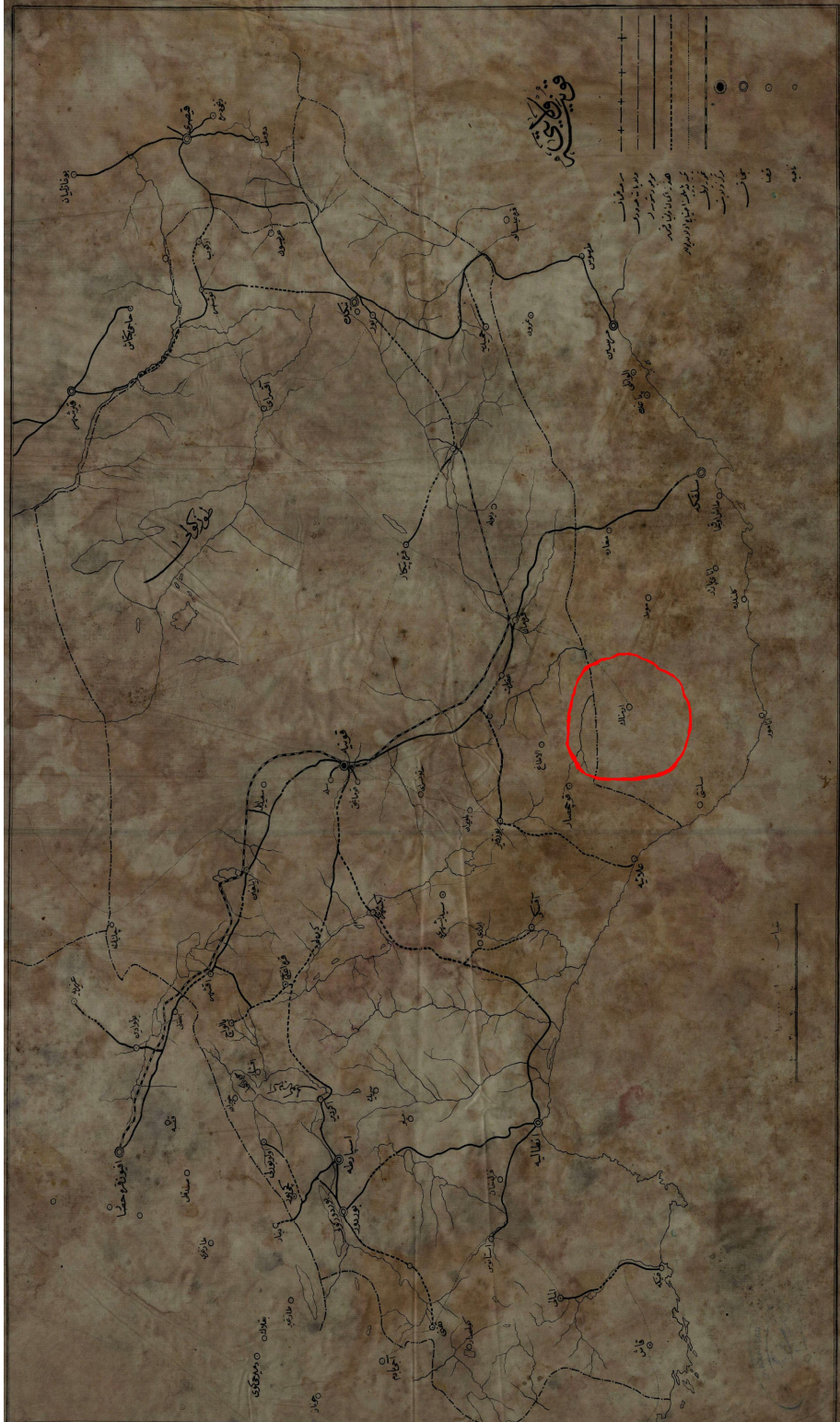
Harita: 2 1341/1922 tarihli Konya Vilayeti haritasında Ermenek (BOA, HRT.h, No: 983).