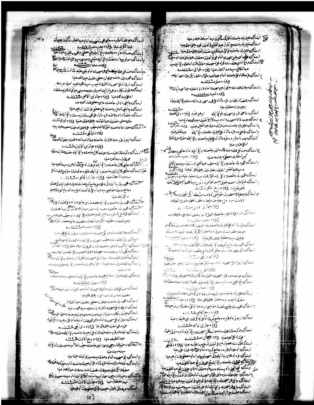
Belge: 1 Hurufat Defterleri'nden bir örnek (VAD. No: 1069, vr. 67ab).