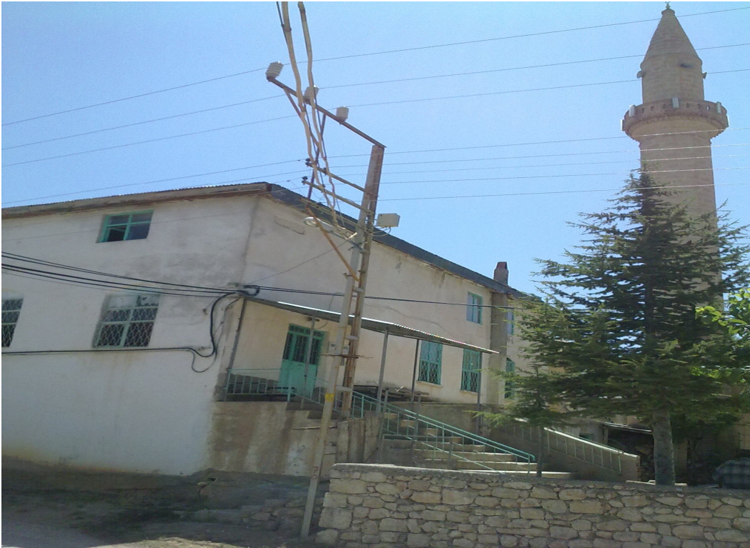
Fotoğraf: 17 Musa Bey Camii yerine yaptırılan Lâmos/Esentepe Köyü Camii.