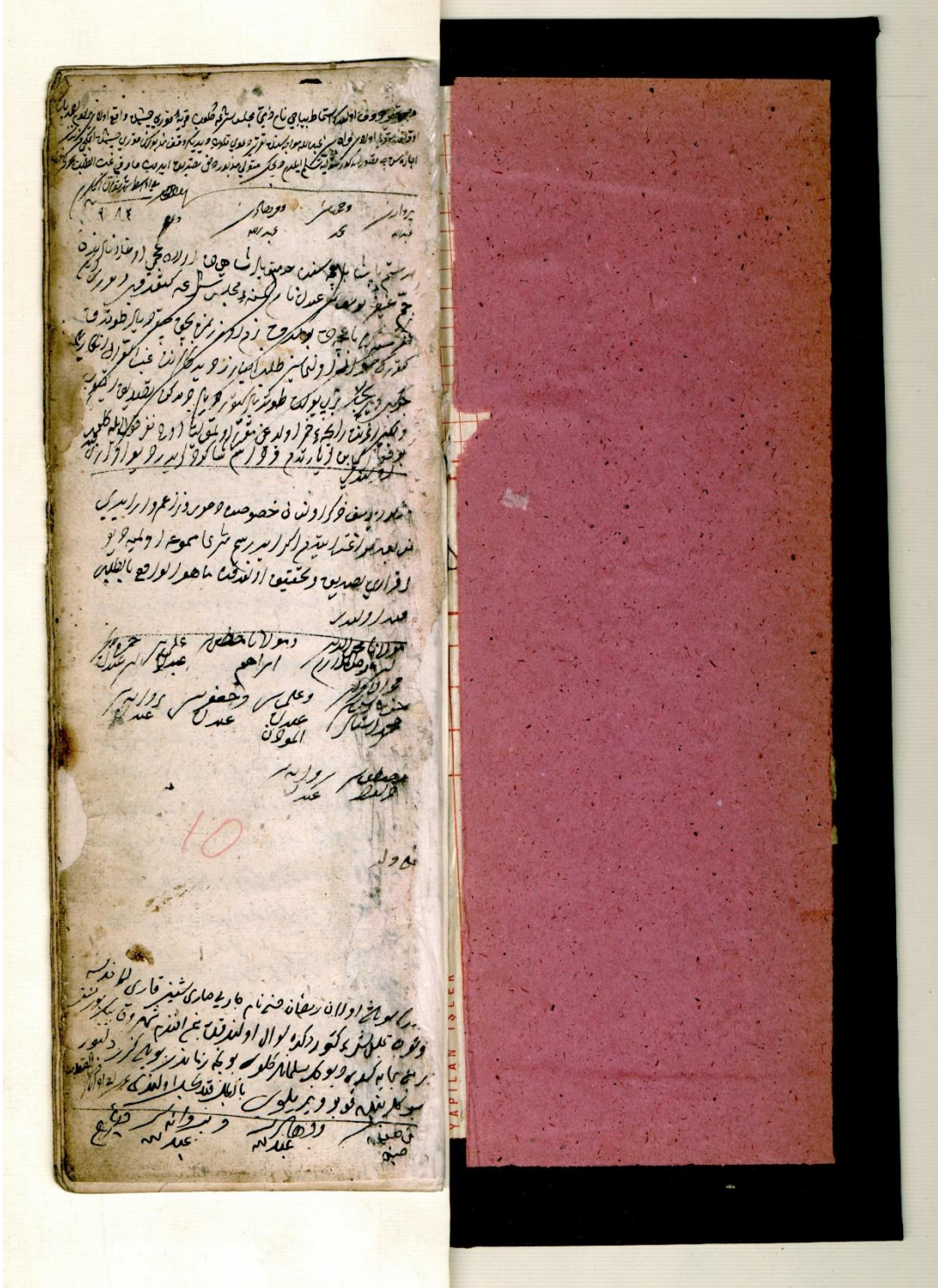
Belge 1: Beşiktaş 10 Numaralı Şer'iyeye Sicili'nin İlk Sayfası